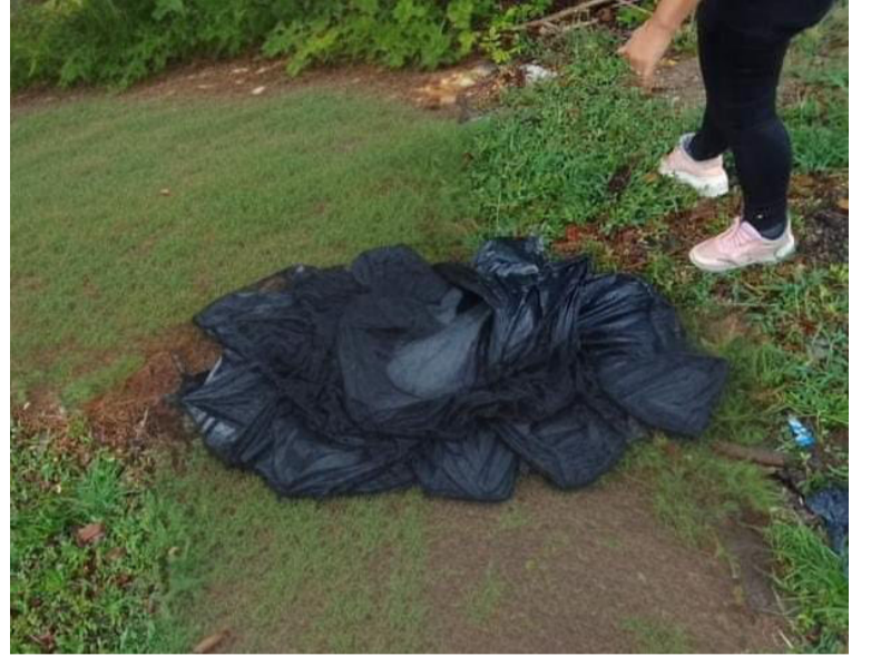
Este sería el tercer cuerpo sin vida hallado entre julio y agosto en la zona del río Jerez.

Asimismo, se pudo conocer que el joven samario prestó el servicio militar en el año 2023, vivía en la ciudad de Santa Marta,