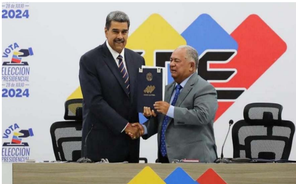
Era predecible que el régimen iba a realizar maniobras para no entregar el poder.

A pesar de que fue una campaña compleja, en la que el Gobierno de Maduro emprendió una feroz