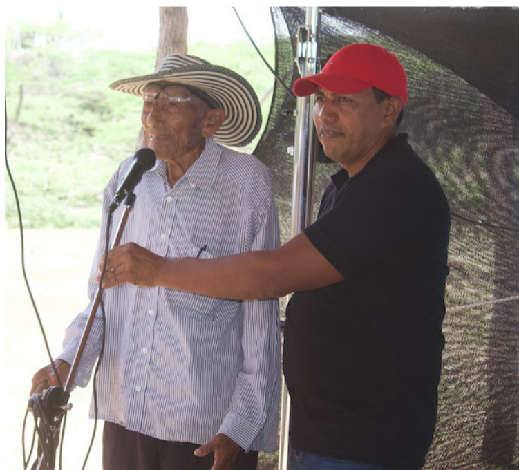
Los asistentes fueron informados de las líneas transversales que se trabajan para el cumplimiento del convenio.

Durante los días 30 y 31 de mayo del presente