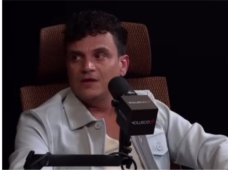
El artista en sus declaraciones dijo que se internó en un centro de rehabilitación en Uruguay y le fue de maravilla.

"Llegó un momento que entré en un conflicto interno; ahí entró a hacer lo suyo la droga, aunque yo he tenido más problema con el alcohol que con la droga, pero hubo un momento en que ya me quería hacer daño y le daba, le daba, para que me pasara algo, pero gracias a Dios no... Me des-