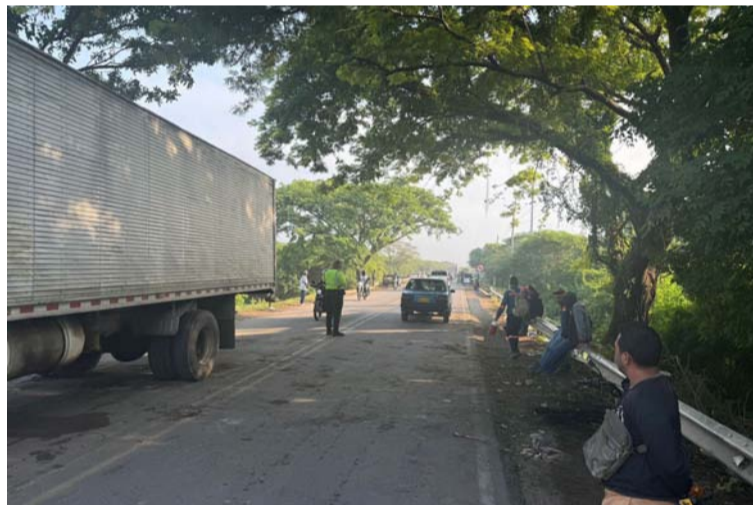
Gracias al diálogo se logró restablecer la movilidad, hecho que fue confirmado por Setra.

Los manifestantes señalaron que han pasado varios meses desde que se adelantó una mesa de