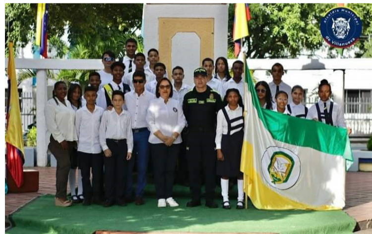
La alcaldesa dijo que la Batalla de Boyacá recuerda la valentía de los héroes que lucharon por la independencia.

cha conmemorativa, recordamos con profundo respeto y agradecimiento a todos aquellos que han contribuido y continúan contribuyendo a la gran-