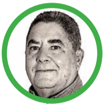
Por Álvaro López Peralta