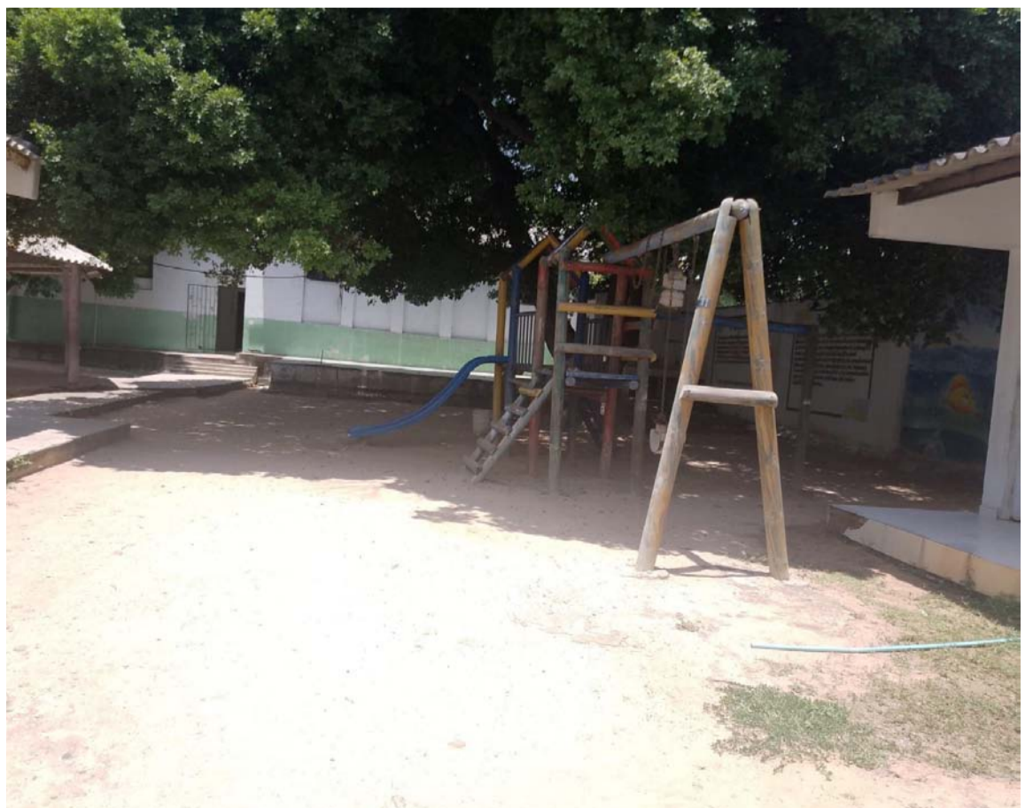
La comunidad educativa está muy preocupada; no es la primera vez que roban.

Por otro lado, la comunidad educativa está muy preocupada por la situación ya que no es la primera vez que roban. "Solicitamos a las autoridades que tienen el control de seguridad en nuestro municipio que hagan patrullajes constante para no seguir siendo víctimas de la delincuencia".