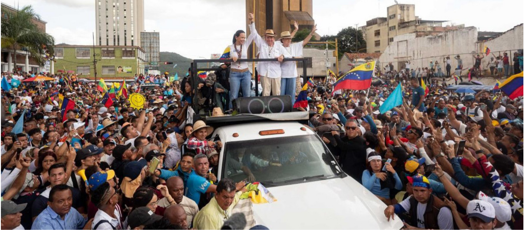
El Centro Carter, la MOE y observadores independientes, confirman el triunfo claro de Edmundo González y María Corina.