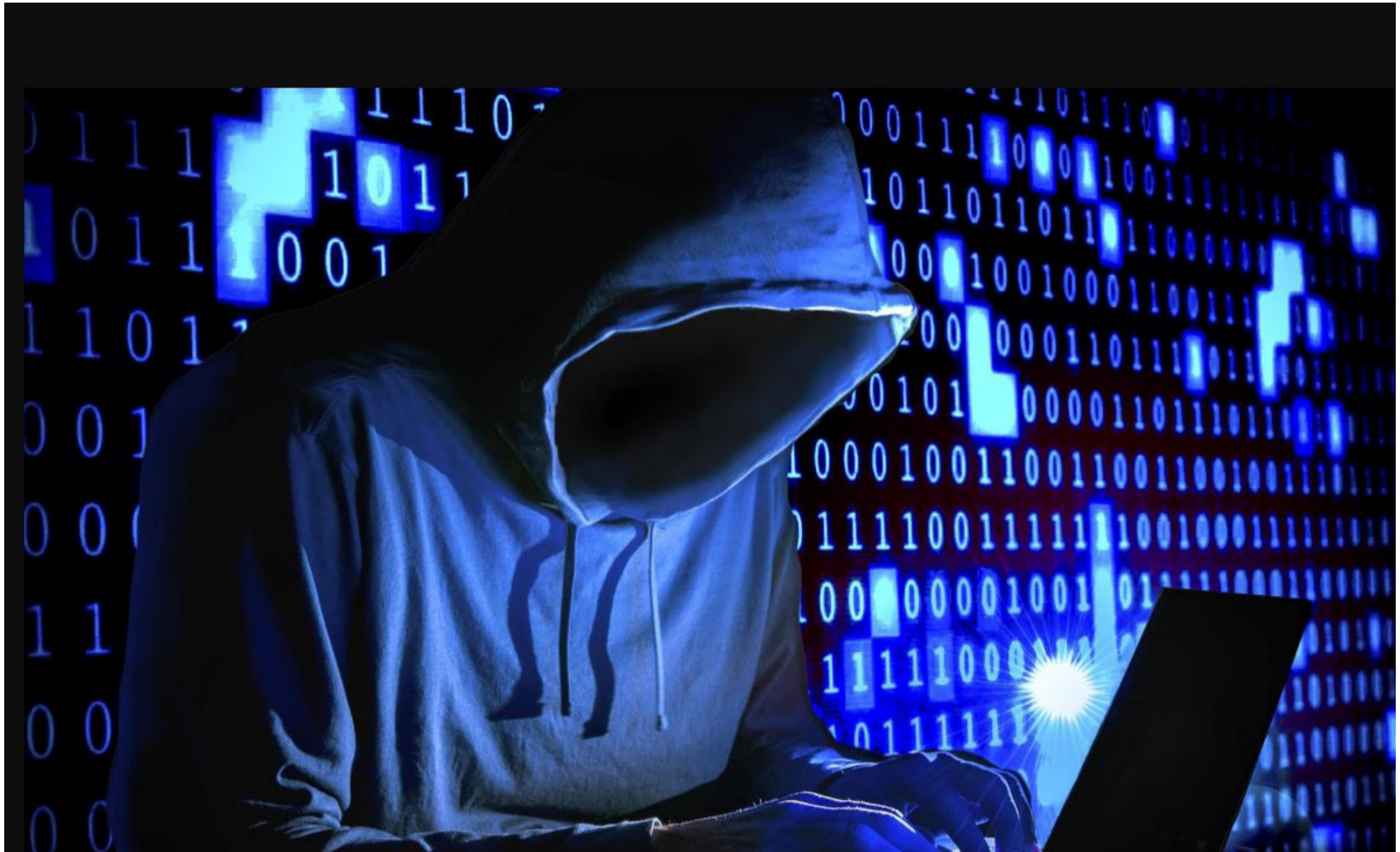
El operador celular desconoce lo que sucede y específicamente deja claro que WhatsApp no tiene nada que ver con ellos.

Es una realidad que nos está tocando a todos