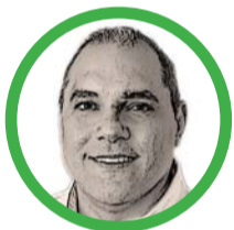
Por José David Name Cardozo