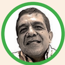
Por Hernán Baquero Bracho