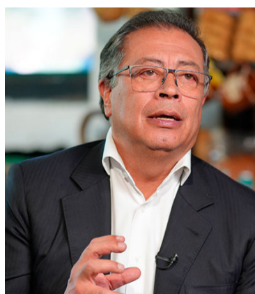
Gustavo Petro, presidente de la República.

“Soy el primero en reconocer que es mucho el ca-