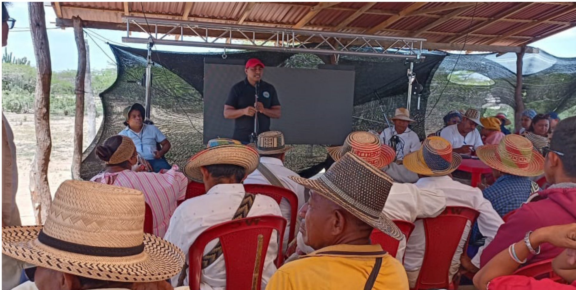
Se vienen cumpliendo los espacios de asambleas de las autoridades tradicionales y pueblo wayuú para avanzar en los ejes establecidos en la Sentencia T 302 de 2017.

E n desarrollo del convenio de asociación No. Msps-974-2024 suscrito entre el Ministerio de Salud y Protección Social y la Asociación de Autoridades Tradicionales Wayuú de La Guajira Akalinjirawa, que tiene por objeto desarrollar de manera exclusiva las acciones tendientes a cumplir la Sentencia T-302 de 2017 y sus autos de trámite, en el marco del Plan provisional de acción concertado con las autoridades indígenas del pueblo wayuú filiales de la organización Gobierno Propio, el cual tiene como ejes centrales los siguientes alcances: