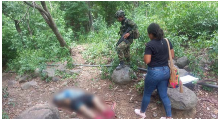
El cadáver presentaba varios impactos de bala y evidentes signos de violencia.

Este hallazgo se registró la tarde del martes 6 de agosto en el sector de Pénjamo en la zona alta de la Sierra Nevada, en donde el cuerpo se encontraba tendido en el suelo boca arriba, descamisado, con una pantaloneta azul y envuelto en una hamaca en medio de una trilla de este sector enmontado.