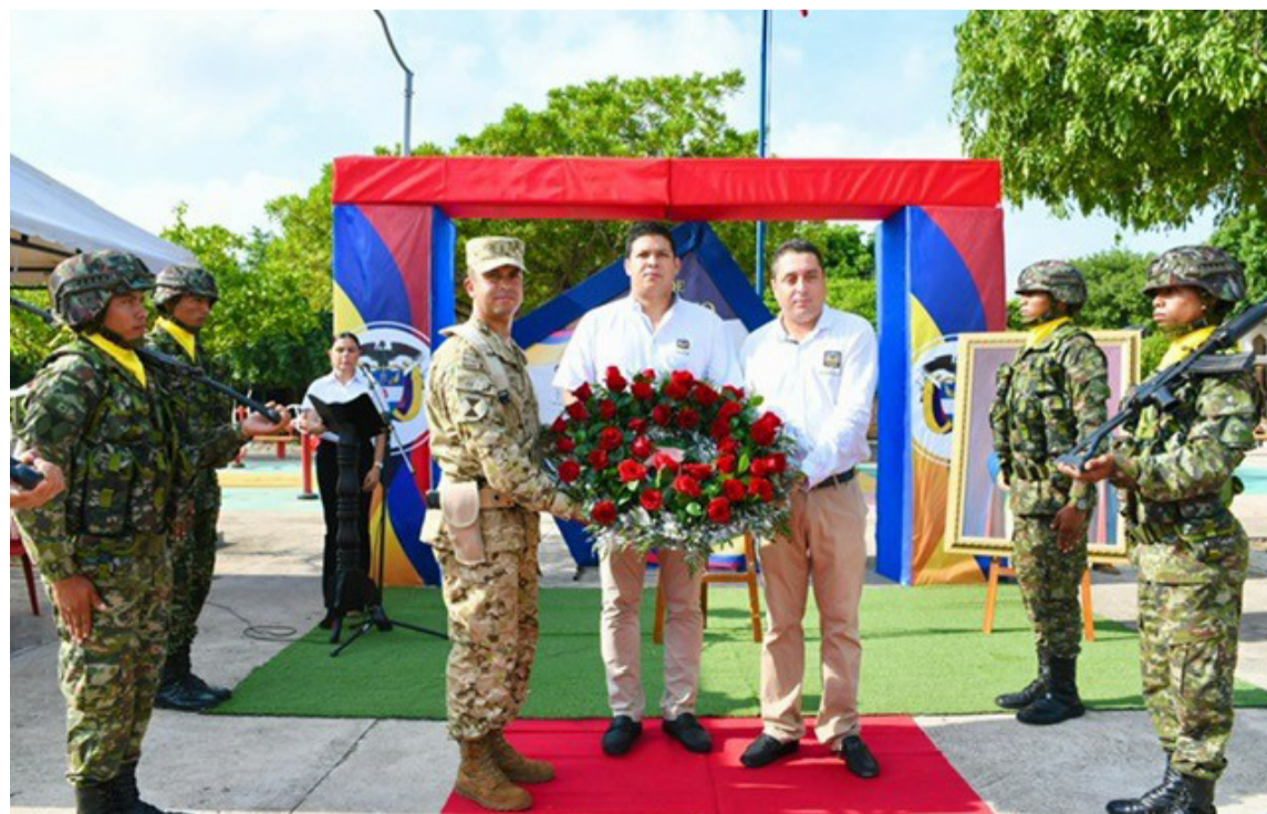
Alcalde Berardinelli conmemoró los 205 años de la Batalla de Boyacá y el Día del Ejército.

El evento contó con la asistencia de secretarios de Despacho, oficina de Gestión Social, directivos, cuerpo de profesores, estudiantes, brigadistas forestales y demás funcionarios de la Administración municipal.