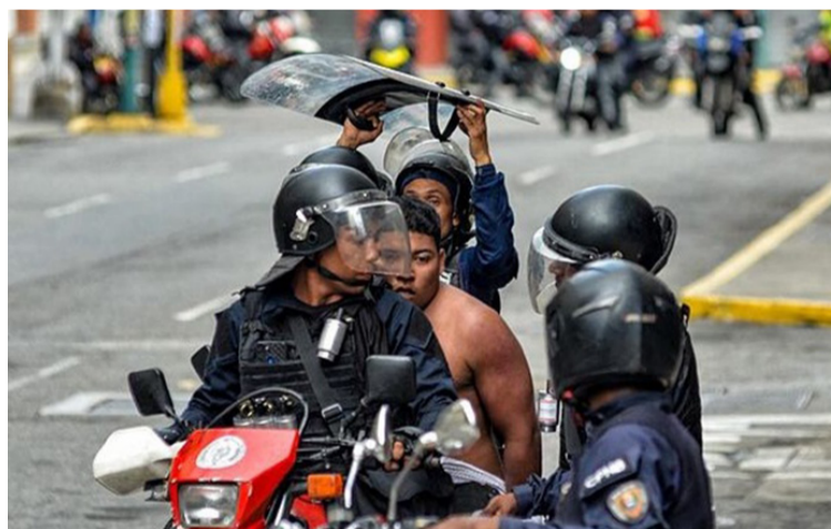
El Gobierno ahora persigue al pueblo con amenazas, atropellos, encarcelamientos y acciones violentas.

Todas las evidencias dadas a conocer por organismos serios, entre otros el Centro Carter, el MOE y observadores independientes, confirman el triunfo claro de la oposición, con aproximadamente las 2/3 partes de la