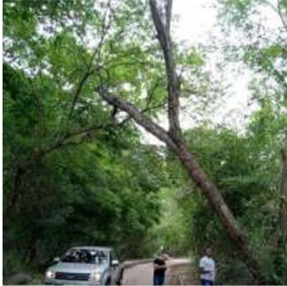
El alcalde Rafael Manjarrez, solicitó la tala de árboles para aprovechamiento forestal.

Corpoguajira, procedió a enviar un funcionario idóneo, para realizar una visita técnica de inspección ocular y verificación de lo solicitado por el municipio, con el objetivo de verificar y evaluar los árboles localizados en las