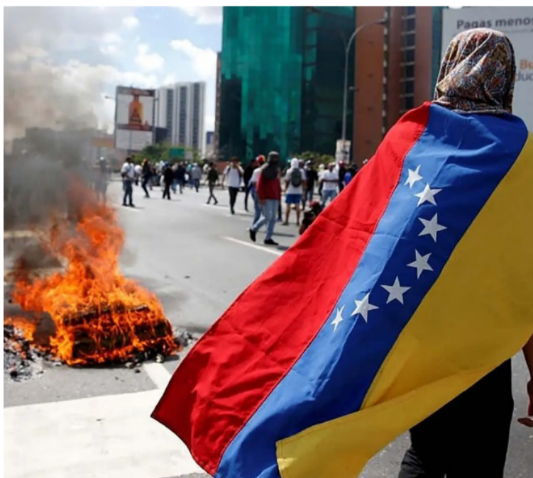
Agotados los recursos democráticos y diplomáticos, es evidente que se debe sacar a Maduro del poder.

Nicolás Maduro en diferentes ocasiones ha manifestado: "Candelita que se prende, candelita que se apaga", haciendo referencia a que responderá ante todas las protestas y manifestaciones opositoras, por esto, hoy es necesario que la voluntad popular no sea una candelita, sino un incendio que deje en cenizas al Gobierno y ponga fin a la era de opresión y corrupción.