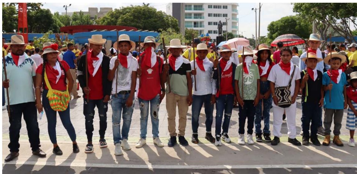
Movimientos sindicales y líderes analizaron acciones ejecutadas por el Gobierno Petro.

Diferentes movimientos políticos y sindicales de La Guajira, realizaron un conversatorio donde analizaron las acciones ejecutadas por el presidente Gustavo Petro en sus dos años de Gobierno.