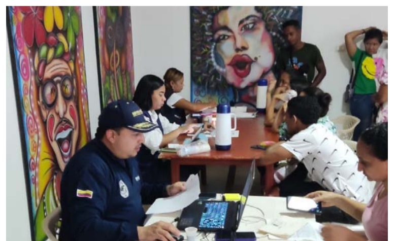
La actividad contó con una amplia participación de la comunidad migrante.

"Seguimos comprometidos con brindar apoyo y facilitar el acceso a servicios esenciales para nuestra comunidad migrante. ¡Gracias a todos por su participación y colaboración!", expresaron los organizadores del evento.