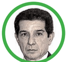
José Félix Lafaurie Rivera @jflafaurie

El 20 de julio, en Remedios, Antioquia, el ELN devolvió a dos líderes sociales secuestrados un mes antes, lo que no fue precisamente un gesto de paz, pues nunca debieron haber sido ‘retenidos’.