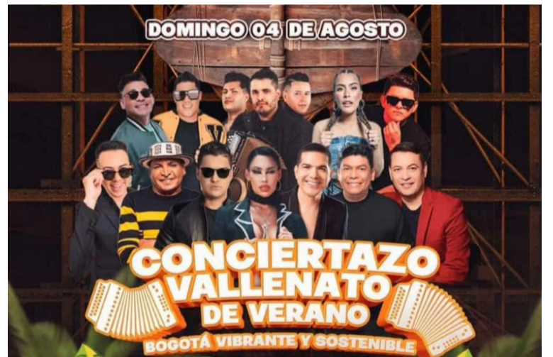
El espectáculo catalogado como inolvidable es para recordar ese legado de Omar Geles.

Serán 13 cantantes del género vallenato que estarán con sus grandes éxitos en el parque Simón Bolívar, a partir de las 9 de la mañana, y la entrada es totalmente gratis.