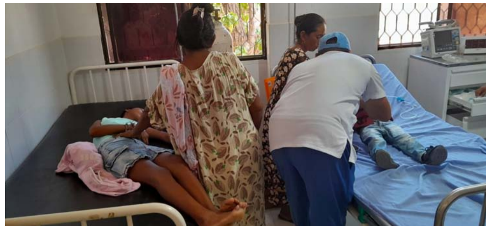
Los padres de familia han exigido a la institución verificar el alimento que le están dando a los estudiantes ya que pueden estar vencidos.