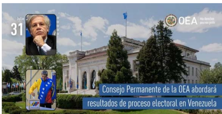
El organismo internacional abordará este miércoles los resultados del proceso electoral en Venezuela.

En un comunicado del secretario general de la Organización de Estados Americanos (OEA) Luis Almagro, denunció ayer