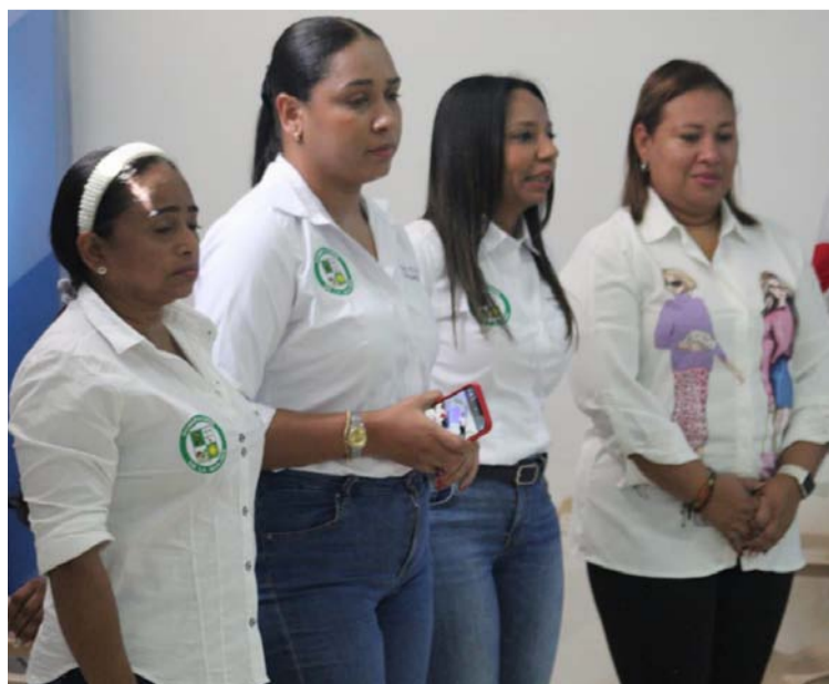
Se están implementando campañas de fumigación y educación para reducir el riesgo de nuevos contagios.

tos. Aunque no contamos al 100% con el servicio de agua, es vital que recolectemos y almacenemos agua de manera adecuada para prevenir la reproducción del mosquito”.