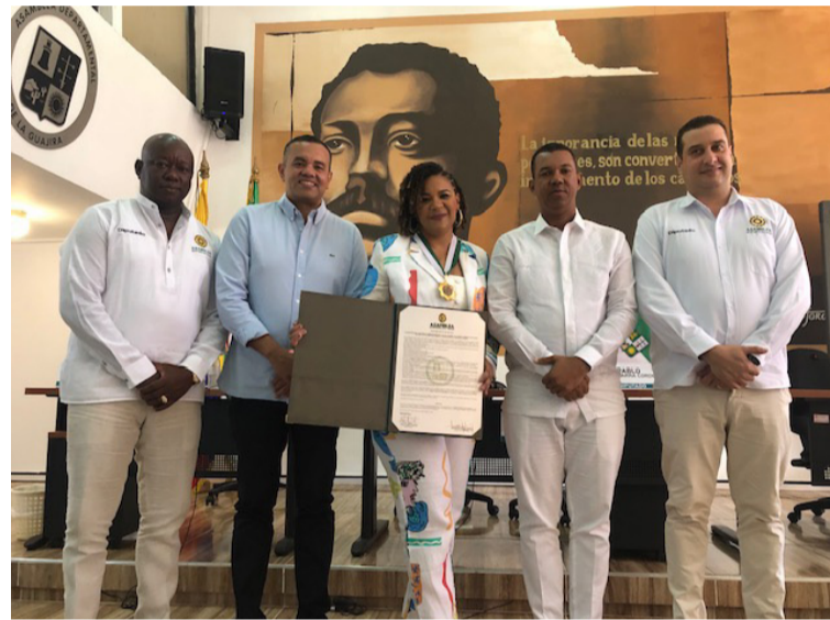
Los exaltados agradecieron a esa corporación las medallas y se comprometieron a seguir trabajando por La Guajira.