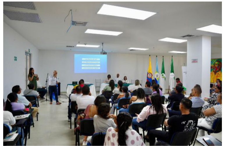
Los beneficiarios del programa serán todos los docentes de instituciones educativas oficiales.

Con el respaldo de la Gobernación de La Guajira y la colaboración de