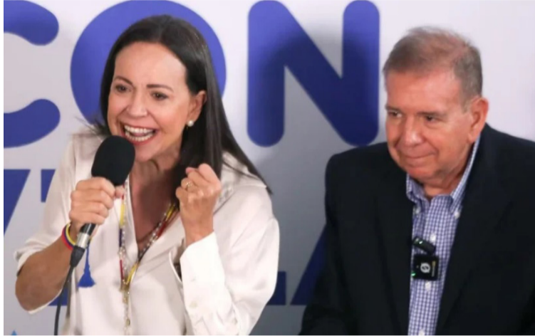
María Corina dijo que se trata de una victoria, "inequívoca, fehaciente, irreversible matemáticamente".

Confirmó la exdiputada, que los líderes mundiales