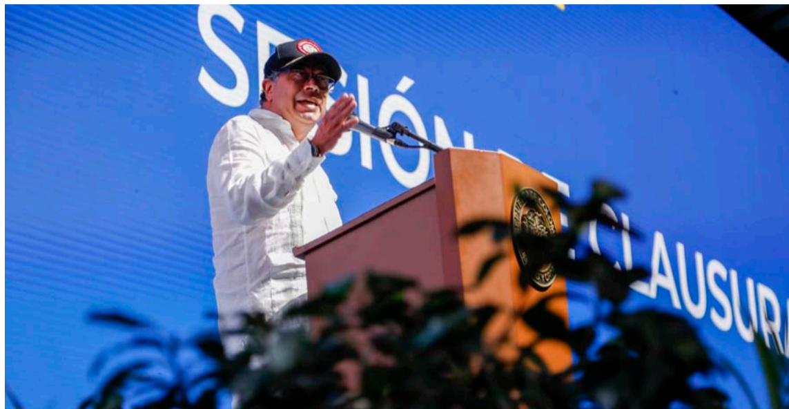
El cambio esperado del Gobierno Petro, se ha opacado por los escándalos.

El Congreso y el presidente de la República, Gustavo Petro, cumplen dos años, del periodo constitucional de cuatro años, 1461 días, cuyo término es factible, para valorar y calificar: gestiones, acciones, operaciones y resultados parciales; Legislativo y Ejecutivo, en cabeza del presidente.