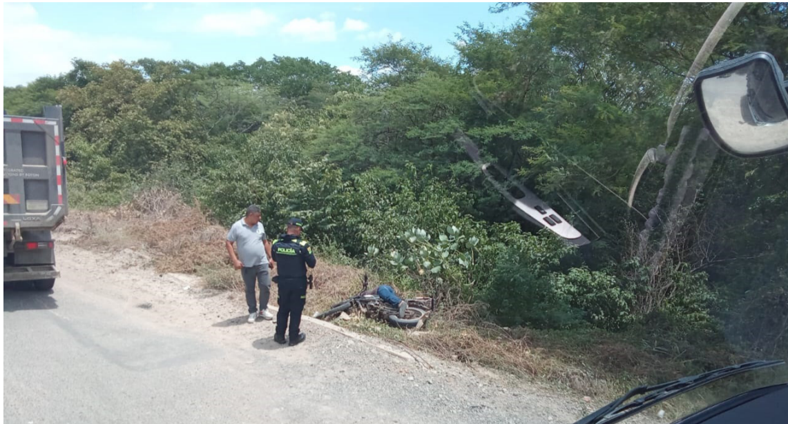
Se busca determinar si esta persona contaba con algunos antecedentes judiciales,

El crimen se presentó la mañana del martes 30 de julio entre los sectores de Arena y La Isla del corregimiento de Villa Martín (Machobayo), zona rural del Distrito de Riohacha, en donde los que transitaban por la zona observaron el cuerpo tendido a un costado de la vía imaginando que se había tratado de un accidente de tránsito, pero al verificar notaron que presentaba heridas de bala.