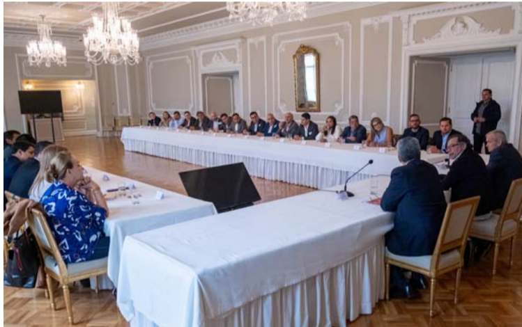
Se observan confrontaciones del Gobierno con la oposición y negativas en el Congreso de algunos proyectos.

La corrupción es una cultura enquistada en el sistema politiquero y de administraciones publicas que operan con partidos de papel, cuestionado por inservibles y perversos