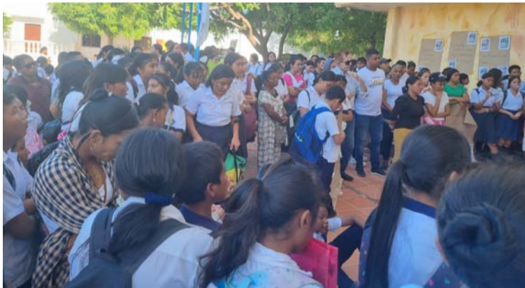
Este viernes 2 de agosto se realizará una nueva reunión de seguimiento a compromisos.

Los acuerdos pactados entre la comunidad edu-