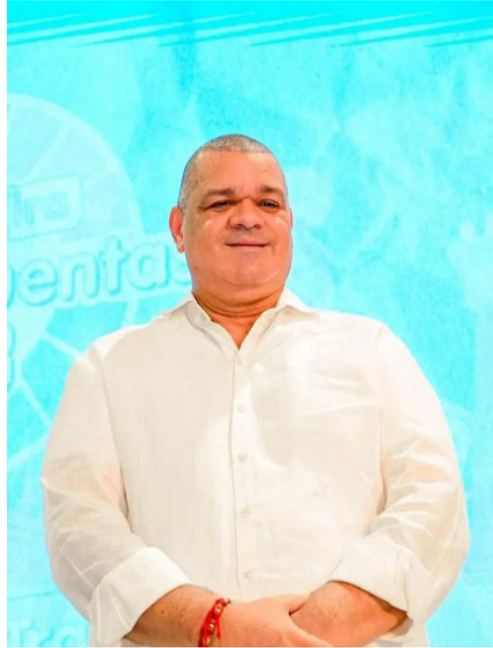
Uniguajira sigue dejando claro su trabajo responsable hacia la calidad institucional.

Por tal razón, esta posición resalta la importancia de Uniguajira tanto a nivel regional como nacional, por su esfuerzo y compromiso para la implementación de estrategias innovadoras, mejora continua de procesos y la