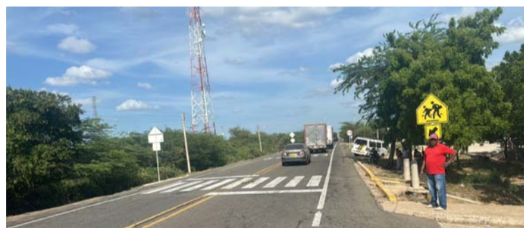
La protesta se da por incumplimientos en la indemnización de una empresa de transporte urbano.