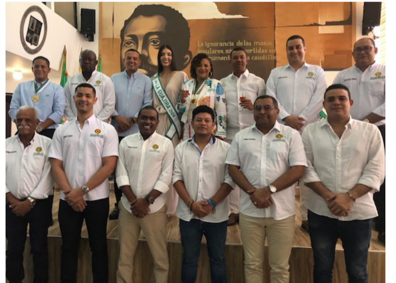
Velásquez hizo el pronunciamiento durante el desarrollo de la clausura de las sesiones ordinarias.