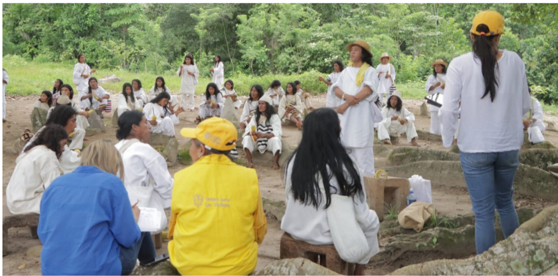
El Plan con el pueblo kogui beneficiará a 26.210 personas pertenecientes a esta etnia.

En la Unidad para las Víctimas 'Cambiamos para servir' con el objetivo de seguir trabajando en acciones de cara a la implementación de una política que contribuya a la superación de los rezagos, brinde una reparación transformadora y le permita a quienes han padecido el conflicto armado acceder efectivamente a sus derechos.