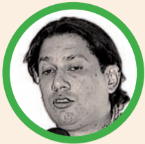
Por Jacobo Solano