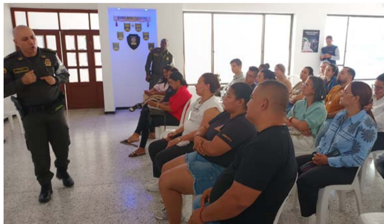
La actividad contó con la participación activa de comerciantes locales.

Difusión de Línea Anti-contrabando #159: Se resaltó la importancia de esta