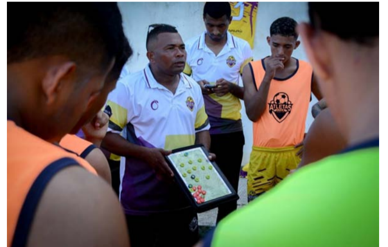
El partido promete ser un emocionante duelo entre dos equipos que buscan afianzar sus posiciones.

El partido promete ser un emocionante duelo entre dos equipos que buscan afianzar sus posiciones en el torneo. Con este enfrentamiento, Atletas del Mañana busca continuar su racha ganadora y mantener el liderazgo en el campeonato.