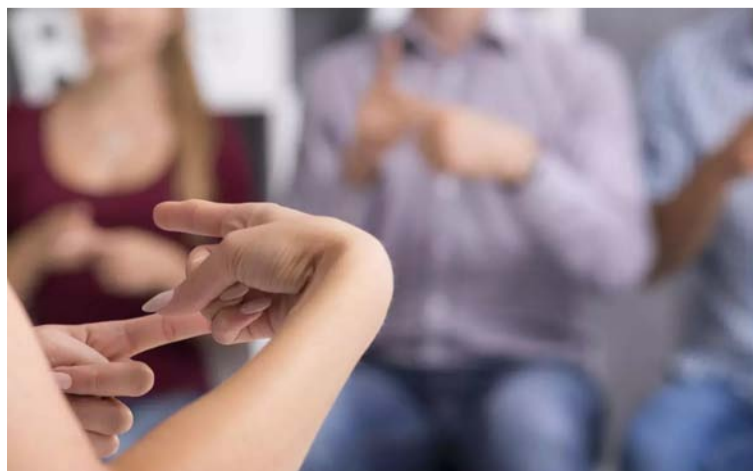
Se busca que el equipo conozca las características y propiedades de este lenguaje incluyente.

La administración, con el apoyo de Fungajes y el programa de Comunidades Saludables de Usaid, seguirán brindando este tipo de capacitaciones, que son herramientas pertinentes para la inclusión y la igualdad de oportunidades en el distrito.