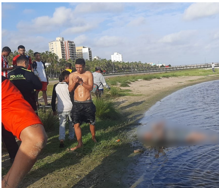
El cadáver del menor de edad fue sacado hasta la orilla por algunas personas.

La ciudadanía y los miembros de la Fundación Guajira Aventura, desde el año pasado han venido haciendo el llamado a las autoridades competentes por la presencia de varios menores de edad en condición de calle y que consumen bóxer a la orilla del río en el sector de El Riíto, pero no han atendido al llamado de esta problemática social que se presenta debido al aumento de niños y adolescentes que llegan a inhalar esta sustancia en esta zona de las playas de Riohacha.