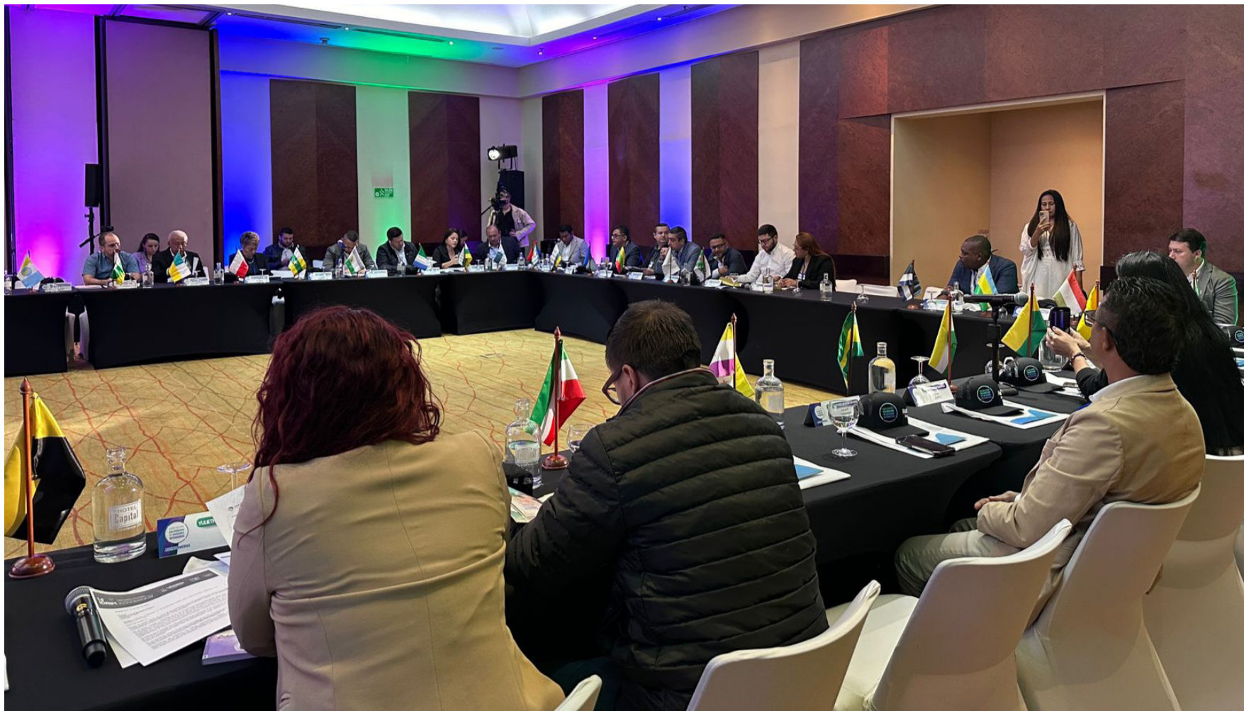
El alcalde reiteró que pensar en una nueva migración constituye una grave preocupación por las consecuencias para el municipio.