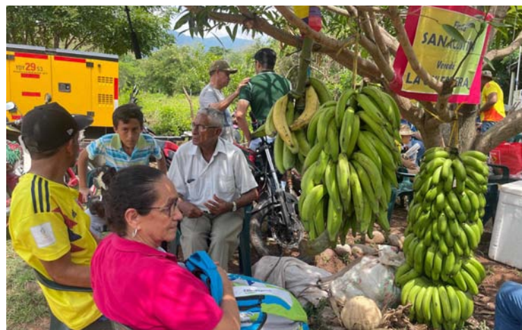
El evento superó las expectativas, convocando a más de 400 personas, cuando se esperaban cerca de 300.