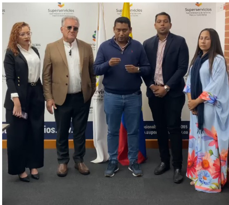
El alcalde dijo que el interés básicamente es dialogar sobre la afectación a la población vulnerable.

En ese sentido, el Superintendente de Servicios Públicos, expresó que en el ejercicio de vigilancia de la institución se definió con el Ministro de Minas celebrar la reunión planteada por el alcalde de Maicao, para encontrar alguna salida al tema planteado.