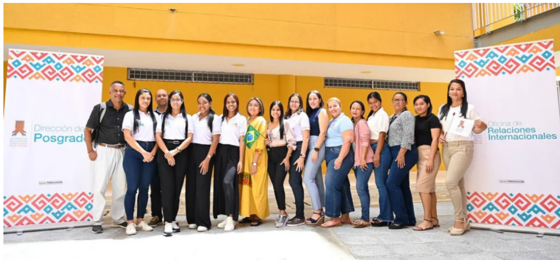
La convocatoria hace parte del proceso de internacionalización de Uniguajira.

En ese sentido, mediante la Convocatoria de Subvención del Programa de Expertos Internacionales del Instituto Colombiano de Crédito Educativo y Estudios Técnicos en el Exterior (Icetex), cuatro estudiantes y dos docentes de la Universidad de La Guajira sede Riohacha resultaron seleccionados para participar en una misión académica en el Brasil.