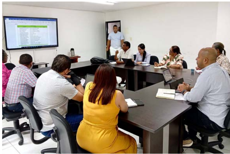
Se hizo una revisión de cómo se viene desarrollando la implementación de la Jornada Única en La Guajira.

En el espacio también fue analizada la proyección para el 2025 y la oportunidad con la que cuentan algunas sedes educativas rurales para implementar en el segundo semestre de 2024 este programa. Enfatizando que deben contar con las condiciones para su implementación, como lo