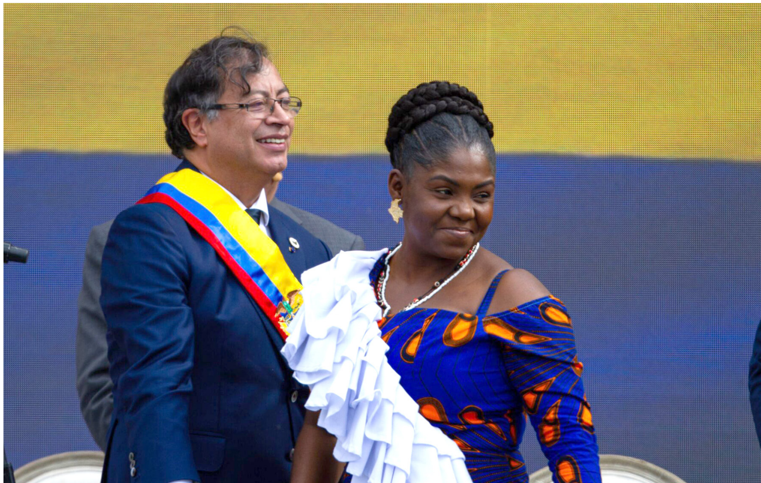
Se puede observar una constante en Petro: cada etapa de su carrera ha estado marcada por desafíos y controversias.

Su dirección ha sido marcada por un descontento creciente entre la población