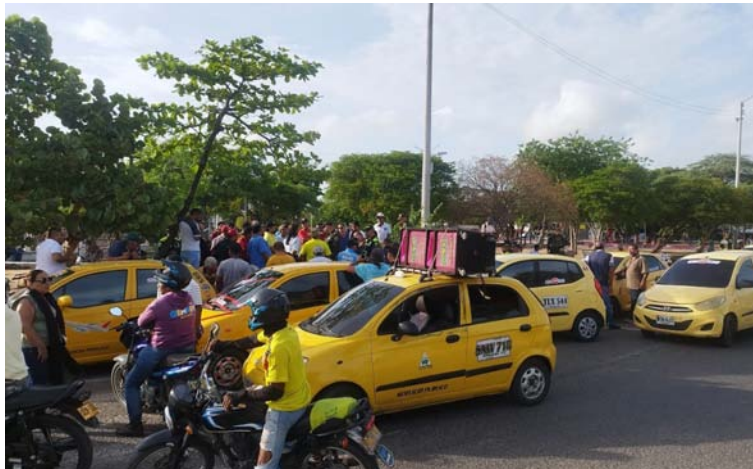
El gremio de taxistas del Distrito de Riohacha determinó no bloquear en su totalidad la ciudad.

Sin embargo, algunos conductores de taxis se encuentran en plantón a la entrada del Aeropuerto Internacional Almirante Padilla, lo que ha generado malestar entre las personas que necesitan ingresar y tienen que caminar con sus equipajes. De igual forma, se mantiene un grupo en la salie-