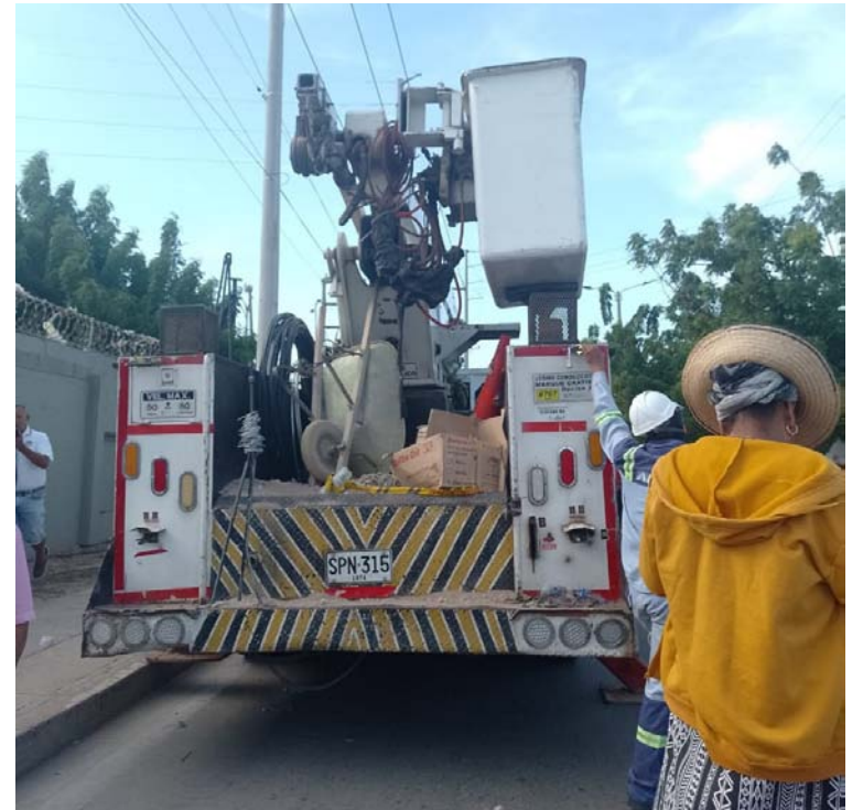
El vehículo de la contratista de Air-e fue detenido en el barrio Villa Inés y lo llevaron hasta la sede de la subestación.

Asimismo, se conoció que el vehículo de la contratista de Air-e fue detenido por las personas en el barrio Villa Inés y lo llevaron hasta la sede de la subestación en donde la comunidad manifestó que no pretendía hacerle nada al automotor ni al conductor, sólo retenerlo para llamar la atención de