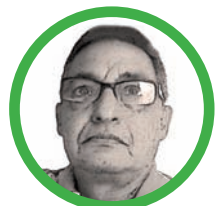
Por José Aragón Jiménez