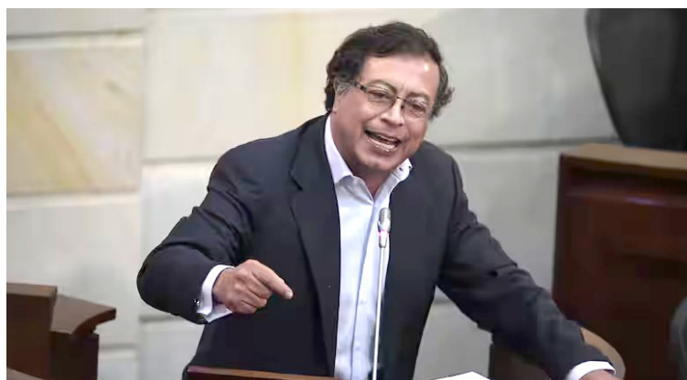
Comparando sus roles como congresista, alcalde y presidente hoy se ven enfrentados.

La capacidad para destapar escándalos y poner en evidencia las fallas del sistema lo posicionaron como una figura polémica, pero respetada en el ámbito legislativo.