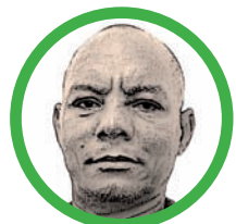
Por Luis Alberto Borja Medina

Las inmensas riquezas de nuestro territorio guajiro eran las llaves para brillar ante Colombia y el mundo pero desde tiem-