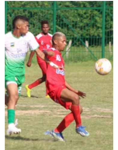
El resultado fue valioso para Juventud Molinera.

para para recibir a Atletas del Mañana como local en un partido crucial que definirá los primeros puestos del torneo.