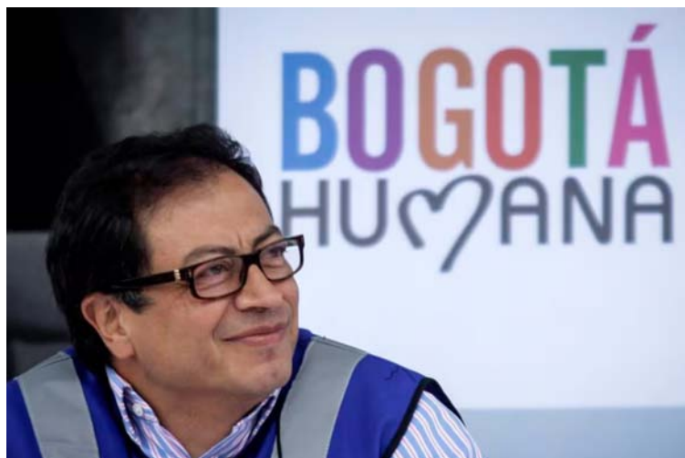
En su rol como alcalde de Bogotá, Petro, intentó implementar su visión progresista a una escala más local.

El señor presidente Gustavo Petro comenzó su carrera política como un ferviente defensor de los derechos humanos y la justicia social.