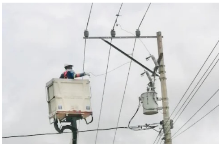
Air-e solicita a comunidad tomar medidas para mitigar el impacto de esta interrupción temporal del servicio.

correcto funcionamiento de sus equipos. Las maniobras de alta tensión se realizarán hoy miércoles 24 de julio.