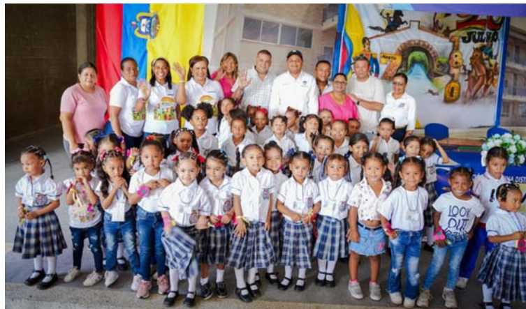
La iniciativa busca brindar más oportunidades para el desarrollo integral de los niños y niñas del Distrito.

"Que bueno que esta sea una oportunidad para que estas niñas puedan desarrollar sus habilida-