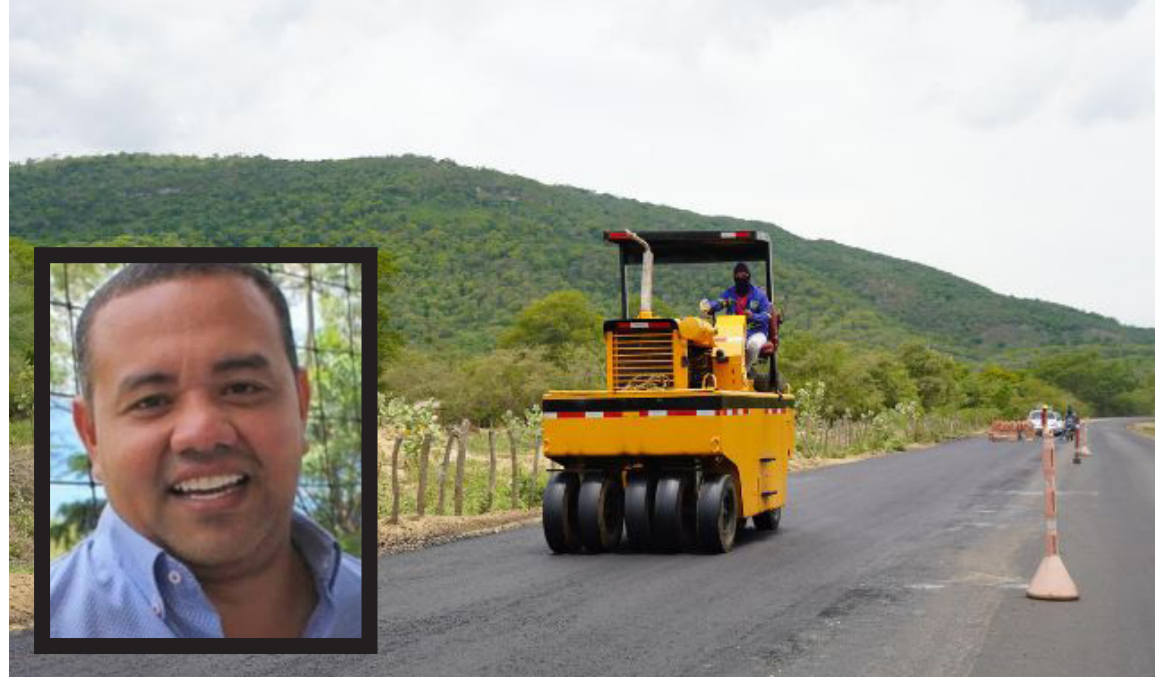
Con alcaldes(as) de cada municipio, se adelanta la caracterización de las empresas.

Asimismo, con los alcaldes y alcaldesas de cada