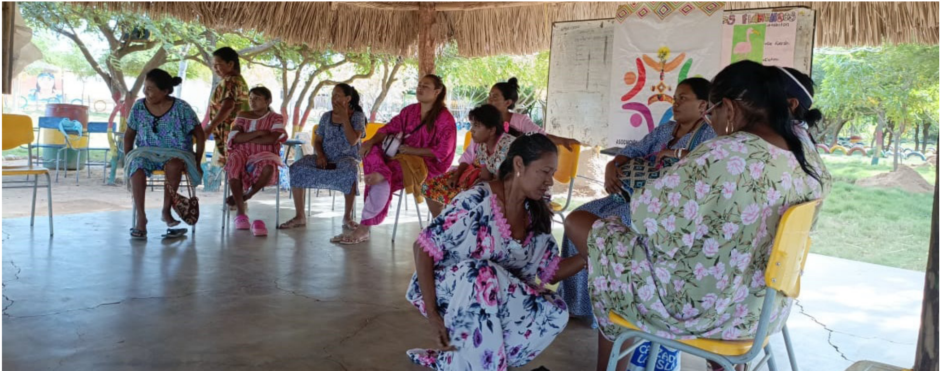
Carmen wayuú, es una madre cabeza de familia, quien considera interesante la iniciativa porque es una forma de fortalecer la cultura wayuú.