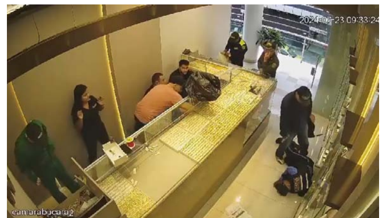
Los bandidos entraron armados y lo primero que hicieron fue desarmar al vigilante y golpearlo en la cabeza.