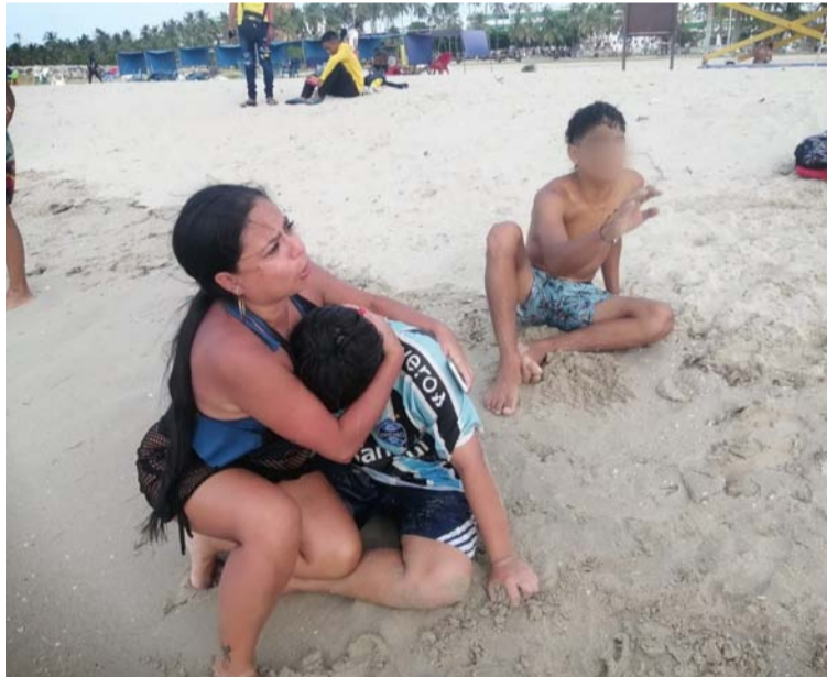
La Fundación Guajira Aventura, señaló que los padres de los menores no estaban al momento del incidente.

Por tal motivo, la Fundación Guajira Aventura hace un llamado contun-