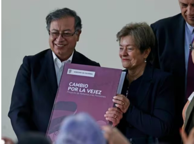
Petro dijo que la reforma es una deuda pendiente que no se había resuelto debido a "intereses de banqueros".