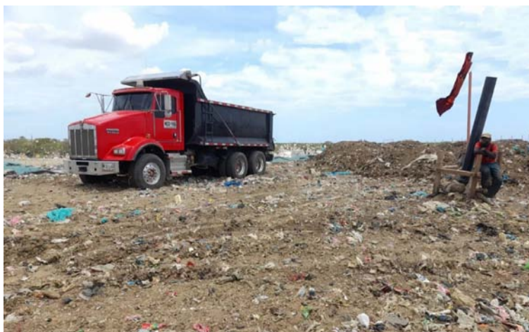
La alta deuda es la que los tiene en aprietos para poder cumplir a cabalidad con la operación.