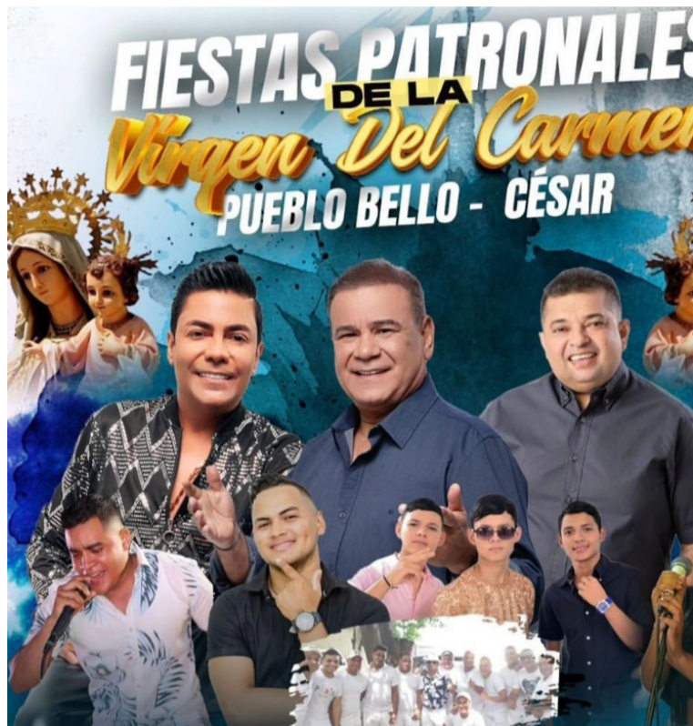
El público le pide cantar éxitos como 'Sal un ratico', 'Un mundo real', 'Apagando focos', y 'Misión imposible'.

Iván Villazón animará con su canto las fiestas de la Virgen del Carmen en el Cesar y Magdalena y esta misma semana emprende viaje hacia Estados Unidos, para presentar su nuevo álbum 'Un mundo real'.