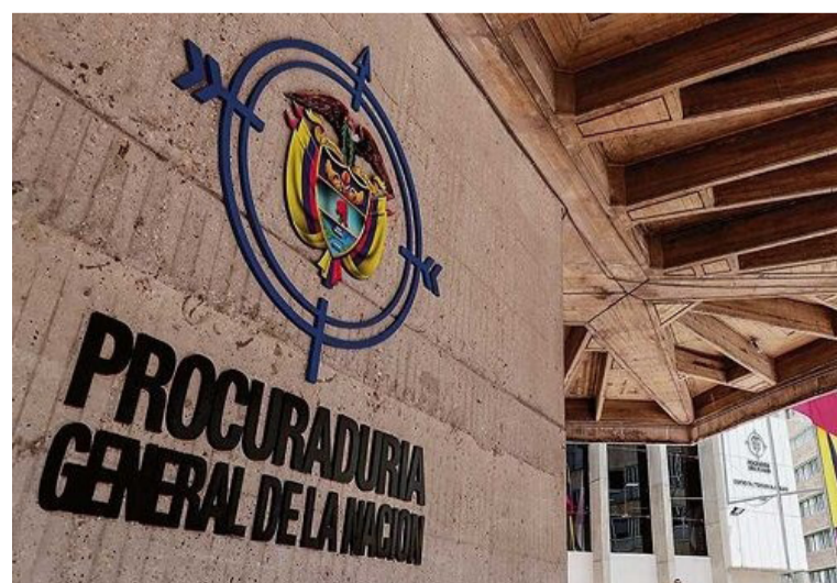
De la terna, el Senado de la república elegirá al nuevo Procurador (a) General de la Nación.

Terminado el proceso de inscripción de aspirantes para elegir el candidato de la Corte Suprema de Justicia (CSJ) para integrar la terna de la que el Senado elegirá al nuevo Procurador (a) General de la Nación, se inscribieron sesenta personas.