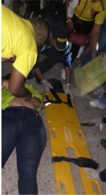
La emergencia fue atendida por 5 unidades bomberiles, la unidad móvil 01 y la máquina M2.