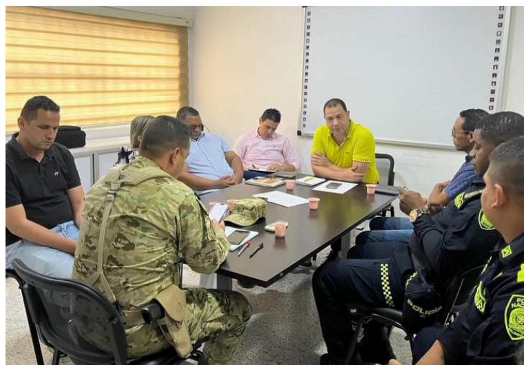
Se anunció un aumento de las acciones de control territorial por parte de las Fuerzas Militares y de Policía.