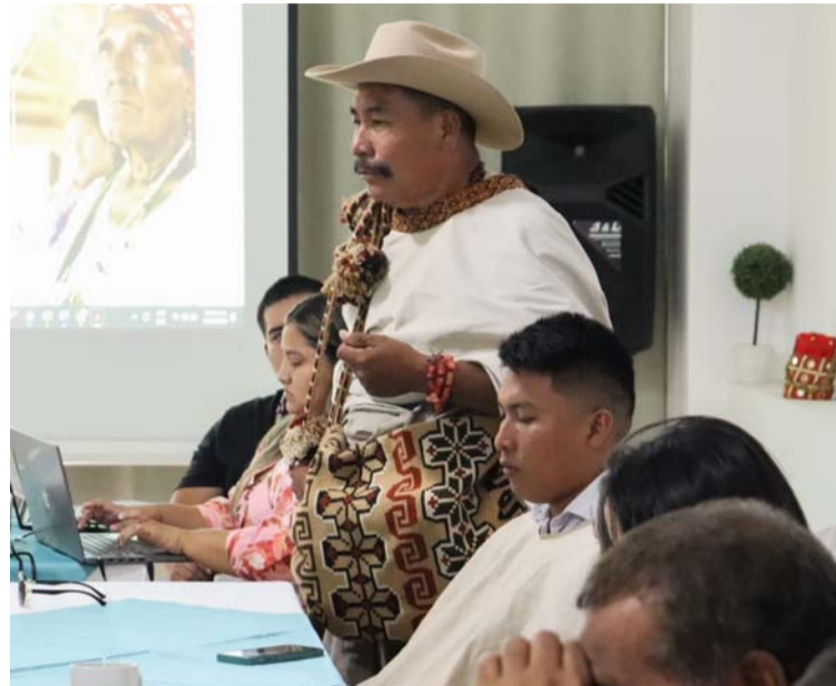
Es una propuesta de protocolo que busca la construcción de la mano de las autoridades de los territorios.

Asimismo, hacen claridad que es una propuesta inicial del protocolo el cual busca la construcción de la mano de las autoridades de cada uno de los territorios en cada uno