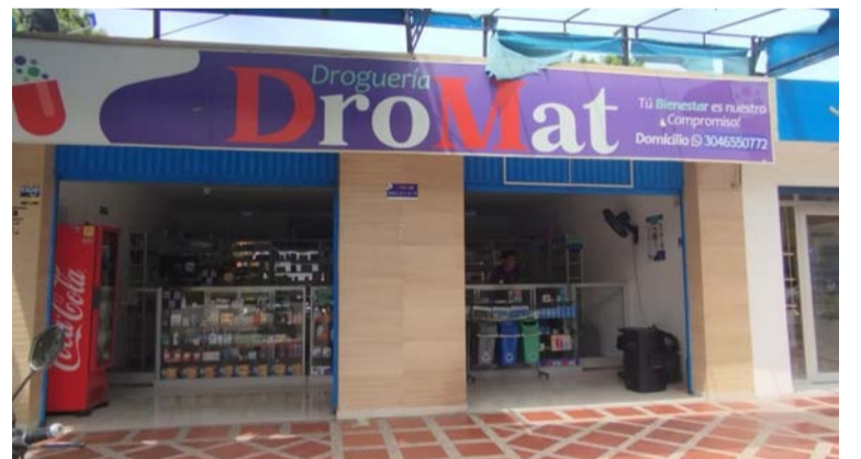
Este sería el segundo robo ya que el primero ocurrió el pasado 13 de mayo de 2023.

Asimismo, se conoció que el propietario de la droguería ya instauró la denuncia ante la Fiscalía General de la Nación, para que inicien las investigaciones y que puedan dar con los responsables de este hecho.