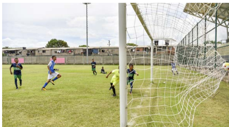
La apertura de esta edición tuvo lugar en el polideportivo del municipio de Albania.