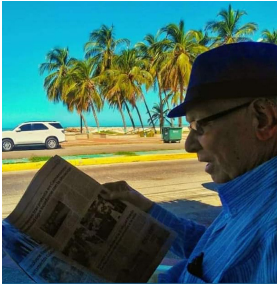
Márquez pasaba horas frente a su computador escribiendo sus artículos de opinión.

Fue un pilar fundamental para su familia junto