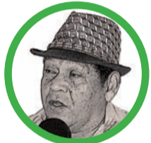
Por Rosendo Romero Ospino