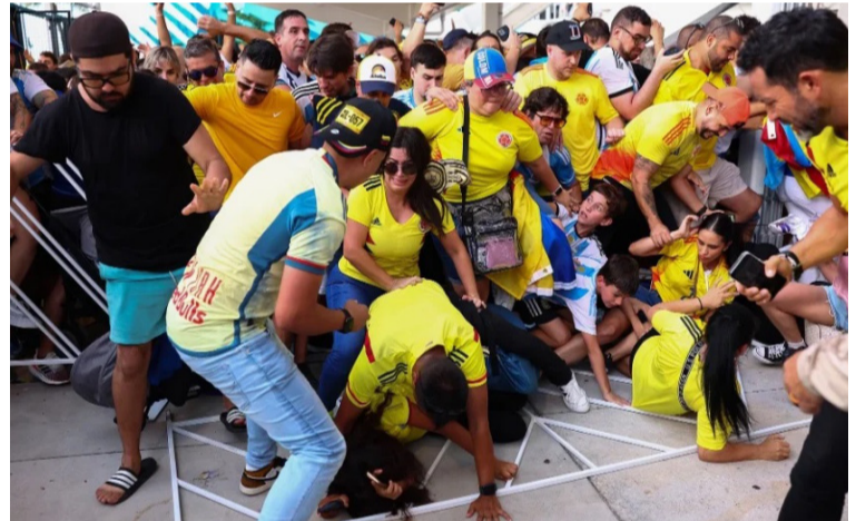
Los hechos habrían ocurrido en medio de los incidentes que se presentaron en el Hard Rock Stadium.

Sin entregar detalles de las causas del arresto, se conoció que el dirigente