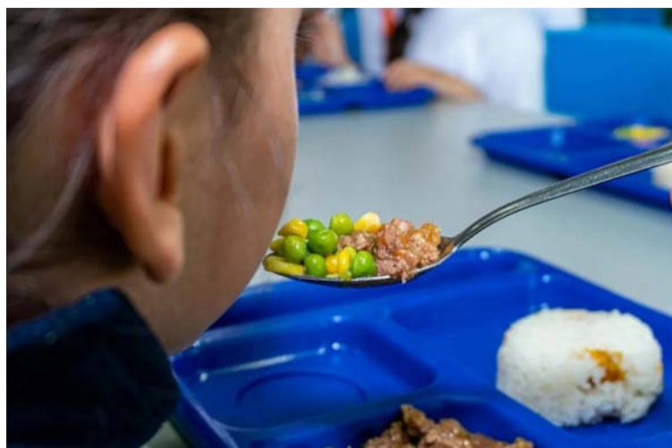
El PAE para niños wayúú, refleja un esfuerzo por traer orden y justicia a una región históricamente olvidada.

El concepto del Demiurgo y la dualidad en la política de La Guajira nos ofrece una lente rica y profunda para entender la complejidad de la vida política en la región. Nos recuerda que el camino hacia una sociedad más equitativa y pacífica no es simple ni lineal, sino un proceso dinámico que requiere la integración constructiva de fuerzas opuestas. En este viaje, todos, desde los líderes hasta los ciudadanos, somos demiurgos, modelando el futuro de La Guajira con cada acción y decisión.