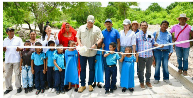
El alcalde dijo que el 40 % de la población indígena del municipio debe verse representada en las grandes obras.