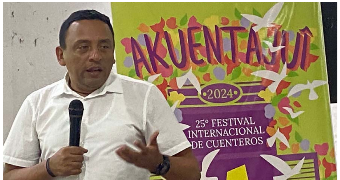
El Festival de Cuenteros Akuentajui se ha convertido en una propuesta destacada.

Afortunadamente, todo su equipo de trabajo se encuentra fuera de peligro. Aunque el vehículo en el que se transportaba sufrió graves daños en la parte delantera. Asimismo,