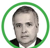
Por Rubén Darío Ceballos Mendoza