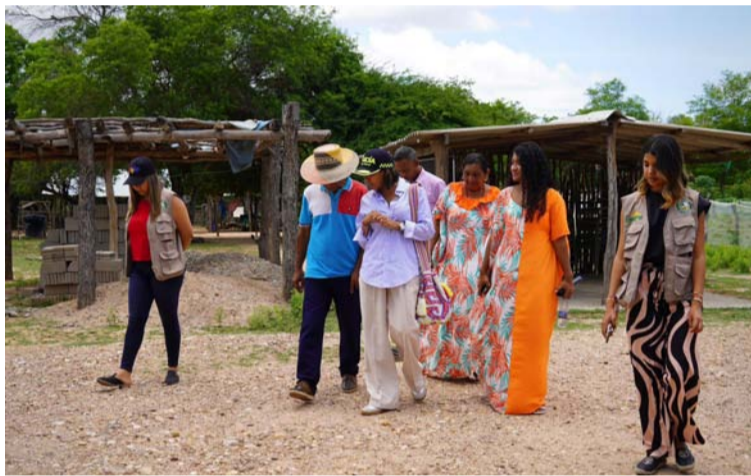
Autoridades locales y tradicionales destacaron el impacto que esta obra tendrá en la calidad de vida de los estudiantes.

A la inauguración de estas nuevas aulas asistieron autoridades locales y tradicionales, quienes desta-