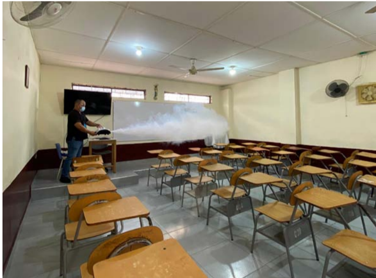
El colegio suspendió las clases de manera presencial, mientras se adelantan las medidas de desinfección.

Atendiendo la emergencia presentada en el Colegio La Sagrada Familia en el municipio de Villanueva ante la presencia de un virus que al parecer es causado por una variante gripal, la Secretaría de Salud Municipal y Departamental, la E.S.E. Hospital Santo Tomás a través del Plan de Intervenciones Colectivas PIC y el equipo de Atención Primaria en Salud, realizaron la desinfección de toda la planta física del plantel educativo, con el propósito de disminuir la población del mosquito transmisor del dengue ( Aedes Aegypti ) y de otras enfermedades