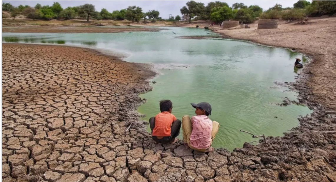
Desde 1980 hasta la fecha, el menor registro de lluvias es entre diciembre y febrero.

Cada principio de año, los vientos alisios del norte, que soplan paralelos a la costa, reduciendo las lluvias y los afloramientos que enfrían la superficie del mar, se intensifican. Después de