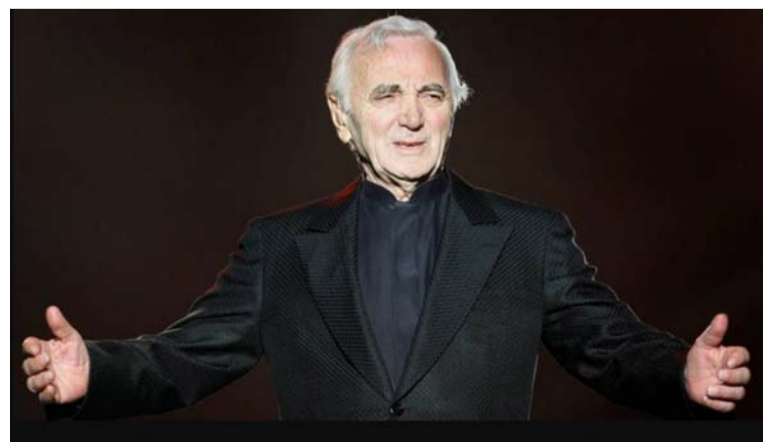
En un álbum propio, Charles Aznavour cantó con Liza Minelli, Elton John, Plácido Domingo y Laura Pausini.

El presidente de Francia, ante la muerte del cantante, expresó: “Charles Aznavour acompañó las penas y las alegrías de tres generaciones. Sus obras maestras, su timbre, su brillo único le sobrevivirán mucho tiempo”. La Torre Eiffel permaneció iluminada la noche de ese luctuoso 1 de octubre, como homenaje al ilustre desaparecido.