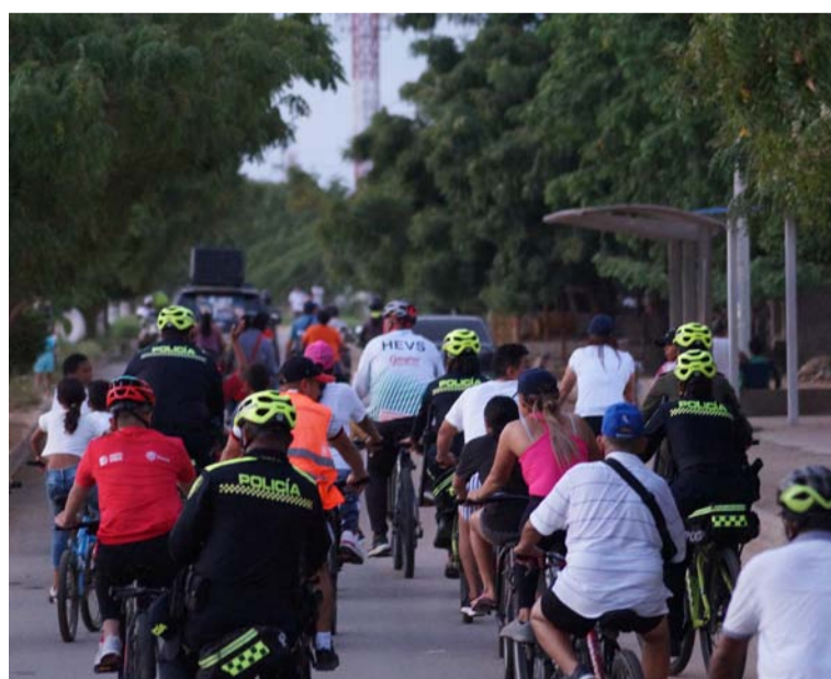
La jornada se desarrolló con el objetivo de promover la convivencia, el deporte y el fortalecimiento de la comunidad.