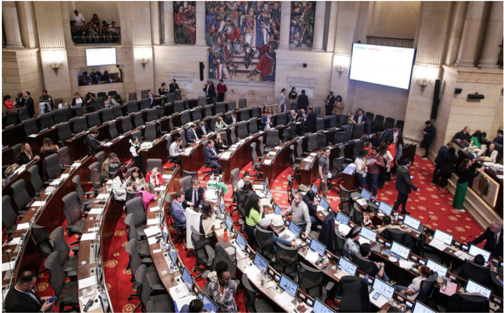
Las casas políticas tradicionales han venido perpetuándose en el poder y ya es hora que le den paso a nuevas caras y talentos.

Las casas políticas tradicionales han venido perpetuándose en el poder