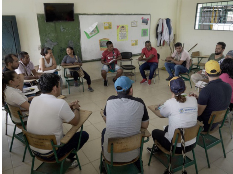
La declaración de bienes y rentas debe ser realizada antes del 31 de julio de 2024 a través del Sigep II.

obligaciones financieras, conformación familiar, bienes patrimoniales, al igual que, sus ingresos laborales y no laborales, entre otros.