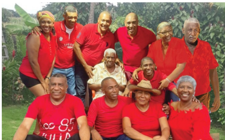
Para esta edición se han inscrito 14 equipos participantes, cada uno conformado por seis deportistas.

Con esta tercera edición de 'El DesafíoX', se consolida esta actividad que se realiza en el mes de junio de cada año con el objetivo de concientizar a la ciudadanía que es bueno vivir en armonía con la naturaleza, respetándola y cuidándola. Además se genera un ambiente de integración entre comunidades de la zona rural y urbana.