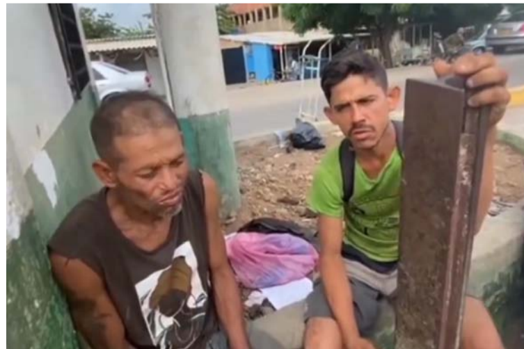
De los 15 migrantes, cuatro siguieron para Venezuela, tres se quedaron en Paraguachón y ocho se trasladaron vía Maicao.

Precisó, que logró entrevistarse con dos de los quince migrantes expulsados por Migración regional Orinoquia desde el municipio de Arauca, en el que se mani-