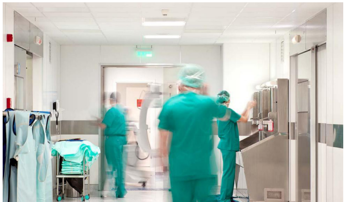
Los servicios prestados por clínicas y hospitales en la pandemia, generaron grandes gastos.

gobiernos nuestros y que los afectaron o afectan?; el de Falaris de Agrigento quien vivió en la Grecia del siglo VI a.C. y gobernó la isla de Sicilia dejando importantes obras tales como estructuras de conducción de agua corriente, algunos caminos y el templo de Zeus en la Acrópolis. No obstante, su inmensa egolatría, el desmesurado culto a su propia personalidad y su obsesión por el poder y el control sin límites, lo condujeron a autoproclamarse emperador vitalicio, pese a las advertencias de unos pocos y la creciente atrocidad y brutalidad de las decisiones y actos de la tiranía de su Gobierno, terminaron convirtiéndolo por siempre en símbolo de crueldad y tortura; si lo traemos a nuestro entorno, nos enfrentamos a una crisis sin precedentes, donde la que pagará los platos rotos será la salud de los Colombianos.