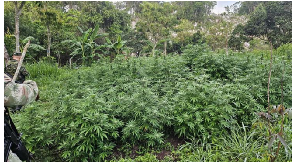
Se hallaron 100 kilogramos de la sustancia psicotrópica evaluados en $150.000.000; de igual forma, 5.000 plántulas y 4 hectáreas sembradas.