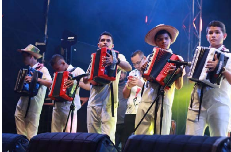
Las 10 agrupaciones participantes competirán por los títulos de Mejor Cantante, Mejor Acordeonero y Mejor Agrupación.

Los asistentes también podrán disfrutar de una variada agenda de actividades, que incluye eventos académicos, el desfile folclórico inaugural, la pasarela AMA, y un desfile de carros antiguos, entre otros.