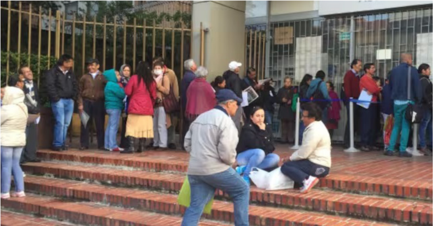
Los precios de medicamentos, los insumos y dispositivos se dispararán y no habrá un Chapulín que dirá y ahora ¿quién me puede salvar?.