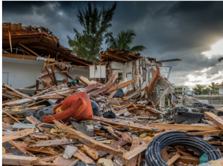
La entidad exhortó al Gobierno nacional y autoridades competentes para ejecutar acciones de prevención y mitigación.

A través de la directiva 04 de 2024, el Ministerio Público exhortó al Gobierno nacional y a las autoridades competentes, a ejecutar las acciones para la prevención, preparación, monitoreo, mitigación, alistamiento, atención y recuperación de desastres, manejo de emergencias y reducción de riesgos previstos para los fenó-