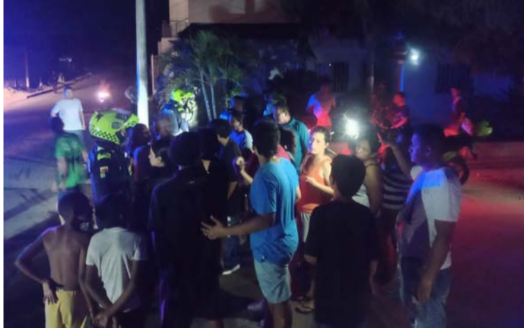
Dos sujetos armados en moto atacaron a unos jóvenes, creando pánico entre la comunidad que se hallaba a oscuras.

Asimismo, otros vecinos que pidieron no ser identificados, señalaron que luego de que la electricidad su-