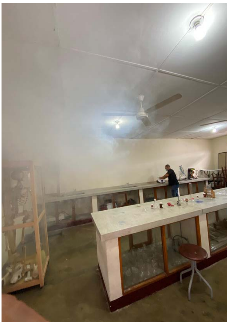
No todos los pacientes que llegan al hospital tienen dengue, son cuadros febriles de virosis asociadas a dengue.

“El tema de fumigación con agentes químicos está relevado por lo perjudicial para la salud del ser humano y sus efectos adversos científicamente comprobados, como administración y hospital venimos liderando campañas basadas en un modelo preventivo predictivo y resolutivo donde la comunidad es el eje central de este proceso para poder contrarrestar entre todos el a transmisor que es una de las causas de ingresos a urgencia del hospital con sintomatología para dengue, aclarando que todo lo que