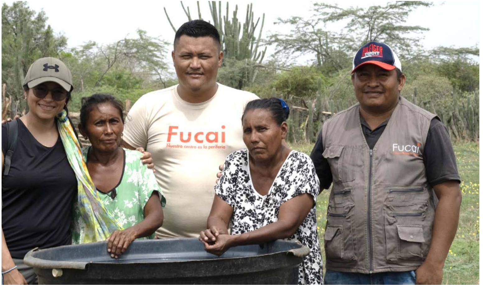
Los agricultores wayuú enfrentan desafíos logísticos y culturales que influyen en sus decisiones comerciales.

Las evaluaciones en que ha venido trabajado Econometría, se encuentra que la experiencia de la Fundación Alpina en la Alta Guajira podría dar luces de como producir alimentos de manera rentable y mantener una oferta diversificada en los territorios dispersos. En esa evaluación se determina que “en una zona semi-desértica contar con agua lo es todo: primero para el consumo humano, pero también para el desarrollo de actividades agropecuarias que complementan los ingresos de las tradicionales artesanías y son la base para la seguridad alimenta-