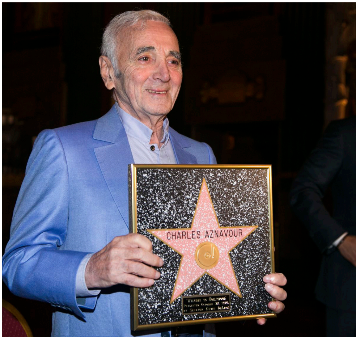
Charles Aznavour se presentó en el Olympia y en el Moulin Rouge, en la capital francesa.

numerosas películas, como ‘La cabeza contra la pared’, ‘El testamento de Orfeo’ y ‘El tambor de hojalata’. Sin embargo, su pasión siempre fue la música.