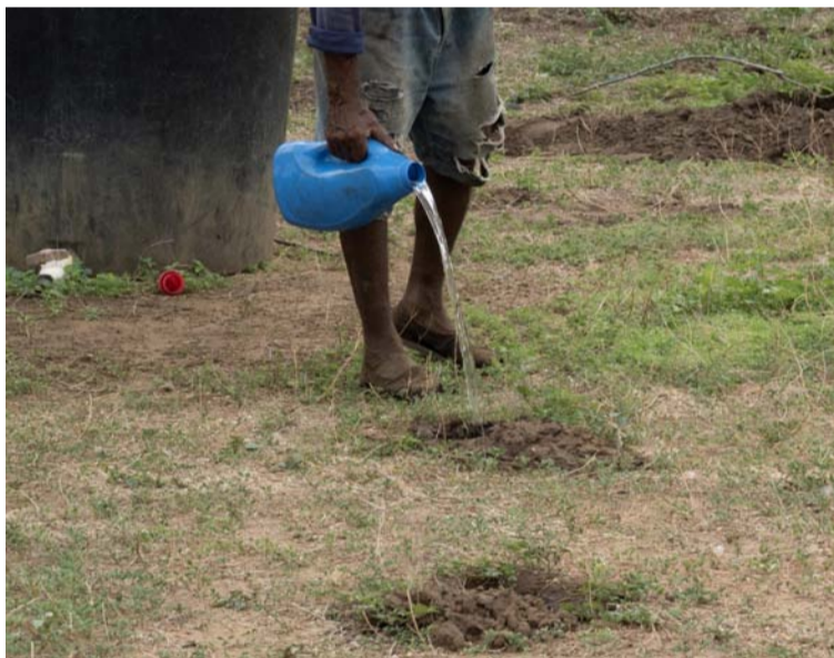
Algunos agricultores wayuú ha diversificado el cultivo sembrando mijo, algunos frutales y árboles de marañón.

ria, más en una perspectiva de soberanía y autonomía alimentaria”.