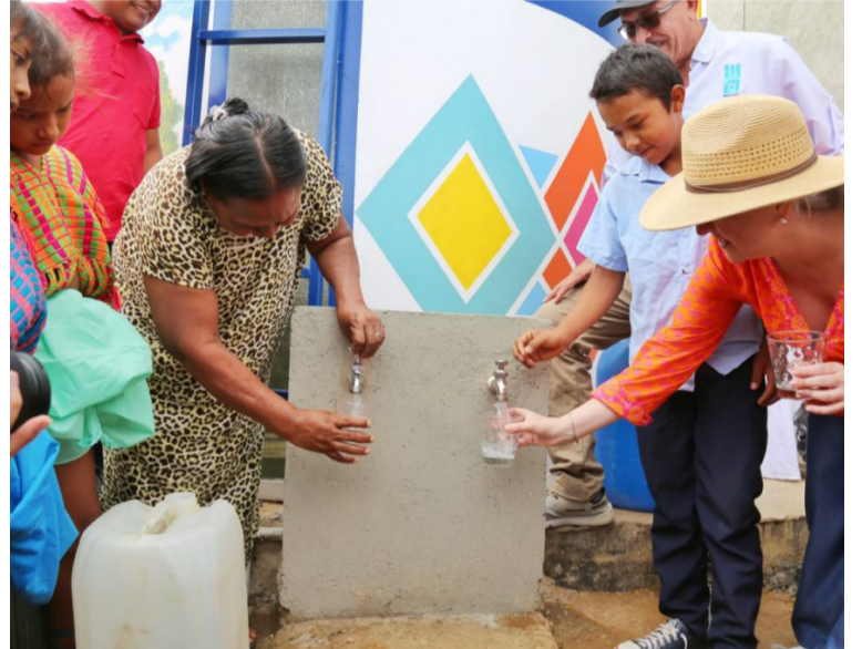
Las obras beneficiarán a los habitantes de zonas urbanas y rurales de Maicao, Riohacha, Uribia y Manaure.

Las obras beneficiarán a los habitantes de las zonas urbanas y rurales de los municipios de Maicao, Riohacha, Uribia y Manaure.