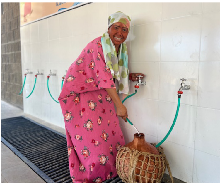
Ecopetrol, Esepgua y Manaure aunaron esfuerzos para entregar este sistema de suministro de agua potable.

El convenio incluyó la entrega de 450 pimpinas para la comunidad, elementos de dotación para áreas ad-