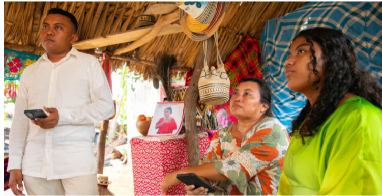
‘ConectiVidad para Cambiar Vidas’, es uno de los proyectos más ambiciosos en la historia de la conectividad.

‘ConectiVidad para Cambiar Vidas’, es uno de los proyectos más ambiciosos en la historia de la conectividad en Colombia, pues le apunta a llegar a comunidades que históricamente han sido olvidadas. Así, el Ministerio TIC busca entregarles tecnología a los colombianos, para que tengan el mismo acceso a las mismas oportunidades de crecimiento y