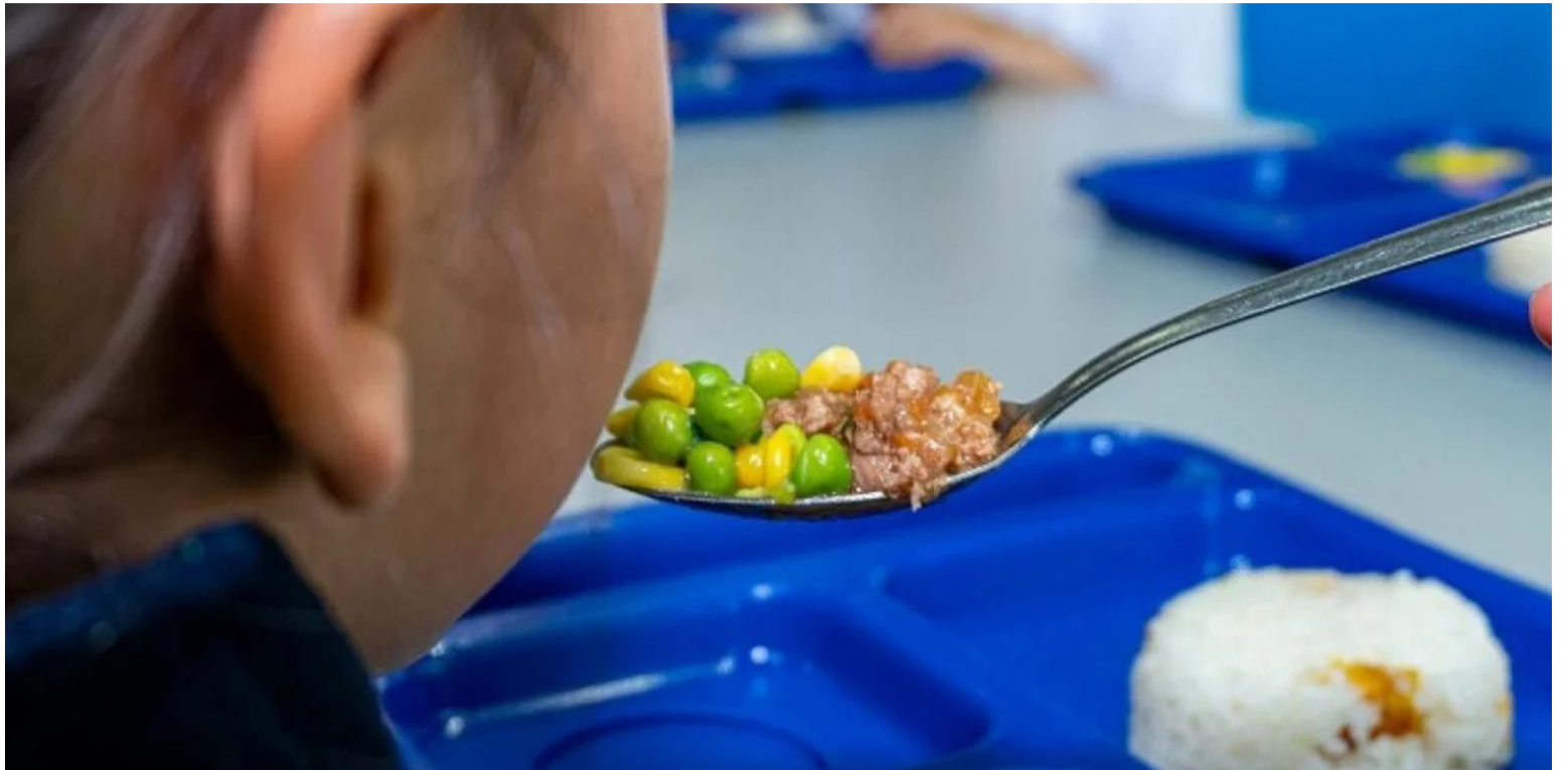
El órgano de control lanzó una alerta sobre el posible riesgo de interrupción del PAE para el segundo semestre del 2024.

La población mayoritaria de la ETC Bolívar no está prestando el servicio de ali-