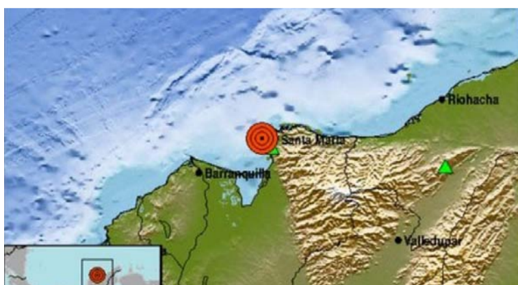
El movimiento se percibió en los corregimientos cercanos, en el Sur de La Guajira y en la ciudad de Santa Marta.

El Servicio Geológico Colombiano informó sobre un sismo que sacudió a la 1:50 am un sector en el norte de La Guajira, con epicentro en el mar Caribe frente a las costas del municipio de Dibulla. El evento telúrico tuvo una magnitud de 2.7 y una profundidad muy superficial, menor de 30 kilómetros, lo que provocó que se sintiera en una amplia zona aledaña.