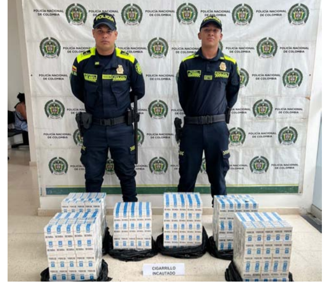
En varios operativos policiales fue recuperada una motocicleta implicada en un hurto, el decomiso de un arma y la incautación de cigarrillos extranjeros.