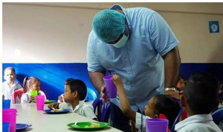
La ETC La Guajira inició la prestación del servicio de alimentación escolar con más de 30 días de inoportunidad.

De las 97 ETC, 8 ETC del PAE Mayoritario (Antioquia, Caquetá, Córdoba, Montería, Girardot, Sucre, Sincelejo y Popayán) y 7 ETC del PAE Indígena (Popayán, Cesar, La Guajira, Norte de Santander, Chocó, Buenaventura y Córdoba) iniciaron la prestación del servicio de alimentación escolar con más de 30 días calendario, de inoportunidad. Asimismo, es preocupante que, 10 ETC del PAE Mayoritario (La Estrella, Barranquilla, Florencia, Casanare, Yopal, Cauca, Cesar, Loricá, Huila y Neiva) y 11 ETC del PAE Indígena (Arauca, Casanare, Cauca, Córdoba, Guainía, Guaviare, Huila, Maicao, Sincelejo, Sucre y Valle del Cauca) iniciaron con un retraso