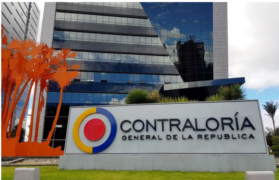
La Contraloría llamó a todas estas ETC para que garanticen la prestación del servicio.

mentación escolar desde el 28 de mayo del 2024, situación que afecta a 153.499 estudiantes de la zona.