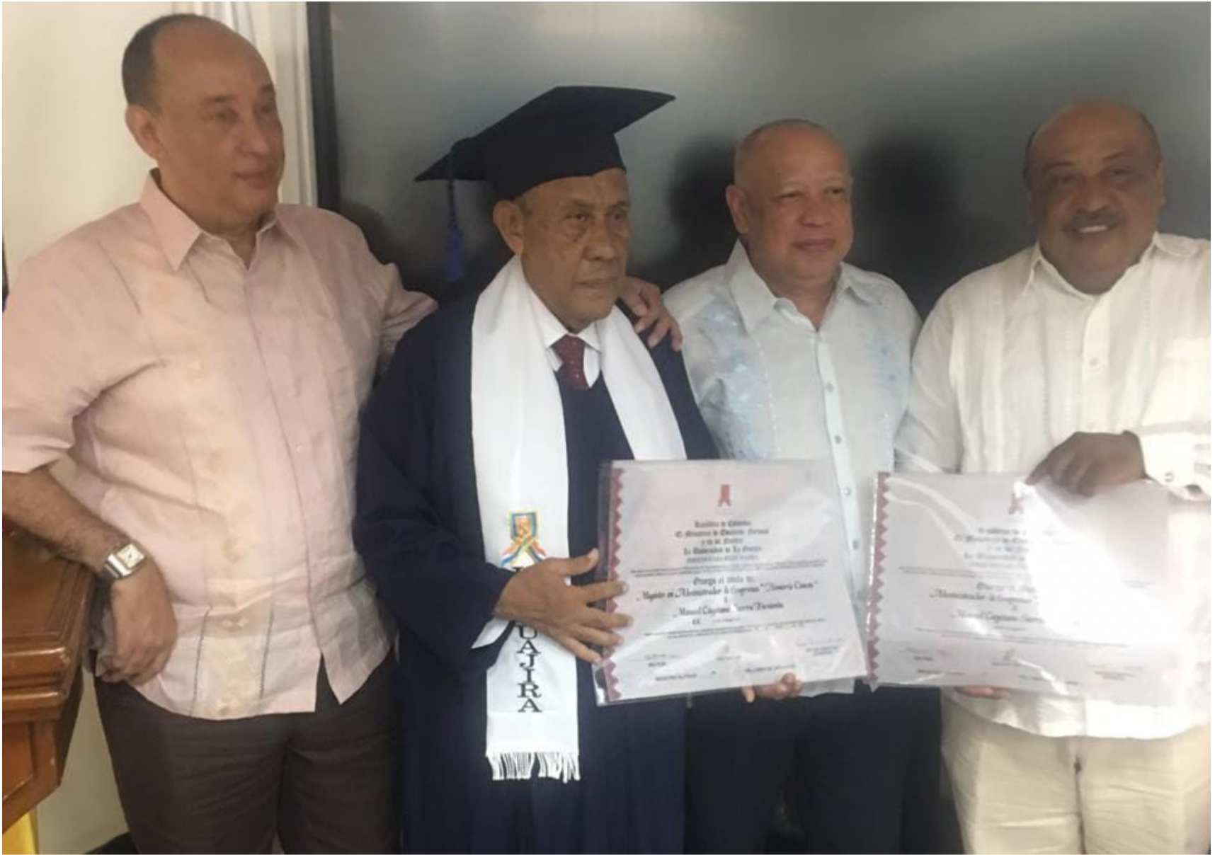
En su vida política, representando al partido Conservador, fue concejal de Riohacha y diputado de La Guajira durante varios períodos.