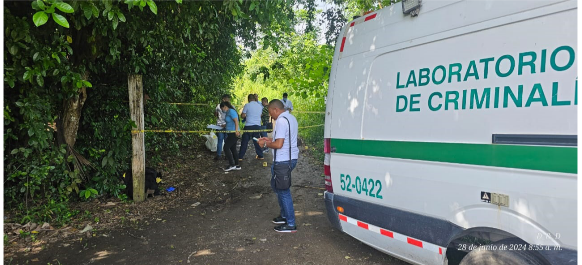
El hallazgo se dio en la vereda Cara y Sello, kilómetro 16+600 del corregimiento de Mingueo.