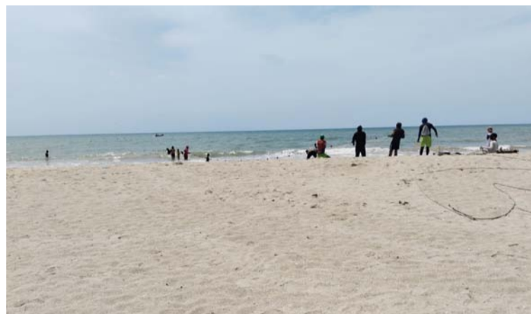
Guajira Aventura denuncia que estas personas utilizan equipos de pesca de gran impacto que arrastran todo a su paso.