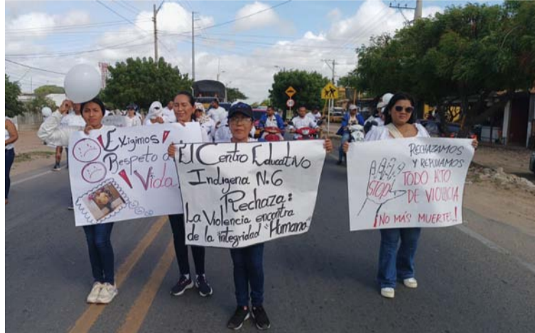
Se adelantó una marcha por parte de los docentes que inició en Uniguajira en Maicao y recorrió varias calles.