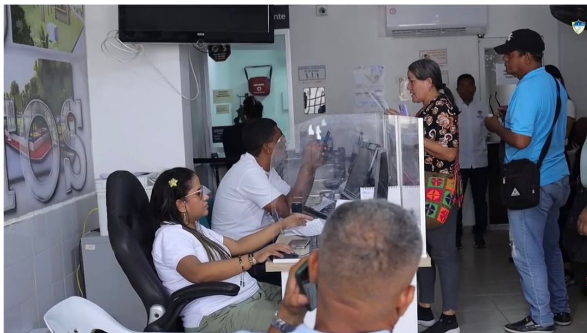
Los contribuyentes tienen hasta el 30 de junio para regularizar su situación tributaria.

Este esfuerzo no solo beneficia a los contribuyentes y negocios, sino que también fortalece las finanzas del Distrito, permitiendo invertir en proyectos para el desarrollo y progreso de la ciudad.