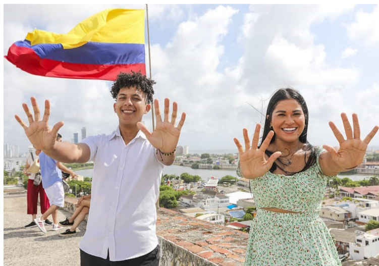
La entrega de la transferencia monetaria irá hasta el 25 de julio, según el calendario que acaba de definir la entidad.

Los jóvenes que no poseen una cuenta bancaria para recibir el pago tienen la posibilidad de abrirla de manera autónoma, gratuita y permanente con el operador de pago.