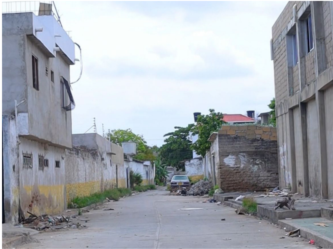
En este sector, se inició una jornada de limpieza y poda organizada por el Distrito e Interaseo.

"Hoy desde la administración distrital tenemos la voluntad de recuperar espacios públicos de la ciudad esto está dentro del marco de esa estrategia cuadrante de ciudad, se va a convertir en uno de los mejores escenarios que va a tener el centro de Riohacha", afirmó Genaro Redondo, alcalde de la ciudad.