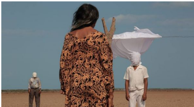
La canción ‘Las bananeras’ recuerda la masacre cometida por el Ejército contra los trabajadores de la Unite Fruit Company.