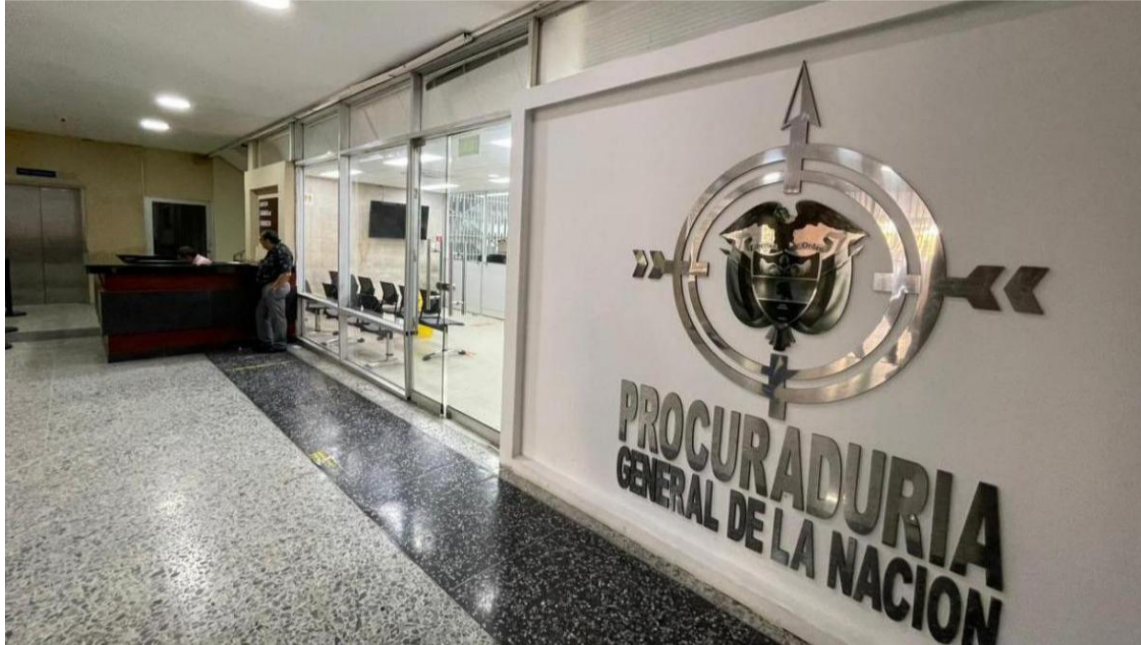
El Sena suscribió convenio en cuyo proceso no hubo participación ni pluralidad de oferentes.

De manera previa a la revocatoria, el 28 de julio de 2023 el Sena declaró la urgencia manifiesta con