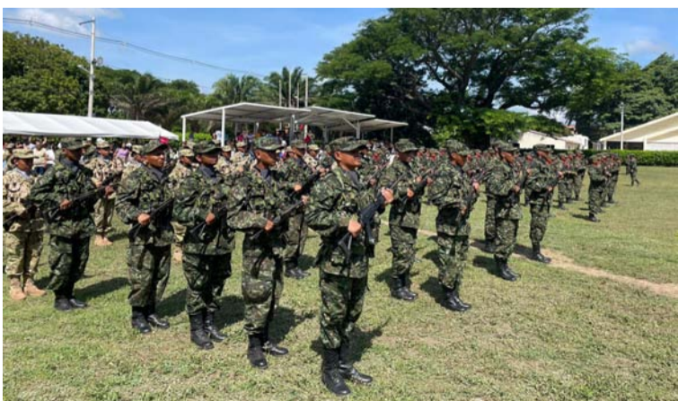
La entrega de armas marca el inicio de una nueva fase, donde se integrarán a las diversas operaciones y misiones del Ejército.