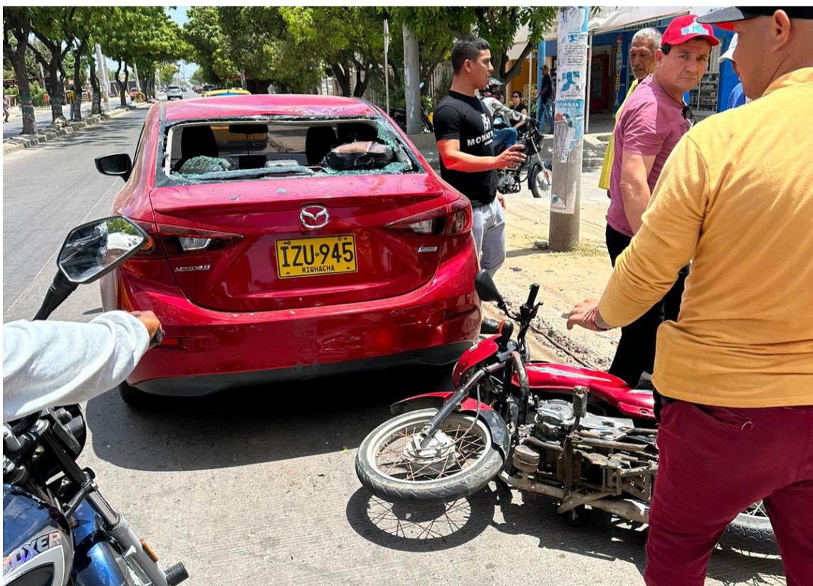
En cámara de seguridad se observa que el hombre chocó por la parte trasera del automotor.

El incidente se registró la tarde del domingo en la calle 15 con carrera 23 de la ciudad de Riohacha. Las autoridades no suministraron la identidad de la persona lesionada.