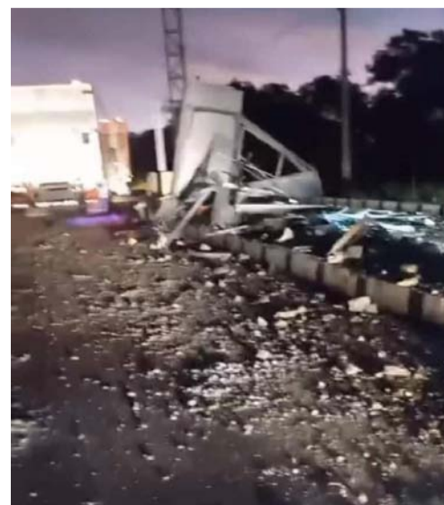
En el bus que chocó contra la estructura del antiguo peaje, solo viajaba el conductor que recogería a los músicos.

El bus de la agrupación musical de Élder Dayán se accidentó la madrugada del sábado en el antiguo peaje de Los Haticos, en jurisdicción de San Juan del Cesar, La Guajira.