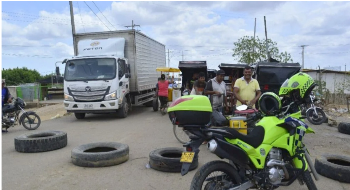
La protesta social es un derecho, que es inequívoco y goza de la protección de la ley,

Una vez posicionados estratégicamente los soldados, se hizo sonar estruendosamente los tambores iniciándose así un silencio frío, sepulcral, profundo, de miedo,