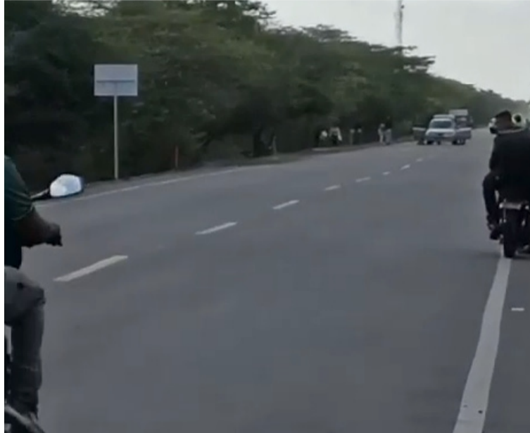
En un video grabado por un conductor de la vía quedó registrado cómo estos delincuentes cometen su fechoría.