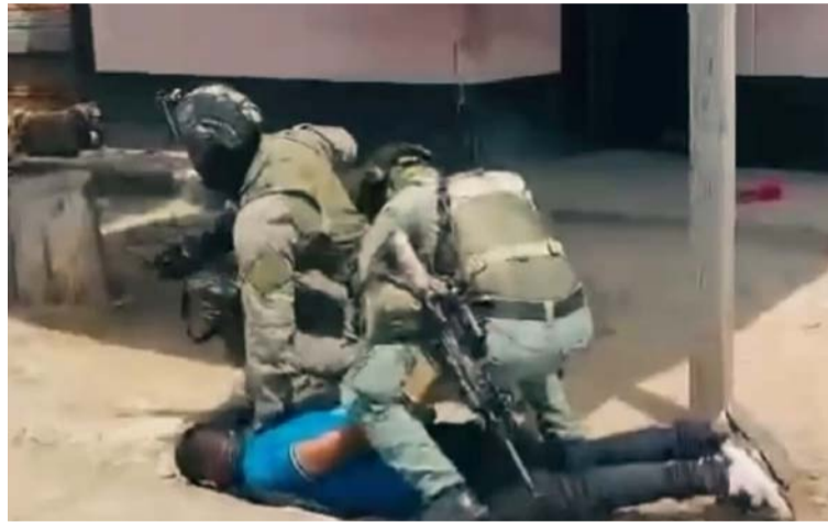
Alias 'Ramiro' era el responsable de la comisión de secuestros, extorsiones, homicidios y reclutamiento forzado.

Y es que, como se recordará, en el Caribe vienen desplegándose operativos especiales para contrarrestar el accionar criminal de las disidencias de las Farc, sobre todo en departamentos como el Atlántico, después de la reciente alerta emitida en Barranquilla por la supuesta conformación de una nueva célula urbana de la organización criminal para, al parecer, atacar contra estaciones de Policía en esta zona del país.