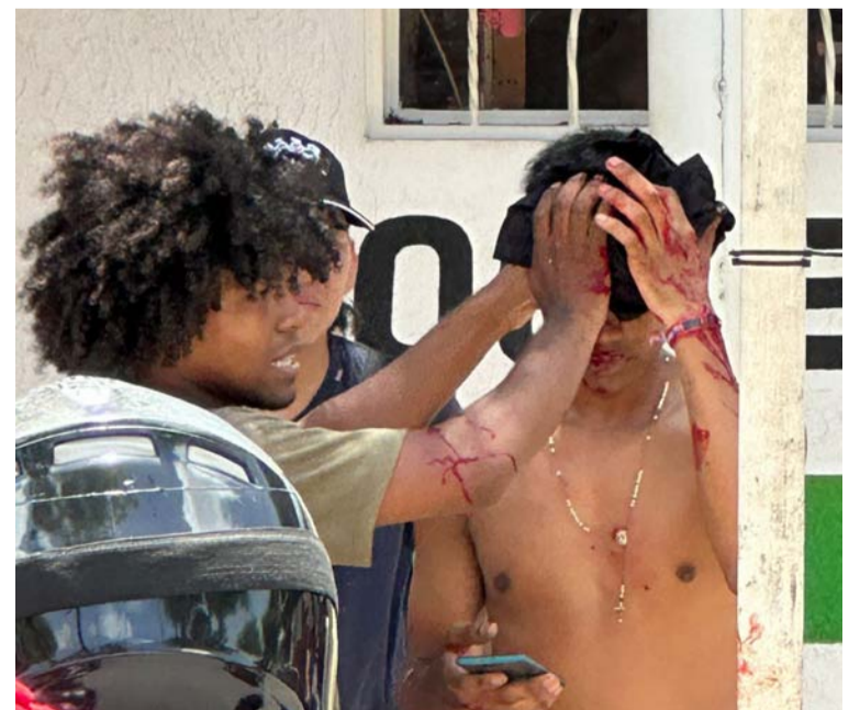
El hombre sufrió heridas en su cabeza y otras partes del cuerpo, siendo auxiliado por los moradores de la zona.