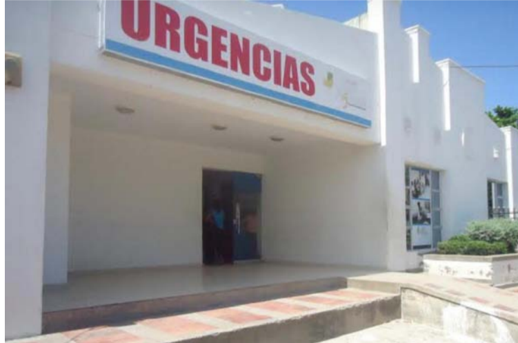
La E.S.E. Hospital San Agustín de Fonseca es un patrimonio del pueblo fonsequeño.