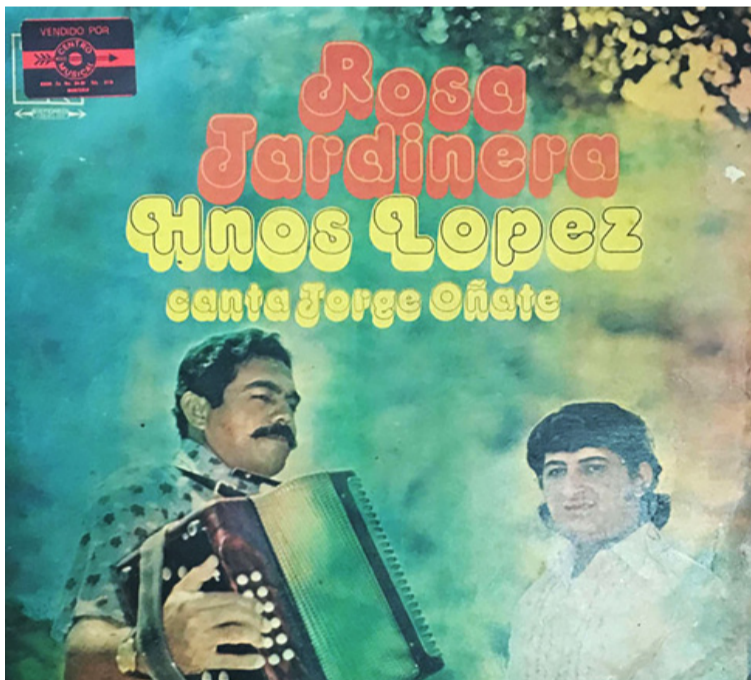
Jorge Oñate con Los Hermanos López incluyeron la canción en el LP ‘Rosa jardinera’ que salió en el año 1974.

y a través de una bocina se leyó para que escucharan los huelguistas el bando por el cual se informaba que se había decretado el Estado de Sitio que prohibía las reuniones de más de tres personas, y se ordenaba a todos el retiro del lugar porque se había decretado ‘Toque de queda’ pero nadie se movió, todos respondieron “Viva la huelga, viva el Ejército colombiano”.