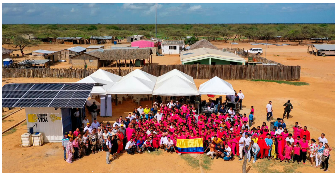
La región cuenta con radiación solar y vientos constantes, ideales para generar energía limpia.

Sin embargo, las perspectivas son optimistas. Con el apoyo continuo del Gobierno, las empresas y las comunidades, La Guajira tiene el potencial de convertirse en un modelo de transición energética para el resto de Colombia y América Latina.