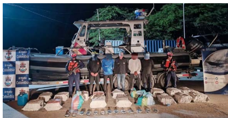
La Armada informó que el alijo en el mercado ilegal tendría un valor de más de 13 millones de dólares.

embarcación arrojaron una cantidad indeterminada de bultos al mar y emprendieron la huida; posteriormente, los uniformados procedieron a recuperar el alijo en el mar, sacando del agua 18 bultos que contenían paquetes rectangulares con una sustancia que, tras ser sometida a la Prueba de Identificación Preliminar Homologada (Piph), arrojó positivo para 409 kilogramos de clorhidrato de cocaína y 48 kg de pasta base de coca.