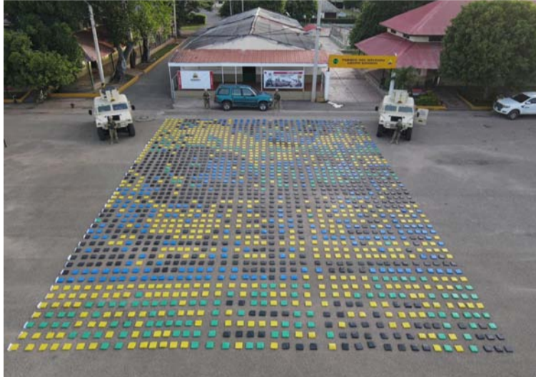
Soldados del Grupo de Caballería Mecanizado N° 2 identificaron una camioneta que llevaba mil kilos de marihuana.

conductor, el vehículo emprendió la huida. Bajo la presión de la tropa, el vehículo fue abandonado,