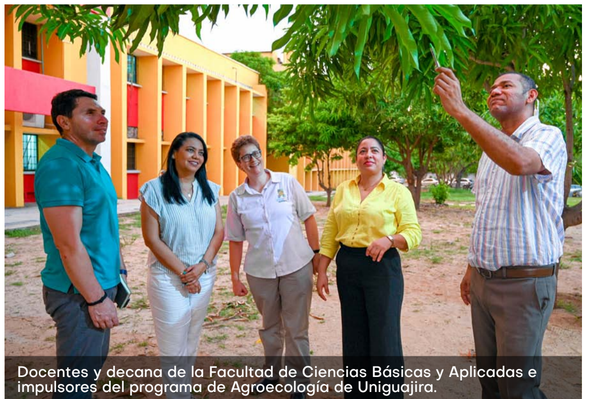
Docentes y decana de la Facultad de Ciencias Básicas y Aplicadas e impulsores del programa de Agroecología de Uniguajira.