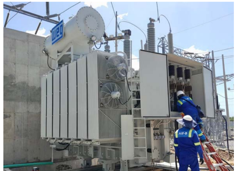
Air-e puso en funcionamiento nuevo transformador.

La empresa Air-e reitera su compromiso con seguir ejecutando importantes obras eléctricas que garanticen un suministro eléctrico confiable y de calidad para los usuarios del Departamento.