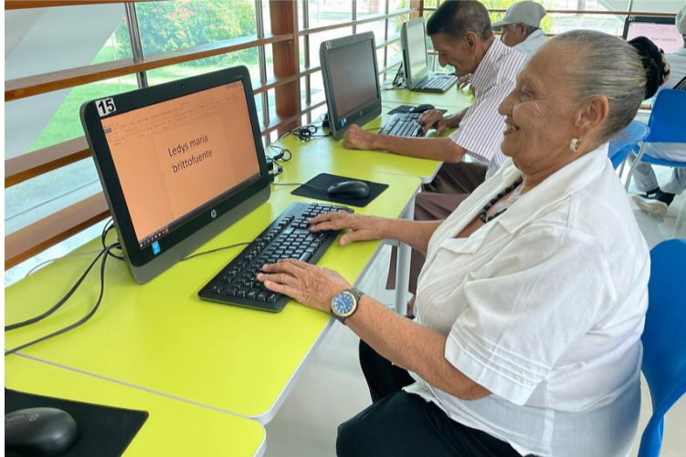
Con la capacitación se busca brindar un mejor entendimiento digital para este grupo poblacional.

La capacitación no solo busca mejorar la competencia técnica de los asistentes,