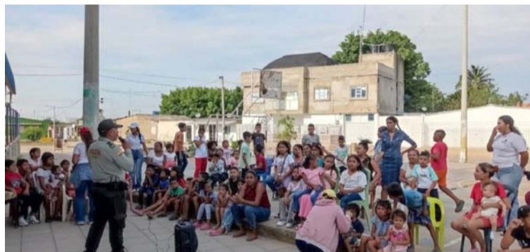
La actividad se llevó a cabo en el escenario deportivo ubicado en la calle 15A, carrera 38, barrio San Francisco.

socializó el objetivo de la campaña, la cual brinda orientación e información a los niños, niñas, padres de familias y comunidad en general de este sector resi-