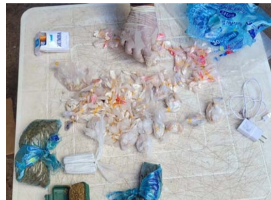
Esta intervención sería la tercera que se realiza en la Estación de Policía de Maicao.

cao en donde los resultados han sido los mismos, lo que se constituye en una gran problemática de seguridad que se está presentando con la entrada de estos elementos, lo cual, al parecer no han podido controlar.