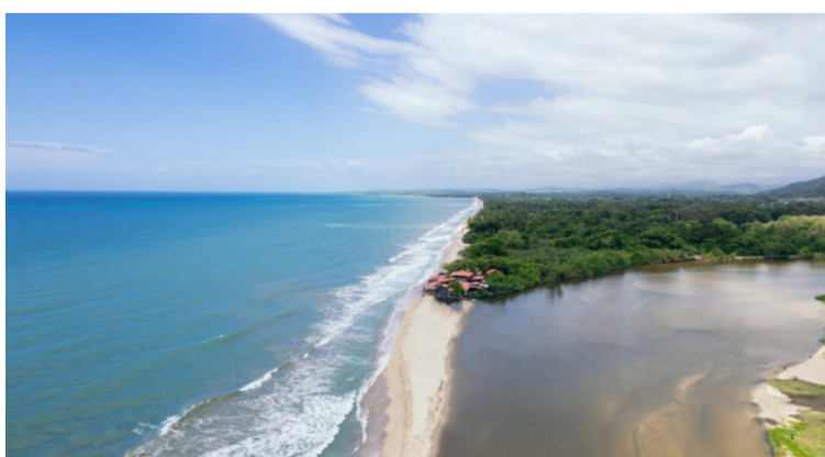
Palomino también es un destino aclamado por los deportistas, que suelen visitarlo para practicar Surf y Body Board.

En Palomino tendrás la oportunidad de disfrutar, descansar, conectarte contigo mismo y con la naturaleza.