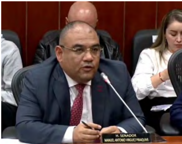
El senador Antonio Correa, propuso debatir la seguridad, crisis migratoria y el tema fronterizo en Maicao.

Igualmente se pide invitar al ministro de Defensa Iván Velásquez Gómez, al comandante general de las Fuerzas Militares, mayor general Hélder Fernán Giraldo Bonilla, al director ge-