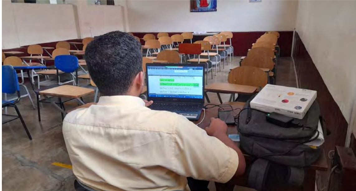
Directivos y docentes decidieron suspender clases presenciales por existencia de una virosis.

“Producto del aumento de contagio de un virus que aún desconocemos en algunos estudiantes con síntomas de alergia nasal