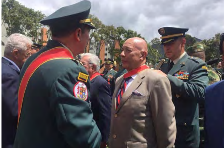
El viceministro de Defensa aseguró que es un día muy especial para 244 mil familias que dependen de estos ingresos.