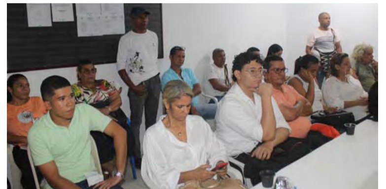
La corporación edilicia aprobó el Plan de Desarrollo Municipal 'Oportunidades con Sentido Social' 2024 - 2027.

“Gases de La Guajira notificará oportunamente sobre el restablecimiento del servicio y proporcionará las medidas de seguridad correspondientes. Agradecemos su comprensión y colaboración durante este proceso”, indicó la empresa de servicio público.