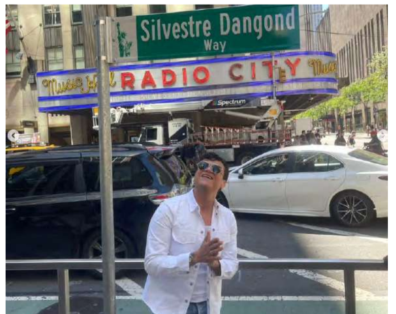
El teatro Radio City, es un emblemático escenario donde se han presentado estrellas como Sinatra y Michael Jackson.

La gira de Silvestre continuó por Boston y seguirá por Estados Unidos, dejando en alto el nombre del folclor vallenato.