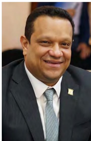
Jorge Cerchiaro, representante a la Cámara.

tal o al Concejo Municipal, detallando la ejecución de los recursos recibidos. Esta medida busca asegurar que los fondos sean utilizados de manera eficiente y que se destinen a mejorar la infraestructura y los servicios hospitalarios, beneficiando directamente a la población del Departamento.