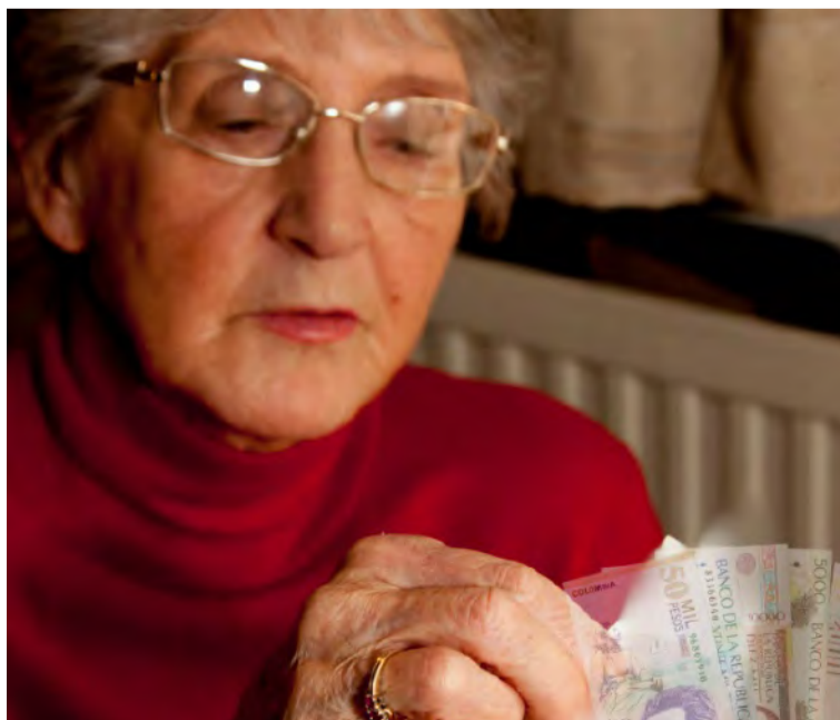
Se deben tener en cuenta los estudios del costo fiscal que generaría el proyecto en el Presupuesto General de la Nación.

La Procuraduría General de la Nación envió a la ministra de Trabajo, Gloria Inés Ramírez Ríos, unas observaciones sobre el proyecto de reforma pensional en las que señaló que se deben revisar cuatro asuntos estructurales que de no ajustarse harían inviable su implementación.