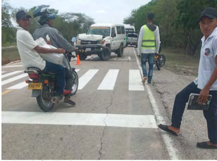
Padres de familia denuncian que a los vehículos no les están haciendo mantenimiento, que sería la causa del accidente.

El fuerte impacto causó la caída de varios estudiantes quienes fueron remitidos de