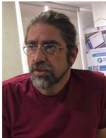
Aquiles Arrieta, exmagistrado de Corte Constitucional.

El exmagistrado agregó que en el caso de los niños y niñas wayúu permite a pesar de sus complejidades, avanzar en la más rápida superación de ese estado de cosas inconstitucional, y quizá por eso se nota en el texto de la sentencia unos plazos y unas órdenes que podían ser menores, sin embargo cuando se dieron esos plazos y esas órdenes la Corte sabía como en todos los casos parecidos y similares que es posible avanzar y dialogar en el cambio de los mismos dependen-