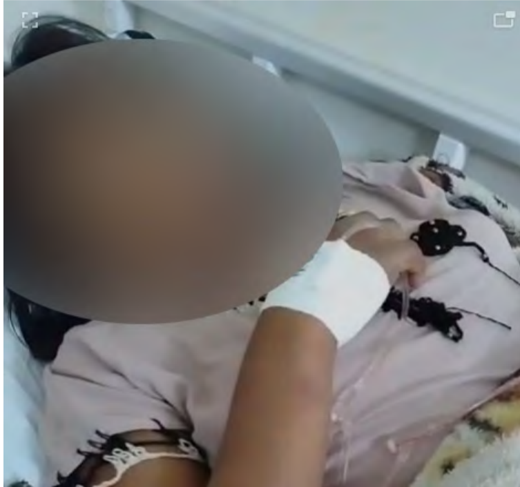
Las dos féminas con heridas en varias partes del cuerpo fueron llevadas hasta la clínica Materno Infantil de Uribia.

Este caso se registró la tarde del martes 5 de junio en la calle 13 con carrera 7 del sector de Las Pulgas en el centro del municipio de Uribia, en donde ambas mujeres al parecer se encontraban consumiendo be-