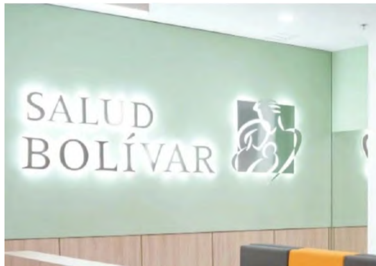
Según la EPS esta difícil decisión se ha tomado tras un análisis riguroso de las circunstancias actuales del sector.

Advierte que los trámites en curso, autorizaciones, procedimientos, citas, tratamientos, medicamentos y