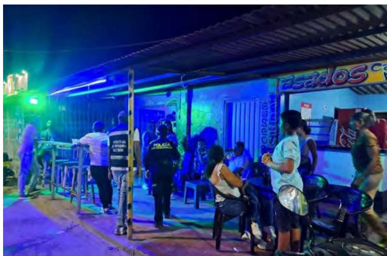
Las autoridades dijeron que los establecimientos no contaban con la documentación exigida para prestar el servicio.