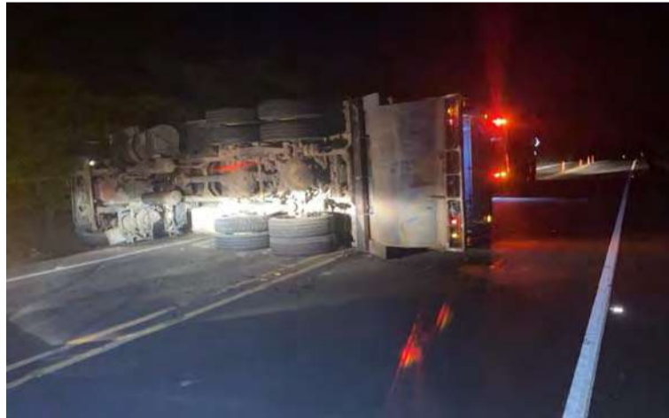
El percance se registró la madrugada del miércoles en el kilómetro 26, de la carretera que conecta a Riohacha y Maicao.

Hasta el lugar del accidente llegaron los miembros de la Seccional de Tránsito y Transporte (Setra) quienes asistieron en la zona y además brindaron la ayuda oportuna a los afectados.