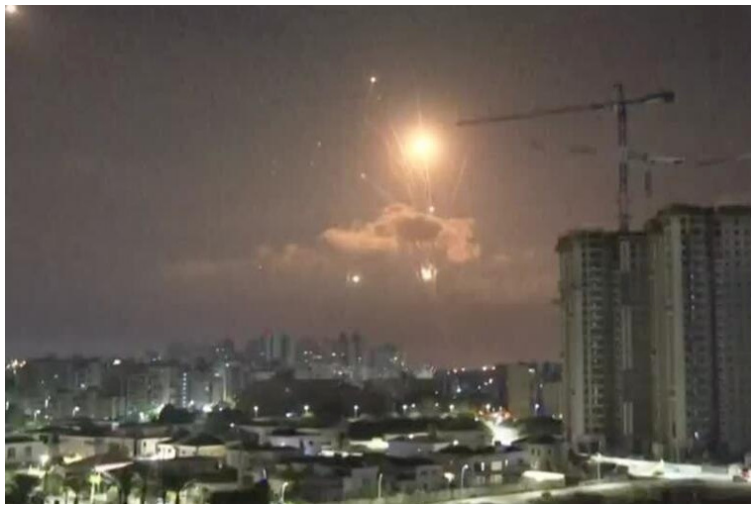
Benjamin Netanyahu logró una importante victoria al defender exitosamente a Israel tras el ataque.

investigadora asociada del programa de Medio Oriente de Chatham House, un centro de estudios en Londres.