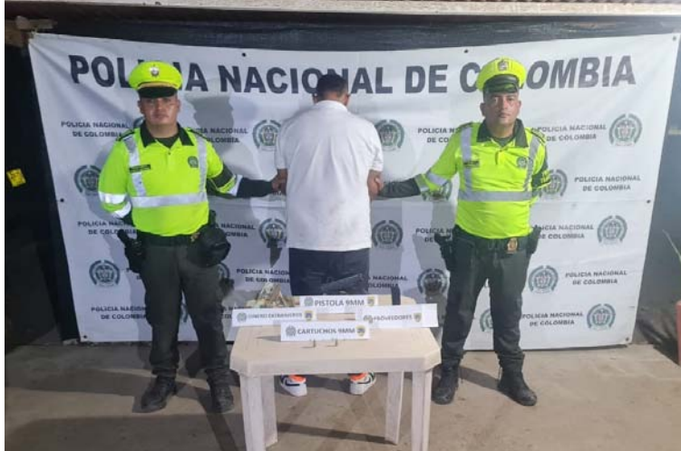
La Policía detuvo a un hombre en posesión de una pistola y una suma significativa de dinero en efectivo.

La captura tuvo lugar en la vía que conecta a Paradero con Maicao, gracias a la valiosa colaboración de un ciudadano que alertó sobre la presencia de varios individuos armados descendiendo de un vehículo en el kilómetro 98, quienes ingresaron a