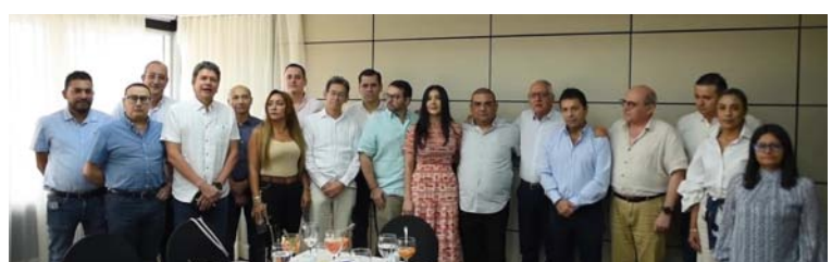
Pidieron hacer un gran pacto por la salud, para que Colombia avance hacia un mejor país en esta materia.

* Submercado Principal lo conforma los municipios de: Riohacha, Barrancas, El Molino, Fonseca, Hatonuevo, Maicao, Manaure, San Juan del Cesar, Uribia, Urumita y Villanueva.