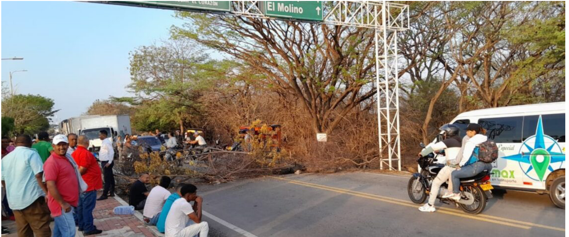
Los cincuenta bloqueos de este año tienen a los guajiros jugando la partida de dominó gubernamental con el doble seis ahorcado.

En una recreación plausible del canto poético