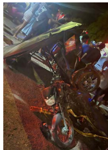
En la colisión entre los dos vehículos, el conductor y dos pasajeros resultaron con lesiones de consideración.

Revelaron además según las indagaciones, que el accidente se produjo por fallas mecánicas al momento de transitar por este importante corredor vial donde una de las llantas se estalló provocando el volcamiento del vehículo, el cual se salió del carril y fue a parar al otro costado de la vía, expulsando a varios de sus ocupantes.