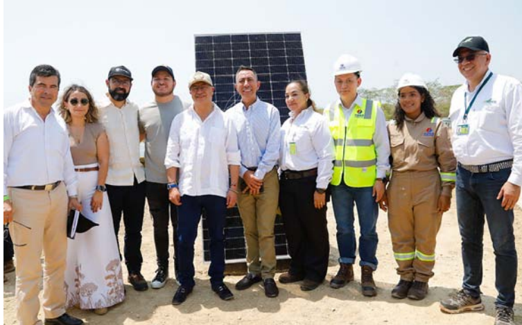
Estuvieron el presidente Gustavo Petro; presidente de Ecopetrol, Ricardo Roa; y el MinMinas, Andrés Camacho.

El eoparque contribuye a la reducción de emisiones