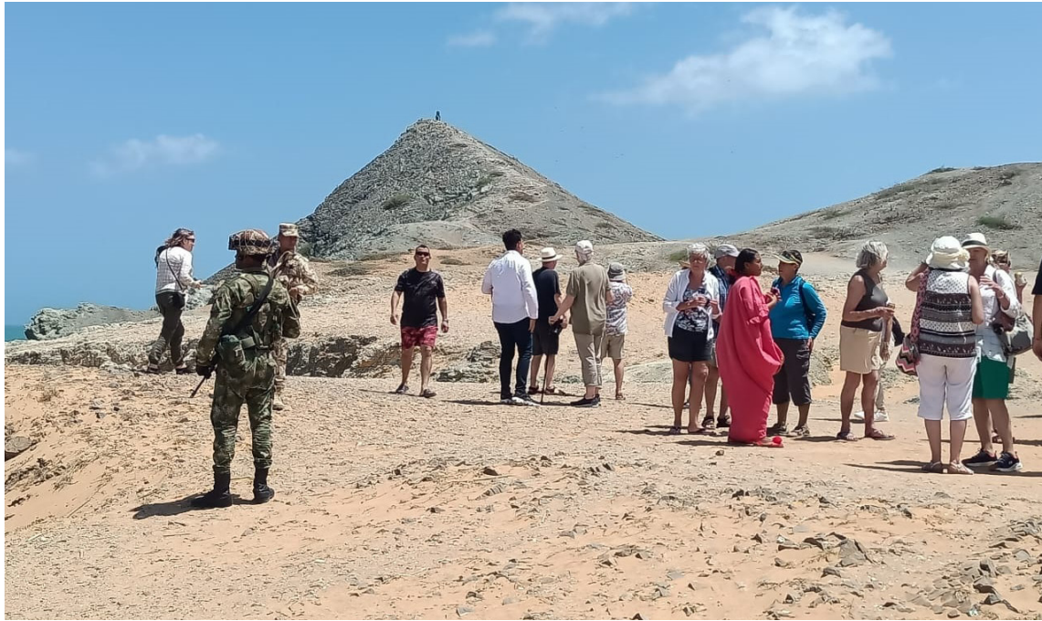
Si las empresas se van los municipios que nacieron por regalías, volverían a ser corregimientos.

Del mismo modo parece que en La Guajira se hubiera derogado el inciso final del artículo 2° también superior que nos dice que “Las autoridades de La República están instituidas para proteger a todas las personas residentes en Colombia en su vida, honra y bienes, creencias y demás derechos y libertades...” los promotores de los bloqueos ya inclusive los anuncian con anterioridad para que los inermes ciudadanos y