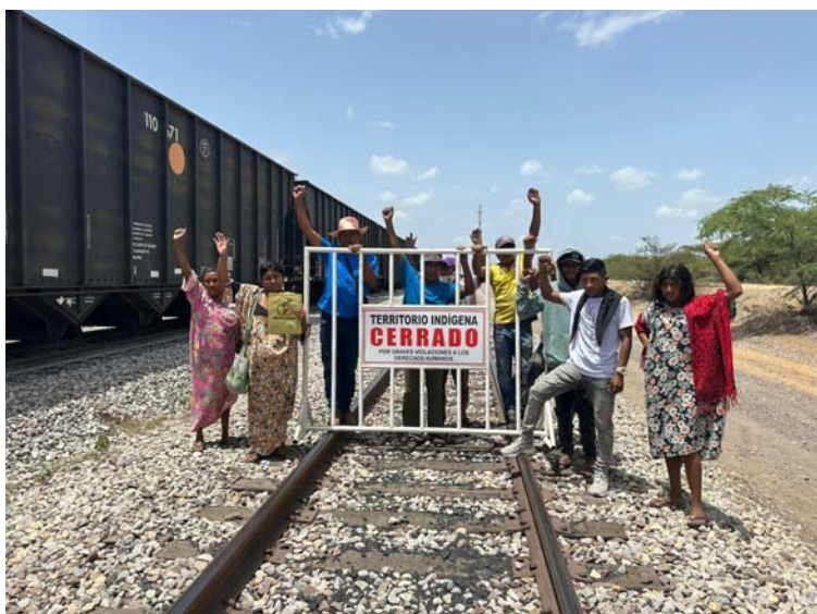
Los promotores de bloqueos los anuncian con anterioridad para que los ciudadanos y autoridades estén notificados.