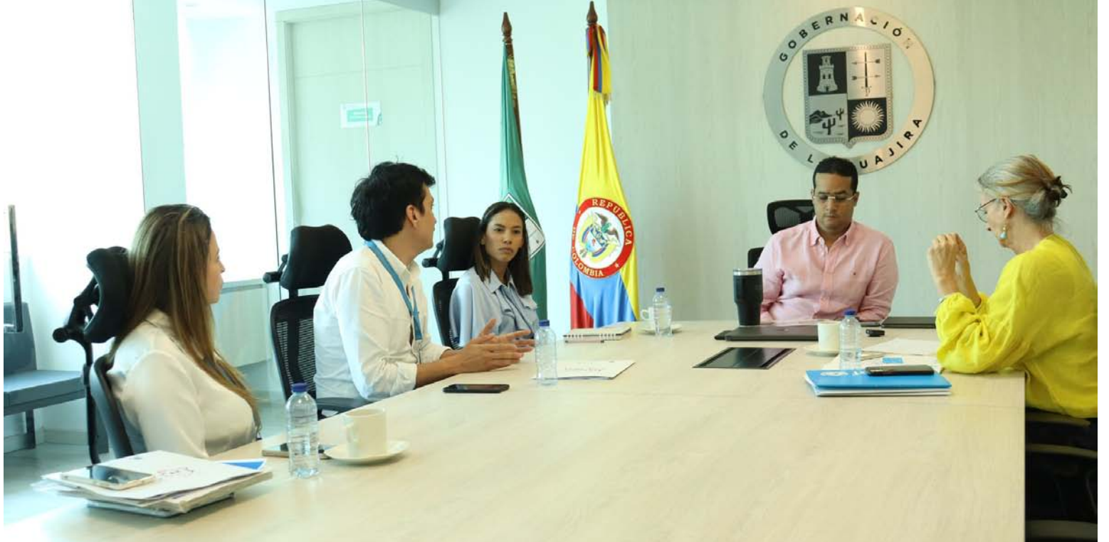
El mandatario Jairo Aguilar Deluque, reiteró que toda la política de su administración está volcada al tema de infancia.

El mandatario de los guajiros, Jairo Aguilar Deluque, sostuvo que también se trabajará de manera articulada con el Instituto Colombiano de Bienestar Fa-