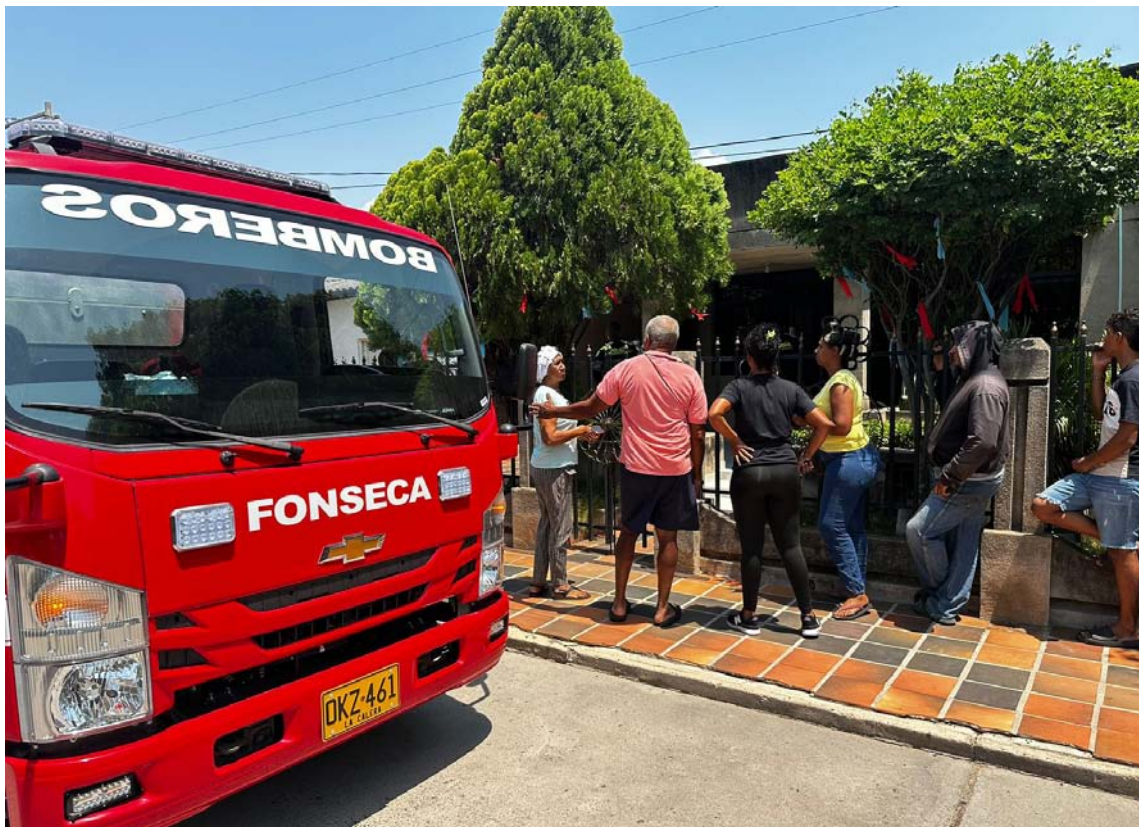
Los bomberos acudieron al lugar ante la alerta sobre humo proveniente de una vivienda.

Miembros del Cuerpo de Bomberos de Fonseca atendieron la emergencia de un incendio estructural el cual fue reportado por vecinos de la calle 14 con carrera 22 del barrio Alto Prado de ese municipio.