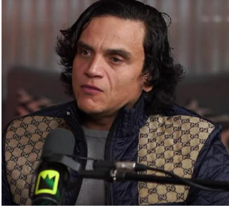
Silvestre confirmó en sus redes la muerte de su abuela.

Manifestó su profundo pesar con este mensaje y un emotivo fragmento del video de su canción