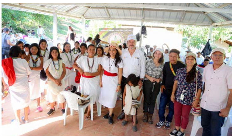
Más de diez mil miembros de comunidades indígenas wiwa de la Sierra Nevada de Santa Marta integran el territorio.