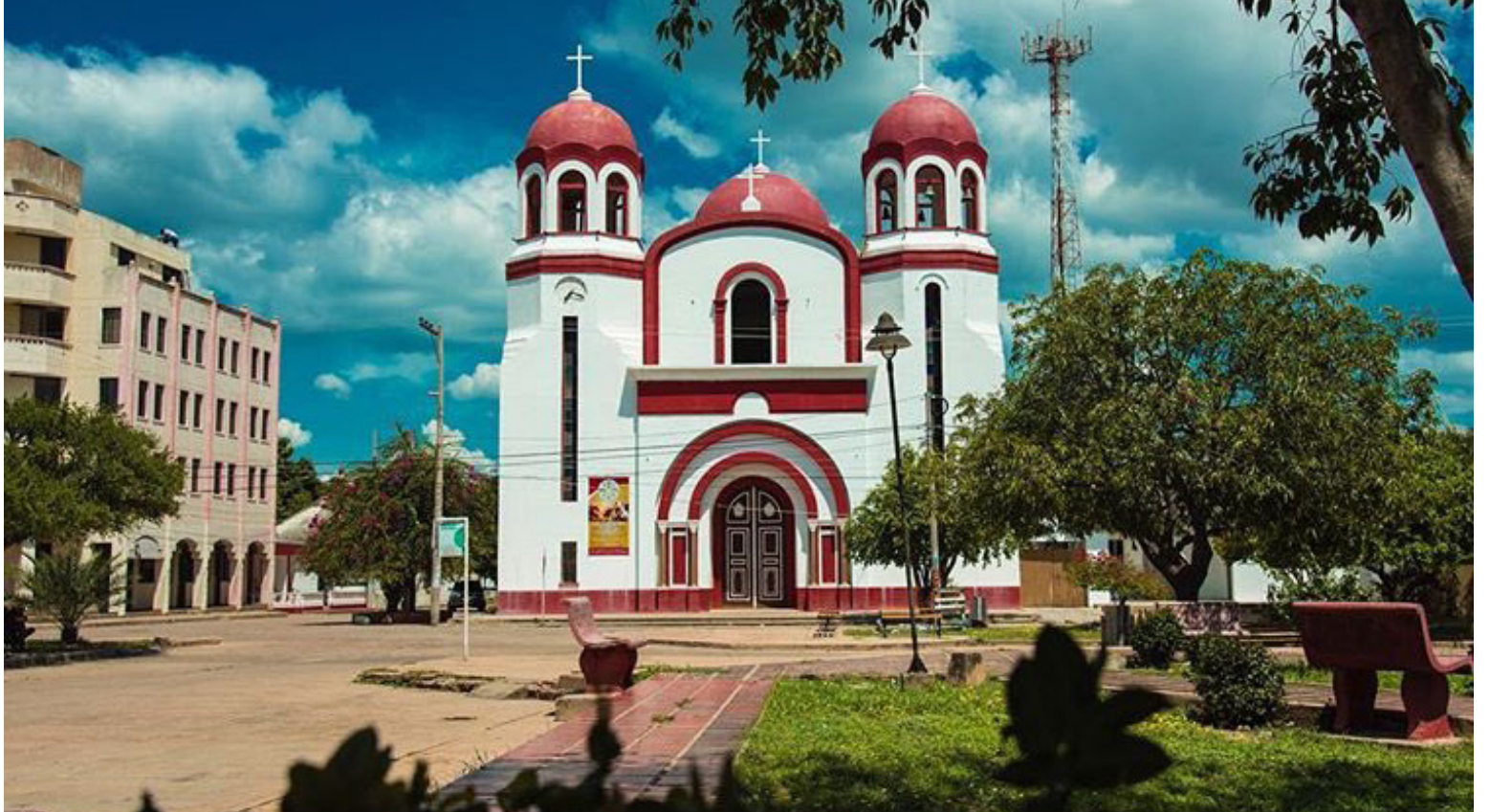
El territorio sanjuanero, bañado por los hermosos valles de los ríos Ranchería y Cesar, representa un oasis de vida.

Esta combinación armoniosa de los recursos