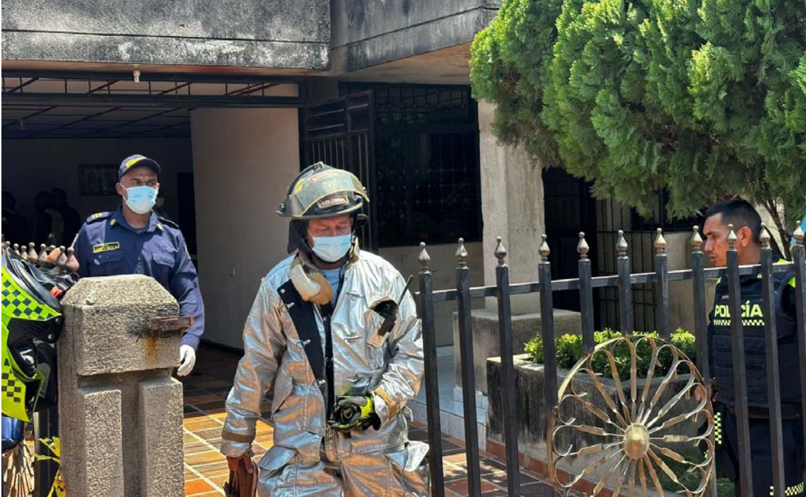
Según explica el Cuerpo de Bomberos, el incendio se generó en la habitación principal.