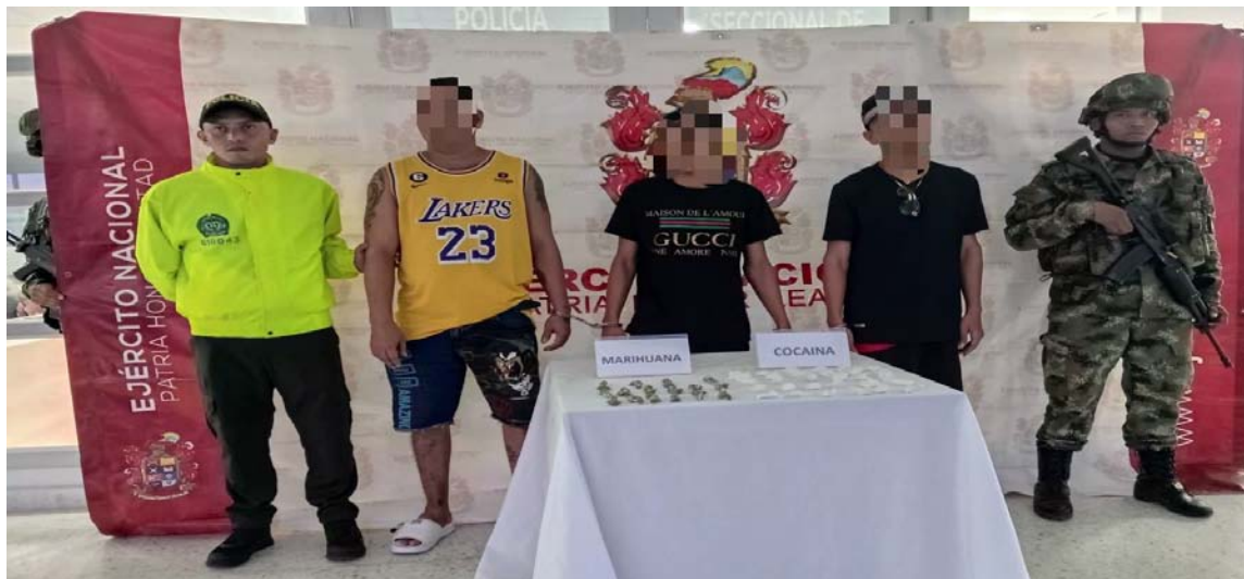
Los sujetos tenían la intención de controlar el microtráfico en el municipio y enfocar sus actividades delictivas a la venta de sustancias psicoactivas.

En Chimichagua, las tropas ubicaron un depósito ilegal con dos armas cortas y 10 cartuchos de diferente calibre que serían utilizadas, por la delincuencia común para intimidar a la población.