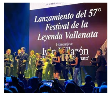
En los próximos días anunciarán las canciones.

Respecto a las canciones que serán seleccionadas entre las 259 inscritas, la Fundación Festival de la Leyenda Vallenata indica que en los próximos días estarán haciendo el respectivo anuncio, luego de cumplido el trabajo por el jurado que tendrá esa misión.