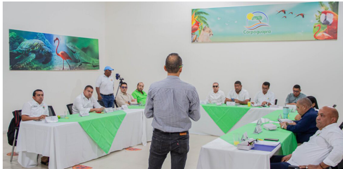
Los mandatarios pueden implementar programas y proyectos contenidos en el documento.

Para la formulación se contó con la orientación del Ministerio de Ambiente a través de la Dirección General de Cambio Climático y Gestión del Riesgo (Dgccgr) y de Corpoguajira.