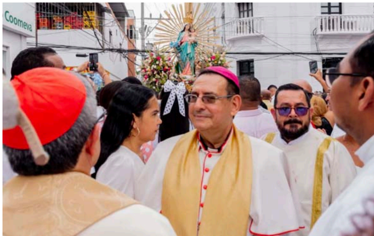
El jerarca católico respaldó las protestas que en el Caribe se vienen realizando para buscar una rebaja de las tarifas.

“Después de esa marcha no ha pasado nada a favor de los usuarios; la situación es peor, el kilovatio de energía se disparó de una manera escandalosa, el servicio del agua no es el mejor, el alumbrado público deja mucho que desear, la reco-