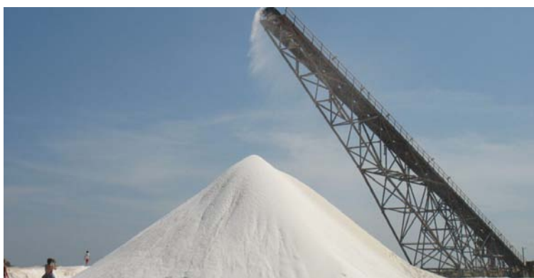
La maldición para Manaure ha sido que Dios lo premió con las minas de sal, esa vaina salió al pueblo.

las autoridades estemos notificados que para esa fecha no seremos libres, que allí mandarían ellos y no el gobierno; que el disfrute del derecho al uso y goce de las vías públicas que es un derecho colectivo a la luz del artículo 4° de la Ley 472 de 1998 se suspenderá porque a ellos les da la gana, lo que constituye una arbitrariedad monstruosa respecto de la cual nadie hace nada, porque lo pertinente es la movilización de todas las autoridades para impedirlo, para proteger los derechos fundamentales de quienes no tenemos velas en el entierro, pero no lo hacen incurriendo en omisión grave de sus funciones lo cual