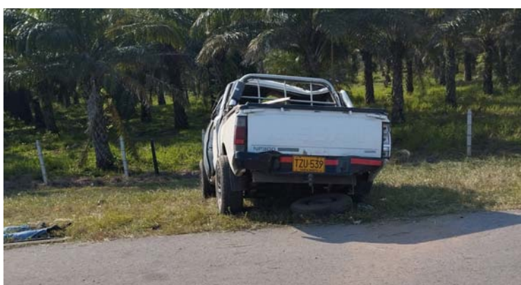
El accidente se produjo al momento de transitar por este importante corredor vial donde una de las llantas se estalló.