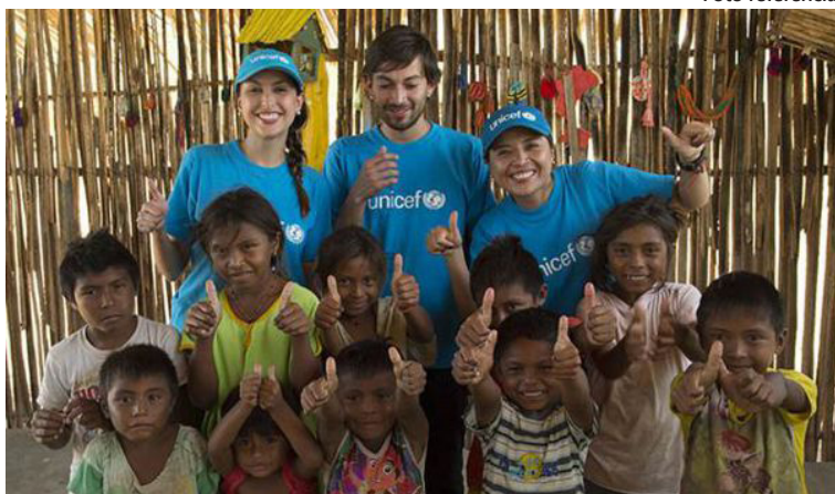
Se trabaja en políticas públicas para mitigar y mejorar las condiciones de los niños, niñas, jóvenes y adolescentes.

miliar, Icbf, sobre algunas situaciones como el de los niños que se ubican sobre las vías, en un proyecto que viene de la administración anterior al cual se le hicieron algunos ajustes.