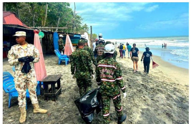
La sinergia entre estas organizaciones permitió la recolección de alrededor de 300 kilos de residuos sólidos.

El Ejército Nacional destacó que continuará entrelazando alianzas para la protección del medio ambiente y el desarrollo sostenible, reiteró que con estas jornadas reafirman su compromiso con la preservación de los recursos naturales y la promoción del turismo ecológico en la Región Caribe colombiana.