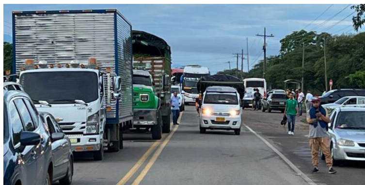
Los líderes deben reconocer que auparse en barricadas para exteriorizar ‘pataletas’ no ha sido la mejor estrategia.