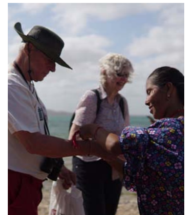
Se registró un aumento en la venta de artesanías

Agregó que es un paso importante para promocionar a La Guajira en el exterior, ofreciendo otras posibilidades de llegar al territorio, en un trabajo conjunto con el Gobierno nacional, el municipio de Uribia e instituciones como la Dimar.