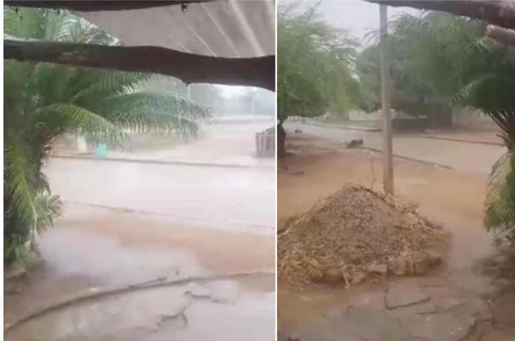
Las precipitaciones se extenderían durante la mañana de este viernes, fin de semana y hasta el próximo lunes.

teorológica que las precipitaciones se extenderían durante la mañana de este viernes, fin de semana y hasta el próximo lunes.