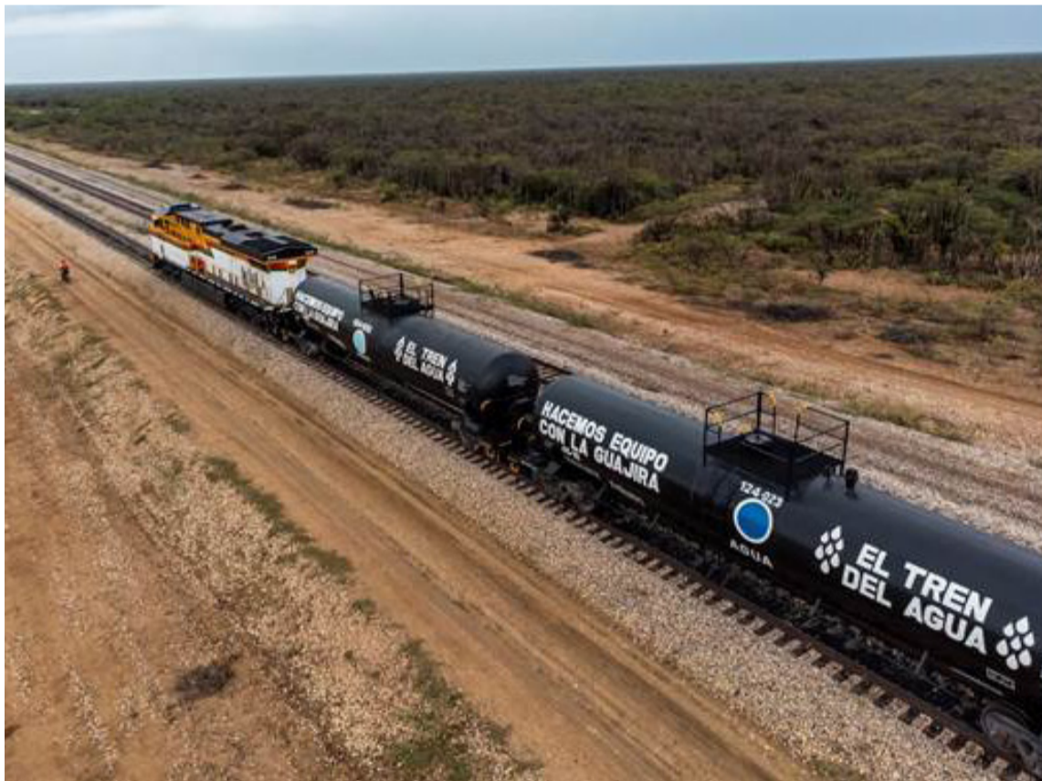
Cerrejón reitera su compromiso para que conjuntamente se den espacios de interlocución.

Cerrejón le recuerda a las comunidades de la zona de operación la importancia de tomar medidas para conservar el agua, ya que la interrupción de sus operaciones les impide mantener el horario regular de entrega del vital líquido.