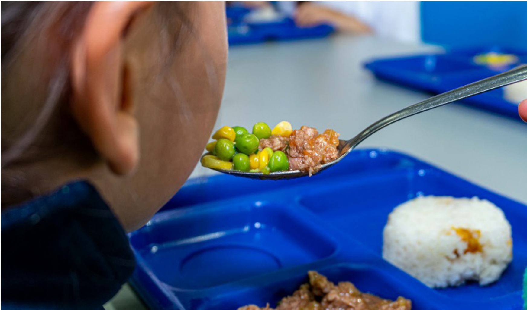
Instamos a todas las autoridades responsables a trabajar mancomunadamente para seguir dando contundentes golpes a estas mafias.

Está en juego la salud de niños y niñas, por ello debe castigarse a los corruptos