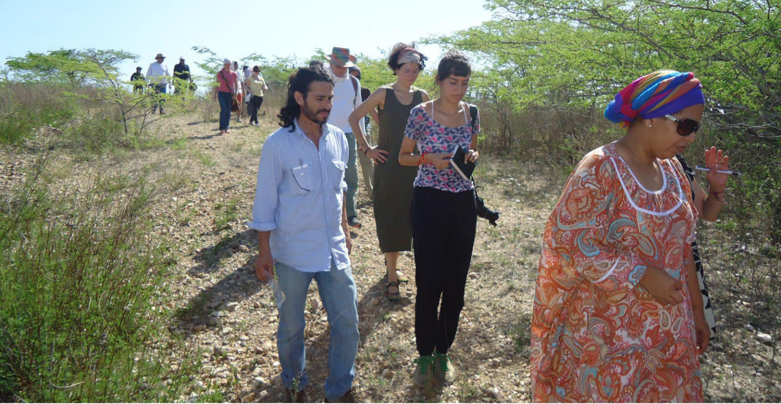
Los eventos asociados a la masacre de Bahía Portete buscaban consolidar el dominio paramilitar sobre la costa Caribe.