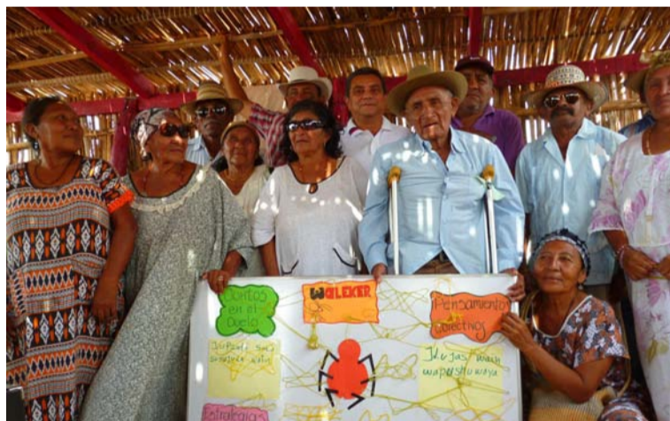
Con el ataque y tortura pública a lideresas mujeres, los paramilitares trasgredieron los códigos de guerra.

consigo enseñanzas y verdades que el tiempo nunca borrará, y vuestra lucha incansable es un recordatorio de la importancia de mantener viva la memoria y seguir trabajando hacia un futuro donde prevalezcan la justicia y la paz. En estos 20 años desde la Masacre de Bahía Portete, vuestra fuerza y compromiso son inspiradores y dignos de reconocimiento.