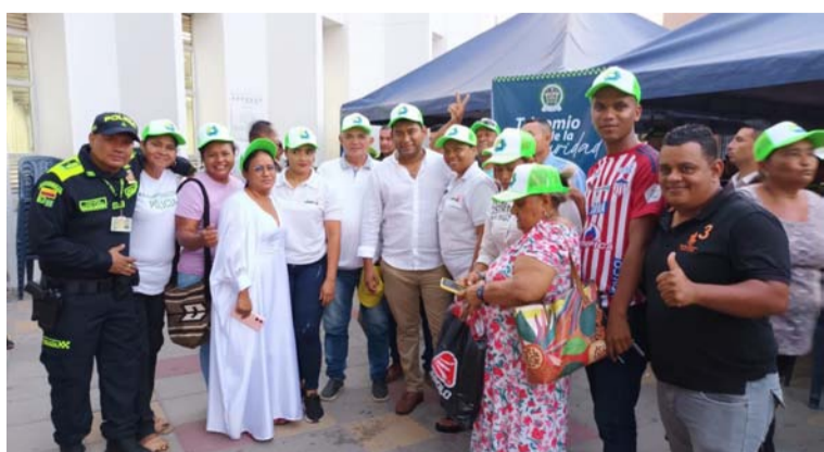
El evento contó con autoridades político-administrativas, líderes comunitarios y medios de comunicación.

Este nuevo modelo de servicio policial representa un avance significativo hacia una mayor seguridad y convivencia en la sociedad guajira. La Policía Nacional reitera su compromiso de colaborar estrechamente con las comunidades para garantizar un entorno seguro y pacífico para todos.