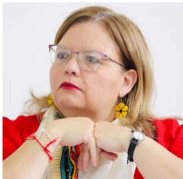
Astrid Cáceres, directora nacional del Icbf.

Reiteró la necesidad del trabajo en equipo con los alcaldes de los municipios accionados por la sentencia.