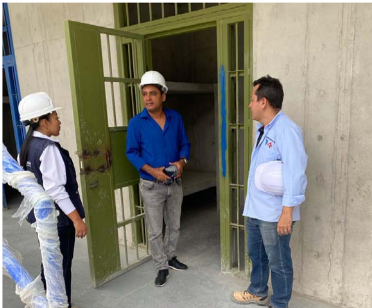
El personero dijo que seguirá como garante e inspeccionando la obra para hacer que el contratista cumpla el contrato.

Expresó que a pesar de las dificultades ya se puede evidenciar que la obra es una realidad para el departamento de La Guajira, donde más de trescientas personas fueron contratadas para trabajar de los