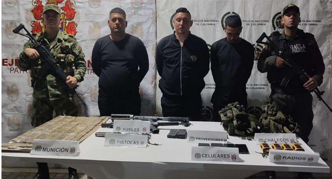
Les incautaron arsenal, equipos de comunicaciones, material de intendencia y un vehículo.

Allí, los uniformados hicieron la señal de pare a un automotor que aceleró