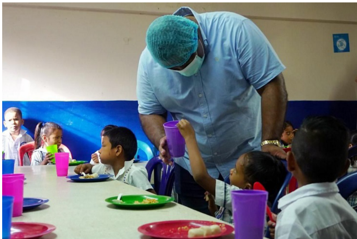
Después de tres meses del inicio de clases, los menores siguen sin recibir sus alimentos.