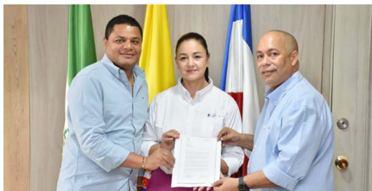
Los mandatarios están conscientes del valor y la importancia que el deporte tiene en la integración de las personas.

Convencidos de que el deporte es el elemento que une a los pueblos, los iguala en la humanidad, en sentimientos de alegría, emociones y paradójicamente en tristezas que se viven y sienten de forma diferente. Los mandatarios están plenamente conscientes del valor y la importancia que el deporte tiene en la integración de las personas y en la promoción de valores como la igualdad, la superación y