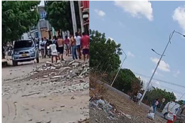
El herido Yeiner Sierra, fue trasladado en una motocicleta hasta un centro asistencial en el municipio de Maicao.

El ataque se registró este martes 16 de abril en un sector de la calle 14 con carrera 1 del barrio Colombia Libre, en el municipio fronterizo de Maicao, en donde según la versión de testigos Sierra Varón se encontraba conversando con una mujer (comadre) cuando fue atacado a bala por el parrillero de la