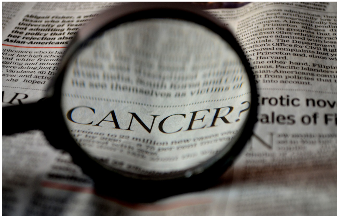
Gobierno deberá actualizar las guías de práctica clínica en un plazo máximo de seis meses.

Por último, se establece que el Gobierno nacional deberá actualizar las guías de práctica clínica en un plazo máximo de seis meses después de la entrada en vigencia de la ley.