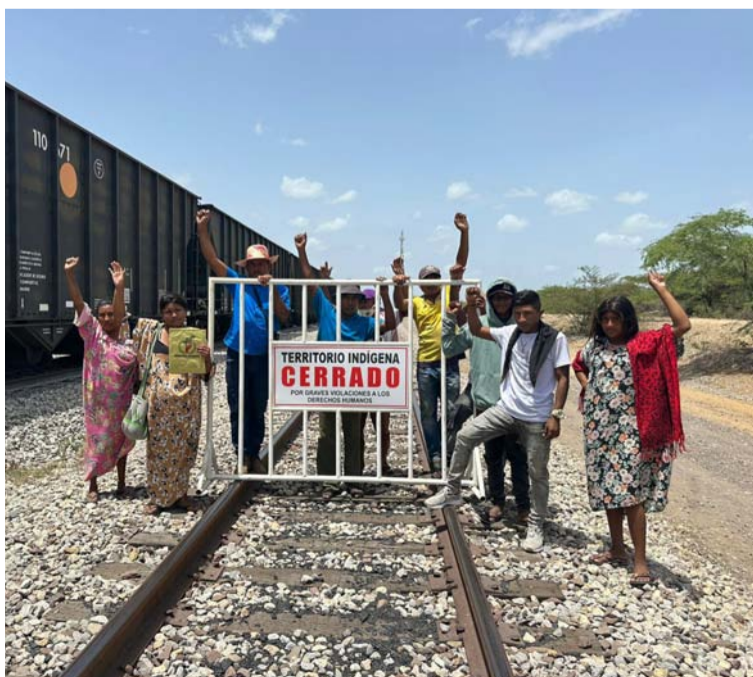
En lo que va de este 2024 se han presentado 73 bloqueos, lo que sigue perjudicando al Departamento y a la empresa.

Precisó que es una situación muy complicada y compleja que sigue causando enormes pérdidas económicas a la multinacional.