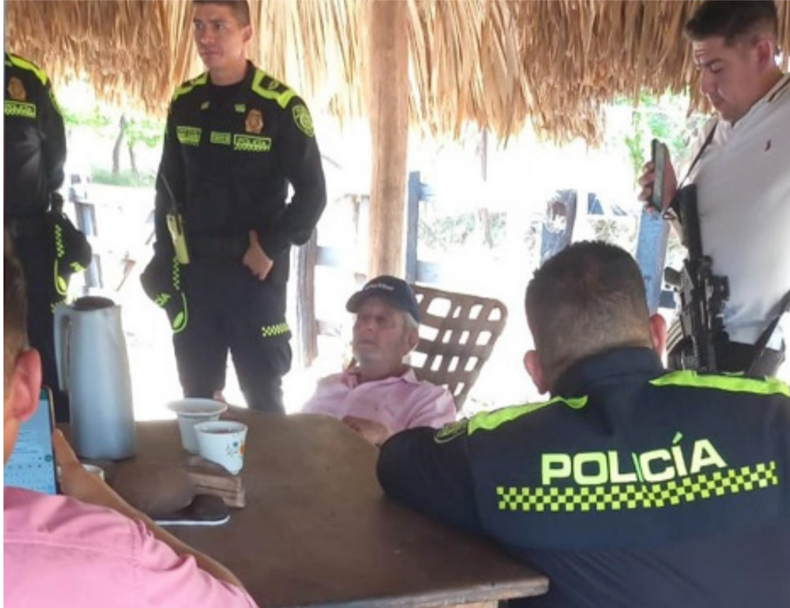
Los secuestradores le pidieron al ganadero que no fuera a hacerse matar y que colaborara.

El ganadero fue dejado abandonado en el sector El