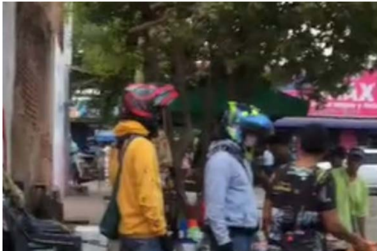
Los cobradores les quitan artículos a los deudores en contra de su voluntad como forma de pago parcial de la deuda.

La situación a la que muchos pobladores se han visto obligados a someterse por falta de oportunidades, se ha tornado en un panorama muy oscuro para la gente del común, al punto de