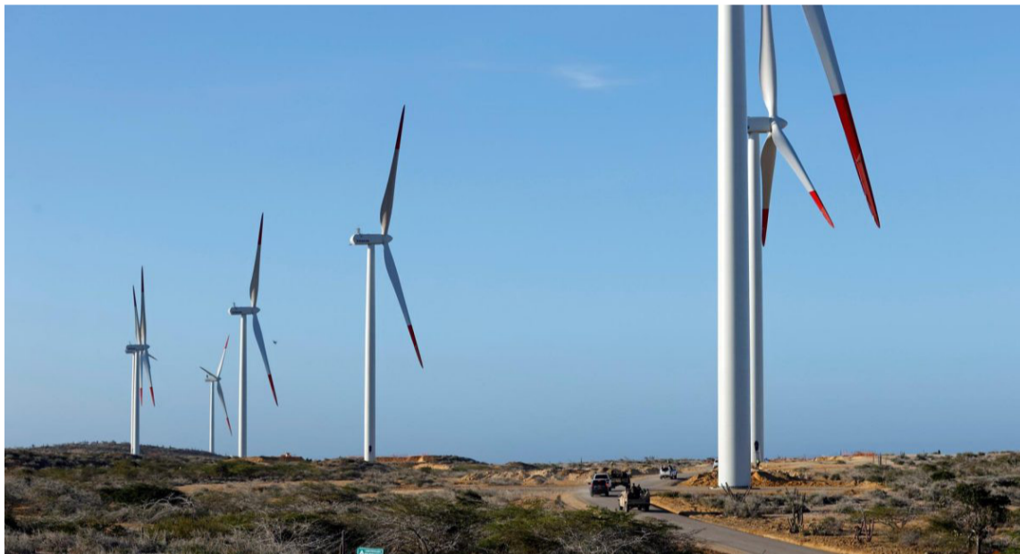
La Guajira norte es un territorio especial para generar energías eólica 365 días del año solar.

La Guajira Norte es un territorio desértico especial, para generar las energías alternativas, eólica 24 horas, 365 días del año solar, 10.7 horas de luz día, du-