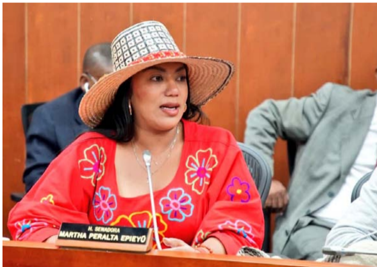
La senadora Martha Peralta se ha mantenido con serenidad y determinación gracias a una excelente ponencia.

do su trámite por el Senado de la República, trabajando de la mano del Ministerio de Trabajo y de Colpensiones, con el objetivo de cons-