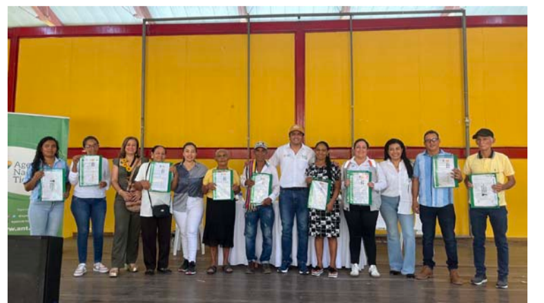
La ANT entregó resoluciones que certifican que estas mujeres y hombres son los propietarios de sus viviendas y tierras.