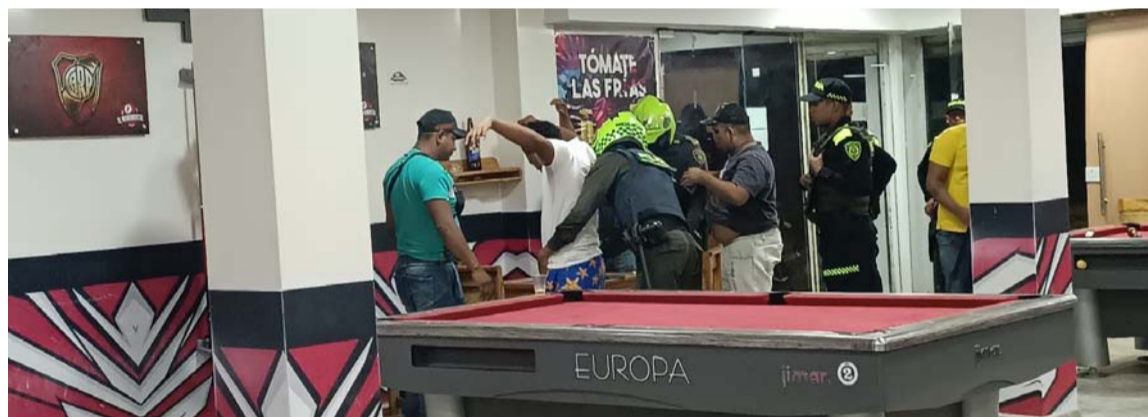
Los operativos se intensificarán con el apoyo de la fuerza pública, el Ejército Nacional y los miembros del Instramd.

Como parte de las acciones de prevención y control en los establecimientos nocturnos abiertos al público, se desarrolló una jornada en varios sectores de alto impacto en la ciudad de Rio-