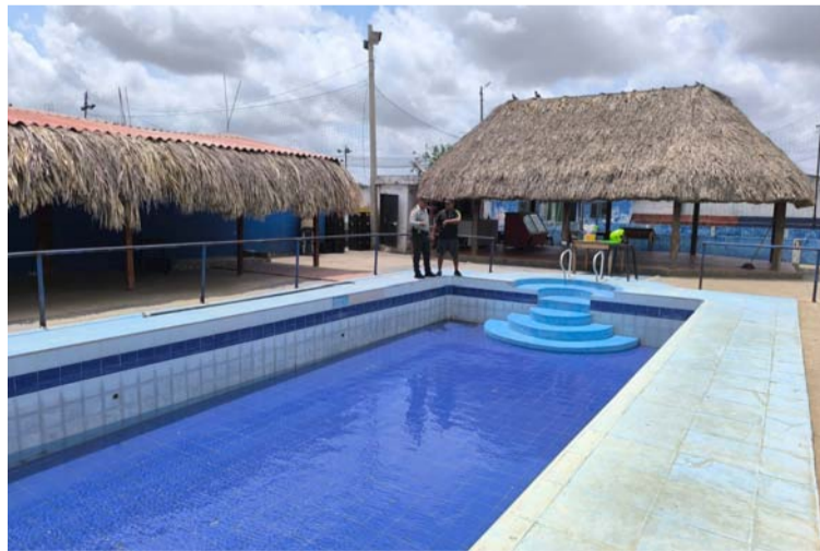
Se verificó el cumplimiento a lo establecido en la ley 1209 de 2008 'ley General de piscinas' para brindar seguridad.

De igual manera, se verificó el cumplimiento a lo establecido en la ley 1209 de 2008 'ley General de piscinas', con el objeto primordial de establecer las normas tendientes a brindar seguridad y adecuar las instalaciones de piscinas que se encuentra en la entidad fronteriza.