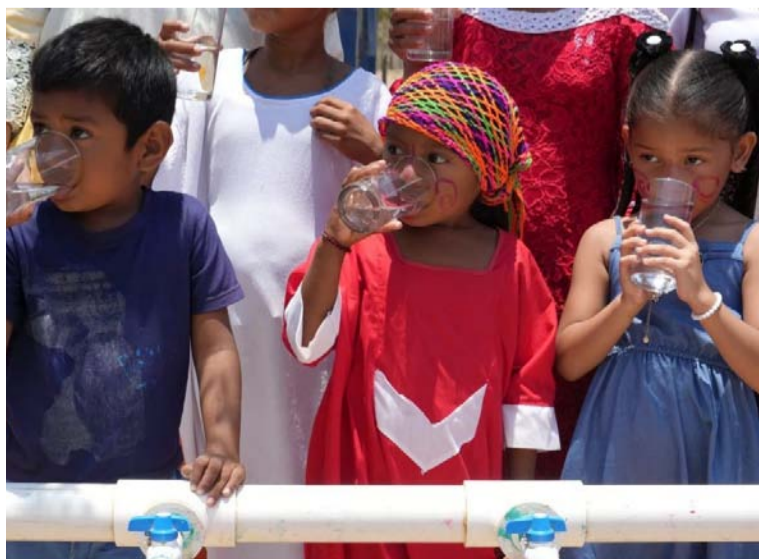
La Ministra Catalina Velasco, aseguró que se busca resolver las problemáticas frente al acceso al agua.

La Guajira hoy es asunto de interés nacional y se evidencia el cambio en las prioridades del país, dijo la Ministra de Vivienda Catalina Velasco, al referirse a la ejecución de rehabilitación de sistemas comunitarios de agua en la península.