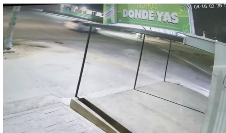
Las personas que se desplazaban en la motocicleta fueron arrolladas por el automóvil en la carrera 7 con calle 17.