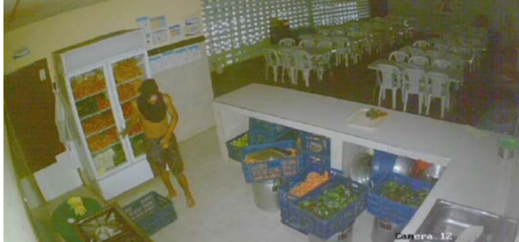
El ladrón de alimentos se toma todo el tiempo para seleccionar los productos que se hurta de las canastas.

En un video de las cámaras de seguridad ubicada en la cocina y comedor del colegio, quedó grabado el accionar del ladrón que