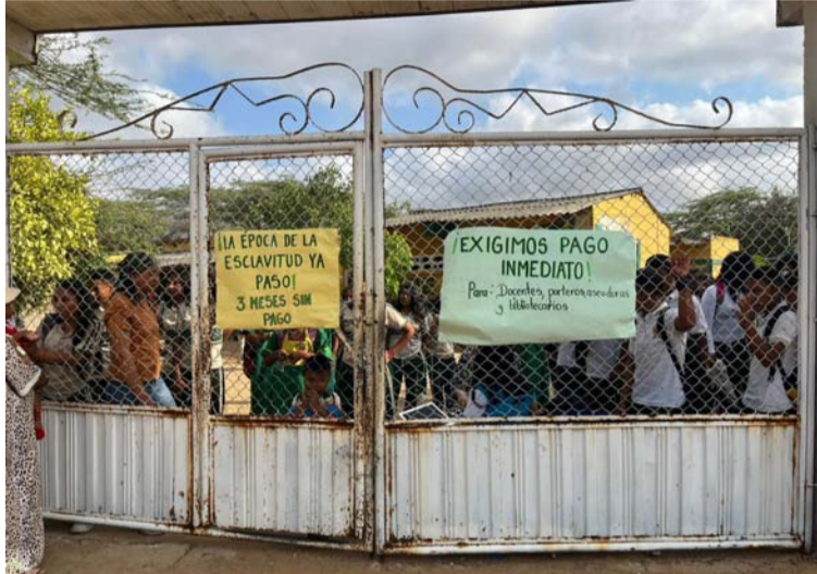
Los docentes y personal de transporte escolar exigen que se les cancelen los tres meses adeudados.

Asimismo, los manifestantes están alegando que al no tener respuesta por parte de la administración municipal de Maicao, se tomarán las vías de hecho bloqueando la carretera de