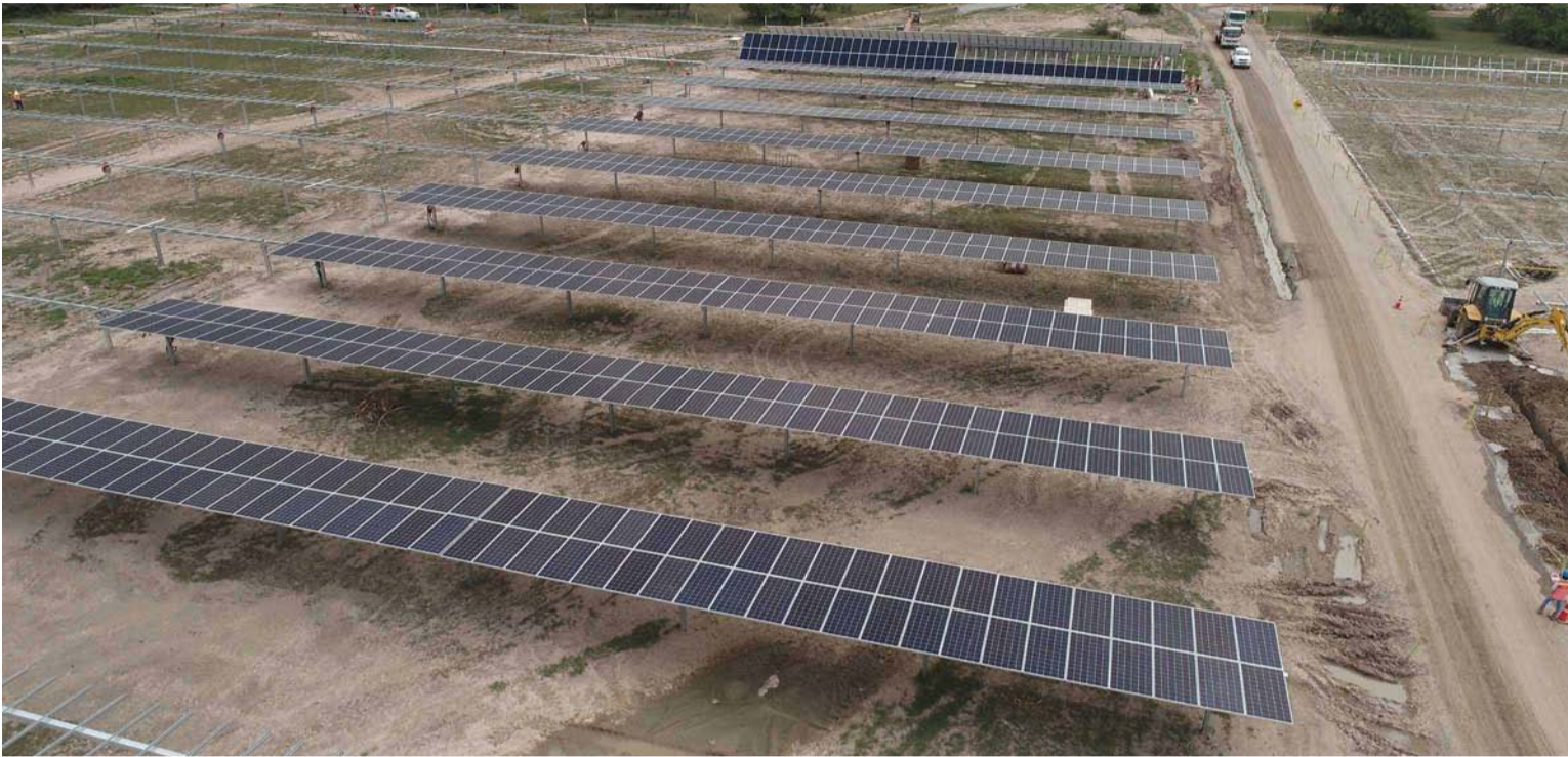
La Guajira, península energética, que de muy poco nos ha servido a nativos, por estar sujeta a un centralismo absorbente.