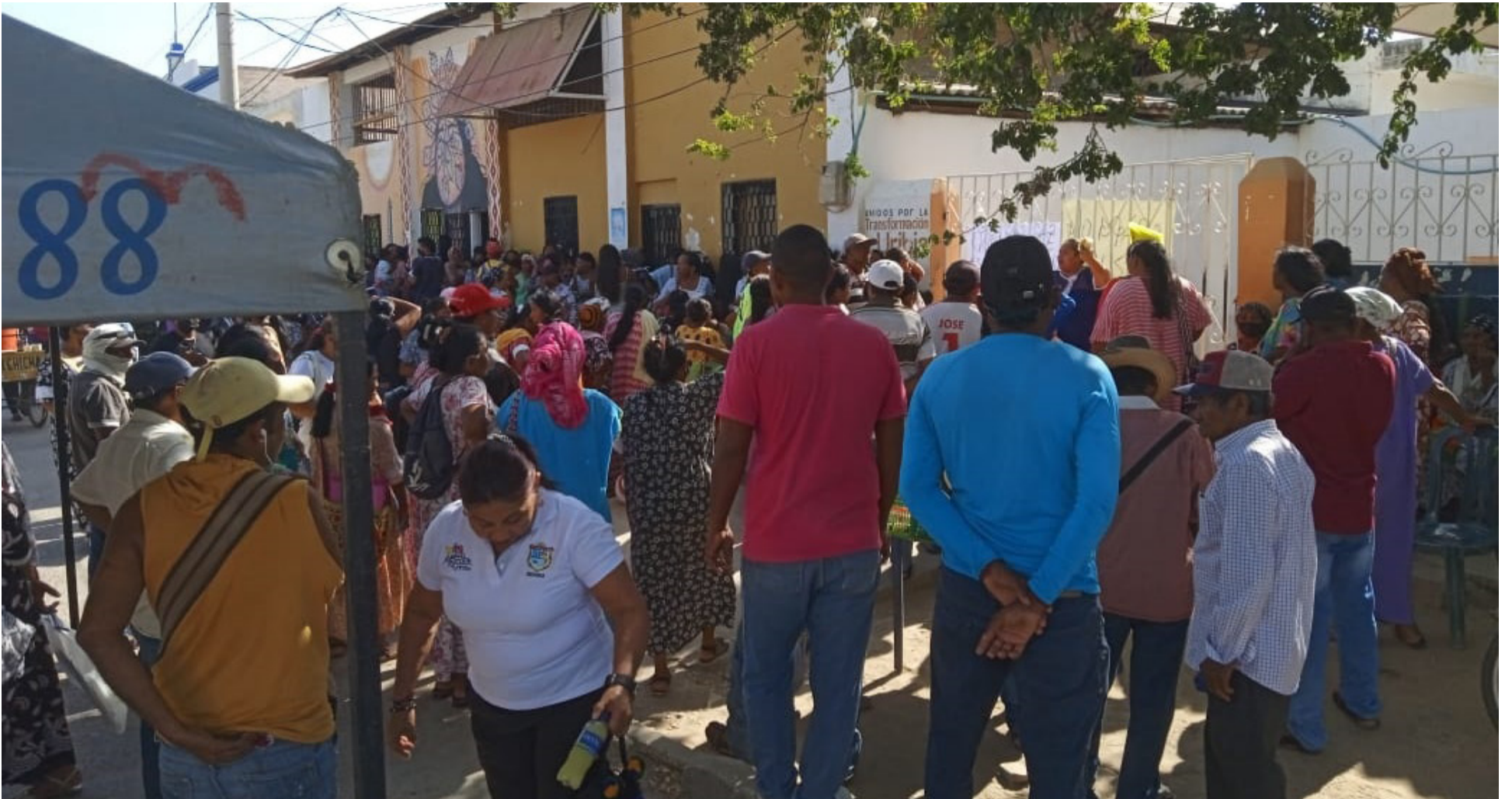
En el Plan Plurianual de Inversión se incluye una proyección para pueblos y comunidades indígenas por un monto de 20 billones de pesos.

Para la formulación de acuerdos se hicieron decenas de encuentros