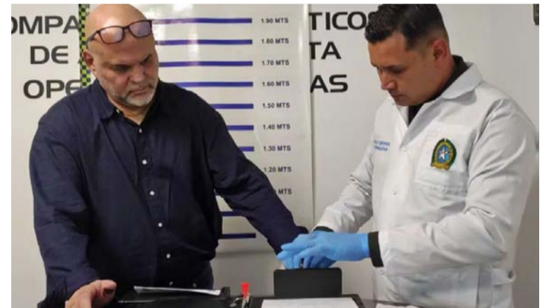
La defensa respondió que Mancuso ha cumplido con todas las obligaciones y requisitos impuestos por la justicia.

“Esta situación de detención ilegal, le está impidiendo llevar a cabo su importante labor humanitaria como gestor de paz. Llamamos a una revisión urgente