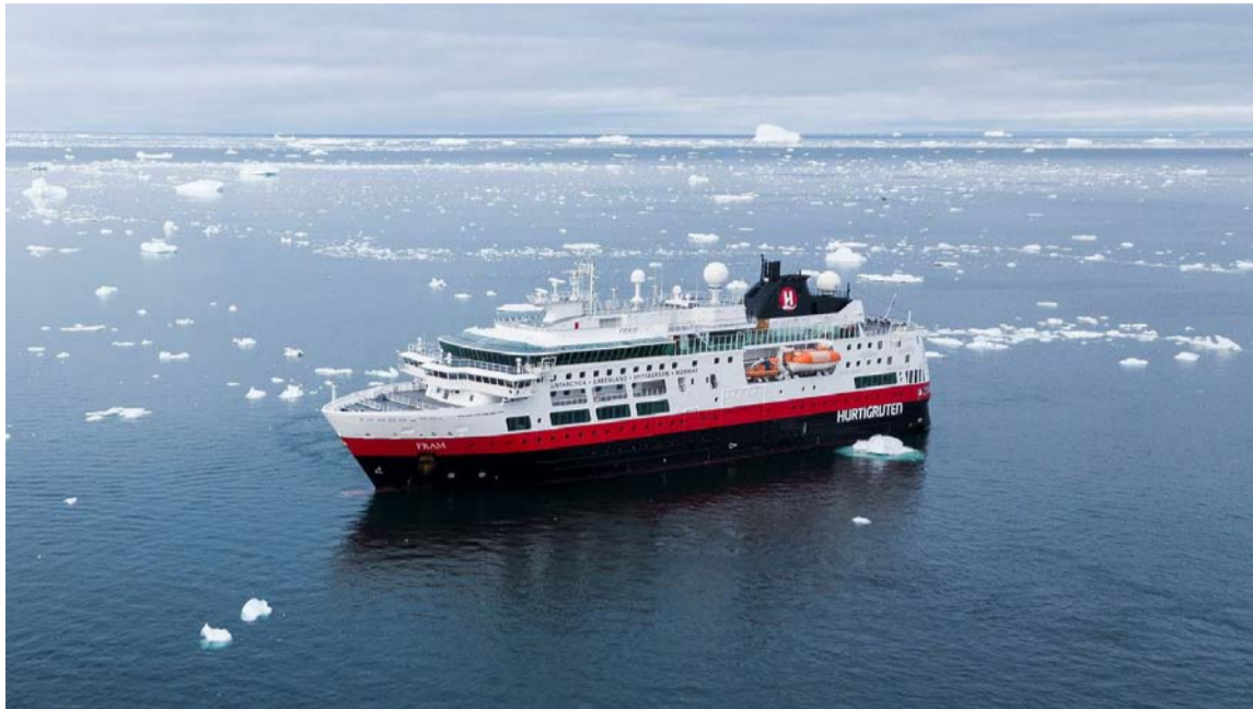
El director de turismo afirmó que la idea es convertir La Guajira como destino emblemático.

La Gobernación, destacó que, con la llegada de este tercer crucero, ratifican que La Guajira se convierte en un destino atractivo para el