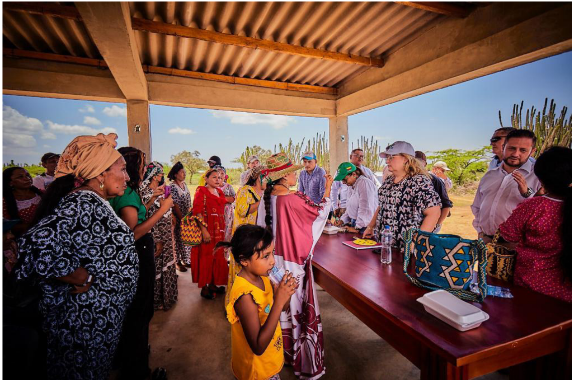
Es crucial que alcaldes y gobernador continúen escuchando las necesidades de la comunidad.