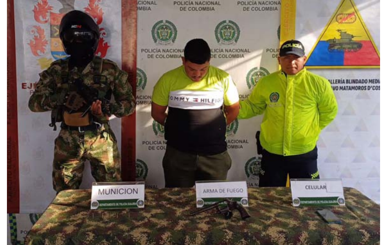
La captura de alias 'Martín' se logró por una orden de allanamiento y registro en la vivienda donde residía.

puesto a disposición de la Fiscalía General de la Nación por el delito de fabricación, porte o tráfico de ar-