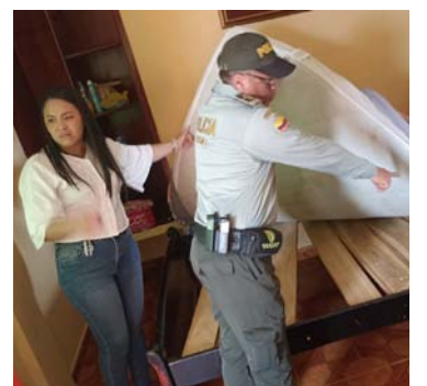
Propietarios deben conocer la normatividad sanitaria.

Asimismo, la Secretaría de Salud municipal como autoridad sanitaria local, ejerció en los establecimientos visitados funciones de rectoría y regulación para emitir conceptos sanitarios con el fin de divulgar la promoción, prevención, tratamiento y control sanitario del ambiente, siendo su principal objetivo el mantener las condiciones higiénico sanitarias básicas, que garanticen el mejoramiento continuo de la salud de la población turística.