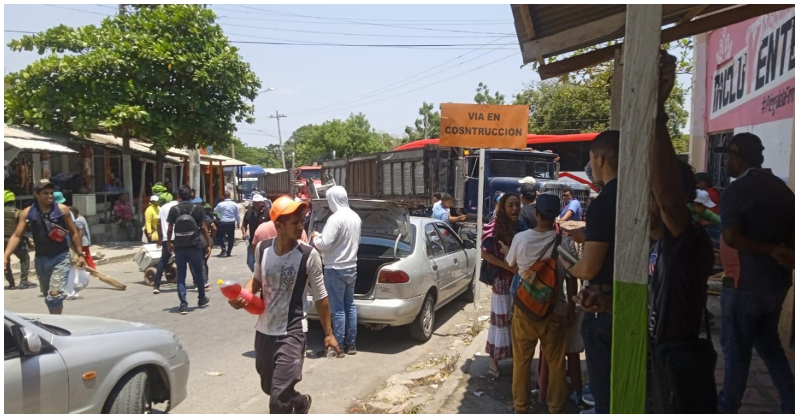
Los conductores no quieren levantar la protesta hasta que se solucione la situación.

Los transportadores de camiones que desde hace dos días no pueden pasar hacia el Sur de La Guajira por la vía Nacional, bloquearon el acceso vial en el casco urbano del corregimiento de Cuestecita en el municipio de Albania, cansados de los constantes bloqueos que hacen las comunidades wayuú.