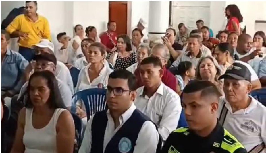
Los asistentes concluyeron que este espacio sirvió como escenario para pasar de las palabras a los hechos; la víctima fue escuchada.

En el marco de la conmemoración del Día Nacional de la Memoria y Solidaridad con las Víctimas, Villanueva fue escenario de paz y reconciliación en honor a las 9 millones de historias del país, evento que permitió saludar víctimas del conflicto armado, reiterando el apoyo y solidaridad.