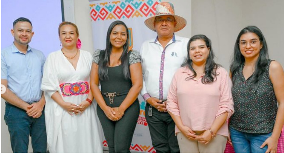
Se destacó la importancia de abordar las enfermedades como el dengue, chikunguña y zika.