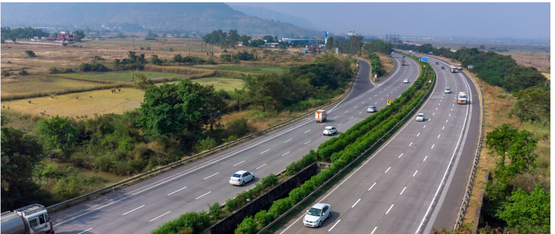
El objetivo de la propuesta y que acogió muy bien el gobernador de Antioquia, es la terminación de obras inconclusas, relacionadas con las vías 4G.

La 'Vaca' traga billete, para cagar concreto y utilizarlo, en terminaciones de las diferentes vías que circulan por Antioquia, quedaron eclipsadas con la intervención de Sanita y Nueva EPS.