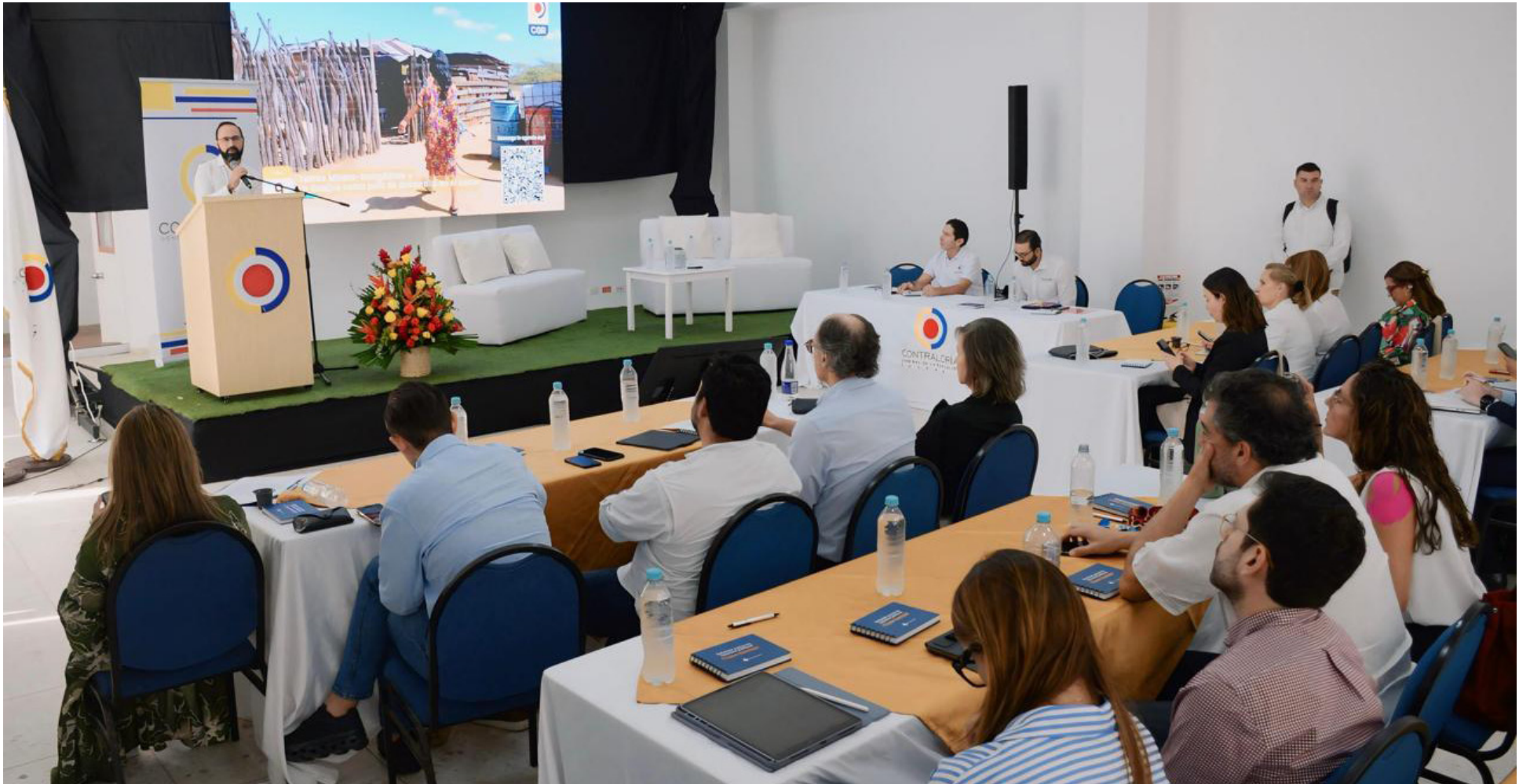
Zuluaga recordó los billonarios ingresos que le proporciona al país la explotación de hidrocarburos y los recursos de regalías al presupuesto de la Nación.

En el diálogo interinstitucional en La Guajira