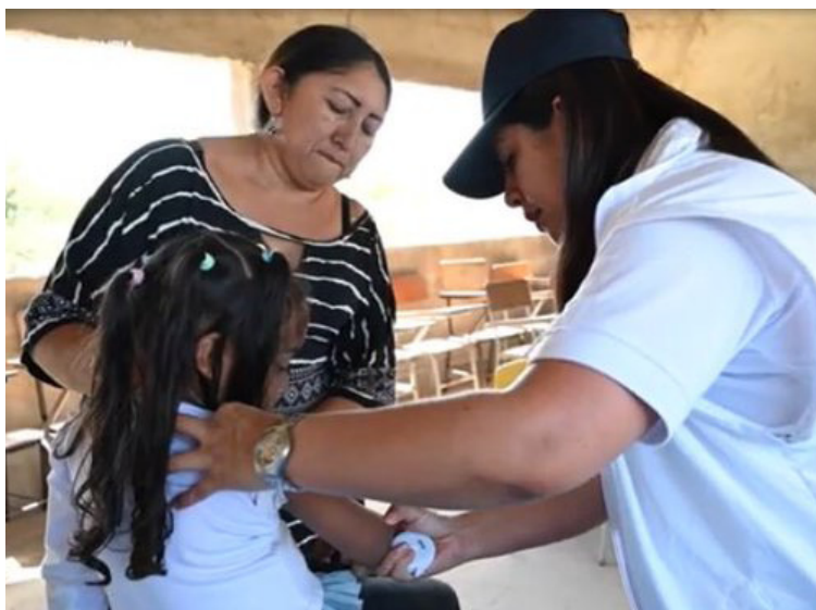
Se deben implementar políticas efectivas para mejorar el acceso a una atención médica de calidad.

mar los órganos de control y judiciales.