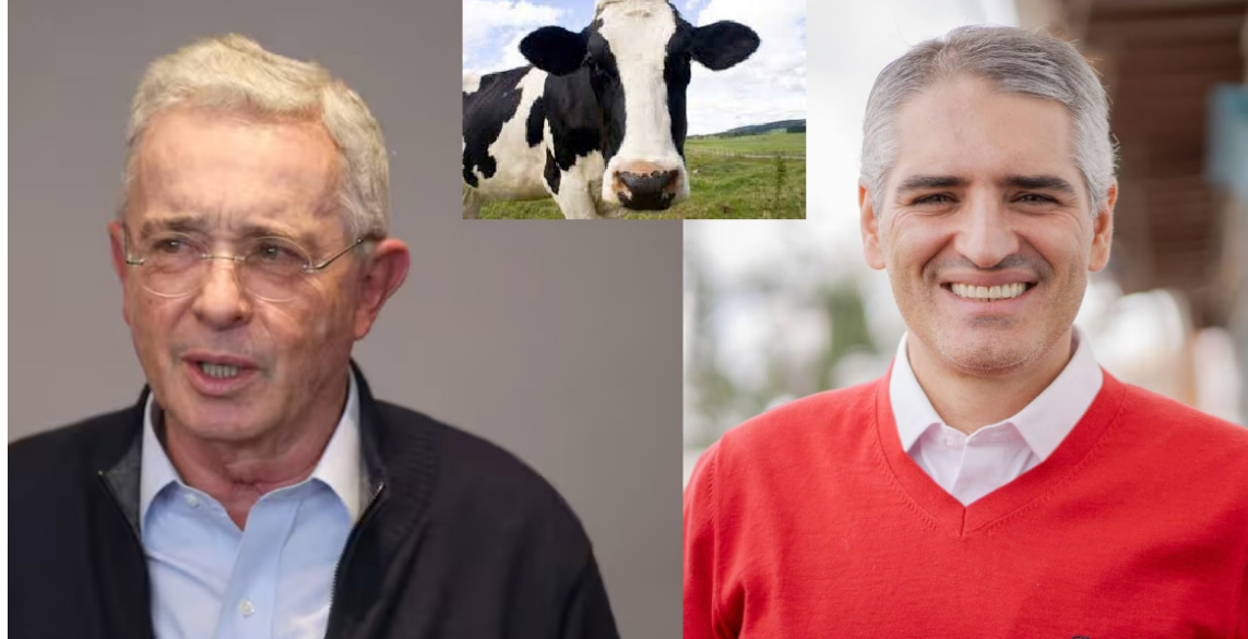
El presidente Uribe no desaprovechó oportunidad para lanzar la propuesta de una 'vaca'.

Las 'Vacas' cooperativas, contributivas y donativas, no es nada nuevo y ha sido copiada por el Estado, para transformarla en impuestos, de obligatorio cumplimiento, entre quienes disponían de: bienes, patrimonio y la rentabilidad; originadas de explotaciones