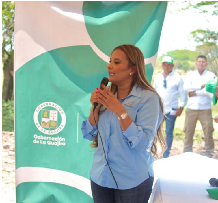
Con una inversión de casi 2 mil 500 millones de pesos este proyecto mejorará las condiciones del servicio en El Molino.

ción departamental con El Molino. Desde Esepgua el departamento continuará trabajando incansablemente por llevar agua potable y saneamiento básico a toda La Guajira.