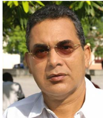
Hernando Deluque Freyle, exgobernador de La Guajira.

La situación tiene que ver con la celebración del convenio 050 de 2000 donde el Gobierno Nacional, el Departamento de La Guajira y el Municipio de Maicao convinieron unir esfuerzos financieros para lograr la "optimización del sistema de acueducto y alcantarillado de Maicao". Se acordó