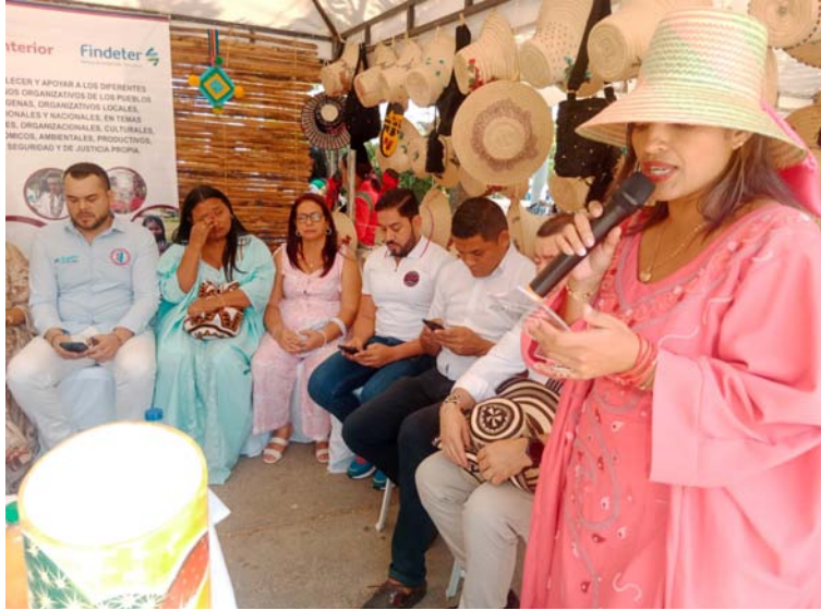
Se presentaron 10 muestras artesanales en la Jornada de Apoyo al Emprendimiento de Mujeres Artesanas Indígenas.