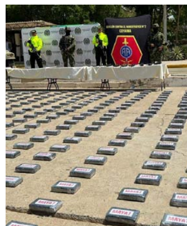
El alijo fue trasladado desde el Catatumbo.

a gestarse tras un reciente cruce de información entre la Policía Nacional de Colombia con el FBI de Estados Unidos, que permitió efectuar una serie de labores de valoración y verificaciones previas por parte de un grupo especial de la Dijín. Con base en los resultados de las vigilancias secretas se coordinó una operación de asalto aéreo