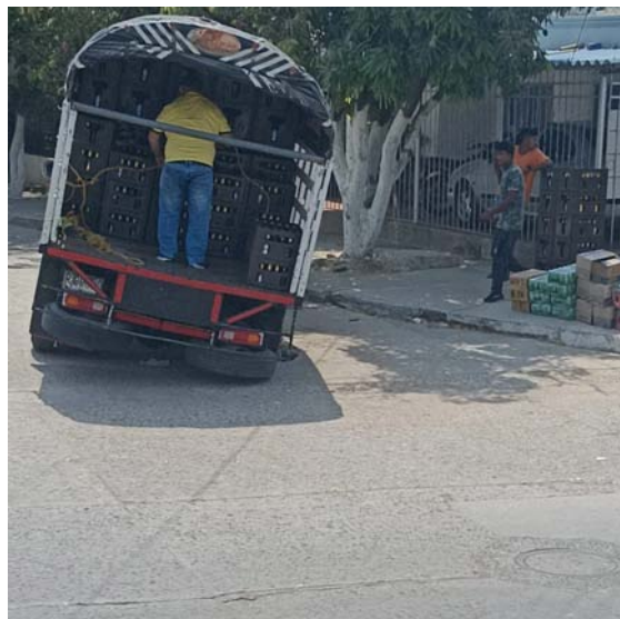
El vandalismo ocasionado por desadaptados ha provocado varios accidentes en el sector.

Este hueco se encuentra entre la carrera 7H con calle 38 del barrio La Esperanza, en Riohacha, en donde la falta de atención por parte de las autoridades no ha permitido solucionar la problemática que ha generado malestar a los conductores afectados.