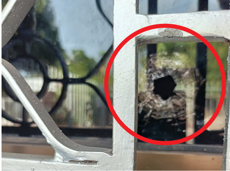
Cinco proyectiles impactaron en la pared y en la ventana, a pocos metros de donde dormía la mamá del expolicía.

“Fue horrible luego de escuchar las detonaciones, fueron cinco proyectiles que impactaron en la pared y en la ventana lo cual uno de