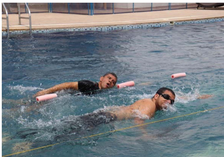
Durante las justas de la fase municipal se definieron los nombres de los maestros que pasaron a la fase departamental.

Las instalaciones de la Universidad de La Guajira, la Institución Educativa Helion Pinedo Ríos, el Centro Vacacional Anas Mai, el estadio Federico Serrano Soto y el billar Francés en Riohacha, se llevó a cabo la fase municipal del Ente Territorial La Guajira para juegos individuales para llegar a participar en los Juegos del Magisterio y el Encuentro Folclórico y Cultural 2024.