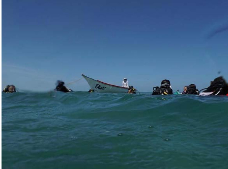
La Dimar informó que en las próximas 72 horas, se prevé un progresivo fortalecimiento del sistema de alta presión.

Es así que la Dimar recomienda al gremio marítimo y a la comunidad en general, extremar las medidas de seguridad en el desarro-