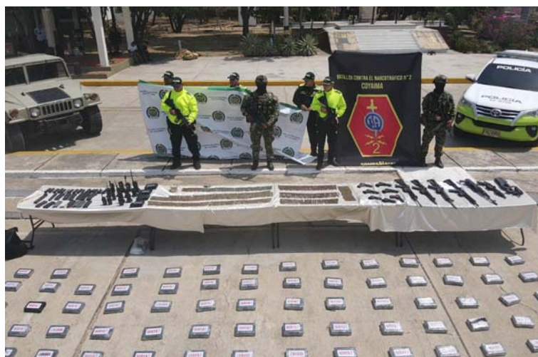
Explicó Mindefensa que esta incautación se efectuó en la zona del Cerro de La Teta, en límites con Venezuela.

Hasta el momento no se conocen mayores detalles de este golpe contra las bandas criminales dedicadas al narcotráfico, sin embargo, se estableció que esta incautación se efectuó en la zona del Cerro de La Teta, en límites con Venezuela.