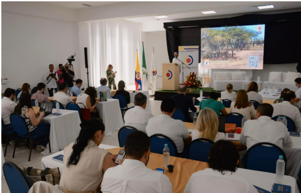
Las reflexiones se dieron en la mesa de diálogo que convocó la Contraloría General.

“Hay una verdad incómoda: 80 billones el hueco que dejó el Gobierno anterior al Fondo de Estabilización de Combustible y 100 billones es el plan de Ecopetrol a 4 años. Hemos trabajado en subsidiar el combustible de los colombianos”, expresó el presidente de Ecopetrol, Ricardo Roa Barragán.