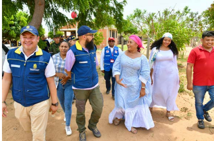
El director de la Ungrd dijo que no volverán a fallar, ni a La Guajira, ni a ninguno que necesite de la entidad.

Asimismo, señaló: “estoy aquí en representación del presidente de la República; soy designado por él y le rindo cuentas directamente