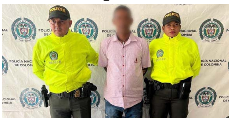
Se logró la captura en flagrancia de este sujeto en el corregimiento de los Ponderos, municipio de San Juan del César.

En la acción policial se incautaron cinco cartuchos calibre 16, evidencia crucial en la lucha contra la fabricación, tráfico, porte o tenencia ilegal de armas de fuego en San Juan del Cesar.