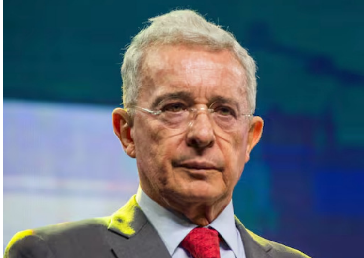
La decisión del fiscal contra Uribe fue adoptada luego de dos solicitudes de preclusión de fiscales diferentes.

También se indica que una vez el Centro de Servicios Judiciales del Complejo Judicial de Paloquehao de Bogotá cumpla con el reparto y se conozca el juzgado penal del circuito al que le corresponda el juicio, se realizará la audiencia de formalización de la acusación, en la fecha y hora que fije la judicatura.