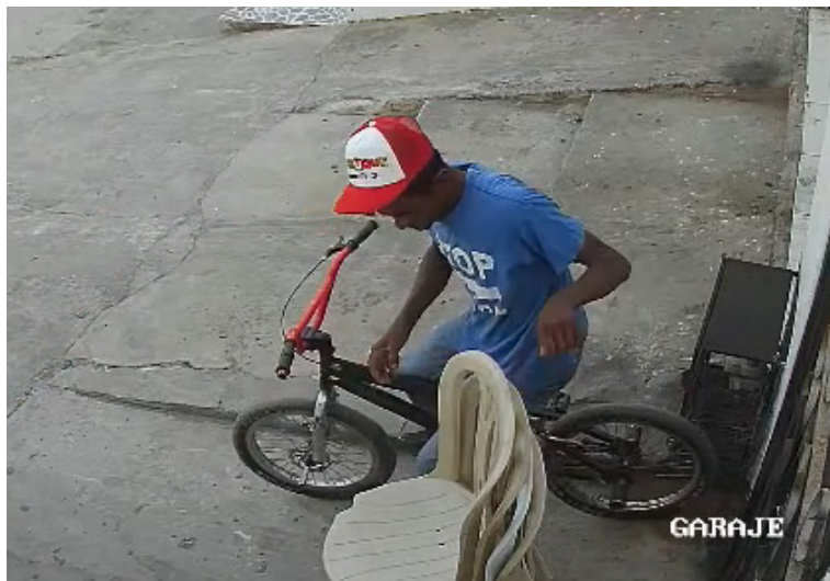
Esta persona la conocen como 'Viejo Rata', quien ingresa a las viviendas a cometer sus ilícitos.

En videos de cámaras de seguridad quedó registrado el momento en que un sujeto aparentemente ingresa a una vivienda y hurta unas