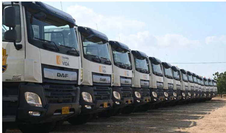
La Contraloría abrió un proceso a exdirectivos de la Ungrd y se determinó la existencia de sobrecostos en el proceso.

sición de los 80 carro-tanques, por parte de la Ungrd, fue de más de $30.750 millones, según la información más reciente. La Contraloría abrió un proceso a exdirectivos de la Ungrd por esta adquisición, y se determinó la existencia de sobrecostos en el proceso, además, se identificó un presunto sobrecosto en la compra de cada uno de los 80 carro-tanques para La Guajira, sin incluir los 20 carros de bomberos; estos hallazgos son preocupantes y resaltan la importancia de garantizar transparencia y responsabilidad en los procesos de adquisición de recursos para el suministro de agua potable en la Alta Guajira. Razón le ha dado la opinión pública al senador Alfredo Deluque Zuleta, al apoyar la denuncia de los carro-tanques para La Guajira y de una recibió amenazas por decir la verdad en todo este desmadre que ha ocupado la prensa nacional, donde El diario El Tiempo fue el medio que, a través de su unidad investigativa, denunció todas estas irregularidades y hasta el reconocido cantante de música vallenata e ídolo na-