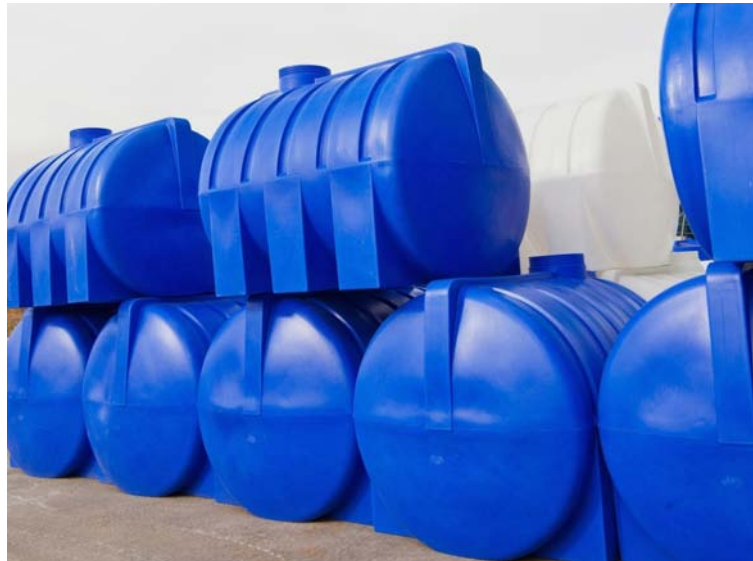
Procuraduría ordenó práctica de pruebas para establecer la ocurrencia de conductas presuntamente irregulares.

La Tercera Delegada para la Contratación Estatal adujo que, según información que dieron a conocer medios de comunicación, el funcionario habría avalado la adquisición de