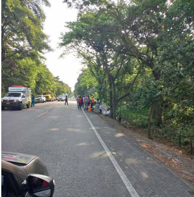
El siniestro vial se registró en el kilómetro 45 de la Troncal del Caribe entre Mingueo y Las Flores, jurisdicción de Dibulla.

El siniestro vial se registró a la altura del kilómetro 45 de la Troncal del Caribe entre los corregimientos de Mingueo y Las Flores en