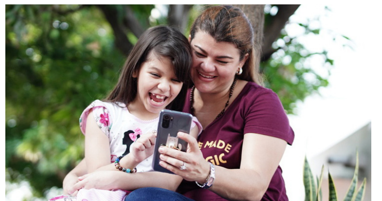
El proyecto es una alianza que realizó el MinTic con Internexa S.A, que busca beneficiar a más de 400.000 hogares.

Para consultar más información pueden dirigirse al sitio web del proyecto https://mintic.gov.co/micrositios/conectividad-para-cambiar-vidas/ .