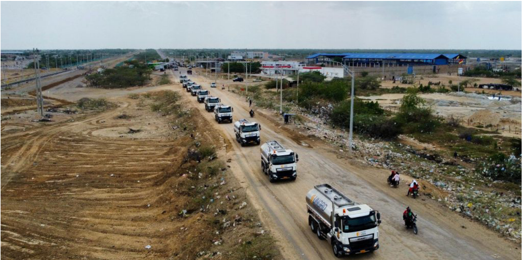
Preocupa que los carro-tanques hayan sido adquiridos sin una póliza de seguro, lo cual podría interpretarse como un acto de mala fe.

La Contraloría abrió un proceso a exdirectivos de la Ungrd