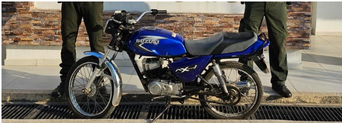
Fue recuperada una motocicleta marca Suzuki, placa ZOH-58A, color azul en Albania.