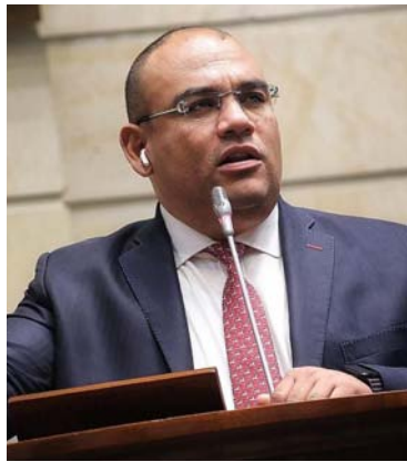
Antonio Correa, Senador del Partido de la U.