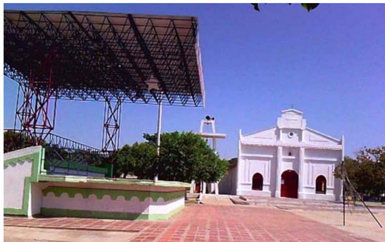
En El Paso, Cesar, desde hace 35 años se realiza el Festival Pedazo de Acordeón en homenaje a Alejo Durán.

Alejo Durán, "El Negro grande", nació para ser de esa dimensión y su nombre quedó enmarcado en la historia del folclor vallenato y más en su tierra El Paso, donde a finales del mes de abril se lleva a cabo desde hace 35 años el Festival Pedazo de Acordeón.