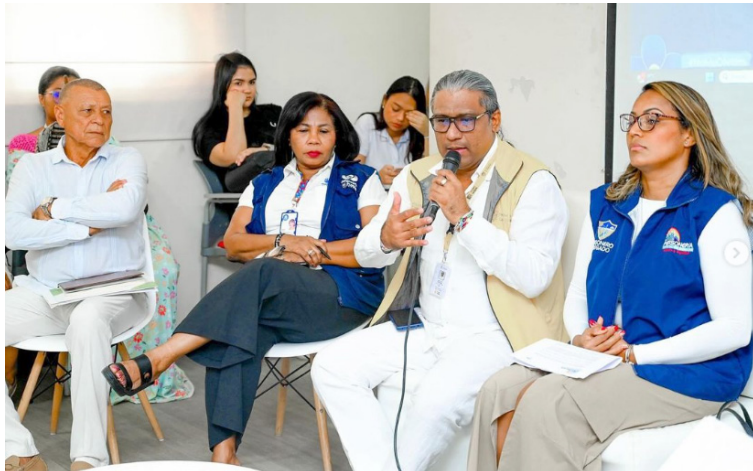
En el encuentro se resaltaron los logros institucionales alcanzados en materia de reparación en el Departamento.

En este encuentro, se resaltaron los logros institucionales alcanzados en materia de reparación de los involucrados en el Departamento, haciendo énfasis en la experiencia y capacidad de resiliencia que han demostrado las víctimas tras