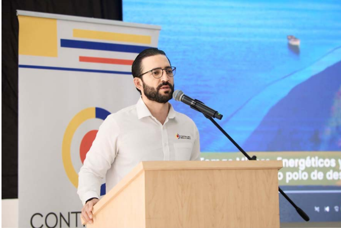
Zuluaga dijo que La Guajira es el mejor lugar de Colombia en términos de potencial logístico.

Manifestó que uno de los elementos más importantes que han identificado desde el Gobierno es que no puede haber una transición energética sin la gente, además