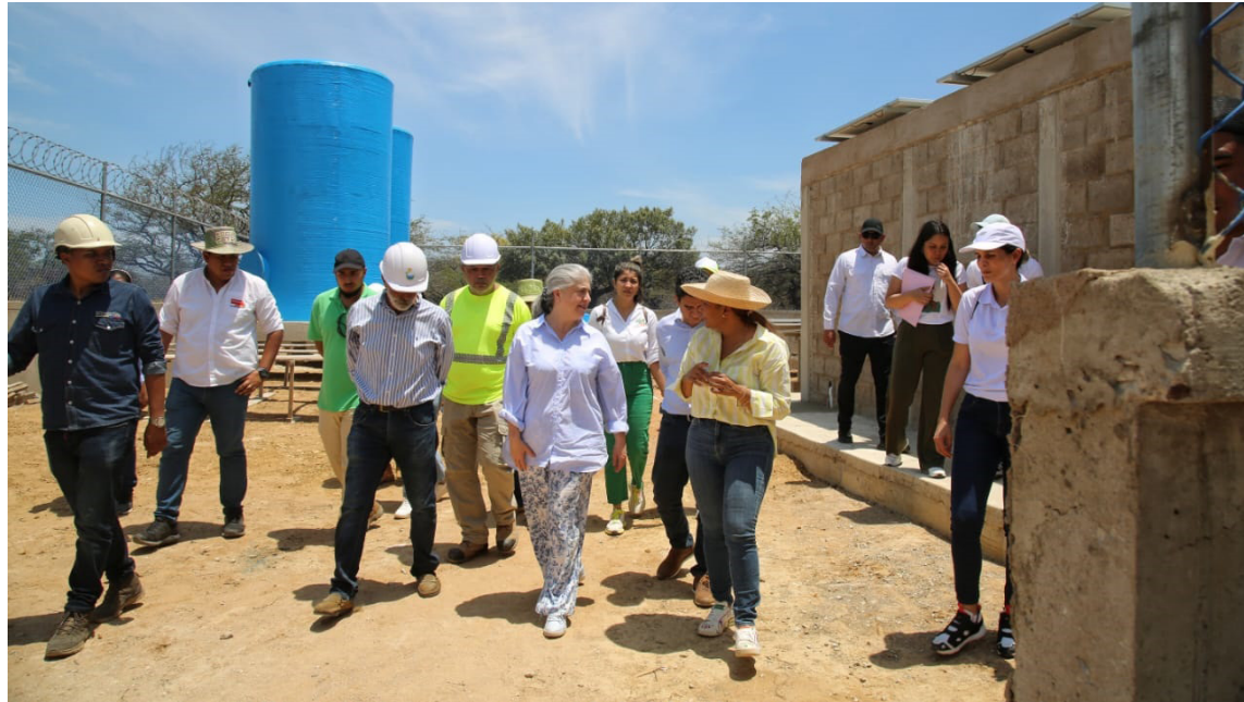
MinVivienda en cada recorrido hace seguimiento a las obras que se ejecutan en La Guajira.