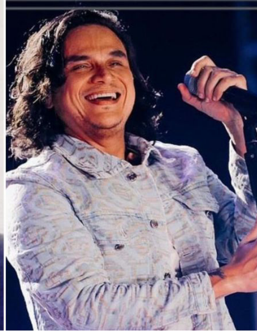
La junta directiva del festival ratificó homenaje a Juancho Rois (q.e.p.d.) y Silvestre Dangond.

presentando la edición 'Rey de Reyes', un tributo único que reconoce al mejor de los mejores compositores de esta música que tanto enriquece el género y las tradiciones.