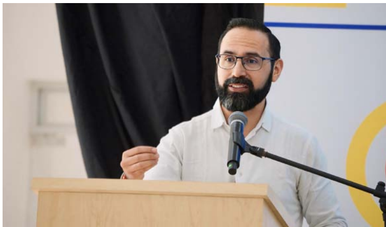
Para Minminas la lucha es contra la pobreza energética.

que transición energética significa progreso de desarrollo y oportunidades.