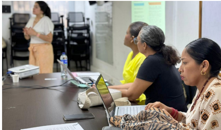
El Icbf llevó las jornadas de capacitación e intercambio de saberes para fortalecer la seguridad y soberanía alimentaria.

Por espacio de dos días, y de manera simultánea en diferentes escenarios de Riohacha, los profesionales del Instituto Colombiano de