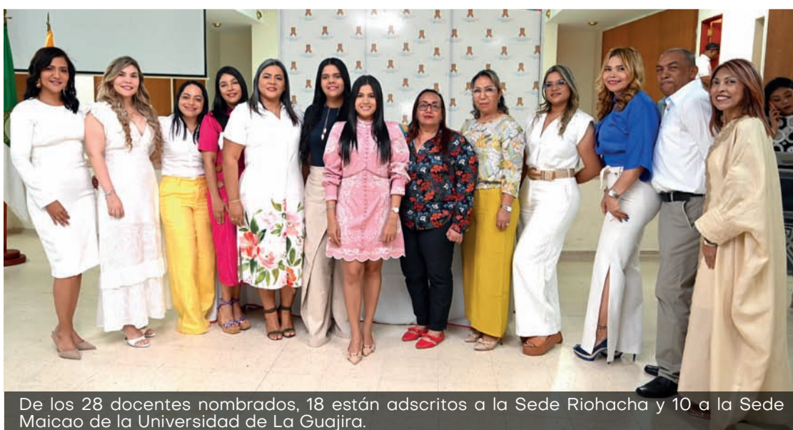
De los 28 docentes nombrados, 18 están adscritos a la Sede Riohacha y 10 a la Sede Maicao de la Universidad de La Guajira.