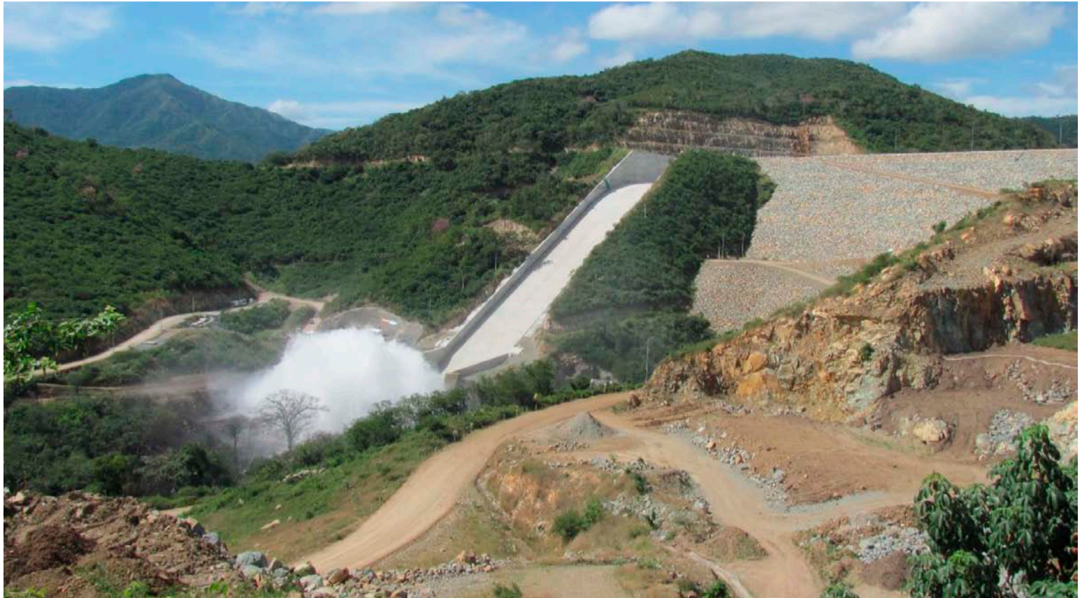
La Yanama guajira sería estrategia exitosa para lograr que anhelos de su gente no sigan escondidos en la sombra del viento.

Pero el camino continúa y el buen andariego no descansa y es animado por otros viajeros. Porque además de reconocerle lo audaz, la vaca ha recibido aportes de los migrantes antioqueños residentes en todo el mundo y la solidaridad de otras regiones de Colombia; muestra de ello, es el anuncio de los ciudadanos de Cúcuta de convo-