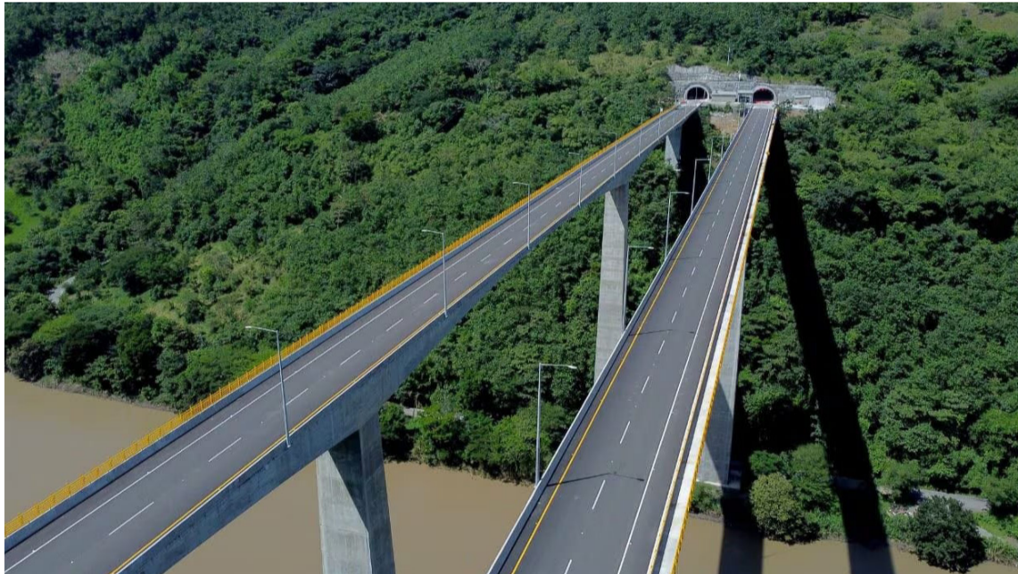
La 'vaca de los antioqueños' merece los aplausos y reconocimiento de todos los colombianos.