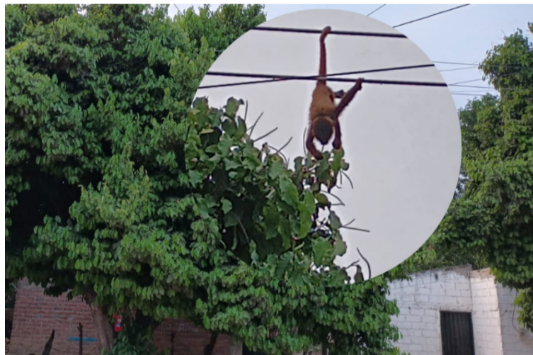
Hace días se registró la muerte de un mono que se subió a uno de los árboles por donde pasan las líneas.

Según los habitantes, las líneas de media y baja tensión quedan en medio de las ramas, lo que energiza a los árboles, incluso cuando están frescos, y ha provocado que más de un residente haya experimentado el paso de la corriente en baja intensidad sobre sus cuerpos.