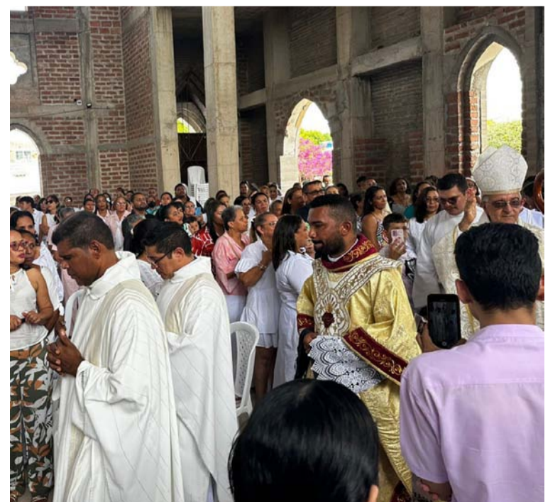
El día de Jesús de La Divina Misericordia se celebra cada segundo Domingo de Pascua en el municipio de Fonseca.