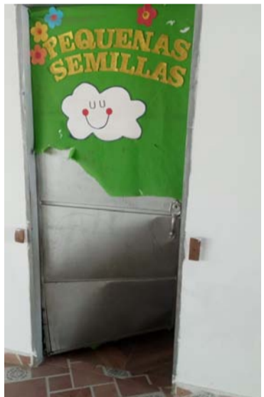
En Las Tunas, ladrones volvieron a robar elementos y equipos de trabajos para la atención de la primera infancia.