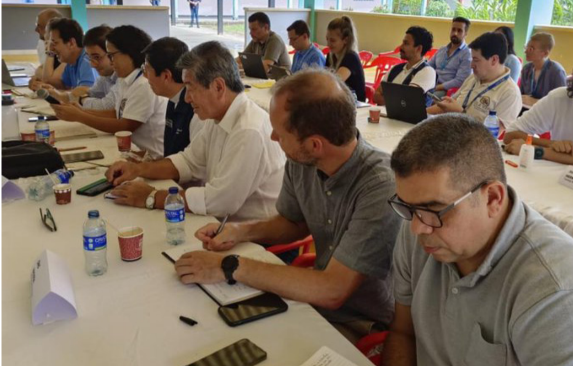
Las partes manifestaron que siguen comprometidas con lo construido durante el proceso.

En medio de una reunión extraordinaria que se llevó a cabo en San Vicente del Caguán, Caquetá, el Gobierno nacional y las disidencias de las Farc o Estado Mayor Central (EMC) acordaron la continuidad de los diálogos de paz.