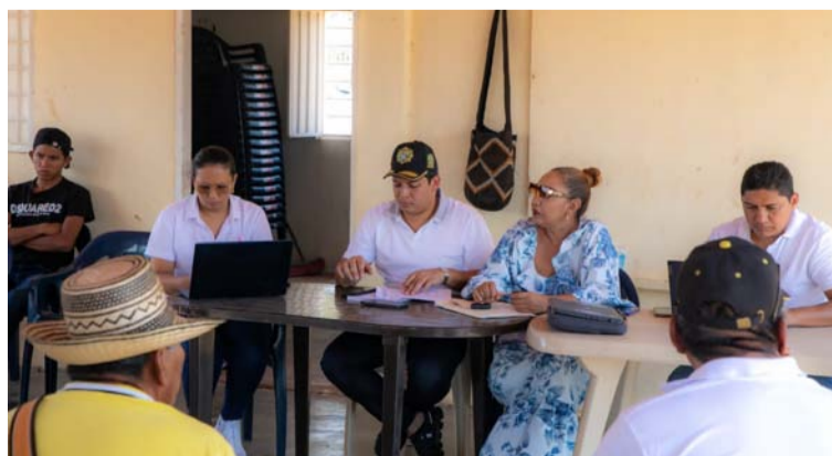
Se busca identificar los problemas y necesidades de esta población para definir las líneas de inversión de regalías.

Durante la reunión, el mandatario expresó su interés en escuchar las voces de los habitantes y vecinos de esta región, reconociendo la importancia de incorporar sus perspectivas y necesidades con la finalidad de garantizar que las políticas y proyectos de este cuatrienio, reflejen de manera efectiva las realidades de este Resguardo y sus comunidades.