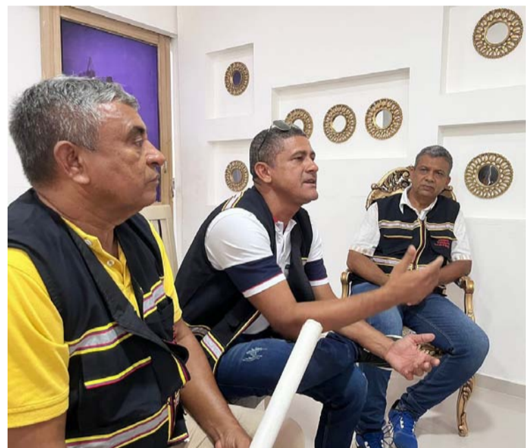
Se incluyó también el mototaxismo para abordar la iniciativa de la transición energética.