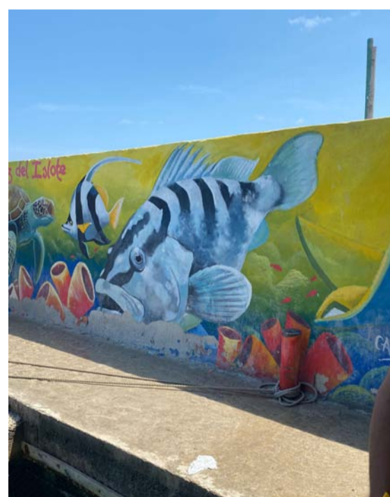
La comunidad de estas islas para su subsistencia solo cuenta con el mar y el turismo.