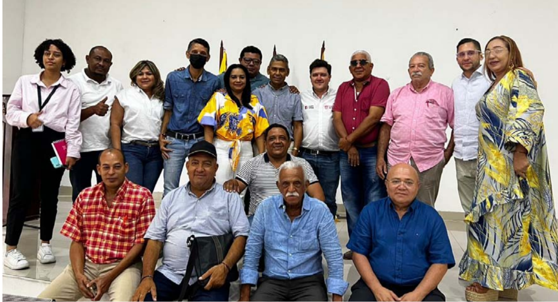
El encuentro contó con la presencia de líderes de acción comunal de los municipios del Sur.

Este encuentro abrió la oportunidad para convocar a una nueva mesa técnica