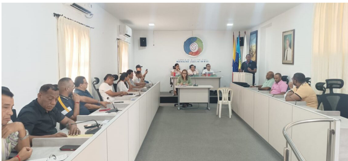
El permiso está fundamentado en una solicitud formal del mandatario al Concejo.

El mandatario se estaría desplazando hoy lunes a la capital de Estados Unidos.