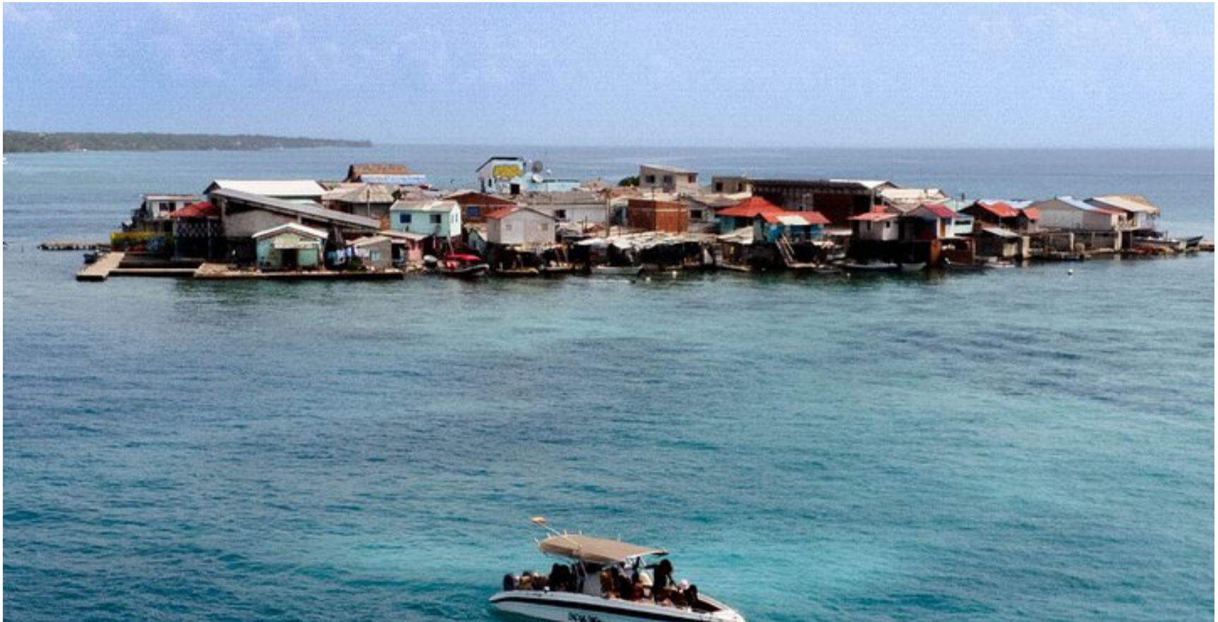
El islote artificial Santa Cruz en Sucre, considerado como la isla más densamente poblada del planeta, tiene 816 habitantes.