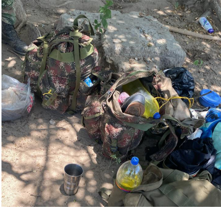
En la operación se incautaron unas botas de cauchos, tres centinelas, 134 cartuchos de 7.62 milímetros, y dos celulares.