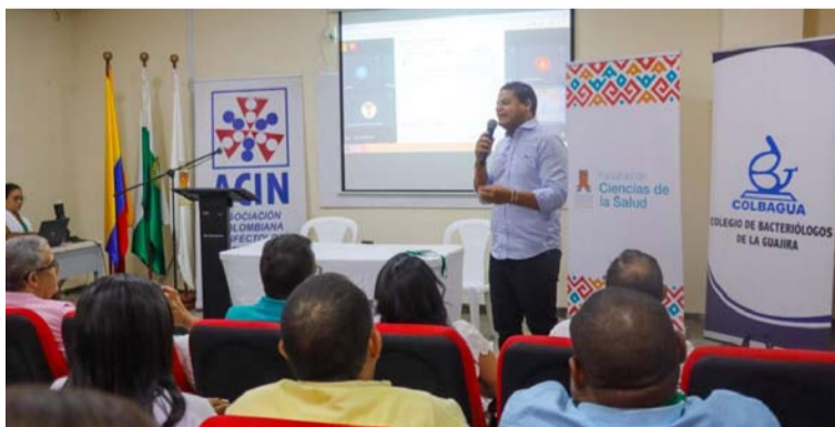
El evento se llevó a cabo en las instalaciones de la Uniguajira, organizado por la Asociación Colombiana de Infectología.

ahí es donde se da paso a la tuberculosis; y que a medida que nosotros hagamos esa prevención y tengamos más atención primaria, menos casos vamos a tener con el tiempo,” destacó el mandatario local en medio de la instalación del IV Simposio