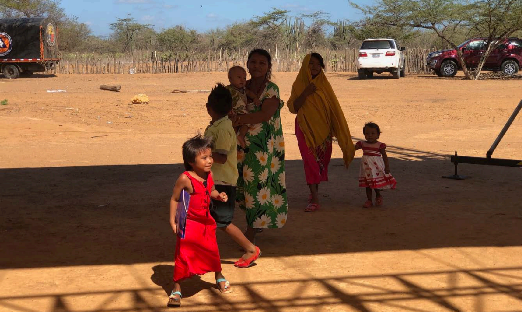
Los Planes de Desarrollo que se formulan tienen la posibilidad de generar apuestas estratégicas para cumplirle a la niñez del país.