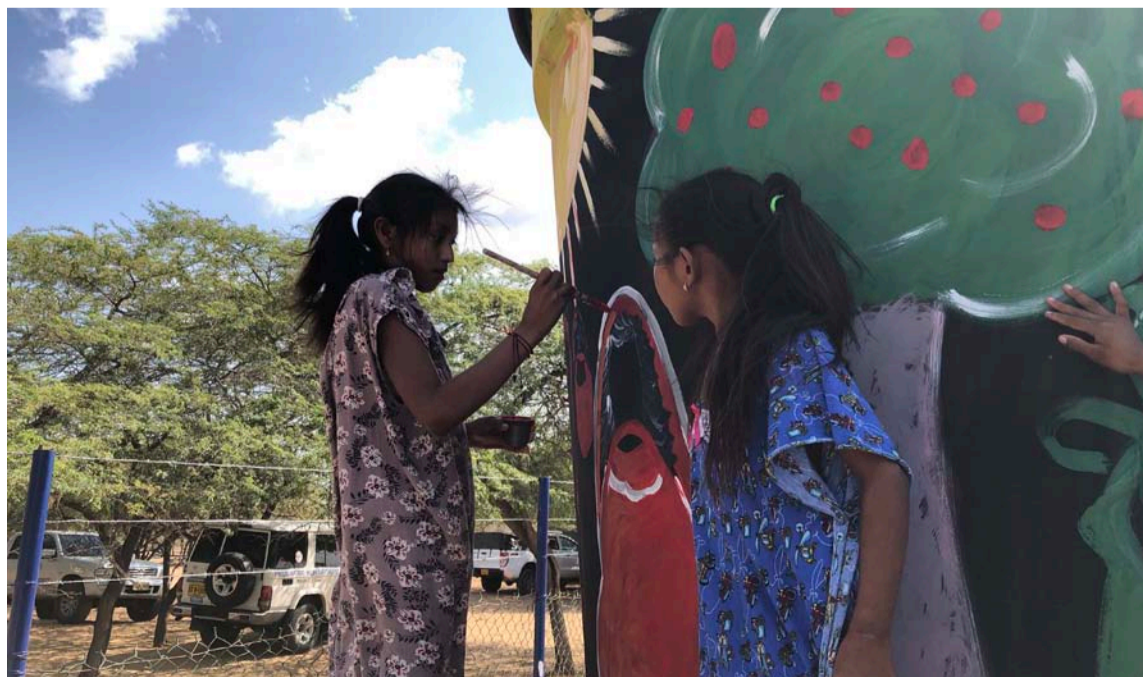
En el norte de La Guajira los más sacrificados son los menores por la alta pobreza.

- Asegurando que existan indicadores claros de los resultados con los que podrán verse los avances de cobertura, calidad y acceso de la niñez y adolescencia a los servicios y atenciones básicos y a las rutas para su atención integral.