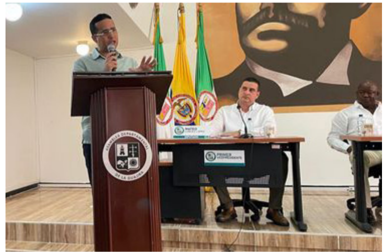
El gobernador dijo que se está trabajando en la iniciativa con el alcalde de Riohacha, para concretarla.

En tanto, los gestores culturales y la comunidad en general confían en que la iniciativa pueda concretarse toda vez que la ciudad no cuenta con espacios para la realización de grandes eventos.