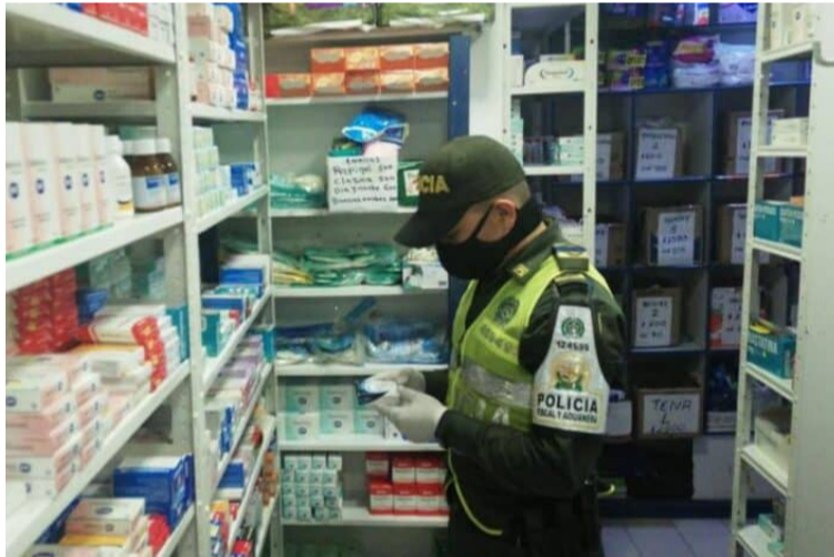
La ciudadanía ha expuesto la presunta operación de contrabando de medicamentos subsidiados hacia Venezuela.

De acuerdo a lo expuesto por los denunciantes, este esquema involucra la presunta complicidad de Entidades Promotoras de Salud (EPS) en Colombia y el uso