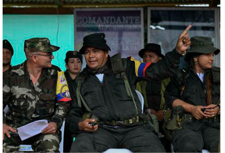
El Gobierno y las disidencias o Estado Mayor Central (EMC) acordaron la continuidad de los diálogos de paz.

“De conformidad con las evaluaciones realizadas se acordó continuar con los