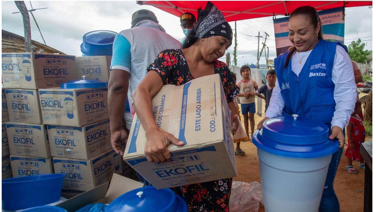
El proyecto Ayana'ajirawa, ha contado con una inversión de $1.5 millones de dólares por parte de la Fundación Baxter.