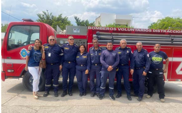
Se revisó la Tasa bomberil, el recaudo que hace la administración para el fortalecimiento de los Cuerpos de Bomberos.

Durante el encuentro también se revisó la tasa bomberil, que es un recaudo que hace la administración para el fortalecimiento de los Cuerpos de Bomberos,