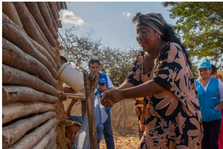
En la zona de la Alta y Media Guajira, acceder al agua potable implica grandes desafíos por la escasez de lluvias.

A lo largo de los últimos 3 años, la alianza ha logrado acompañar el proceso de certificación de 34 comunidades que han implementado la construcción sostenible de letrinas autocons-