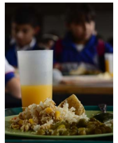
La Contraloría General le tiene puesta la lupa al tema.

En este mes de abril, dedicado a la celebración del bienestar y desarrollo integral de los niños, la Contraloría General reafirma su compromiso con la defensa de los derechos de la infancia y la adolescencia y recuerda el deber de los prestadores de este servicio fundamental, que deben garantizar que ningún niño o niña se quede atrás en el acceso a una educación integral y saludable.