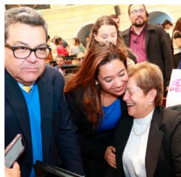
La Ministra de Trabajo mostró muy emocionada.

“Los más de 2 millones 800 mil abuelos y abuelas que no tienen un ingreso para vivir con dignidad están pendientes de esta reforma y, desde luego, todos los colombianos y colombianas”, puntualizó.