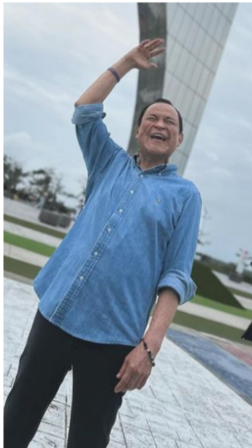
El cantante y acordeonista, Alfredo Gutiérrez.

"Este homenaje a Alfredo Gutiérrez, es más que merecido; a través de los años ha dejado un legado y ha llevado nuestra cultura a nivel nacional e interna-