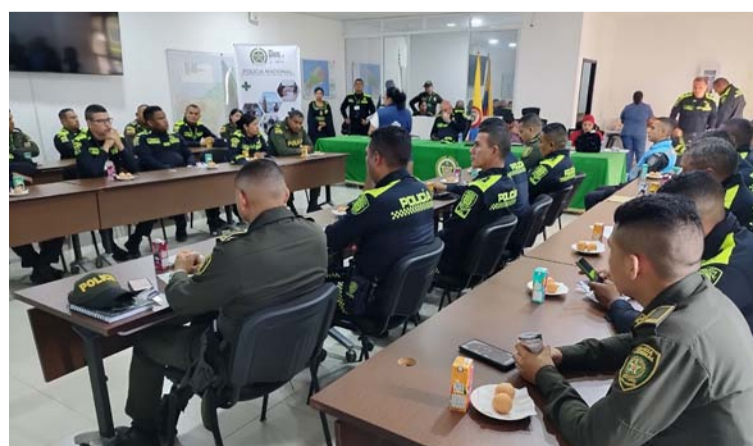
El seminario busca garantizar que los policías estén preparados para enfrentar los desafíos y exigencias de su labor.