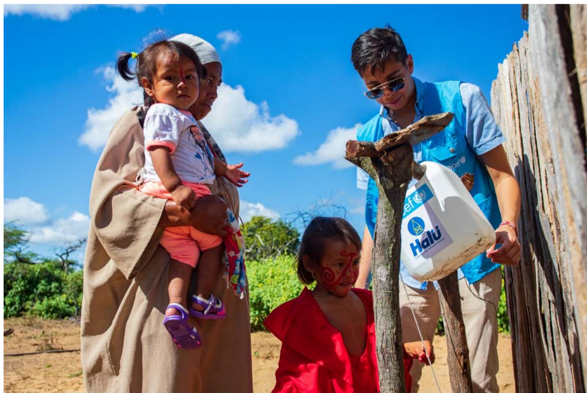
448 mil guajiros son considerados como personas en necesidad porque tienen limitaciones.

“Los resultados del proyecto Ayana'ajirawa superaron las expectativas iniciales y esto es posible gracias a la suma de otros aliados y la catalización de recursos que amplían el alcance de la intervención, desde la calidad y la sostenibilidad”, añade Estrada.