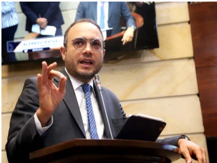
El senador ha utilizado los medios de comunicación y las redes para cuestionar públicamente a la doctora Cáceres.

Sin embargo, ¿esta postura está justificada o es simplemente una estrategia política? El Icbf es una entidad crucial para el bien-