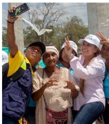
Este año se han entregado 6 plantas potabilizadoras.

“Mucha parte de la planta está en Colombia, estamos en trámite de importación y esperamos instalar la planta este mes ya la obra está completamente construida y