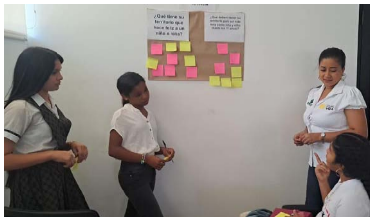
Los adolescentes presentaron propuestas en el marco de la primera Mesa de Participación 2024.

En este sentido, el Icbf se comprometió a brindar apoyo, acompañamiento en los procesos y articulación con los entes competentes para asegurar que sus propuestas sean atendidas y de este modo, promover el bienestar integral de las niñas, niños y adolescentes en La Guajira.