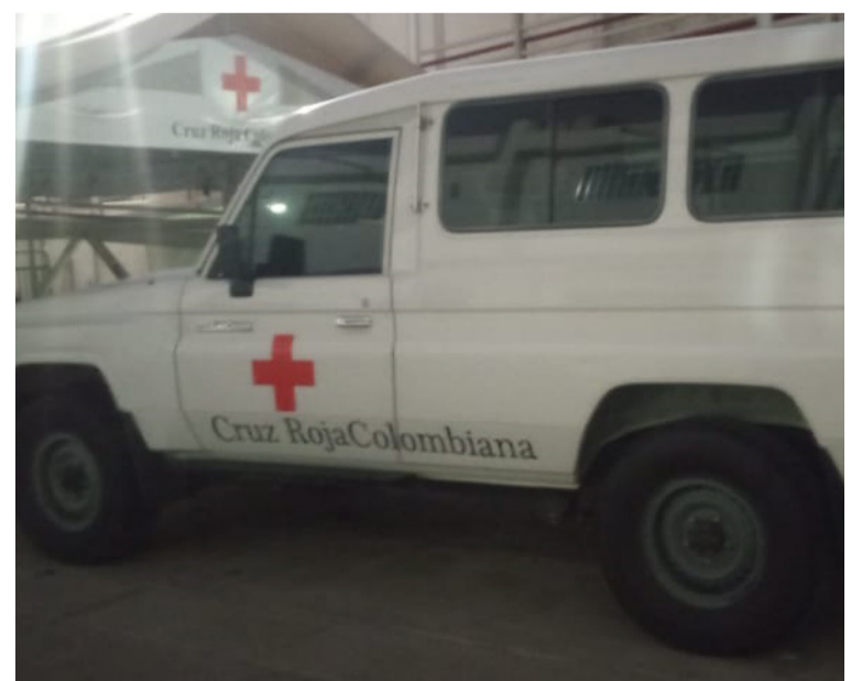
Las autoridades iniciaron las investigaciones pertinentes para dar con el automotor y los autores del robo.

Asimismo, se pudo conocer que las autoridades competentes ya tienen conocimiento de la situación, por lo que iniciaron la búsqueda e investigaciones pertinentes para dar con el automotor y los autores del robo.