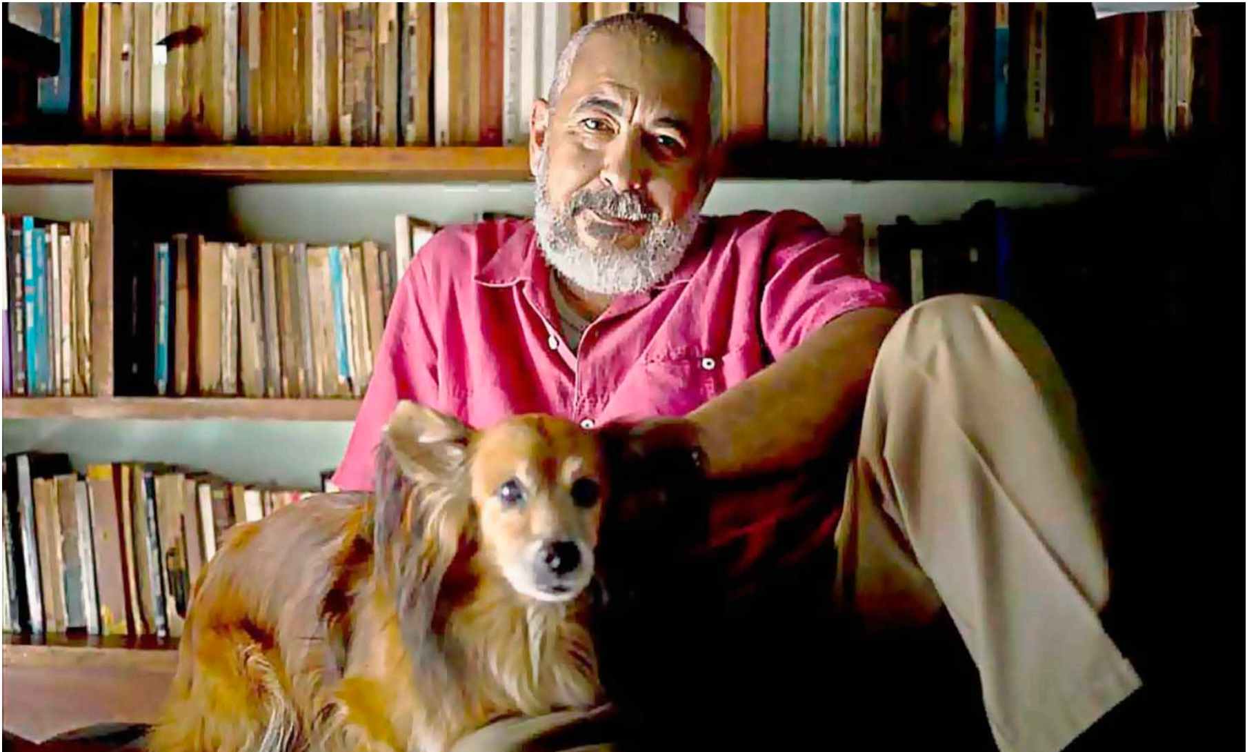
Leonardo Padura, escritor, periodista y guionista, nacido en La Habana en 1955, da muestras de su maestría en el arte literario.