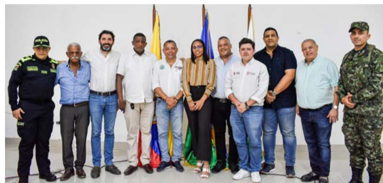
Los alcaldes, y el delegado del gobernador, coincidieron en solicitarle al Gobierno central acciones tangibles.

a los compromisos hechos en las mesas de diálogo, al igual que gestionar proyectos de nuevas cámaras de seguridad, crear la brigada de soldados especializada, aumento de pie de fuerza, la correcta y efectiva captura de delincuentes, más presencia del Ejército y Policía en las vías, a formular proyectos para adecuación de las estaciones de policía y capacitación para formación de proyectos en materia de seguridad.