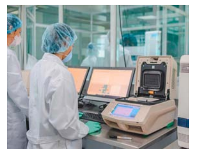
Son pagos de los presupuestos máximos a las EPS.

En total, se trata de 1 billón 144 mil millones de pesos. Estas transferencias de recursos se realizaron a las EPS que manifestaron su conformidad con las resoluciones expedidas por el Ministerio de Salud y Protección Social, a través de las cuales el sistema reconoce los gastos adicionales en los que incurren las entidades para garantizar la atención integral de sus afiliados.