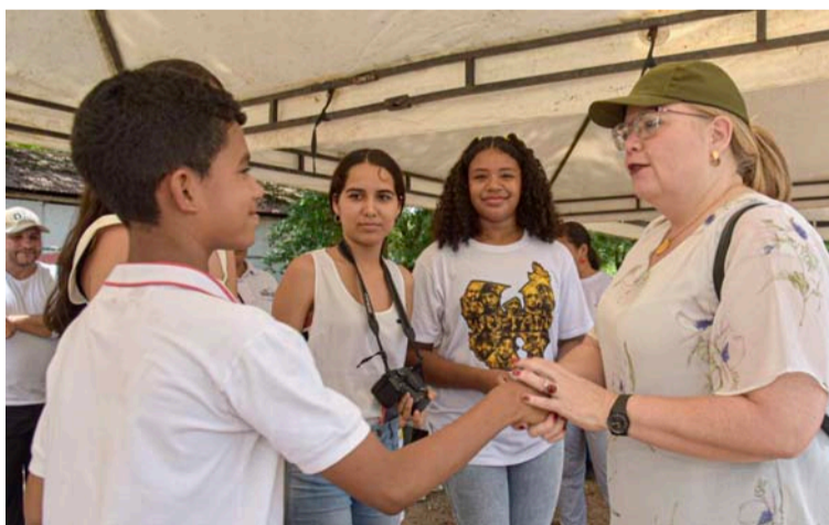
El Icbf es una entidad crucial para el bienestar de los niños, básicamente en aspectos relacionados con la nutrición.

estar de los niños y niñas, básicamente en aspectos relacionados con la nutrición, educación y protección de los derechos de la infancia.