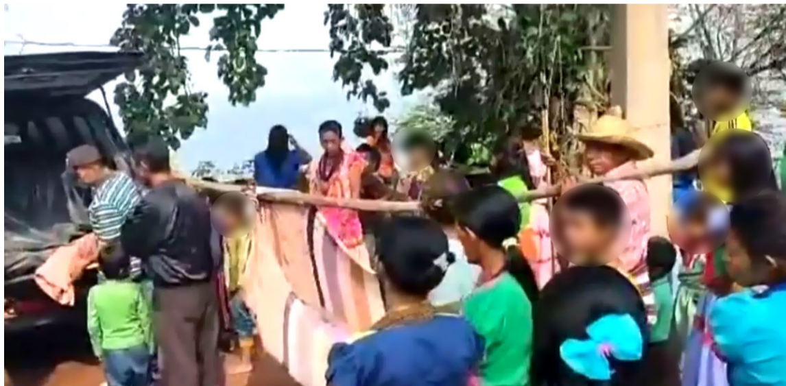
La tragedia ocurrió en el asentamiento Kchusweye, vereda El Limón, en Codazzi (Cesar).

En atención a la solicitud hecha por seis gobernadores del pueblo indígena Yukpa, la Fiscalía General de la Nación asumió la investigación por la muerte de cinco hermanos de 15, 13, 11, 7 y 3 años, ocurrida el pasado 24 de marzo en el asentamiento Kchusweye, en la vereda El Limón, en Codazzi (Cesar).