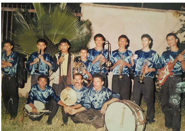
Banda 'Los Fernandez' de la cual hacen parte varias generaciones de esta dinastía en donde se demuestra que en Villanueva no solo impera el género de vallenato.

logrado organizar este legado como debe ser, valdría la pena rescatarla, este grupo de compadres, otrora muy amigos, todavía las mayorías conservan su amistad, pero ya no nos deleitan con tan importante evento folclórico; 'La Parranda Blanca'. Rescatarla en el marco de la esencia folclórica, de la cultura que caracteriza a Villanueva, sin fines comerciales, sin política, ni respetando su fondo su fragancia como fue concebida 'La Parranda Blanca', por los compadres debe ser una tarea.