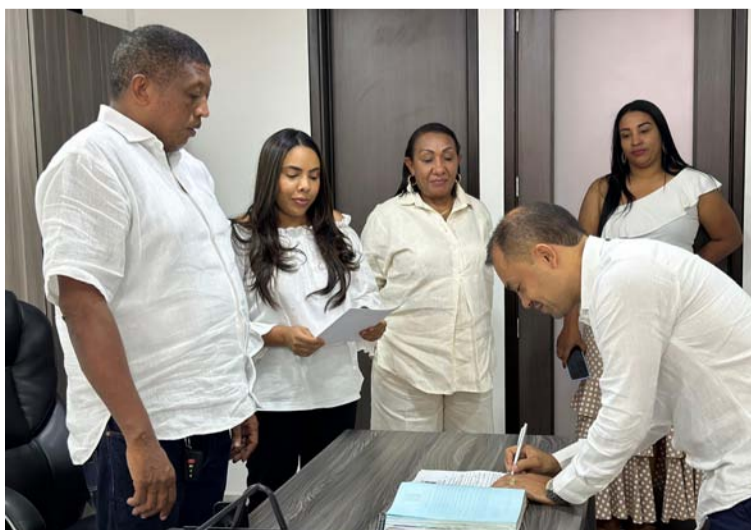
El nuevo gerente cumplirá el periodo constitucional comprendido entre 01 de abril de 2024 y 31 de marzo del 2028.