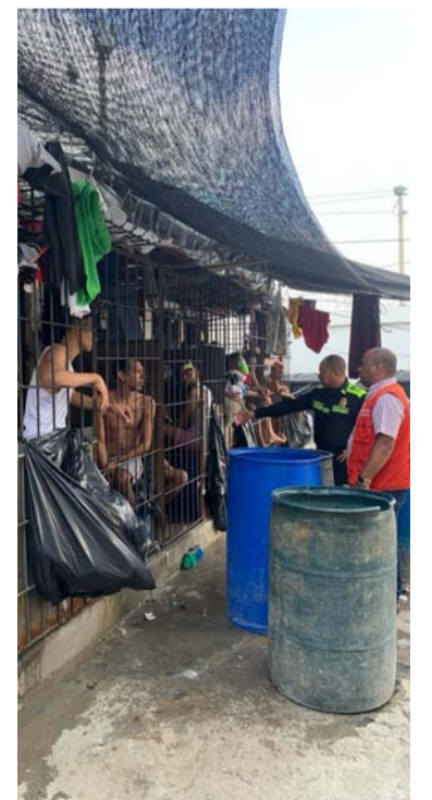
Advierte que no cuentan con condiciones higiénicas.

só que en las próximas horas se oficiará a los entes de control y entidades territoriales de la situación de los reclusos ubicados en la sala de reflexión de la estación de Policía de Maicao, para que se tomen los correctivos y no se le vulneren sus derechos humanos.