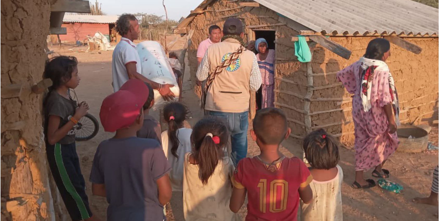
Es importante reconocer que el nuevo Gobierno está demostrando su voluntad de hacer las cosas de la mejor manera posible.

A pesar de las dificultades, hay logros de la Sentencia T-302 de 2017