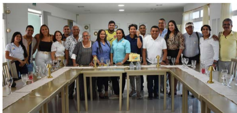
La agencia ha sobresalido por su oferta de servicios turísticos y su compromiso con el desarrollo integral del sector.

cuentan con el apoyo de las alcaldías y los Centros de Cultura municipales.