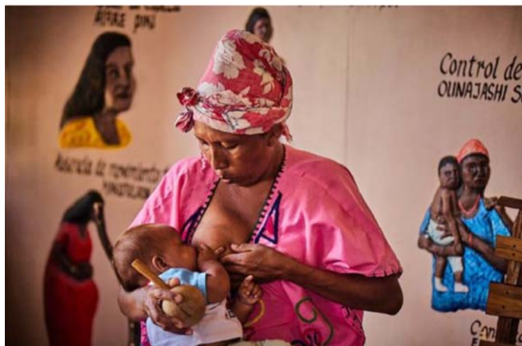
El gobierno de Petro ha centrado sus esfuerzos en resolver el Estado de Cosas Inconstitucionales y evitar un desacato.

Por Veeduría Ciudadana para la Implementación de la Sentencia T-302 de 2017.