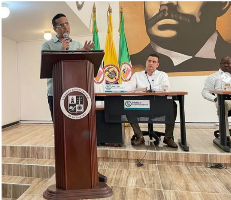
En el acto de clausura, el gobernador Jairo Aguilar resaltó el apoyo de los diputados.