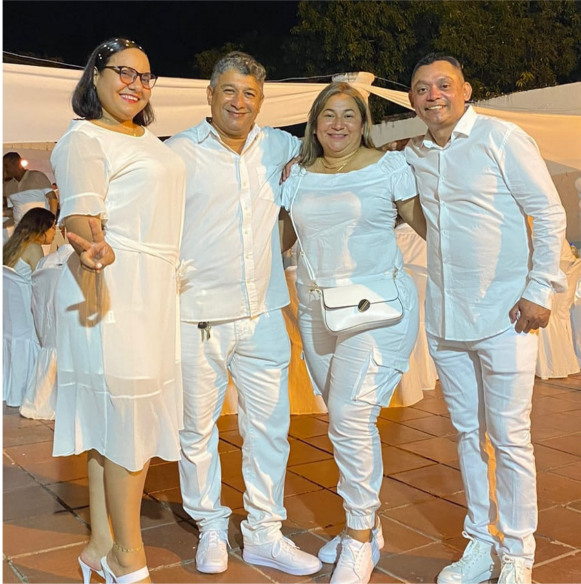
Muchos villanueveros han disfrutado 'La Parranda Blanca', un encuentro organizado por un grupo de amigos que se reúnen para despedir el año.

Este grupo se disolvió por rencillas políticas, cosa rara, porque la política no debería acabar compadrazgos ni menos amistades, pero aparecieron diferencias entre sus integrantes de varias índoles, pero así es la vida y las historias del folclor vallenato en esta tierra Cuna de acordeones, que 'Poncho' Cotes Jr. por siempre honró con sus cantos y composiciones, no de-