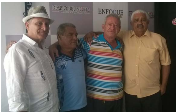
Los Compadres, grupo de amigos de infancia, compañeros de estudio, folcloristas cantantes y acordeoneros de Villanueva en donde hay expresidentes del Cuna de Acordeones.