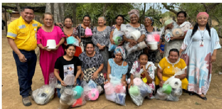
Cerrejón se ha propuesto entregar 17.927 conos adicionales como muestra de su compromiso a generación de ingresos.