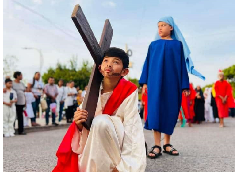
La obra emociona y conmueve a los espectadores con su poderosa narrativa y deslumbrante puesta en escena.