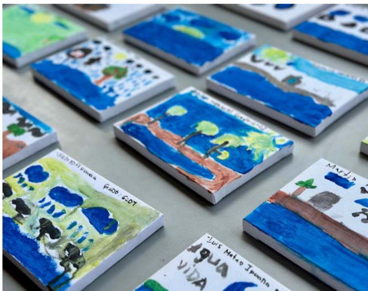
Estos clubes generan un sentido de pertenencia y responsabilidad en los pequeños y en cada uno de sus hogares.

Para el componente de gestión social, es funda-