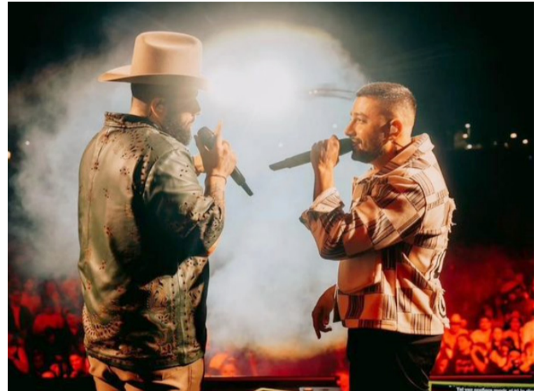
Carín León estará en la edición 57 del Festival Vallenato en Valledupar acompañado con Jean Piero.

“Estoy muy contento con el apoyo de los artistas mexicanos, fusionando su música regional con nuestro vallenato; llegando a importantes escenarios de México y Colombia, donde el público queda maravillado”, dijo Jean Piero.