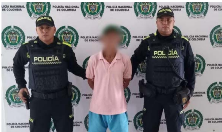
El capturado fue puesto a disposición de las autoridades competentes para que responda por sus acciones.

En una reciente operación de patrullaje llevada a cabo en el barrio Nazaret, se logró la captura de un individuo de 55 años de edad. Durante la inter-