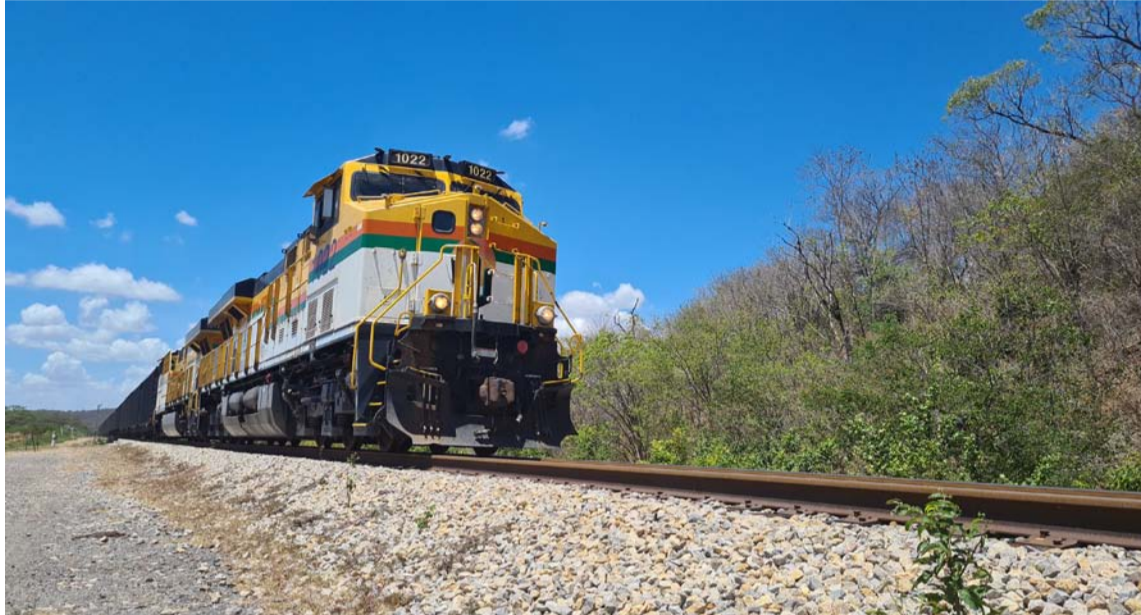
Cerrejón reitera compromiso para que se generen espacios de interlocución y concertación.

“Como compañía creemos y reiteramos nuestro compromiso con el diálogo abierto, transparente y honesto con las comunidades, sin acudir a las vías de hecho como mecanismos de presión, respetamos el derecho a la protesta pacífica que tienen todos los ciudadanos, al tiempo que rechazamos los bloqueos que