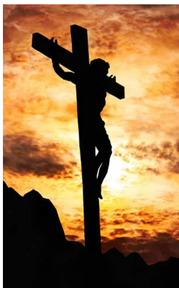
Es el evento más importante para los Testigos de Jehová.

Aunque para muchos el domingo 24 de marzo pueda pasar desapercibido, millones de personas alrededor del mundo se reunirán en esa fecha al anochecer para conmemorar la muerte de Jesucristo.