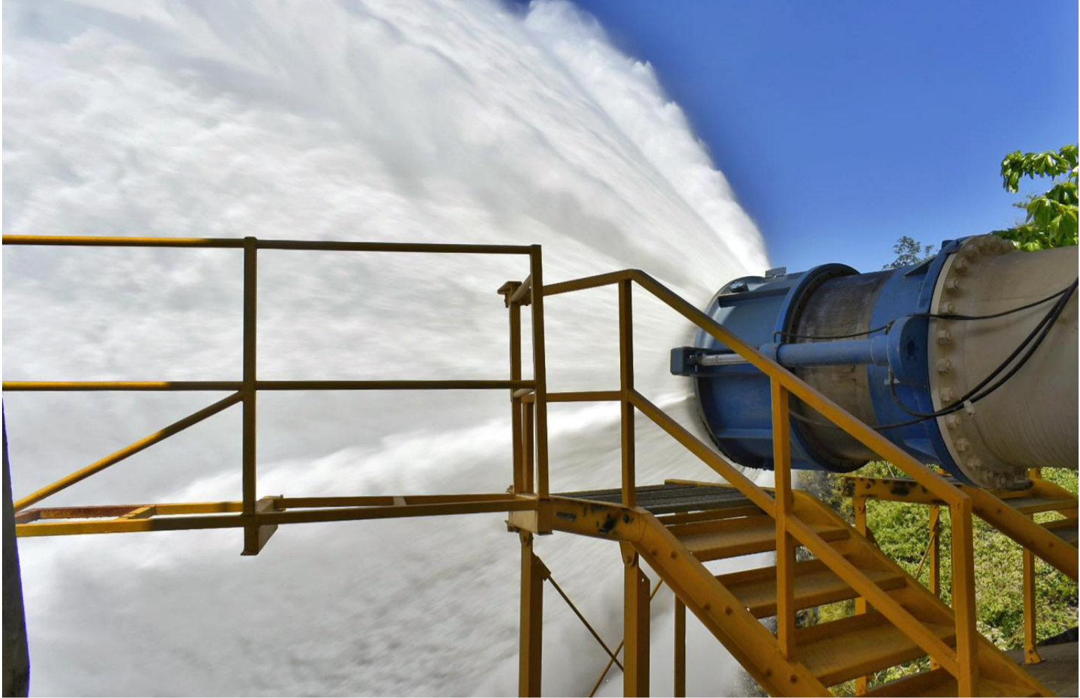
El trabajo de Esepgua con Minvivienda y el gobernador, seguirá marcando la ruta de llevar agua potable a todos los guajiros.

Avances significativos en la implementación de programas y proyectos