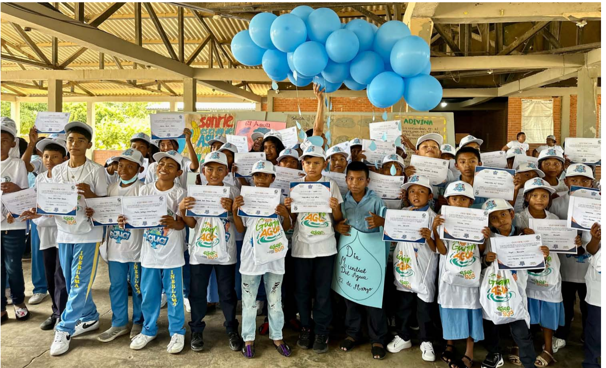
Los niños en Riritana-Maicao y el internado Laachon en Mayapo, del club de defensores del agua, representaron a través de la pintura el preciado líquido.

La sede de la Nueva Eps fue tomada por los empleados de la E.S.E Hospital San Rafael de Albania. ¿No les han girado? Nada, al hospital lo tienen prácticamente quebrado, la gente está protestando. ¿Sigue el estrangulamiento financiero? Eso dicen los trabajadores. Parece que es una línea de conducta, otras Eps en La Guajira viven el mismo drama con la Nueva Eps. No les giran para debilitarlos y luego buscan otra con músculo financiero.