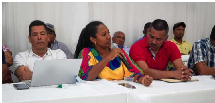
La Comisión surge con el fin de potenciar las dinámicas para superar las vulnerabilidades de las familias wayuú.

La creación de la Comisión Científica surge con el fin de potenciar las dinámicas para superar las vulnerabilidades de las familias wayuú y concretar los cambios propuestos por el Gobierno nacional, de modo que se fomente el crecimiento generacional en un entorno de justicia social.