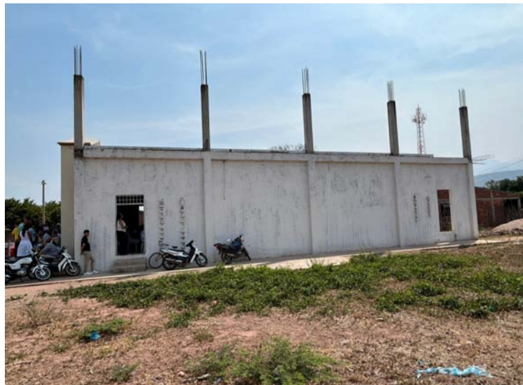
Esta infraestructura se construirá en la parte nororiental del municipio de Villanueva, en el barrio Blanca Martínez.