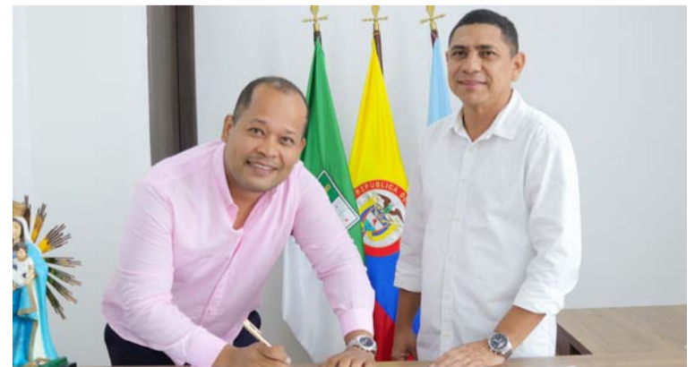
La administración busca apuntarle a la tecnología como herramienta para impulsar la educación de calidad.

tas son muy importantes hoy en día. Espero poder aportar desde mi conocimiento para contribuir al mejoramiento de la ciudad, en esta dependencia." Con la llegada de Medina Argote, la administración distrital le apunta a la tecnología como herramienta para impulsar la educación de calidad, y también para seguir cerrando las brechas digitales y a la vez generar desarrollo y competitividad en la ciudad.