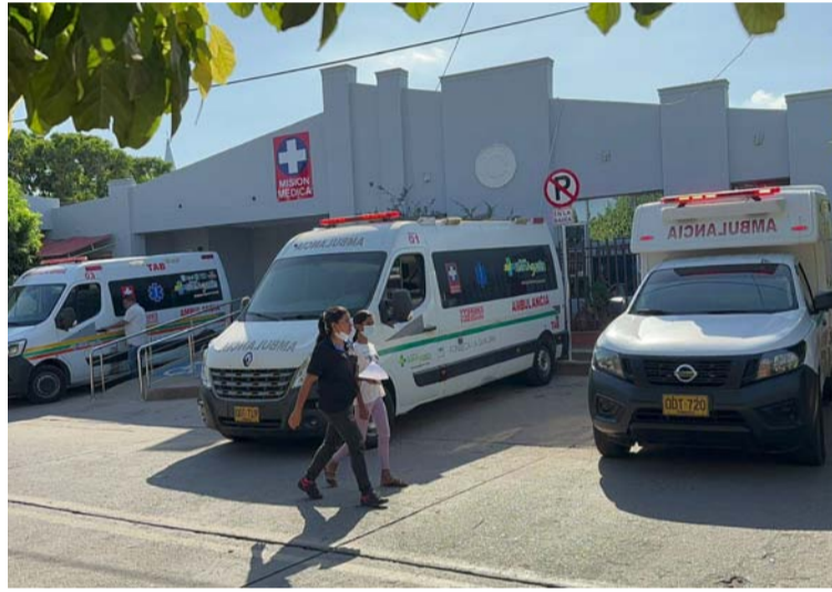
El servicio de urgencia se prestará las 24 horas todos los días, quedando con especial disponibilidad todo el personal.

Explica la entidad que el servicio de urgencia se pres-