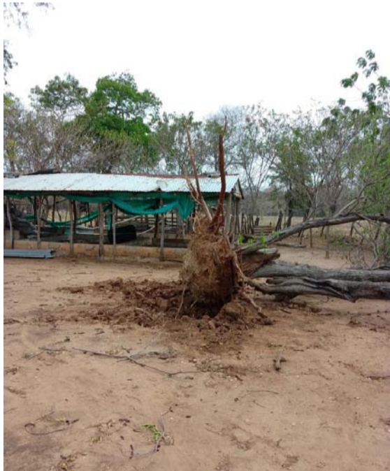
El fenómeno arrancó árboles frutales y nativos, y destruyó galpones de pollos y gallinas.