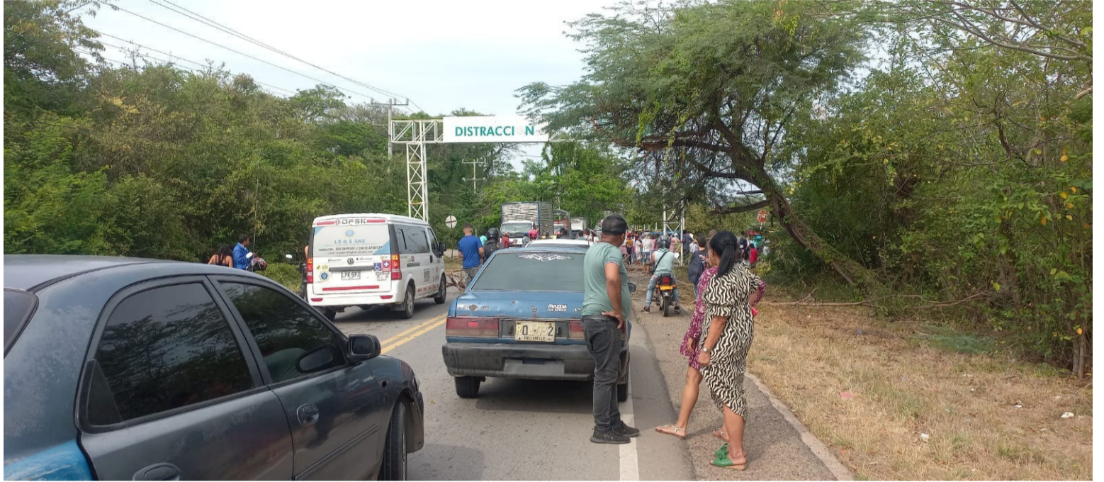
Padres de familia señalan que autoridades han pasado por encima de los conductos regulares y acuerdos establecidos.