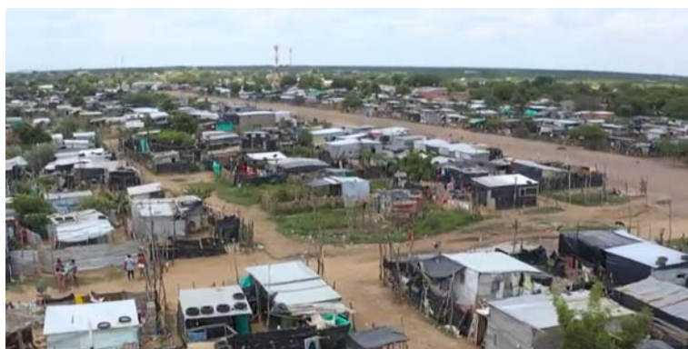
Se conocerán los avances en las medidas de atención en salud, servicios públicos, educación y primera infancia.

La Procuraduría General de la Nación verificará en Maicao la situación del más grande asentamiento de migrantes irregulares en Colombia, conocido como ‘La Pista’, donde analizará las medidas adoptadas por entidades nacionales y regionales para atender la crisis humanitaria que viven más de 12.000 personas entre ciudadanos venezolanos, colombianos retornados y algunos pertenecientes a la