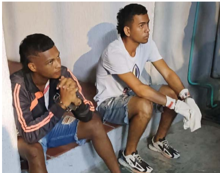
Estos sujetos pretendían ingresar al local comercial a cometer el hurto, pero primeramente neutralizar al guarda.

Una fuente ligada a la investigación determinó que serían tres los implicados en este suceso que ha sido repudiado por la comunidad maicaera y guajira, ya que el hecho quedó registrado en videos de cámaras de se-