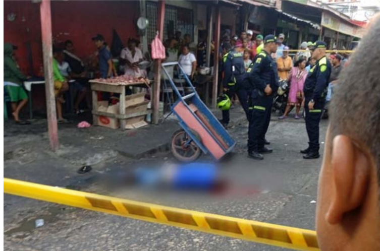
Este nuevo hecho violento sería el segundo caso presentado en el municipio fronterizo de Maicao.

Este nuevo hecho violento sería el segundo caso presentado en el municipio fronterizo de Maicao en