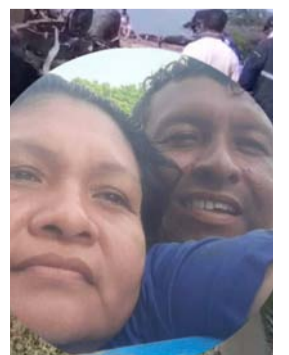
Los hechos se atribuyen inicialmente a mal estado de las vías y al exceso de velocidad.