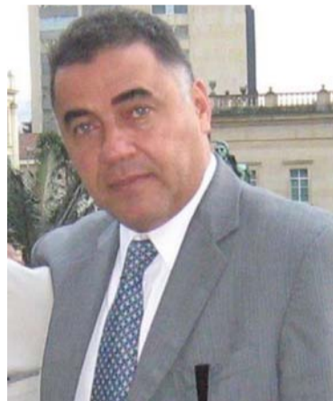
Ulises Ibarra Daza, contralor provincial de regalías.

El Contralor General de la República, Carlos Mario Zuluaga, se manifestó sobre el caso del contralor provincial de regalías de La Guajira, Ulises Ibarra Daza.