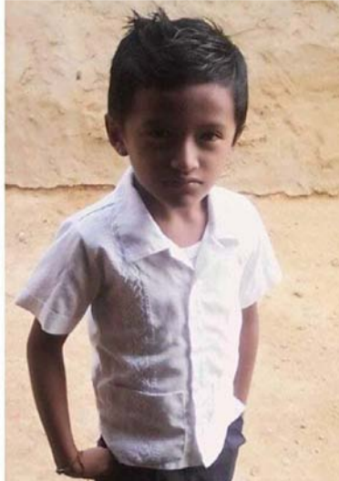
Las autoridades aún no han dado una respuesta sobre qué ha podido haber pasado con la mujer y su hijo.

paradero de la mujer y su hijo los contacten, ya que se encuentran preocupados. “Ya pasó más de un mes y nada que sabemos dónde pueden estar, de verdad que estamos desesperados al no saber nada de ellos”, dijo un familiar de los desaparecidos.