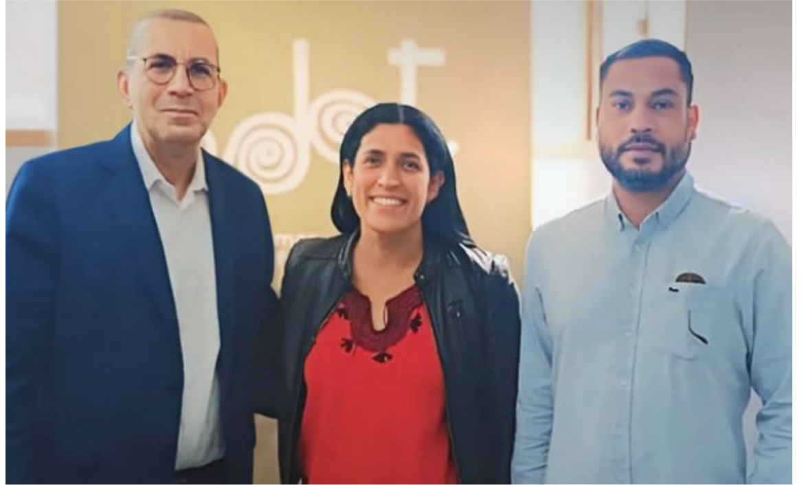
Se analizaron medidas para conservación de las cuencas de los ríos Ranchería y Cesar.