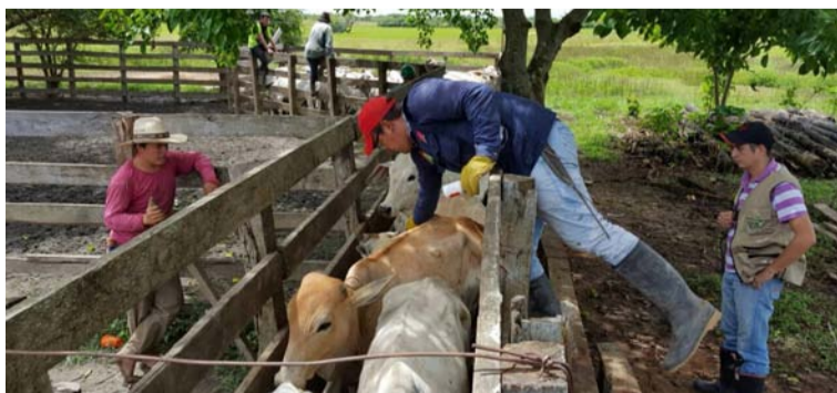
El ciclo adicional ordenado por la resolución 00000546 del 22 de enero de 2024 culminará el próximo 19 de marzo.

El ciclo adicional contra la fiebre aftosa en zonas de frontera con el vecino país