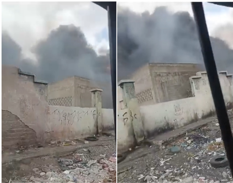
La construcción de la Alcaldía queda ubicada en la calle 13 con carrera 20 del barrio El Carmen de Maicao.

Allí, desde hace 10 años se diseñó el proyecto de la construcción del Centro Administrativo Municipal, es decir lo que los maicaeros llaman la 'nueva sede de la Alcaldía'.