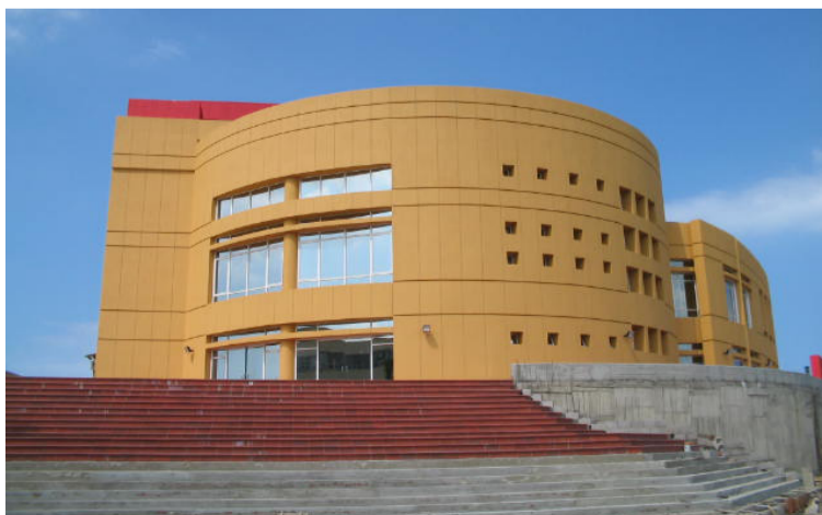
Dijo que realizarán todos los esfuerzos para lograr que la Nación le apueste a la recuperación del Centro Cultural.

El director explicó que los funcionarios pertenecen a la dirección de Patrimonio y Memoria. “Estamos demostrando nuestro compromiso por rescatar y dinamizar