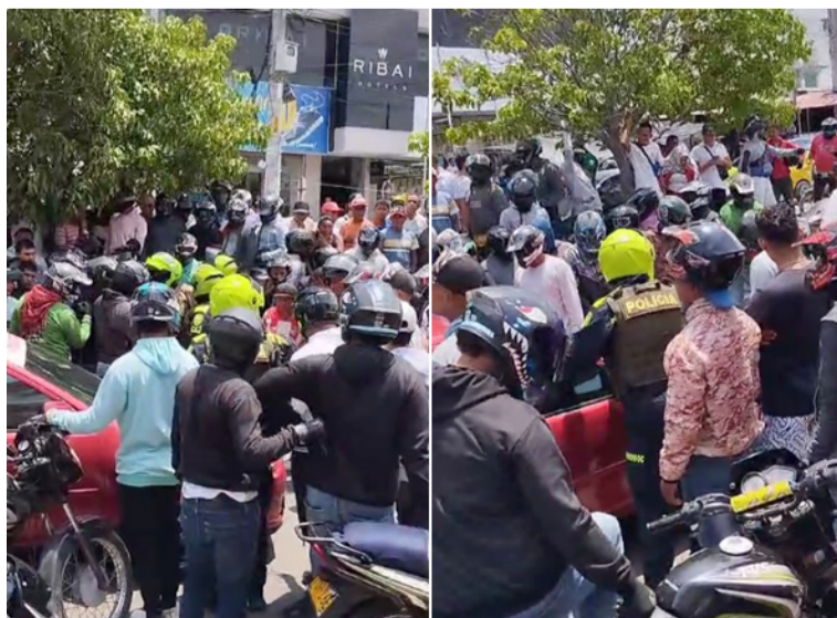
El incidente ocurrió entre la calle 12 con carrera 7 en el mercado viejo, justo al frente de la sede de Corpogujira.

Un hecho que al parecer se debió a planes de registro y control del Modelo Nacional de Vigilancia Comunitaria por Cuadrante de la Policía Nacional en el sector del mercado viejo de la ciudad de Riohacha, originó una alteración de orden público entre las autoridades y los mototaxistas que hacen transporte en el sector.