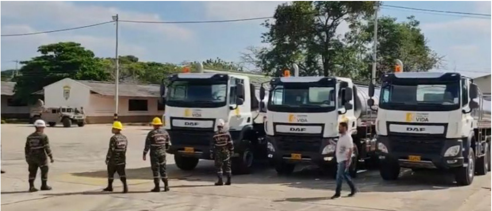
En La Guajira se sintió alivio y regocijo por la llegada de 40 carrotanques para distribuir agua en los territorios indígenas wayuú.