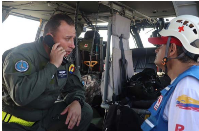
La Fuerza Aérea Colombiana organizó kits de supervivencia con implementos básicos para los heridos.

Como primera medida ante la emergencia, el Comando Aéreo de Combate No. 3 (Cacom 3), ubicado en Barranquilla, dispuso de dos aeronaves de vigilancia y reconocimiento para sobrevolar la zona de difícil acceso terrestre, dar con la ubicación de los heridos y poder realizar la