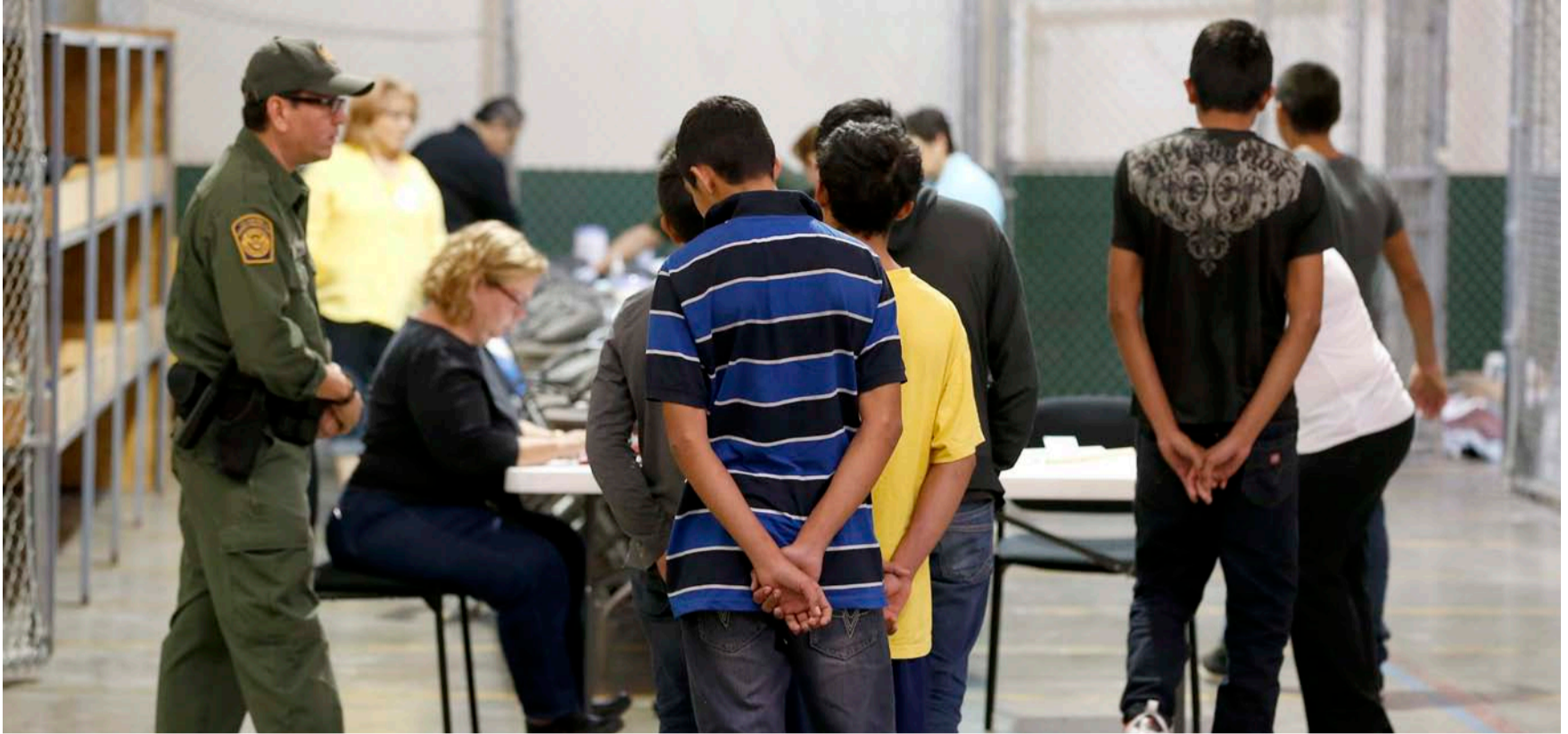
Una vez pisan suelo americano son reclusos en un centro de atención para luego ser llevados a un sitio especial para migrantes ilegales.