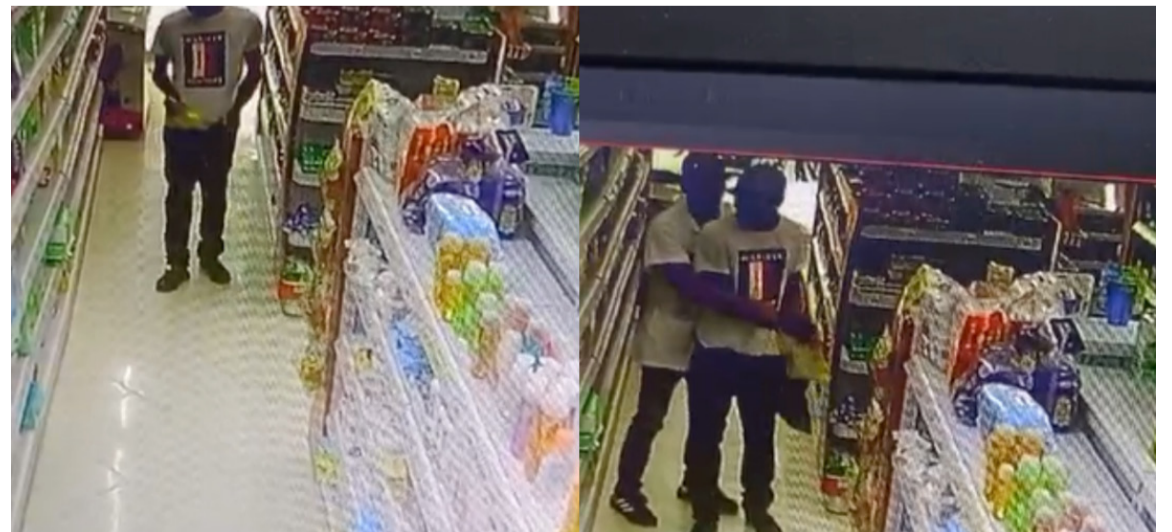
El delincuente cometió robo en dos droguerías de la misma empresa en el Centro.