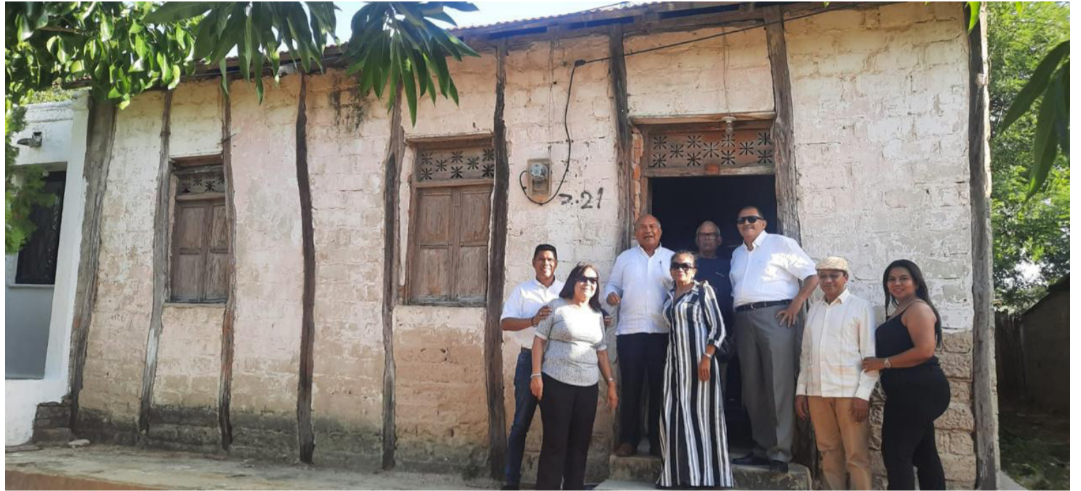
Al llegar a la vieja casona de Monguú con sus hermanos, el cronista evoca los recuerdos que se mantienen incólumes a pesar del paso del tiempo.

Evidentemente el 4 de marzo reciente pasado se realizó la misa para orar, para que brille para esa abuela inquieta, franca y maravillosa, la luz perpetua, durante todo ese día reflexioné muchísimo sobre la interpretación de los sueños, los míos son sucesi-