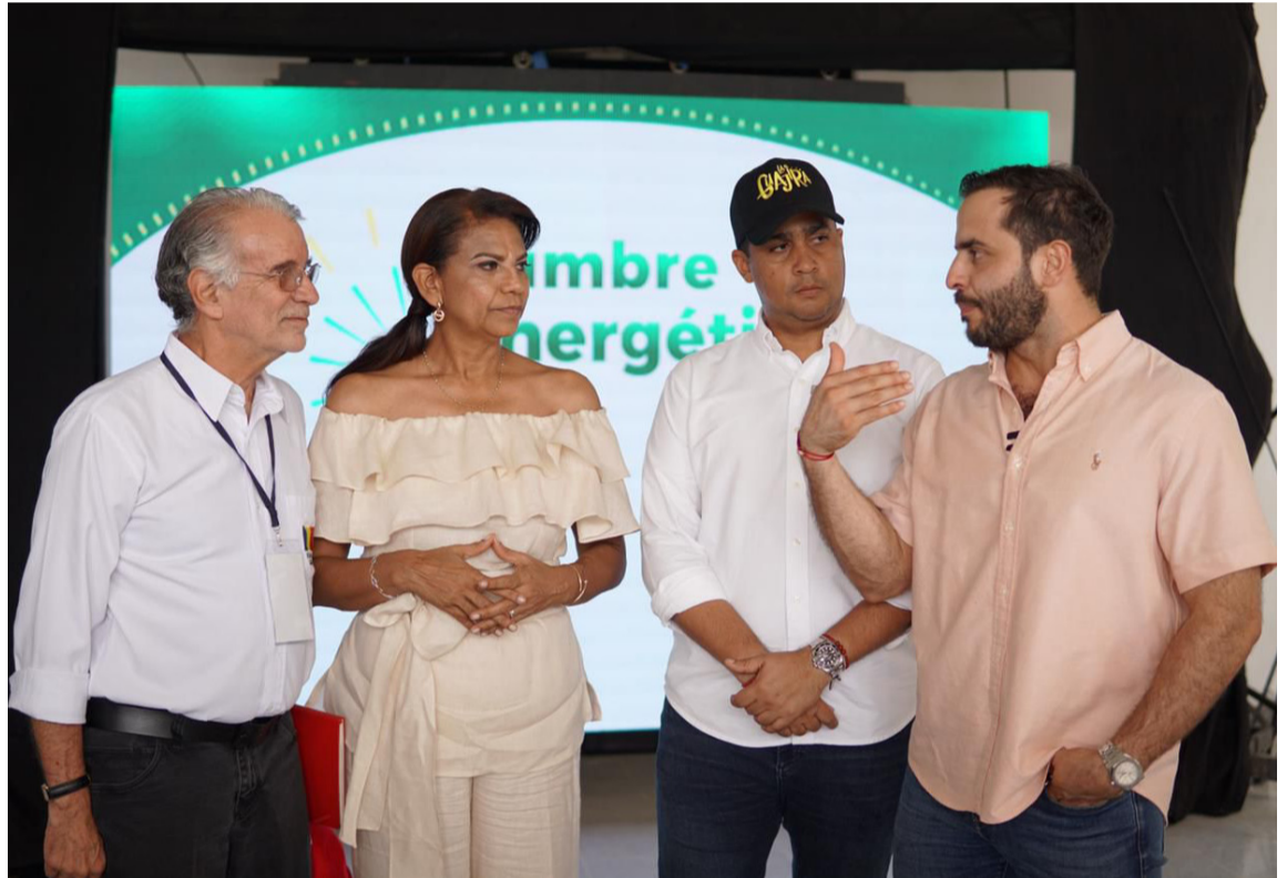
El mandatario departamental ratificó su respaldo al sector privado para acompañar proyectos.

A través de estas y otras iniciativas, el Gobierno departamental, ratificó su respaldo al sector privado, para acompañar los proyectos, velando por el acatamiento de las leyes y cuidando los intereses comunes de desarrollo y generación de beneficios para las comunidades y La Guajira, en general.