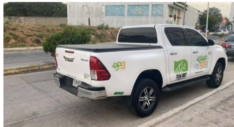
Un total de cuatro vehículos pertenecientes a Esegua se han robado en la zona de Uribia en los últimos meses.

Ante estos hechos, el gobernador de La Guajira, Jairo Aguilar Deluque, a través de un comunicado de prensa condenó el acto criminal que