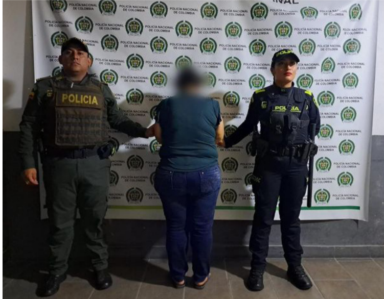
Esta mujer de 38 años de edad, oriunda de La Guajira, fue capturada por concierto para delinquir agravado.