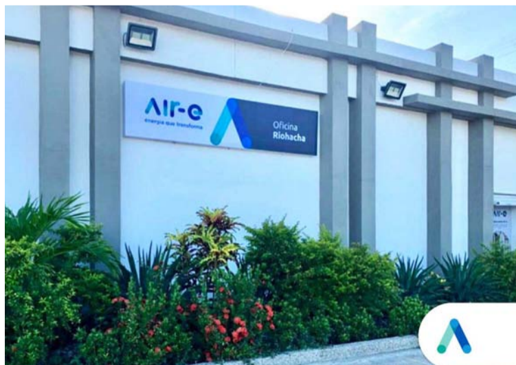
En la decisión judicial se ordena que se abra un proceso disciplinario en contra del funcionario encargado de Air-e.

“Este cumplimiento no se ha efectuado, del que estoy sumamente interesado en que se responda lo solicitado en ese Derecho de Petición, que dio origen a esta Tutela, por la razón de que los representantes de estas empresas piensan que solo tienen el deber de responder oportunamente, sin importarle si responden o no lo solicitado en ese Derecho”, expresó el demandante.