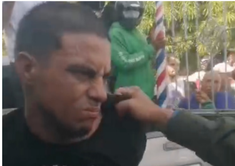
Más de 10 efectivos de la Policía Nacional intervinieron para que no siguieran golpeando al presunto ladrón.

El hombre ingresó a una vivienda ubicada al lado de una barbería e intentó cometer un hurto, sin embargo, esta versión no ha sido confirmada aun por las autoridades de Policía.