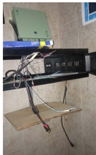
Comunidad pide a autoridades recuperar lo hurtado.

Habitantes del sector piden la colaboración de las autoridades para recuperar los elementos hurtados de este emblemático lugar.