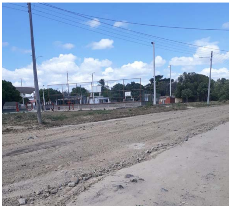
Quedan en la mente los recuerdos impercederos de aquellos tiempos cuando se transitaban por las destapadas calles del pueblo.

vos y con ellos Dios me ha anunciado acontecimientos buenos y malos antes que sucedan.