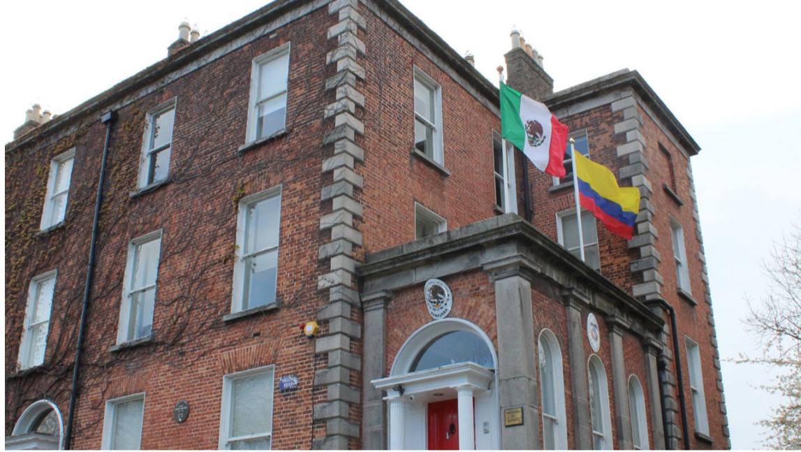
Las relaciones entre Colombia e Irlanda se establecieron el 10 noviembre de 1999.

“Esa es una decisión fruto del trabajo de la política exterior colombiana que nos invita a seguir trabajando para lograr la eliminación del requisito de visa de corta instancia para todos los