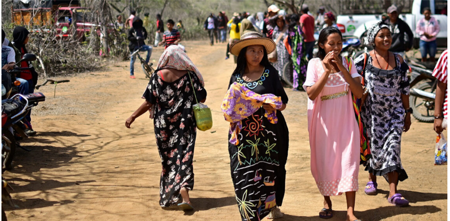
La Corte exhorta a autoridades nacional y territorial a continuar con la divulgación de actividades propuestas por MinInterior.

Con ponencia del magistrado José Fernando Reyes, la Sala Especial ordenó a la Procuraduría General de la Nación y a la Defensoría del Pueblo “seguir el cumplimiento de las actividades de divulgación del fallo rea-