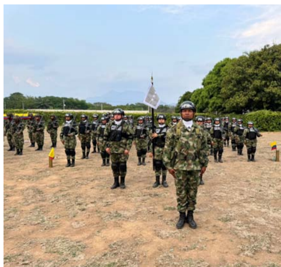
Los ascensos fueron a cabos segundos, cabos primeros, sargentos viceprimeros y primeros.