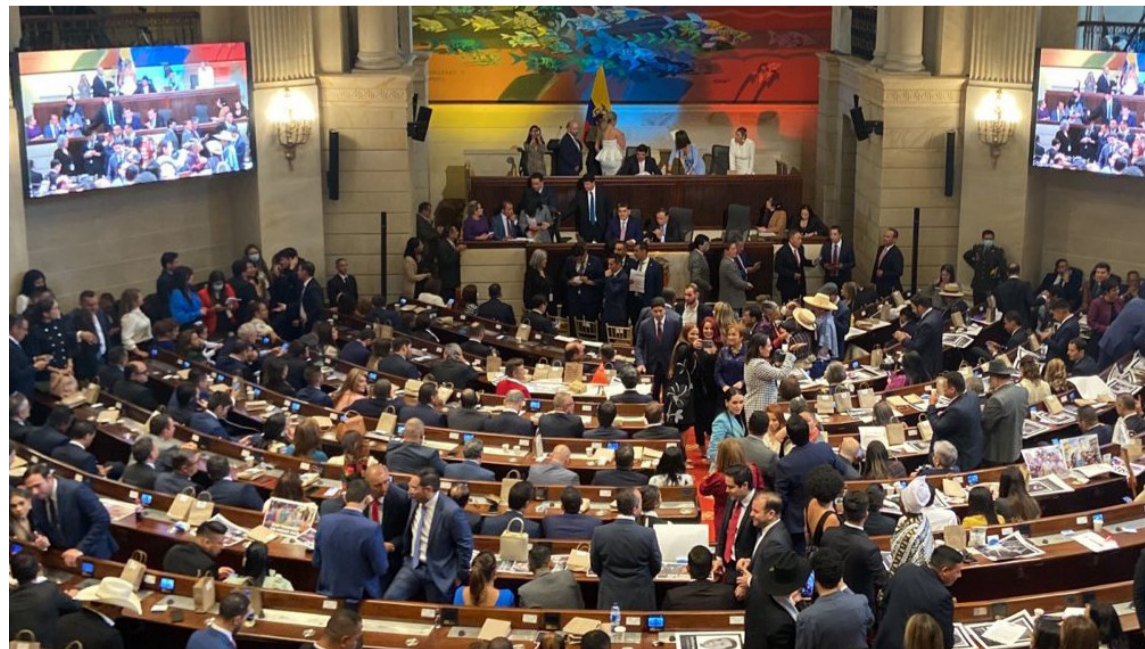
Senadores respaldaron la postura de Iván Name, sobre la autonomía a la hora de legislar.

Afirmaron que el Senado está cumpliendo con la discusión porque saben de la importancia de la reforma. La pensional seguirá su discusión la próxima semana.