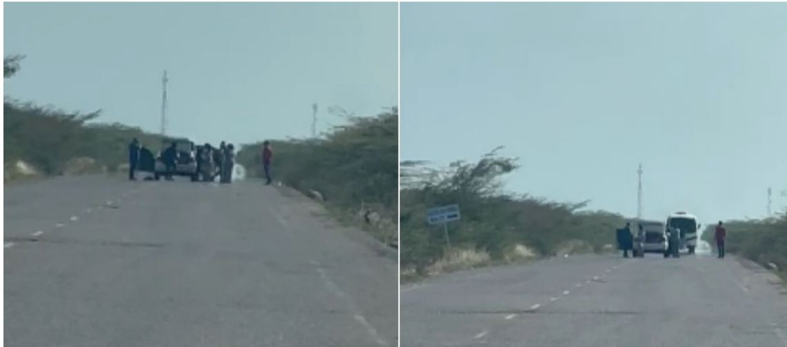
Vías de alto tráfico turístico hacia la Alta Guajira, son las preferidas de bandas delincuenciales.

do la atención del Gobierno departamental y de los alcaldes para que aborden el tema, puesto que en muchos sitios se tienen identificadas las bandas dedicadas a los atracos en las vías.