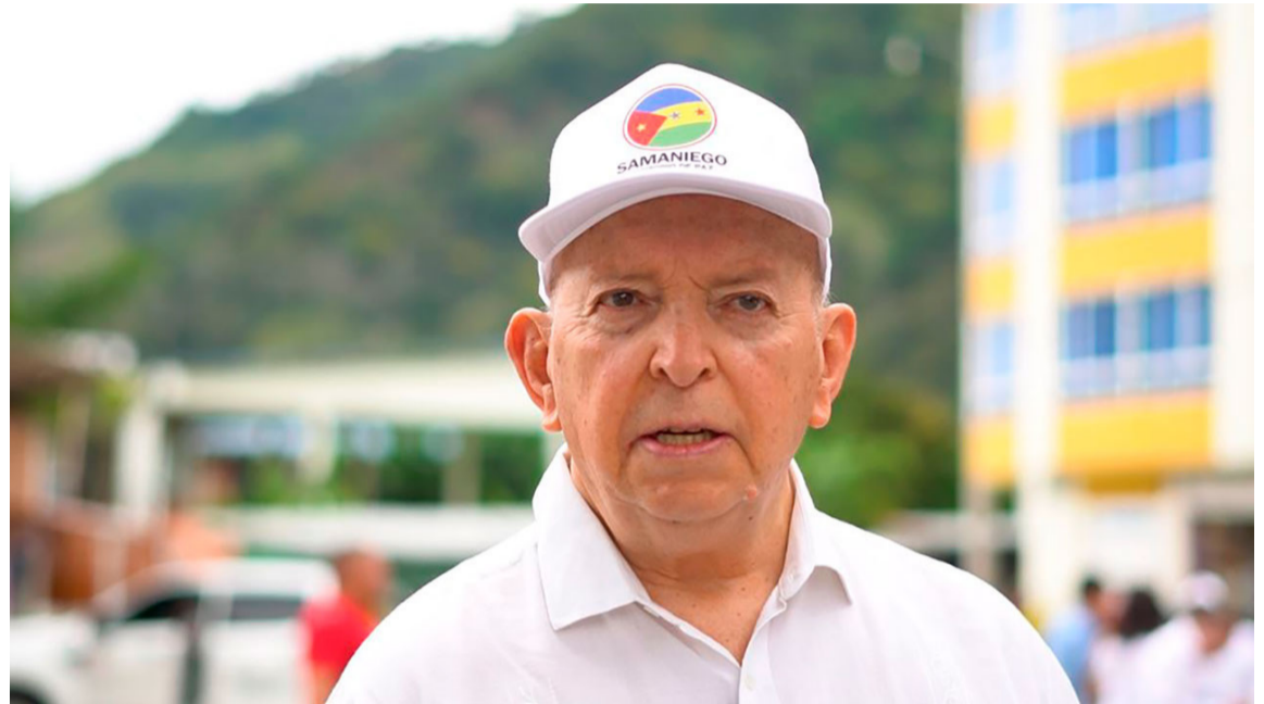
El Comisionado Otty Patiño, dijo que "también es necesario que la paz se territorialice".

El Comisionado de Paz, Otty Patiño, dijo sobre los