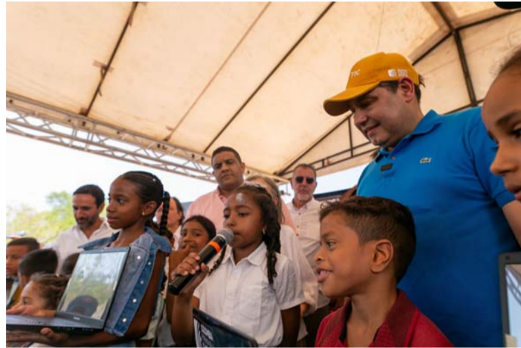
El ministro Mauricio Lizcano conversó con miembros de la comunidad, quienes compartieron su experiencia.

La jornada no solo dejó conectividad para el corregimiento, ya que 20 niños y niñas de la Institución Educativa Villa del Río recibie-