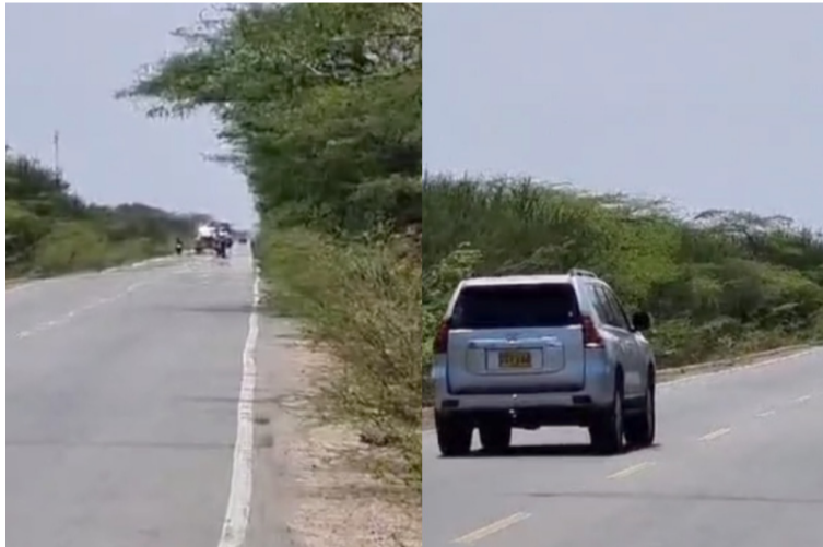
Los 'piratas terrestres' detuvieron a dos automóviles y les hurtaron las pertenencias a pasajeros y conductores.

En horas de la tarde del sábado 9 de marzo, antes de llegar al antiguo peaje de este tramo vial de Uribia hacia Cuatro Vías, sujetos vestidos de negro portando armas de largo alcance sa-