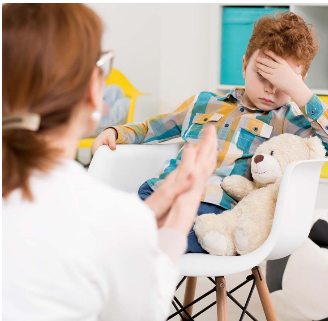
La iniciativa buscará continuar promoviendo políticas a favor de los niños de Colombia.

Con esta iniciativa se buscará continuar promoviendo políticas a favor de los más pequeños de Colombia, quienes deberán tener un acompañamiento y formación constante desde su familia, maestros e instituciones educativas, lo que contribuirá a su salud mental.