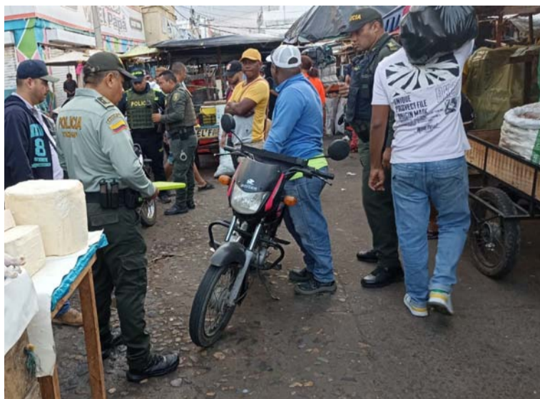
El fin es garantizar la seguridad de los comerciantes, prestadores de servicios turísticos y comunidad en general.

La seccional de Protección de la Policía Nacional, a través de sus Grupos de Protección al Turismo y Patrimonio Nacional, Protección a la Infancia y Adolescencia, en articulación con especialidades del Distrito Especial de Policía Maicao, realizaron una intervención en la calle 10, 11 y 12, entre carreras 16, 17 y 18, zona comercial del mercado público, cuadrante 12 de la ciudad fronteriza de Maicao.