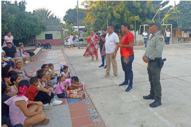
El objetivo es enseñarles a adquirir sentido de pertenencia e identidad hacia los valores culturales y sociales.

mi Ciudad' se realizó en atención al despliegue de acciones de prevención con el fin de contrarrestar el expendio y consumo de sustancias psicoactivas, el respeto y la tolerancia por la convivencia y el exceso de bebidas alcohólicas en espacios públicos, deportivos, recreativos, religiosos, culturales, patrimoniales, lugares donde se desarrollen actividades turísticas entre otros.