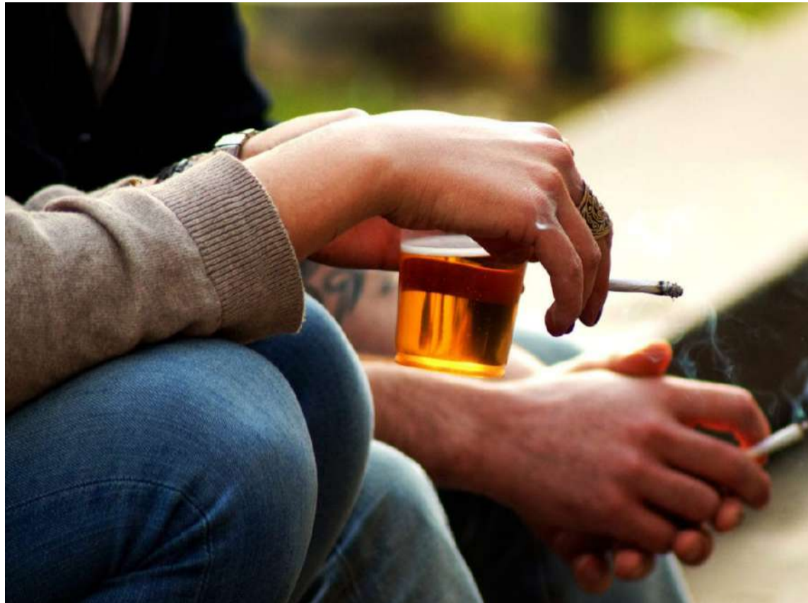
El cáncer de pulmón fue el más frecuente, seguido del cáncer de mama en las mujeres.

de esta enfermedad, recordando que más de un tercio de casos se pueden prevenir y otro tercio se puede curar si se detecta de forma tem-