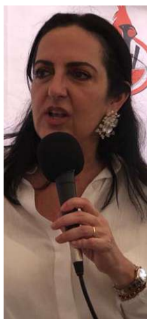
María Fernanda Cabal, senadora.