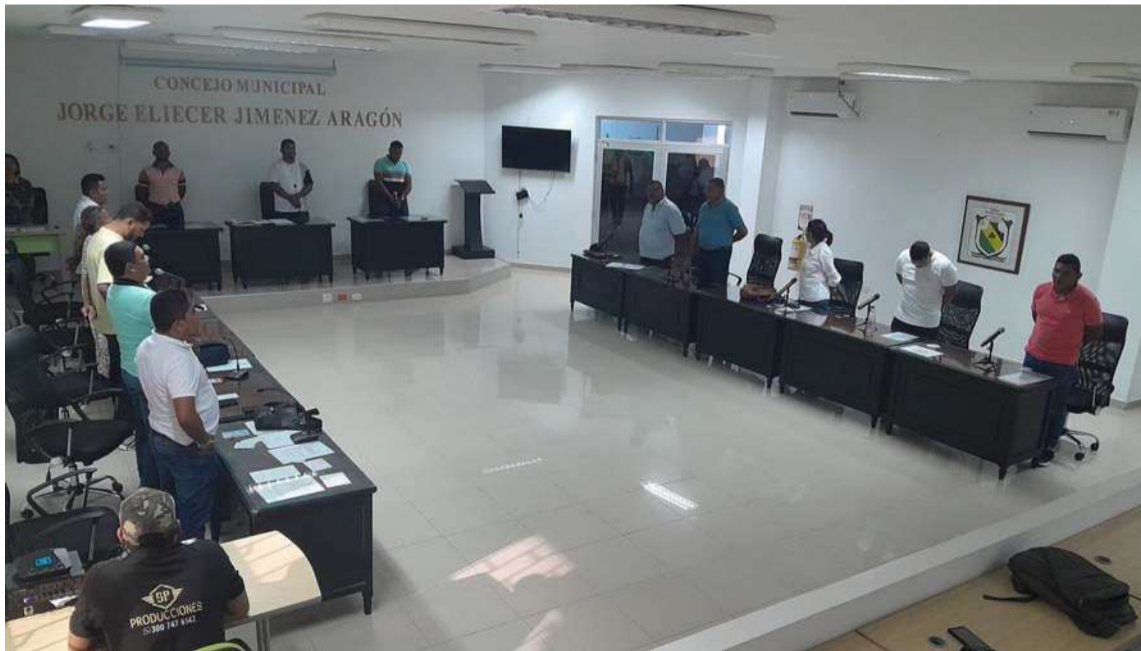
La oposición debe colocar primero los intereses de las comunidades que los eligieron.

De todas formas, en aquellos municipios en donde las alcaldías salientes no eligieron sucesor(a), a estos les