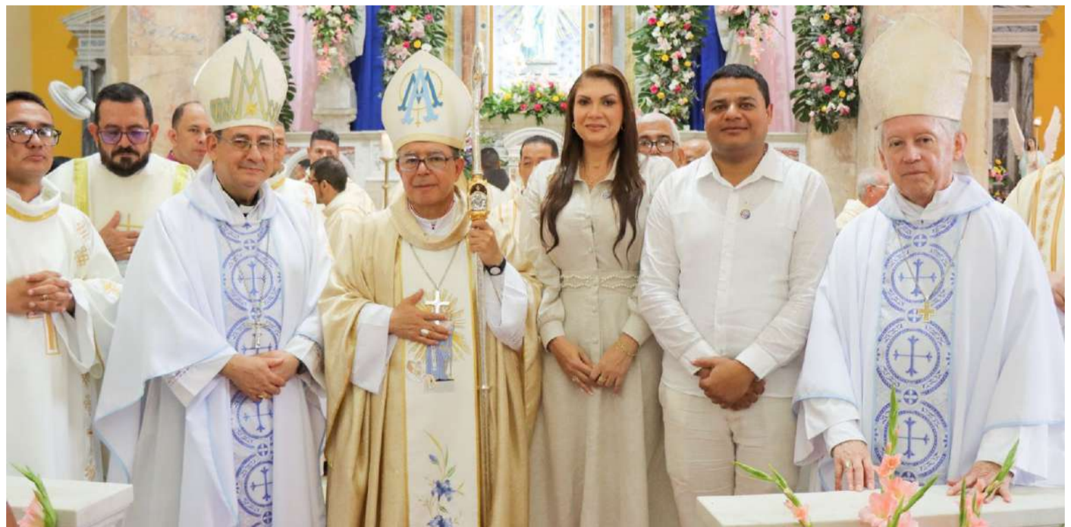
El mandatario coronó a la Virgen junto al cardenal Luis José Rueda, Presidente de la Conferencia Episcopal de Colombia.

meros auxilios y empezar a trabajar con objetivos claros por Riohacha, los cuales quedarán plasmados en el Plan de Desarrollo, el cual empezaremos a construir muy pronto, de la mano de la gente”.