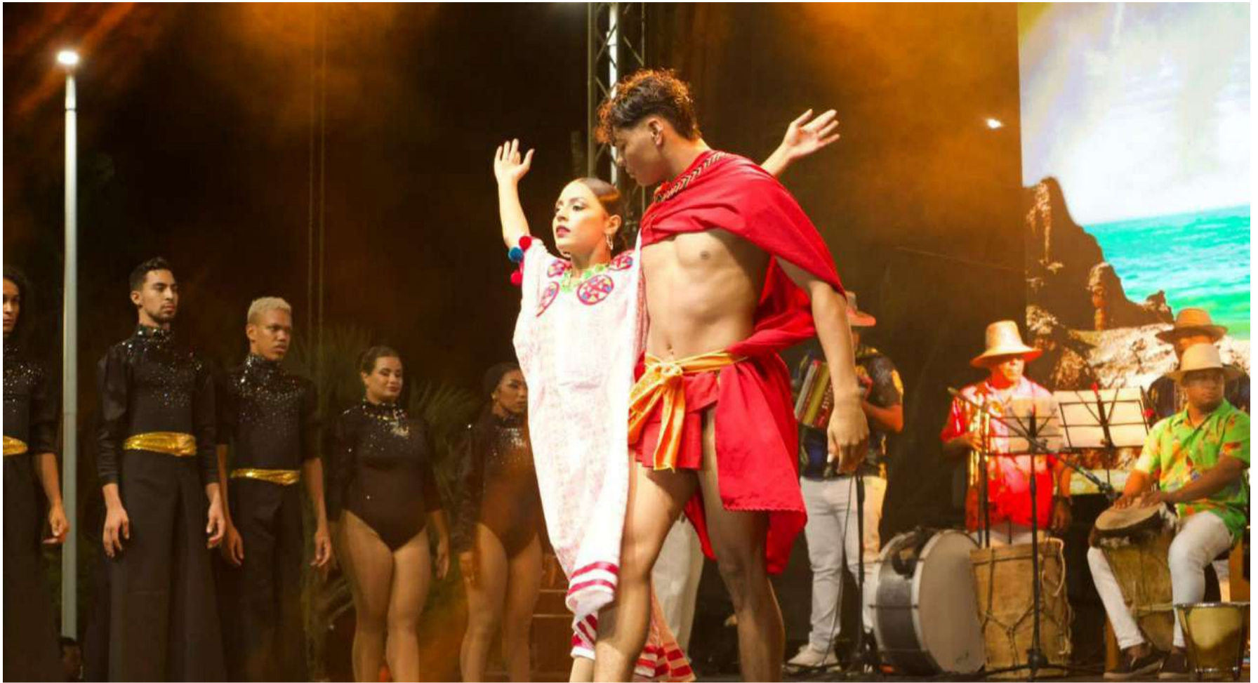
'Eclipse', La Guajira de ensueños', tiene como objetivo el fortalecimiento del sector artístico, creativo, folclórico y cultural del Departamento.