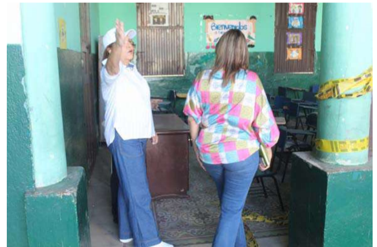
Funcionarios del PAE dijeron que en estas condiciones del colegio no pueden dar las raciones a los estudiantes.

Para mejorar la calidad de vida de la comunidad