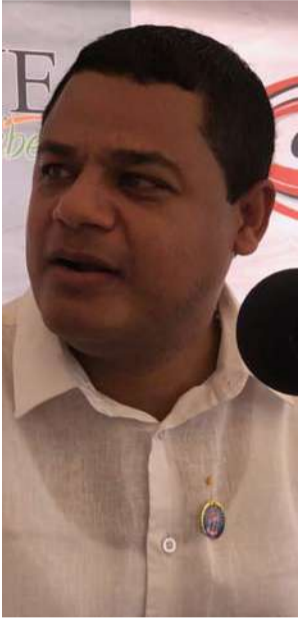
Genaro Redondo, Alcalde de Riohacha.