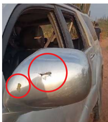
La camioneta recibió varios disparos.

Al parecer cinco personas resultaron heridas cuando se movilizaban en una camioneta y fueron sorprendidos por hombres fuertemente armados que dispararon en varias oportunidades para que se detuvieran y así cometer un atraco.