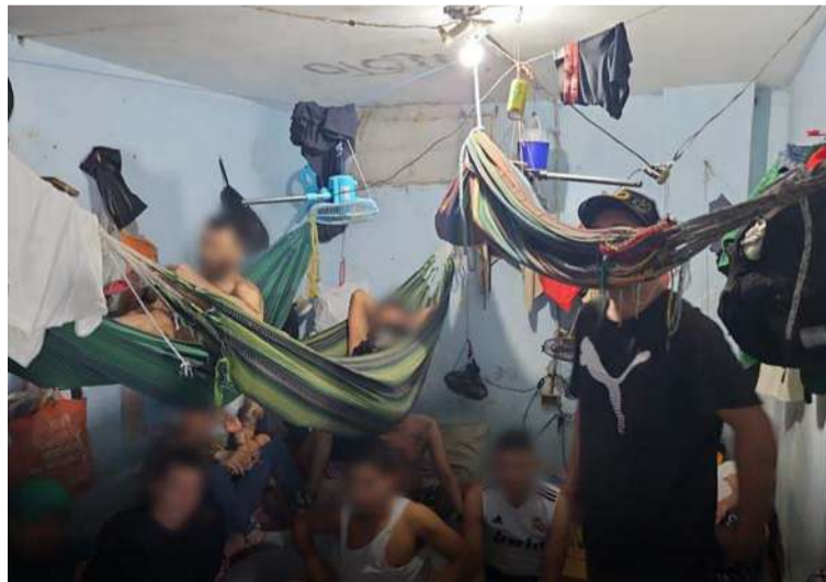
En el sitio hay infectados con VIH, afecciones en la piel y enfermedades respiratorias que no son valoradas por médicos.

De acuerdo a lo expuesto, lo primero que descubrió la comisión que ingresó durante la jornada de visitas, fue que los encuentros familiares, que incluyen la presencia de menores de edad, se realizan simultáneamente y en los mismos espacios con las visitas conyugales, en las cuales los reclusos sostienen relaciones sexua-