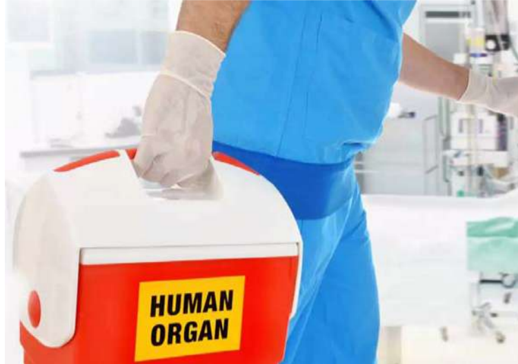
El instituto coordinará y operará el Sistema Nacional de Donación y Trasplante de Órganos y Tejidos en Colombia.

Este instituto, adscrito al Ministerio de Salud, tiene como objetivo coordinar y operar el Sistema Nacional de Donación y Trasplante de Órganos y Tejidos en Colombia. Busca cumplir con