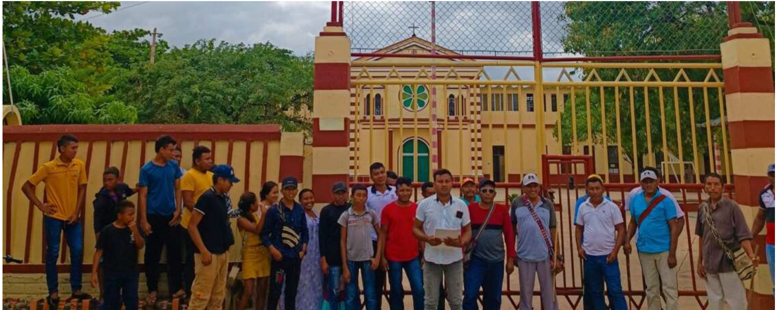
El Internado de Aremasain tuvo su embrión en el orfanato de San Antonio de Pancho que fue clausurado por inundaciones.

Después de haber descendido en el análisis de los documentos que en nuestra actividad en la Academia de Historia hemos conocido, estos reclamantes no tienen la razón, por el contrario, las vías de hecho que han