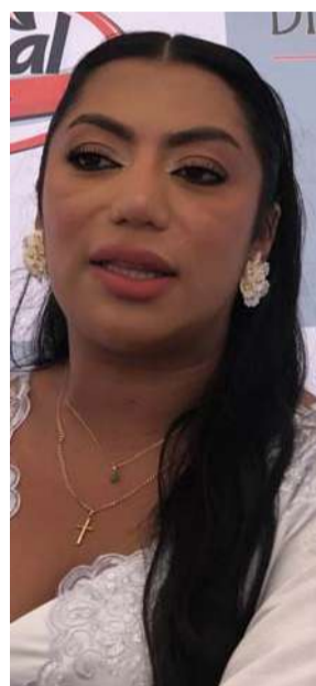
Martha Peralta Epia-yu, senadora.