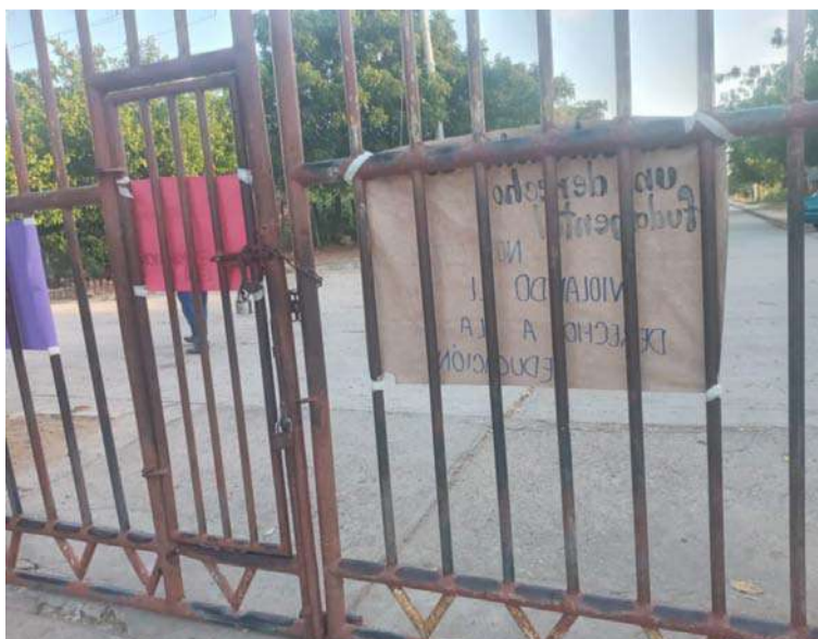
Algunas familias wayuú, posiblemente mal informadas, han desplegado una inexplicable actividad de bloqueo.

Monseñor, el argumento de la fuerza jamás ha triunfado sobre la fuerza de los argumentos, dice el artículo 44 de la Constitución Política que los derechos de los niños prevalecen sobre los demás derechos, y a los habitantes de Aremasain, donde está mi Santo Patrono que decía mi Santo Patrono que lo malo no es lo malo que hace la gente mala, sino el silencio de la gente buena ante las cosas malas que hace la gente mala!