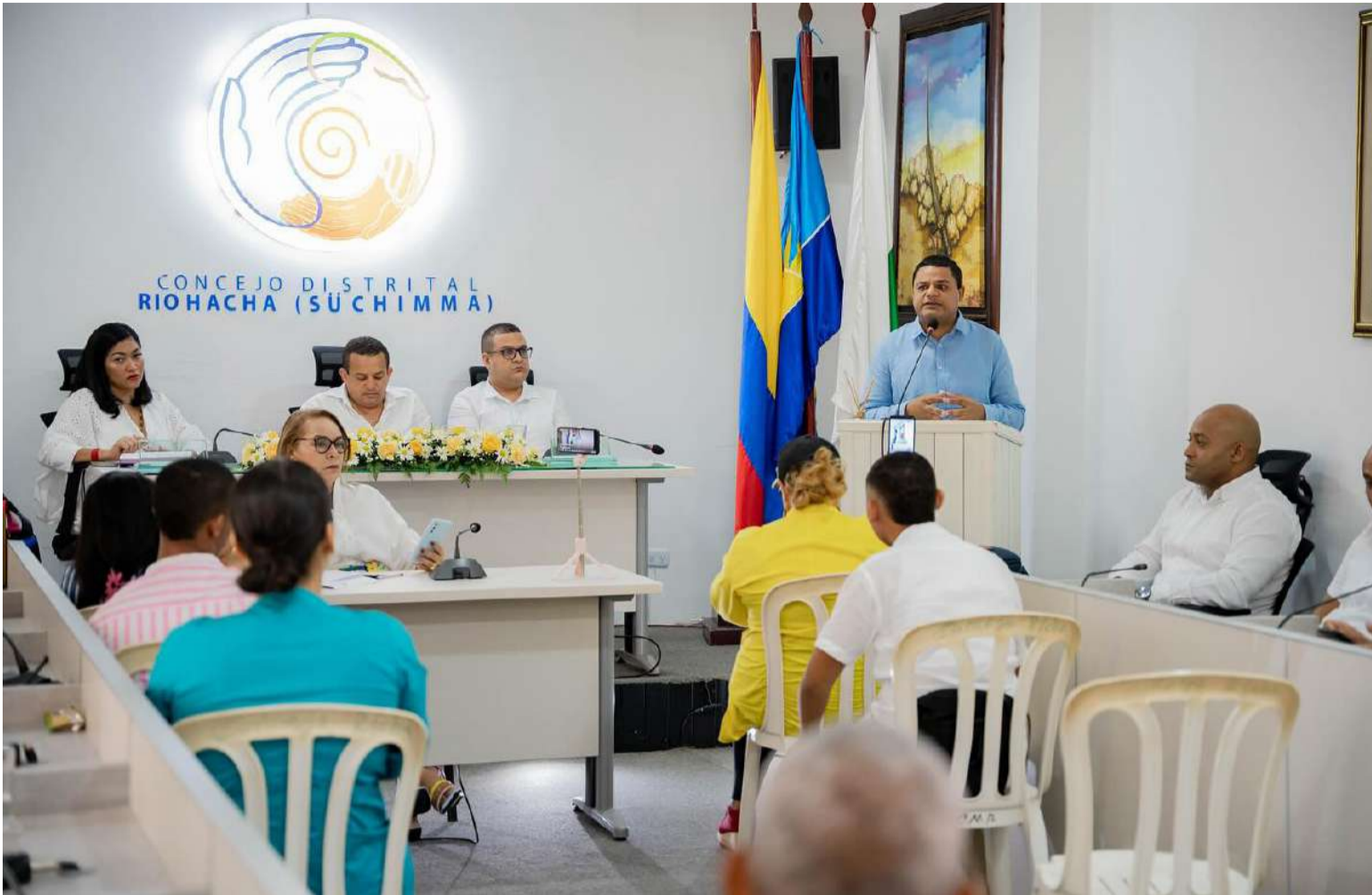
En el primer semestre de este año, el presupuesto y el Plan de Desarrollo que se ejecutan son del Gobierno anterior.