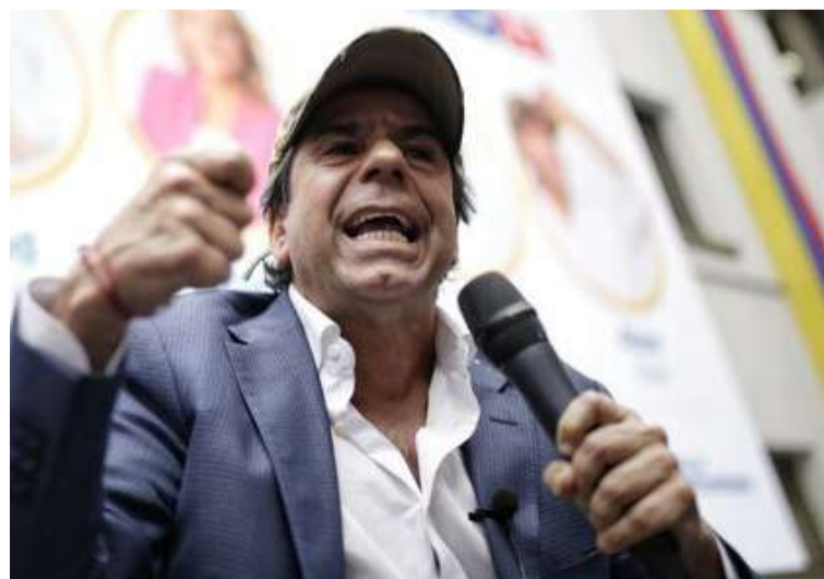
Char dijo que se necesitan esos recursos inmediatamente para impulsar el deporte en la ciudad de Barranquilla.

El alcalde de Barranquilla, Alejandro Char, señaló que luego de la decisión tomada de manera unilateral no pueden permitir que el dinero depositado siga en manos de Panam Sports.