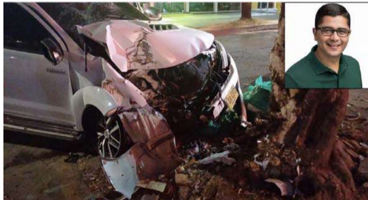
El siniestro se registró cuando el concejal iba a bordo de una camioneta Toyota Hilux, que impactó contra un árbol.