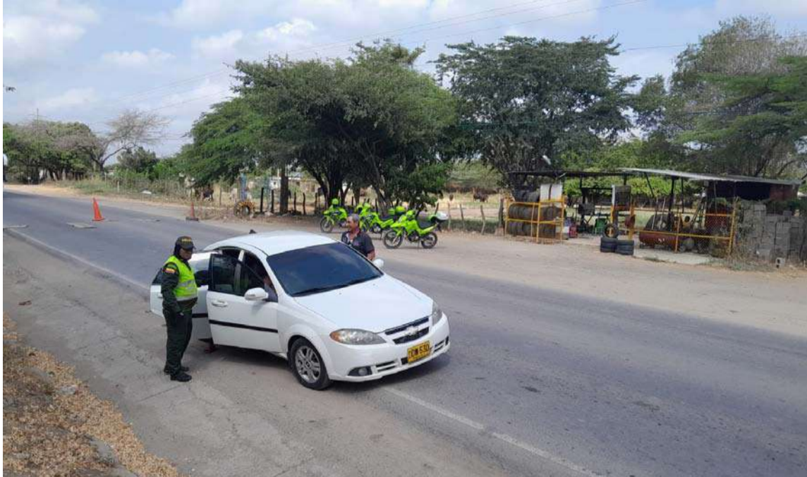
Las actividades de registro y control se desarrollan en sectores estratégicos del municipio.

Con el propósito de evitar la compra y venta de estupefacientes, la Policía Nacional viene realizando una serie de operativos sobre la vía que comunica la cabecera municipal de Albania con el corregimiento de Cuestecita.