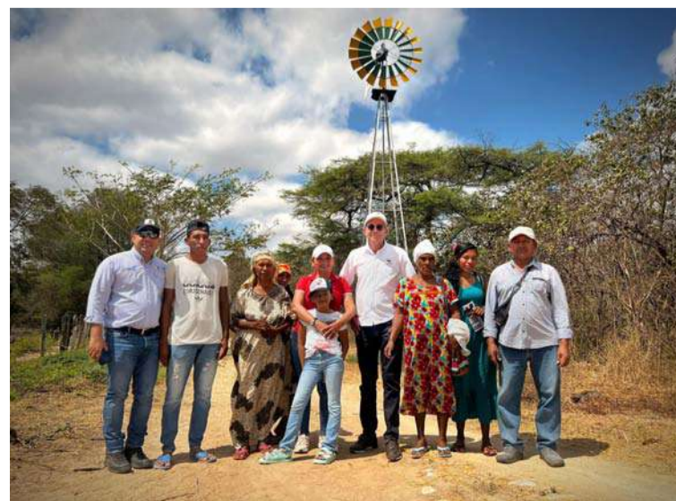
Las obras cobran gran relevancia en esta temporada debido a la escasez de precipitaciones y efectos del Fenómeno de El Niño.