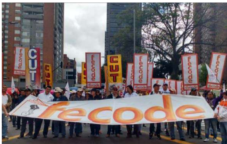
Fecode y la CUT dijeron que "es necesario que el próximo jueves se conozca finalmente el nombre de la nueva fiscal".

Una nueva jornada de manifestaciones es convocada en Colombia, en esta ocasión lideradas por sindicatos de maestros y trabajadores, quienes han instado a la ciudadanía a unirse a las movilizaciones el próximo 8 de febrero.