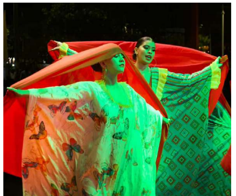
Se contó en tarima sobre el Carnaval a través de los bailes el 'Pilón riohachero' y 'La Colita', y la celebración de la 'Vieja Mello'.