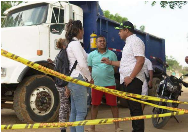
Durante la jornada, el mandatario Genaro Redondo Choles visitó las casas del barrio Las Marías y sus alrededores.

gente, concientizando a la ciudadanía sobre la importancia de tener una ciudad limpia. También estamos aquí diciéndole a la gente que vamos a trabajar con ellos, vamos a seguir en las calles, en los barrios, en las comunas, queremos hacer un gobierno de la mano de la gente”, aseguró el alcalde.