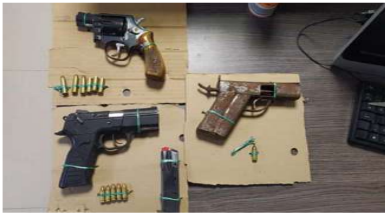
Se logró incautar las armas que portaban los sujetos y con las cuales dispararon contra los uniformados.

aún permanece sin identificar en la morgue de Medicina Legal de Riohacha.