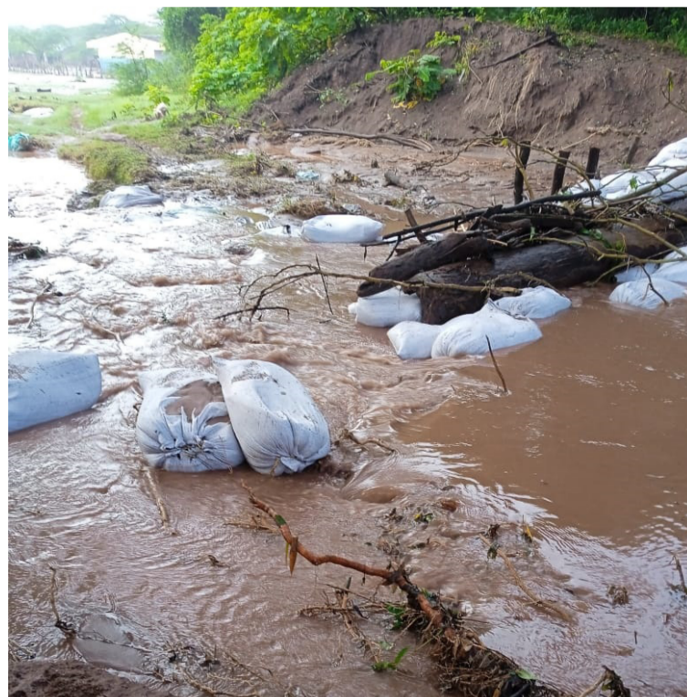
El río que surtía su precioso líquido a tanta gente productiva de Villanueva, ya es una quimera, solo quedan sus leyendas.