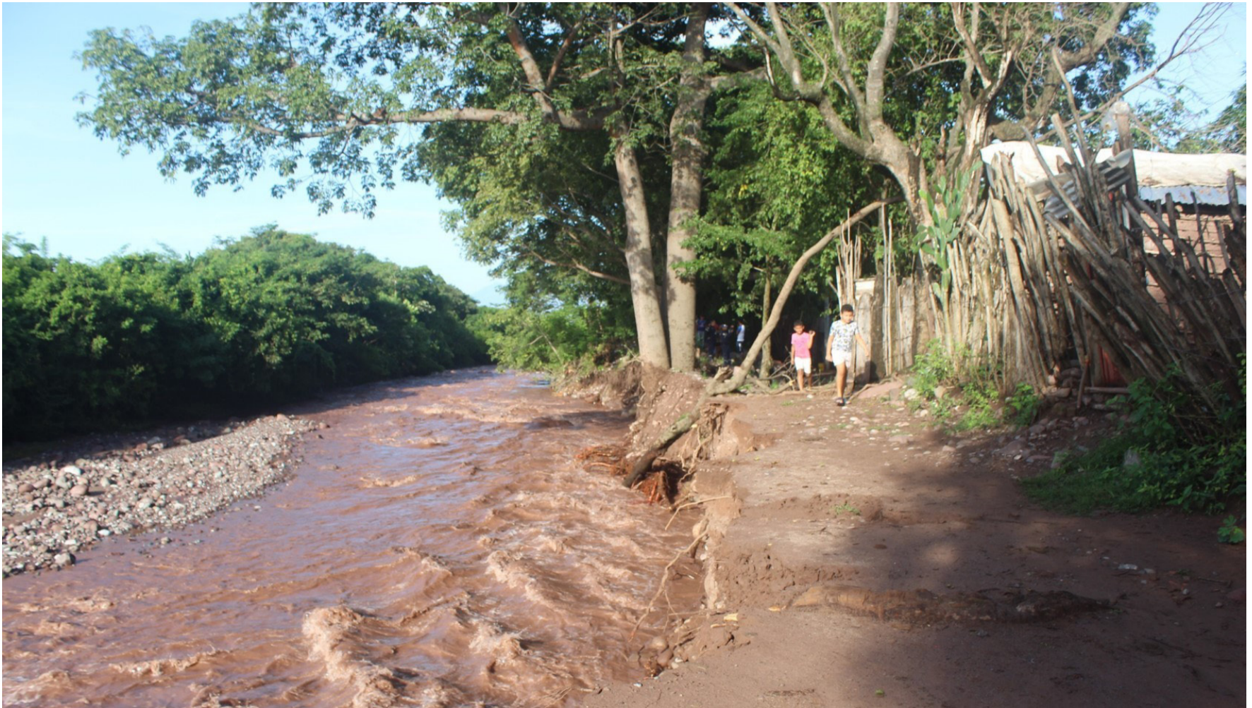
El caudal del río Villanueva estaba por encima de 1.000 litros por segundo y vino luego el caos; la marihuana y amapola arrasaron de un tajo.

Como un rey de la montaña fluía a cántaros desde la misma Serranía