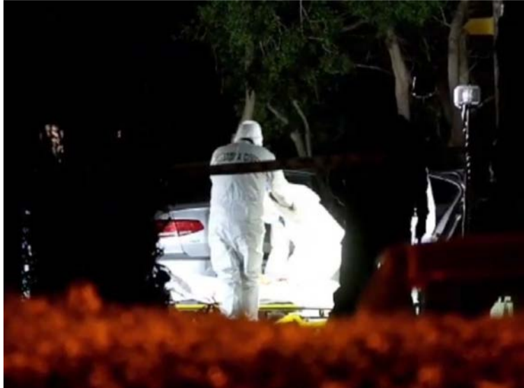
Las autoridades españolas de la ciudad de Valencia, realizaron las labores de reconocimiento del cadáver.

Las autoridades locales, la policía local de Valencia y la Guardia Civil, ya están al frente de la investigación de este caso para identificar a los autores del ataque.