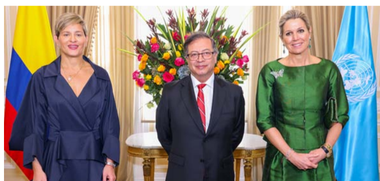
El presidente Petro recibió con su esposa Verónica Alcocer a la reina Máxima de Países Bajos, asesora de la ONU.

En el inicio de su recorrido, le presentaron una colección de artesanías colombianas con marca de origen, desde cestería de caña flecha, werregue, tamo de trigo y barniz soplado de pasto, hecha por artesanos de Córdoba, Bolívar, Chocó y Nariño; hasta una muestra de piezas de joyería de filigrana de Mompo, en oro, plata y esmeraldas.