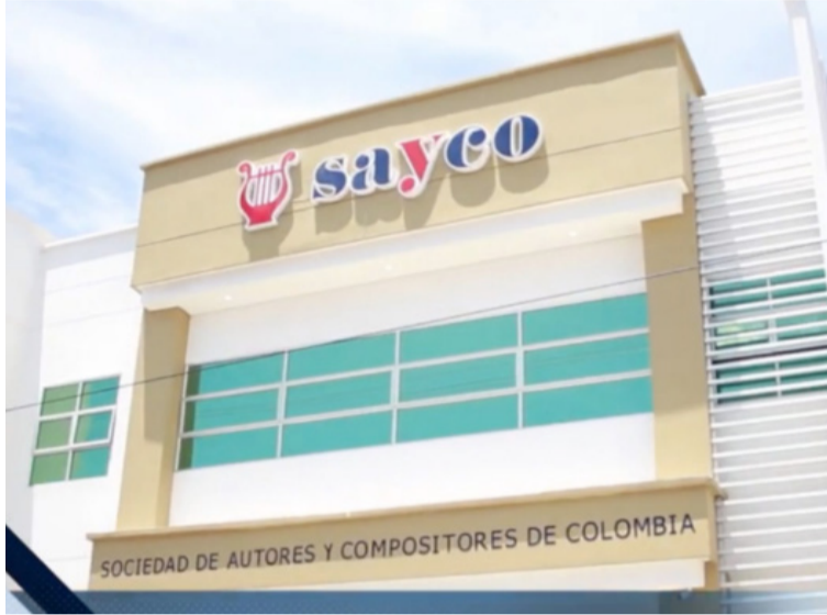
De acuerdo al fallo, el Distrito deberá pagar a título de reparación del daño antijurídico ocasionado a Sayco.

El Juzgado Tercero Administrativo oral del Circuito de Riohacha condenó al Distrito de Riohacha para que le pague a la Sociedad de Autores y Compositores, Sayco, la suma de siete millones ochenta y cuatro mil pesos con noventa y un centavos ($7.084.000,91), por haber permitido la sonada de varias canciones administradas por Sayco, sin su previa y expresa autorización de la sociedad de gestión colectiva el día 24 de junio de 2017, en el sitio de inicio centro comercial Viva y terminando en la calle 1 - sector de la playa, frente a Anas Mal, en el evento llamado 'K festival Color Neón