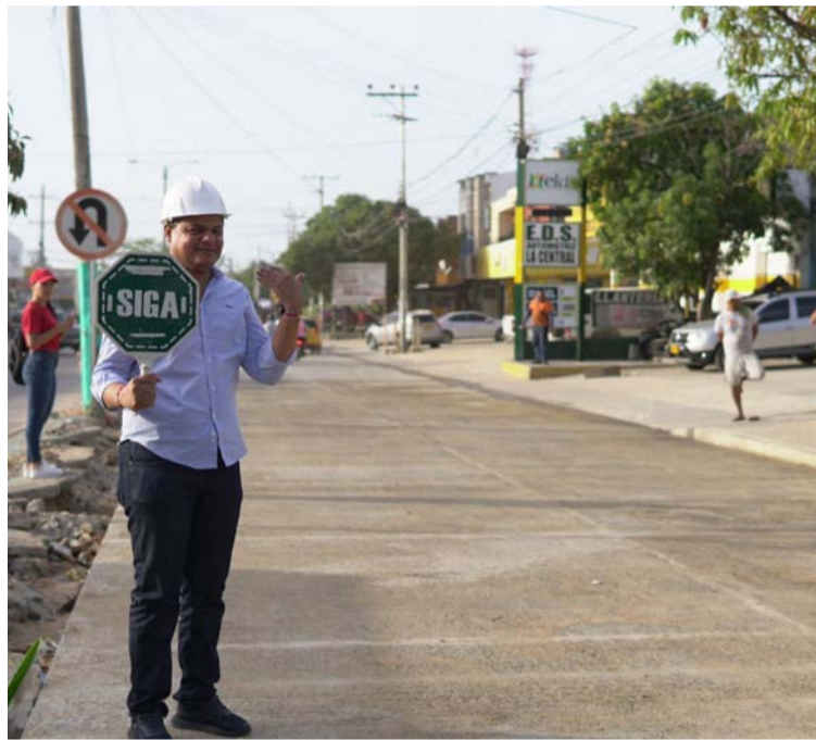
Dijo el alcalde que la intervención de la obra comprende la optimización de redes de acueducto y alcantarillado.

Los conductores de taxi, mototaxi y transporte colectivo indicaron que agradecen que se vaya terminando esta obra. "La movilidad en