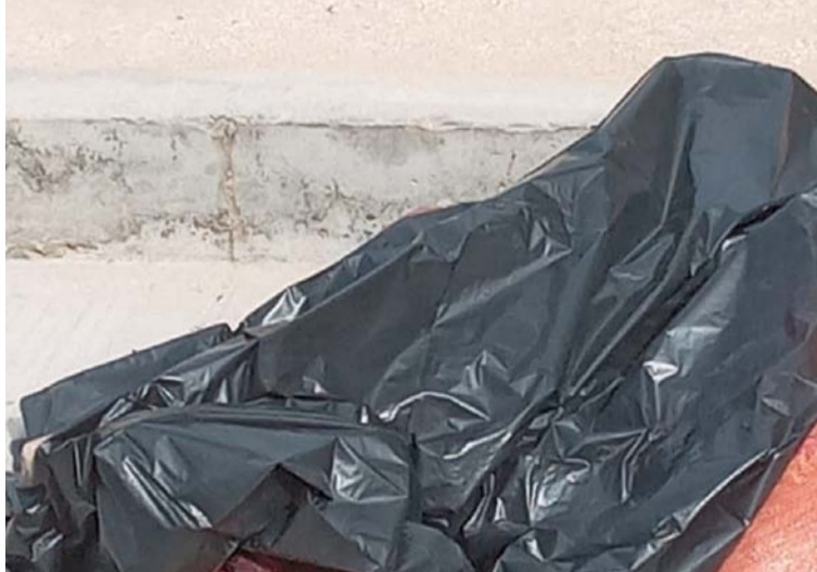
En uno de los sacos se encontraba la cabeza de esta persona que presentaba signos de tortura y dos impactos de bala.

Los investigadores luego de conocer que en la vía principal del corregimiento de Juan y Medio en horas de la madrugada del martes encontraron los costales y bolsas negras llegaron