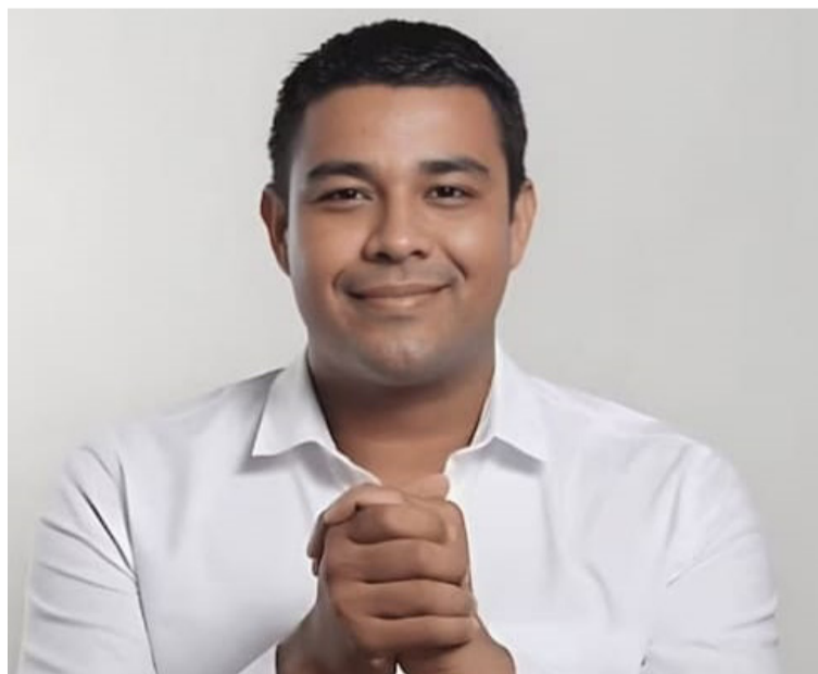
Las declaraciones de Víctor Meza plantean una nueva dimensión al escándalo, sugiriendo una posible complicidad.

Recientemente el director de Ungrd lideró la puesta en marcha de 45 vehículos cisterna 'carrotanques' en la capital de La Guajira,