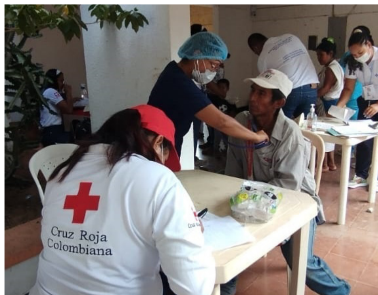
Con el Instituto Colombiano de Bienestar Familiar, Icbf, se les está también brindando alimentos a toda la población.

Indicó además que siguen a la espera del acta del Comité de Justicia Transicional para activar el acompañamiento de la Cruz Roja Nacional a través de Gestión del Riesgo. "Como institución de carácter humanitario es nuestro deber y compromiso mitigar los sufrimientos ocasionados por el desplazamiento forzoso de esta comunidad y en especial las poblaciones infantiles y adultas mayores que son más vulnerables", advirtió Cortés Mindiola.