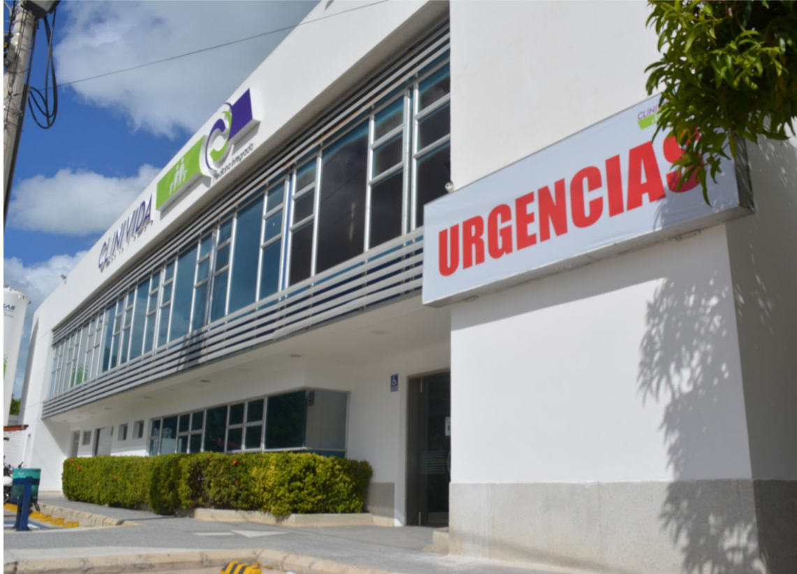
Pese al hermetismo de la Policía se conoció que hay dos personas gravemente heridas.

Según se pudo conocer por medio de una fuente que pidió no ser identificada por su seguridad, este suceso inició en el barrio Nazaret, cuando sujetos armados llegaron a un establecimiento de