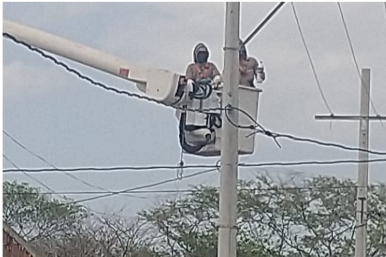
La comunidad agradeció el apoyo de las autoridades ya que las abejas fueron alejadas de la zona de peligro para la gente.

Los habitantes se mantenían en constante zozo-