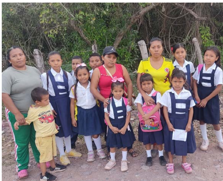
Las mamás están pidiendo una pronta solución ya que sus pequeños hijos e hijas son los más afectados.

Caminar más de dos kilómetros que separan a la única escuela rural de las fincas ubicadas en la vereda Juncalipito, jurisdicción del municipio de Villanueva, se ha convertido para los estudiantes y padres de familia en una odisea ya que en esta ruta no cuentan aún con el transporte escolar.