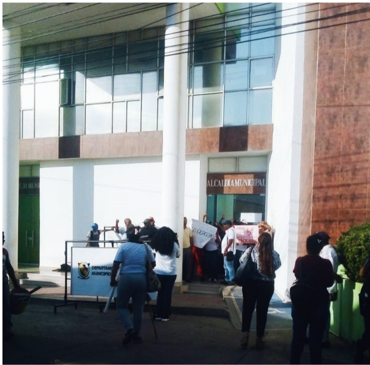
Profesionales que concursaron y ganaron, reclaman que les sean entregados los cargos por los que participaron.

En año 2021 se realizó una convocatoria a nivel nacional de concurso de méritos en donde se ofertaron alrededor de 76 cargos entre los cuales están coordinador de deportes, de cultura, inspector de policía y otros más. Para el año 2022 se identificaron unos errores por parte de la empresa que realizó el concurso, por lo que se realizó una investigación por parte de la Procuraduría General de la Nación, lo que hizo que la entrega de los cargos se demorara y empezaran a eje-