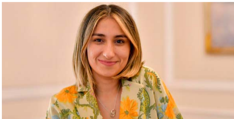
La nueva directora del Dapre, Laura Sarabia, llega a reemplazar en el cargo a Carlos Ramón González.

Este proyecto de ley también otorga facultades al Ministerio de Trabajo para ampliar el número de salas de decisión de las Juntas de Calificación de Invalidez, con el fin de garantizar un eficiente y oportuno reconocimiento de los derechos a la seguridad social especialmente para las regiones, y refleja el compromiso del Gobierno con la mejora continua del sistema de calificación de invalidez en Colombia, asegurando un proceso justo y transparente para todas las y los ciudadanos colombianos.