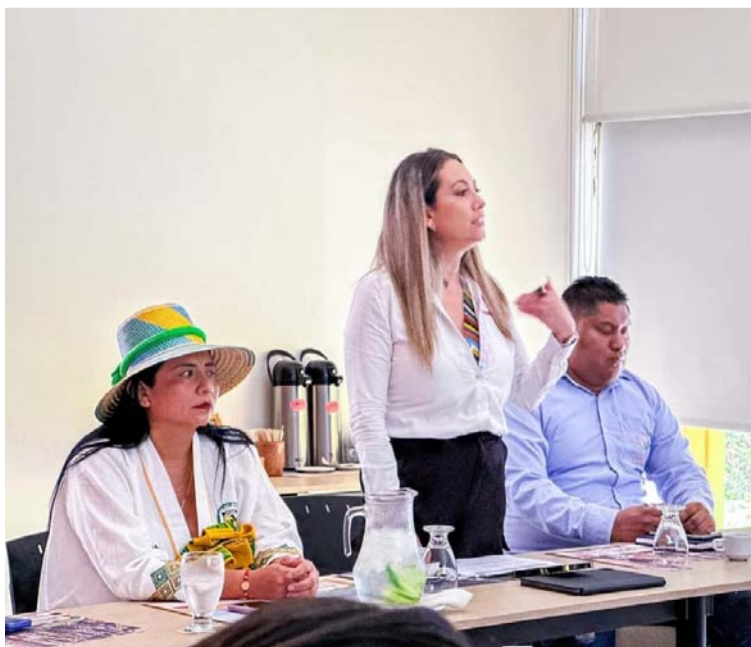
La alcaldesa dijo que Albania es una población pluricultural que merece apostarle al turismo “para mostrar lo que son”.