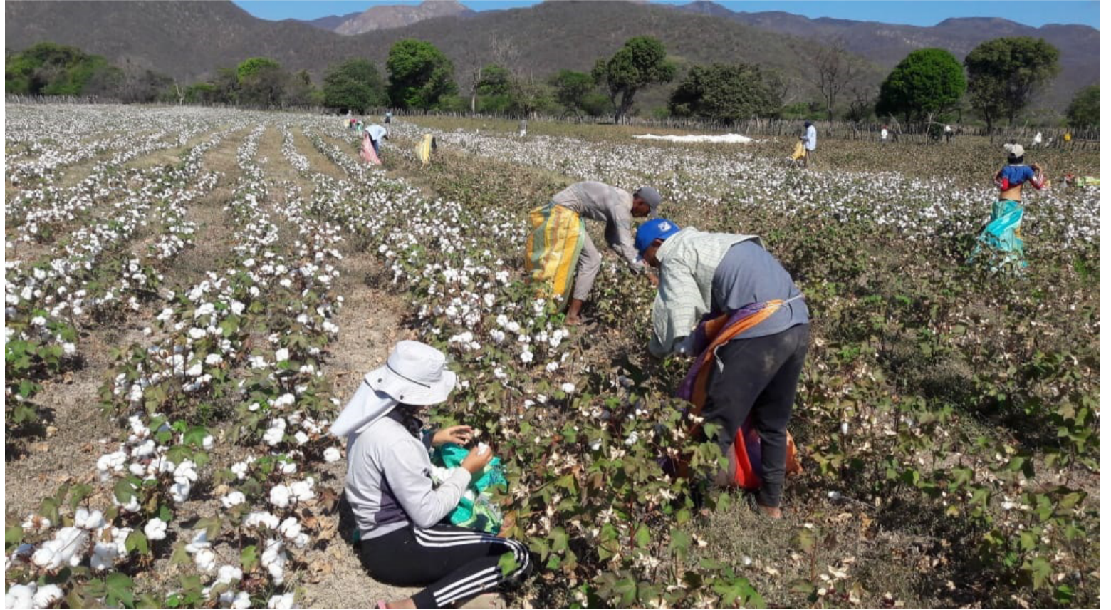
El cultivo del algodón le trajo algunos beneficios a San Juan del Cesar ya que generaba mucha mano de obra.