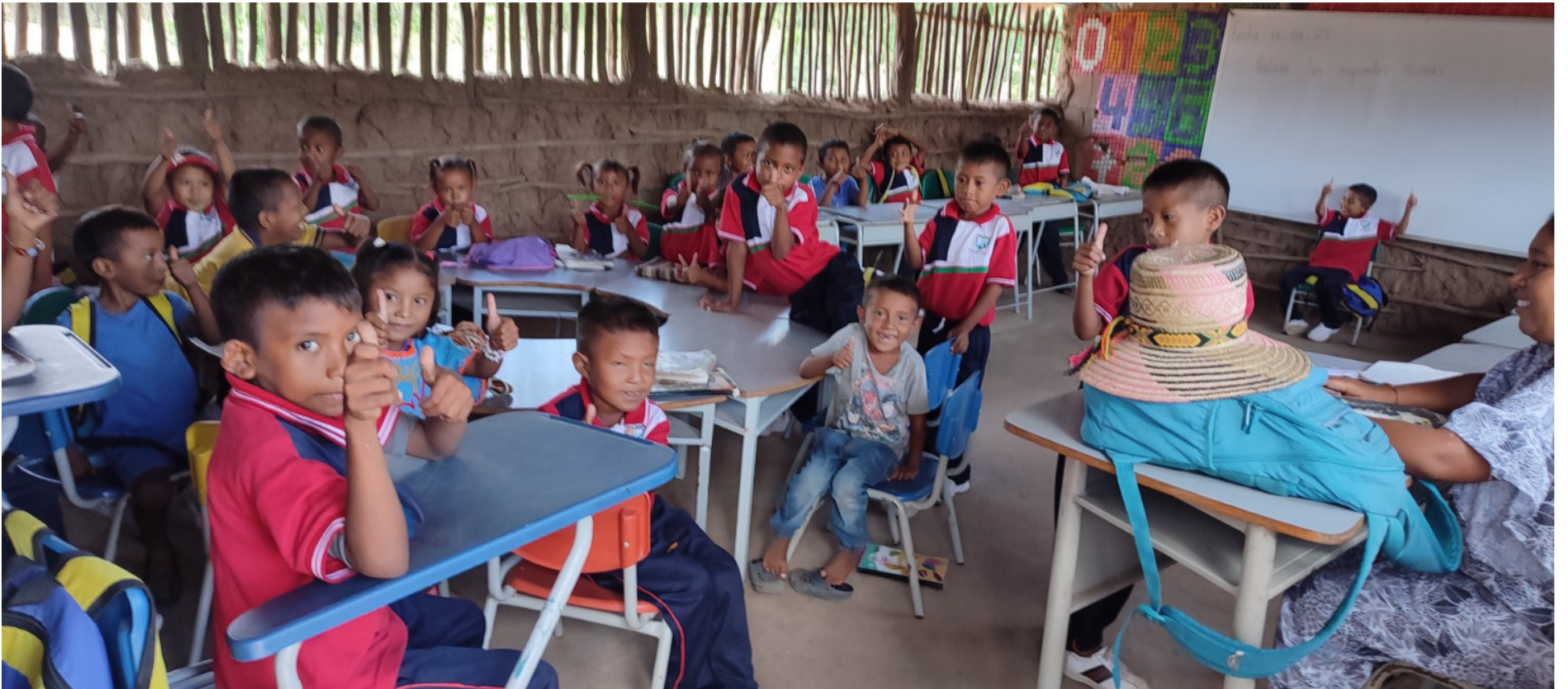
En los internados indígenas de Aremasain, Nazareth y en Ziapana, los docentes tienen como función no dejar perder la lengua materna.

Esta pérdida lleva al final de una identidad cultural