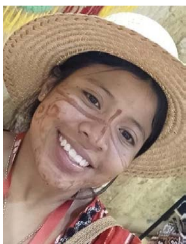
Los indígenas wayuú están orgullosos de su lengua.

nonuya, nukak, ocaina, piapoco, piaroa, piratapyo, pisamira, puinave, sáliba, sikuani, siona, siriano, taiwano, tanimuca, tariano, tatuyo, tikuna, tinigua, tucano, tucuná, tuyuca, uito, uwa, wanano, wayuunaiki, wounaan, yagua, yanuro, yuhup, yukpa, enverachami y yuruti.