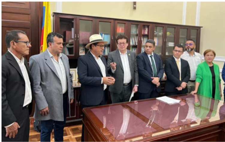
Este proyecto otorga facultades a Mintrabajo para ampliar número de salas de las Juntas de Calificación de Invalidez.

nerar las condiciones para que estas instancias sean imparciales, transparentes,