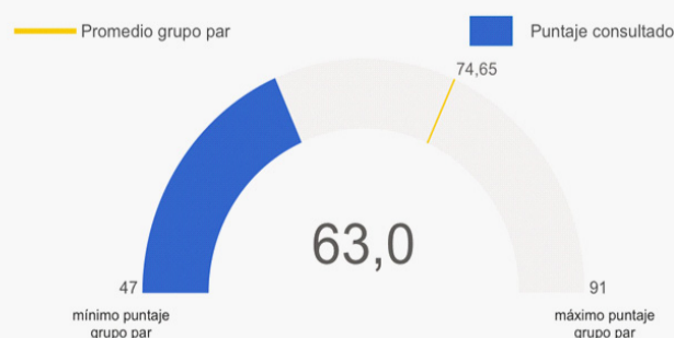
Índice de Desempeño Institucional Gobernación de La Guajira – 2022 - Dafp