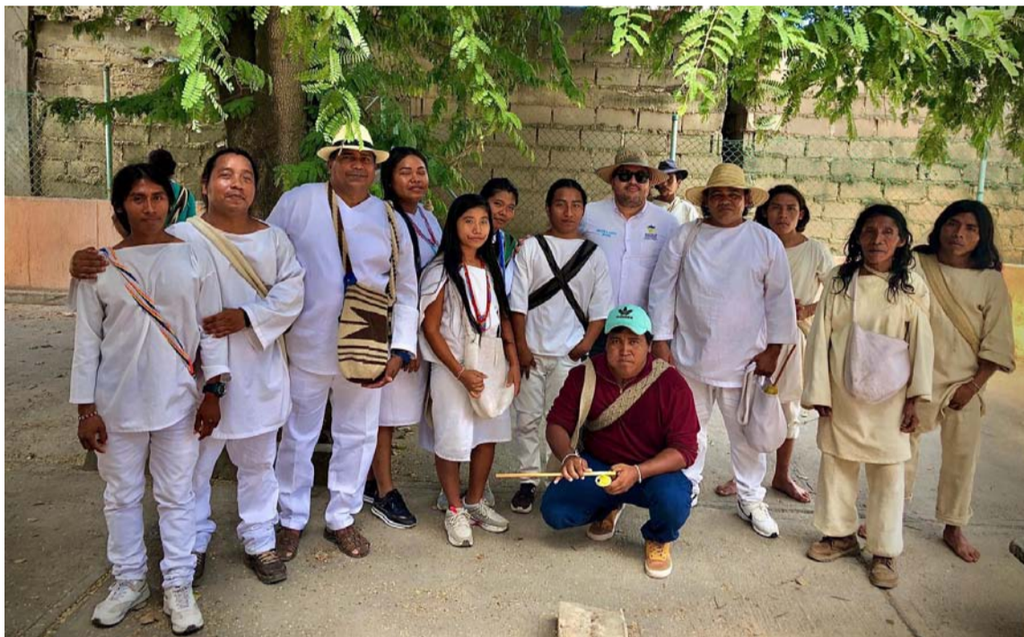
En la actualidad perviven en todo el territorio colombiano 68 lenguas nativas.

Cabe destacar que en la actualidad existen 68 lenguas nativas en el territorio colombiano como lo son: achagua, andoque, awapit, bará, barasano, barí ara, bora, cabiyari, carapana, carijona, cocama, cofán, cuiba, curripaco, damana, desano, embera, ettenaka, hitnu, guayabero, ika, inga, kakua, kamsá, kichwa, kogui, koreguaje, kubeo, kuna tule, macuna, miraña, muinane, namtrik, nasa-yuwe,