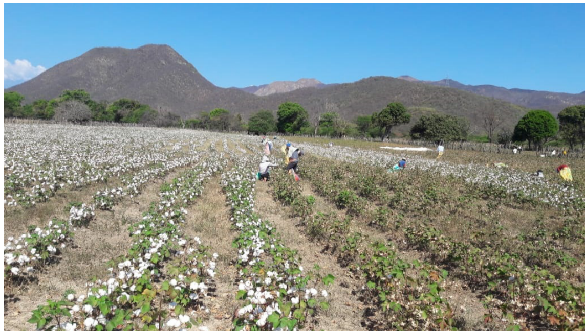
La recolección del algodón era una actividad que representaba un ingreso de mucha ayuda.