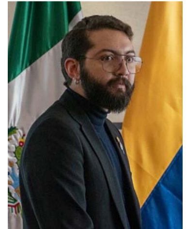
El video político sería a un diputado mexicano.

Con la apertura de la indagación, la Procuraduría busca identificar a los posibles autores de la falta y determinar la procedencia de una investigación disciplinaria.