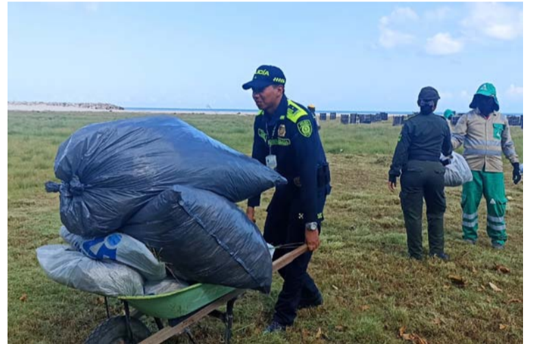
El objetivo de esta iniciativa es sensibilizar a la comunidad sobre la importancia de no arrojar basura que contamina.

El Grupo de Prevención y Educación Ciudadana del Departamento de Policía Guajira seguirá trabajando incansablemente en la ejecución de acciones que promuevan el bienestar y la convivencia pacífica en la región.