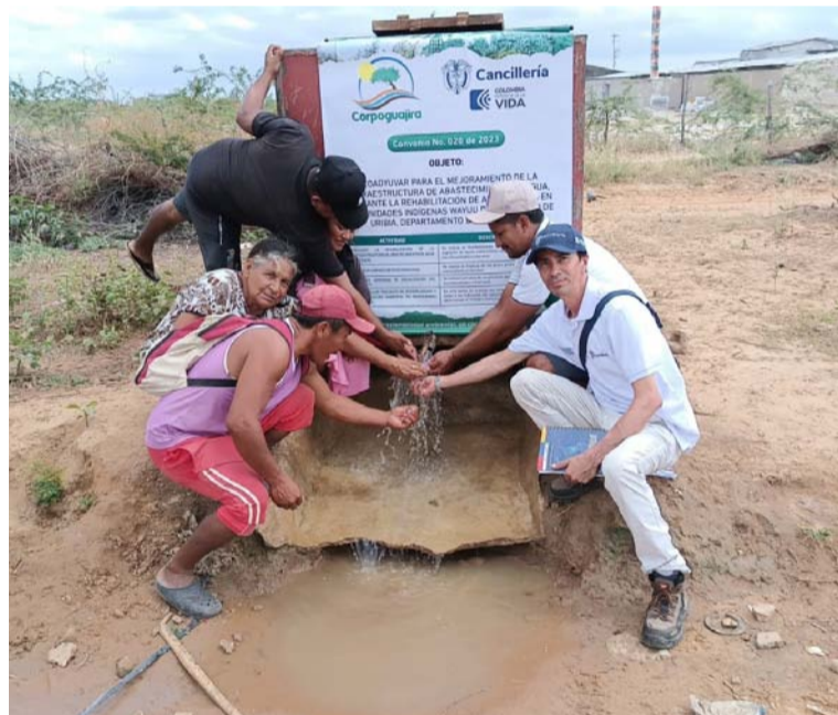
El proceso se hizo mediante el Convenio Interadministrativo 020 de 2023, suscrito con la Coproguajira.

ción y los equipos conjuntos avanzaron en la construcción del modelo de la operación técnica y el plan de trabajo en las 74 comunidades wayuú que serán atendidas.