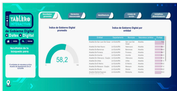
Índice de Gobierno Digital 2022 – Alcaldías de La Guajira - MinTic