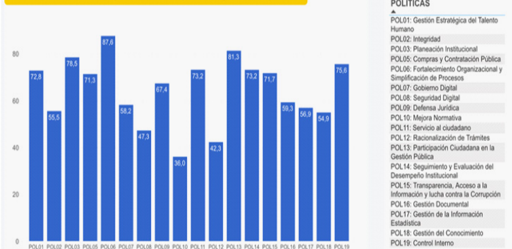
Índice Políticas de Gestión y Desempeño Institucional Alcaldías de La Guajira – 2022 - Dafp