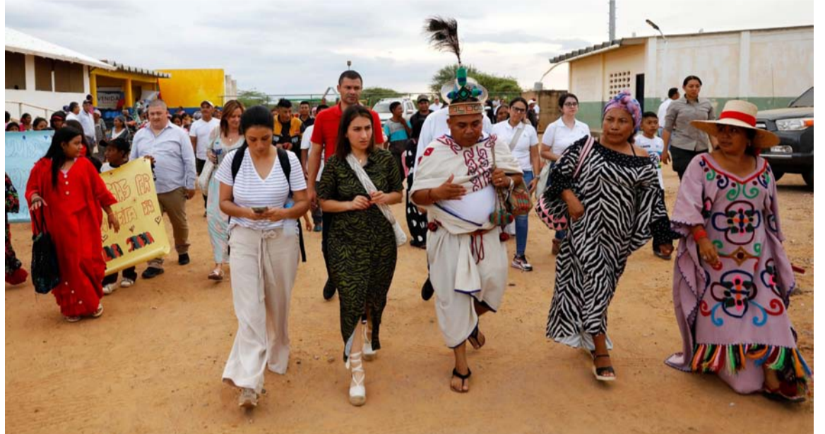
Se atienden necesidades básicas en materia de seguridad alimentaria, agua y energía.

Con esta estrategia de intervención integral más de 3.600 hogares wayuú recibirán soluciones reales y duraderas para mejorar la calidad de vida de los habitantes del Departamento, especialmente de las comu-