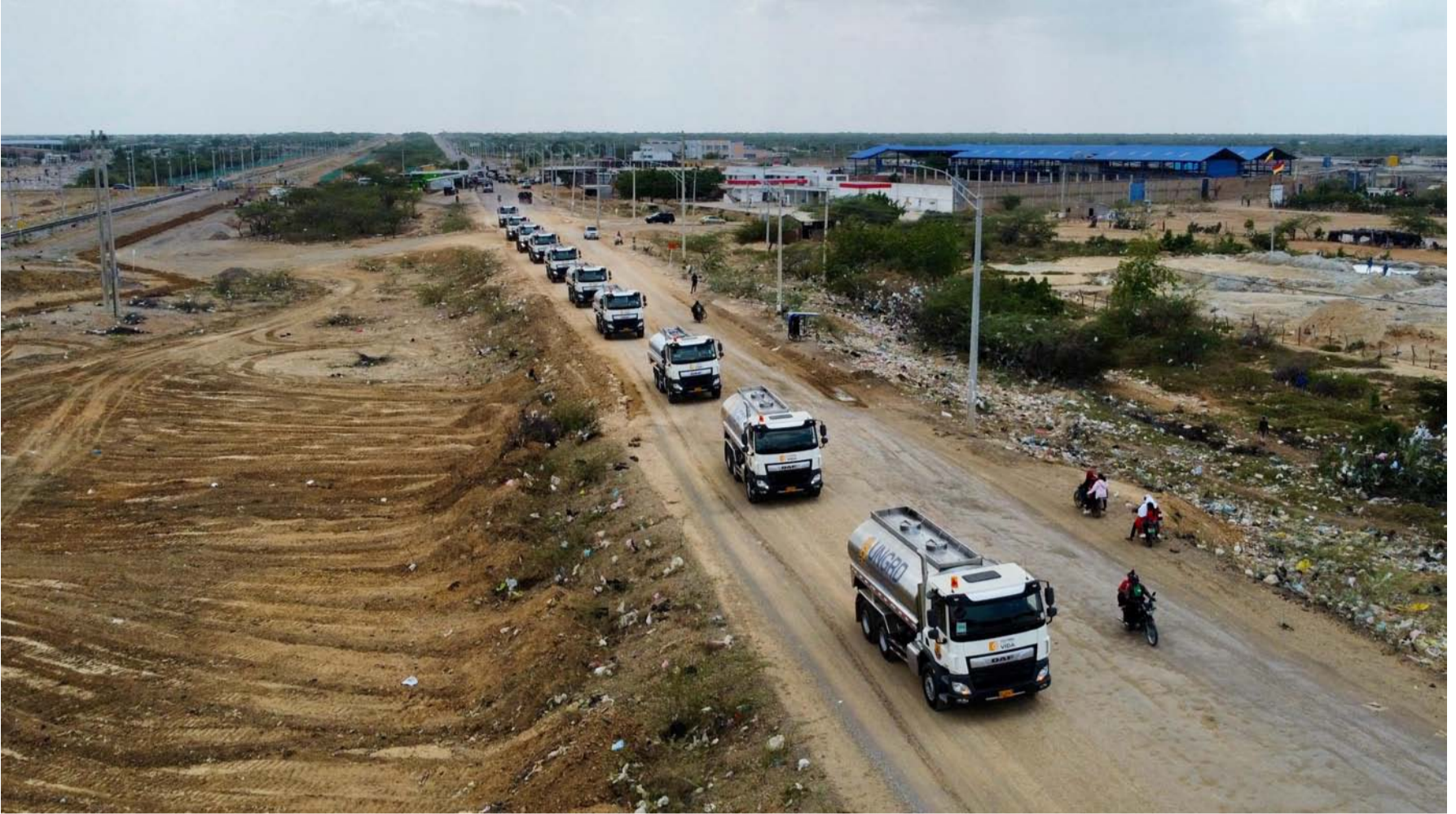
El valor de los carro-tanques incluyó ensamblaje, compra de chasis, montaje del tanque, matrícula, Soat, y combustible para traslado.

La adquisición se realizó bajo régimen especial