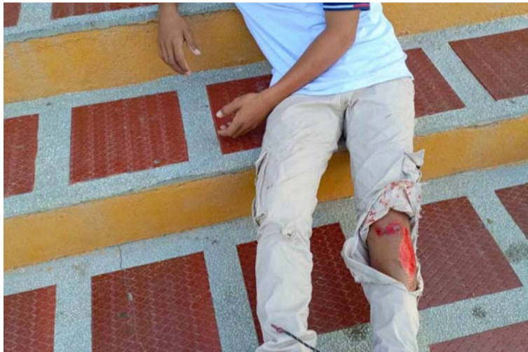
El menor tuvo lesiones delicadas en su pierna izquierda debido a que se cayó de la moto al pasar por una batea.

Un padre de familia indignado por la situación que hasta la fecha 20 de febrero, ya para culminar el mes, aún no se ha contratado el transporte escolar, denunció que los menores de edad