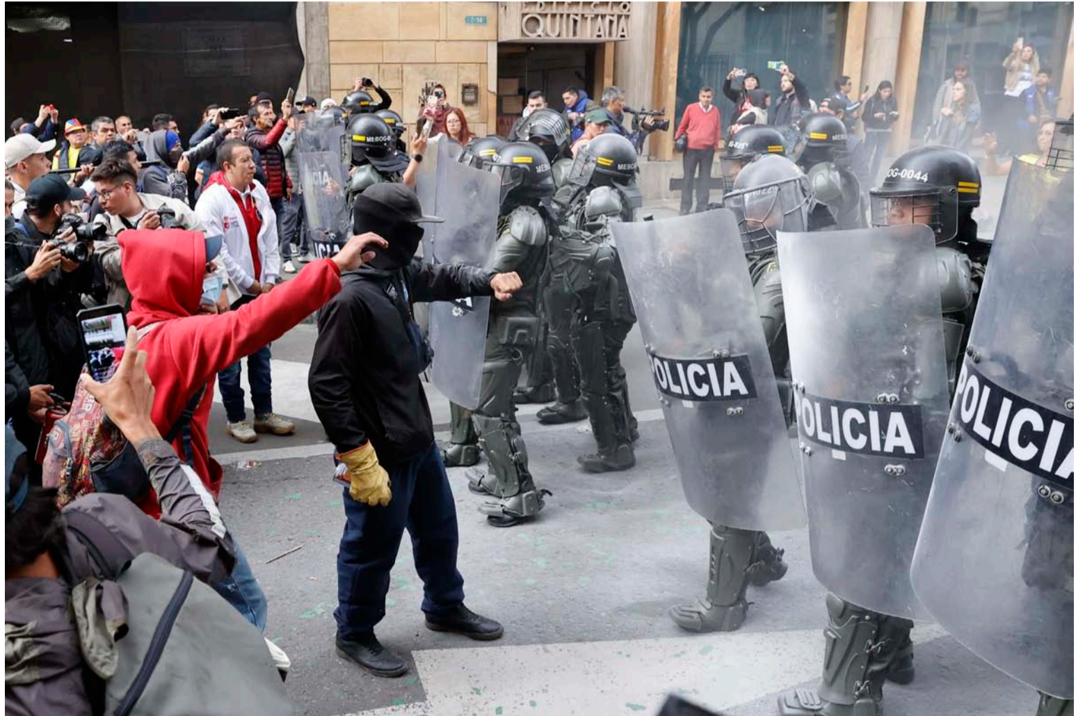
La polarización política en Colombia es un tema complejo que ha generado divisiones y tensiones en la sociedad.

Las protestas ante la Corte Suprema por la elección de un fiscal general de la Nación son un fenómeno que refleja la importancia y la sensibilidad de este proceso para la democracia y el estado de derecho en Colombia. Aunque es posible que haya habido protestas anteriores relacionadas con la elección de funcionarios claves, es crucial considerar que el contexto político y social actual puede haber intensificado la atención y la participación en este proceso específico; es importante que todas las partes involucradas en esta selección, actúen de manera responsable y respetuosa, garantizando que la elección de este funcionario se lleve a cabo de acuerdo con los principios democráticos y legales que rigen el País.