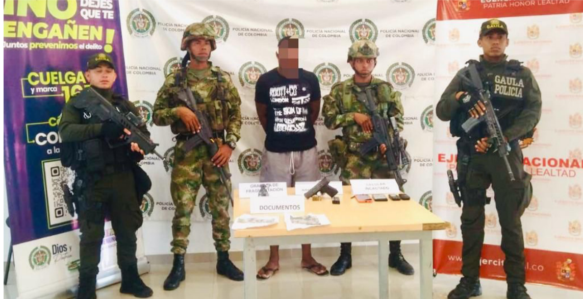
Alias 'Juancho' tenía más de 5 años en la organización, con injerencia en Riohacha.

Alias 'Juancho' tenía más de cinco años en la organización, con injerencia criminal en zona urbana de Riohacha y en los corregimientos de Camarones, Tigreras, Matitas y, principalmente, sobre la vereda Perevere, donde al parecer estaría encargado