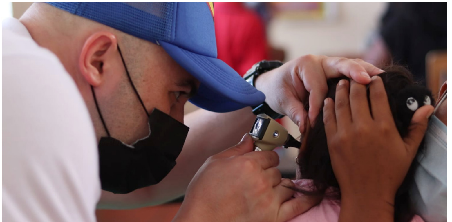
Por orden expresa de la Corte se busca la protección especial de los derechos a la salud y alimentación de los wayuú.

En ello también puede intervenir la Universidad de La Guajira, ya que la misma providencia es clara y contundente en su parte motiva, al establecer la necesidad de adecuación y contextualización del lenguaje bajo una estrategia pedagógica pertinente, para una mejor apropiación del conocimiento, en el sentido de sus bondades y alcances, pensando en la corresponsabilidad, complementariedad y necesaria articulación institucional. Por Veredura Ciudadana para la implementación de la Sentencia T-302 del 2017.