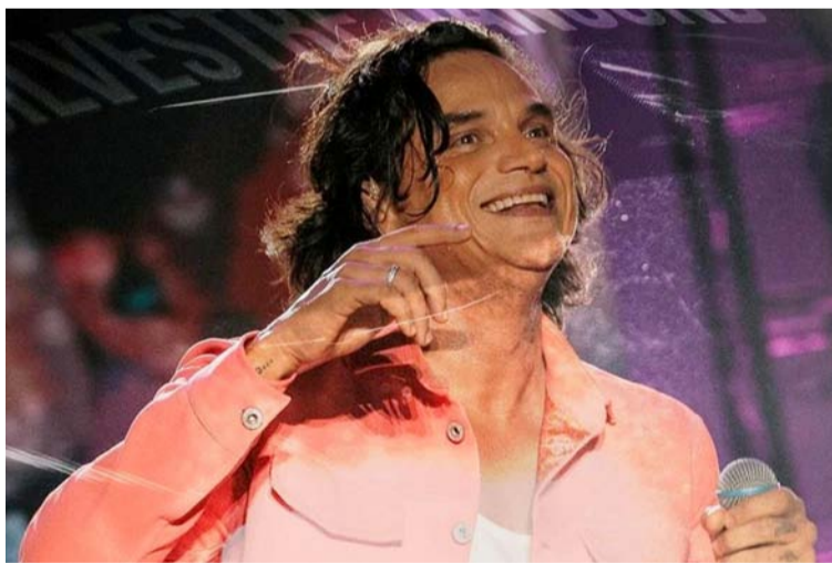
El artista Silvestre Dangond continúa llevando el vallenato en su alma.