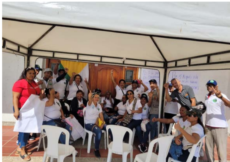
Exigen que se respeten sus derechos por parte de la institución en cuanto a la contratación de operadores.

Los comunales que hoy se fueron a las vías de hechos exigen que se respeten sus derechos por parte de la