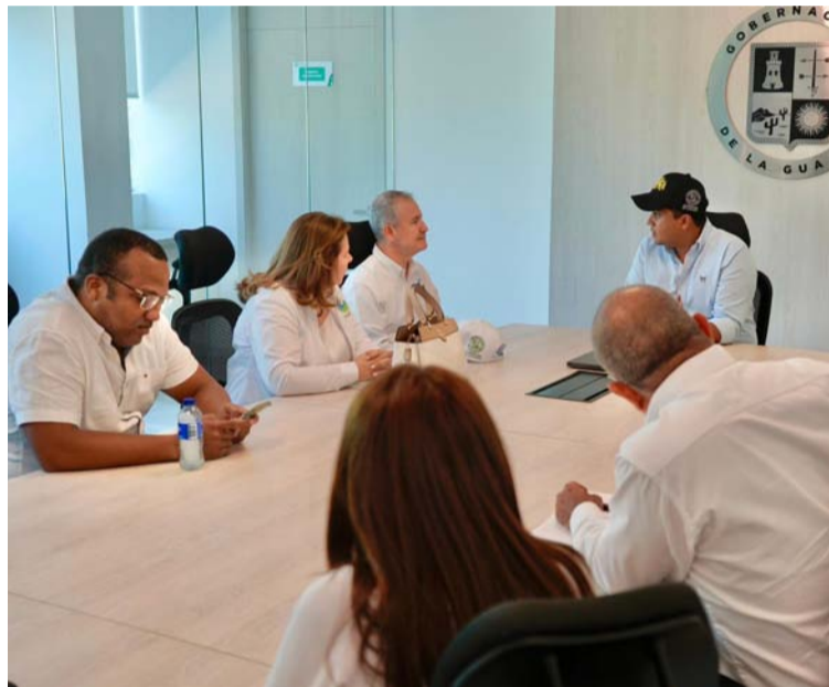
El gobernador Aguilar pidió a la empresa avanzar en la contratación de mano de obra local y de bienes y servicios.

Además de estos logros, el gobernador pidió a la empresa avanzar en la