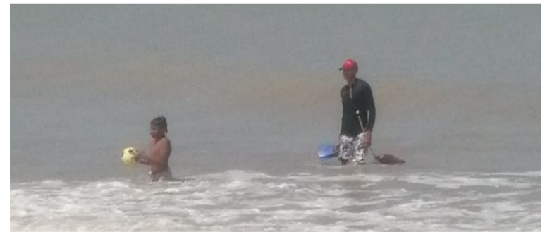
Rescatistas llamaron a los adultos a estar atentos a los menores y evitar llevar a la playa pelotas e inflables.