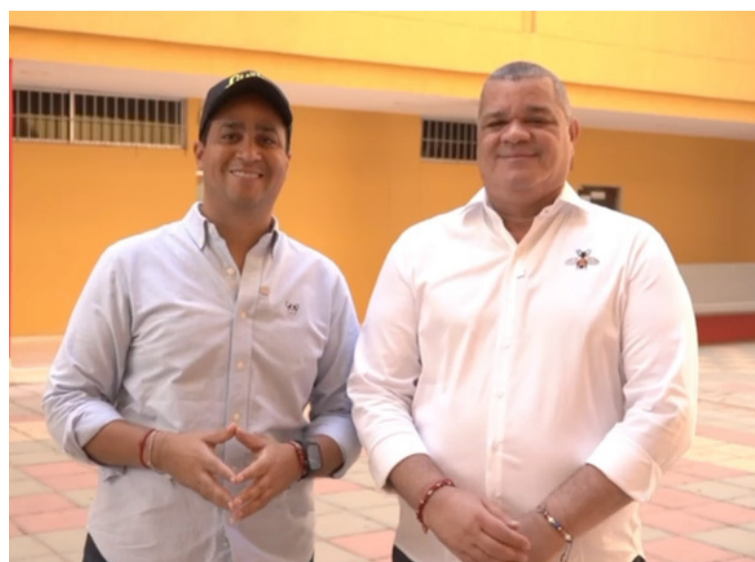
El gobernador Aguilar y el rector de Uniguajira, iniciarán trabajo para la elaboración del PDD de La Guajira 2024 – 2027.

Se invita a todos los sectores de la comunidad a sumarse a estas mesas de participación ciudadana, donde cada voz cuenta y cada aporte es fundamental para el desarrollo del Departamento de La Guajira.