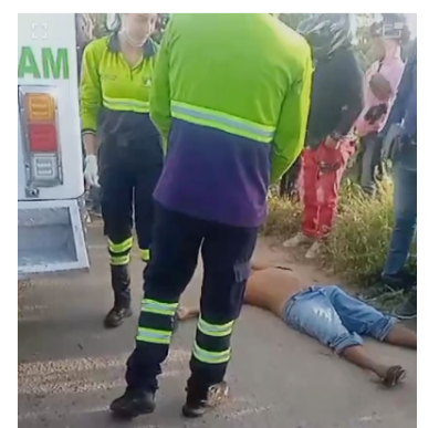
Esta persona fue auxiliada para paramédicos.

Se espera que pueda evolucionar con la atención médica que ha estado recibiendo en el centro médico, asimismo, las autoridades tratan de determinar si esta persona pudo haberse lanzado desde el puente.