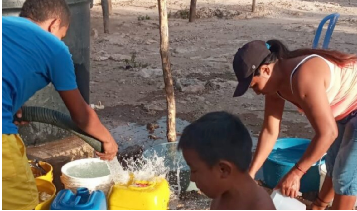
Es necesario que se comuniquen de forma oral las dimensiones centrales de la sentencia.

A este proceso de relacionamiento con las comunidades, le llamaron fortalecimiento y consolidación del proceso de divulgación y comunicación en lengua wayuunaiki para cumplir y subsanar los problemas generados en un primer intento fallido durante el 2019 y 2020 en la socialización del contenido de la norma y de sus autos, dado que la Corte no consideró que lo realizado se inscribe