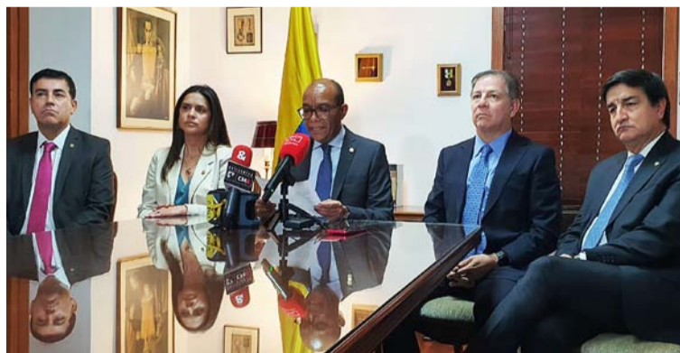
El presidente de la Corte Suprema Gerson Chaverra, pidió que los dejen elegir de manera tranquila nuevo fiscal.

Las protestas y el enfrentamiento con la Corte Suprema de Justicia por parte de los seguidores de Petro, son un reflejo de la polarización política en Colombia. Es fundamental que todas las partes involucradas busquen soluciones pacíficas y respeten el estado social de derecho, para garantizar la estabilidad y la democracia