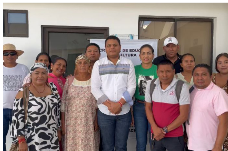
El alcalde logró detener la intención de paro por parte de los 7 Centros Etnoeducativos creados en el año 2023.