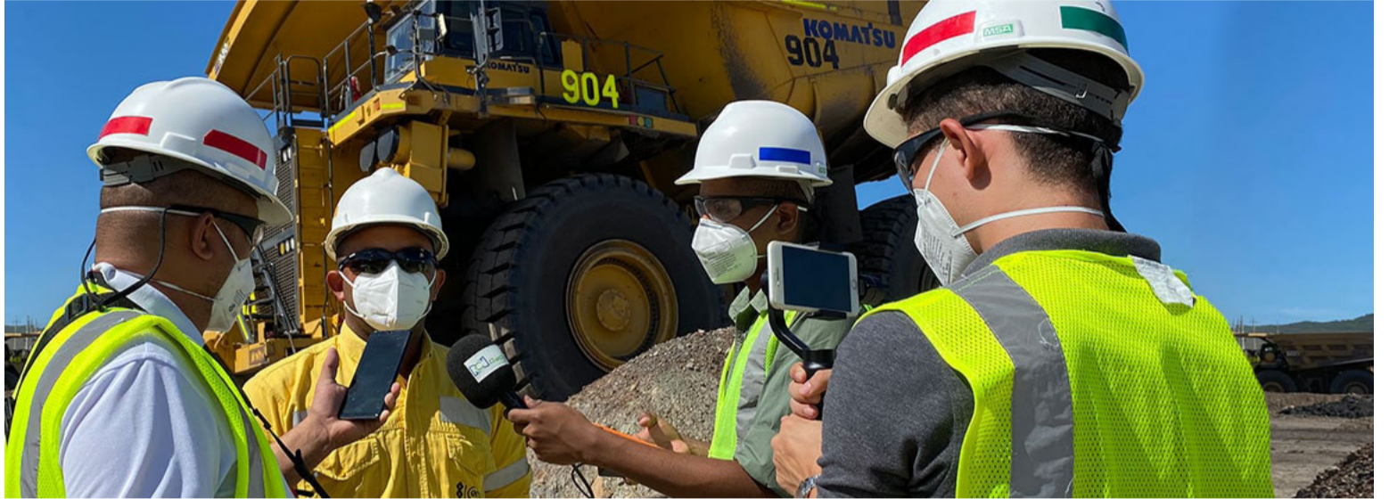
La compañía cuenta con una Política de DD.HH. la cual fue actualizada con la adopción de los Principios Rectores de la ONU.

La evaluación identificó seis Cuestiones Destacadas, que representan las principales áreas en las