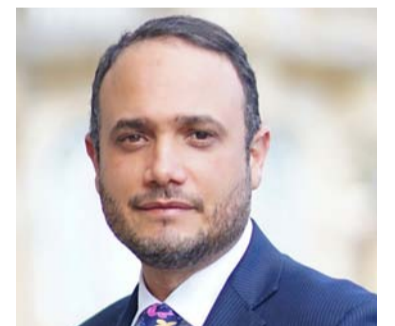
Senador de la República Alfredo Deluque Zuleta.

ron desmentidas por el senador quien aseveró que está faltando a la verdad: “Ella se refiere a unos hogares comunitarios que vienen contratados con vigencia futura desde el año pasado y que solo atienden a 7.200 niños de un universo de 98.000 que necesitan atención urgente.