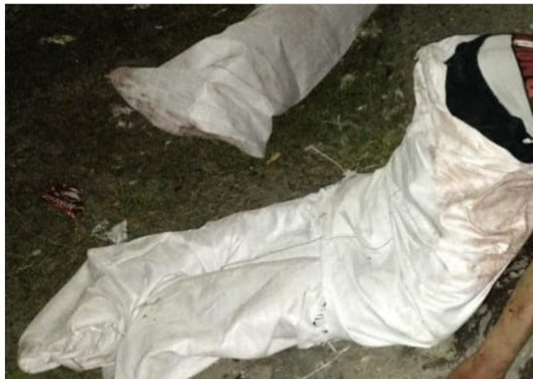
El hallazgo se dio a la altura del kilómetro 50+460 en la vereda de Pelechúa, corregimiento de Tigreras, Riohacha.

Asimismo, durante las investigaciones adelantadas inicialmente por las