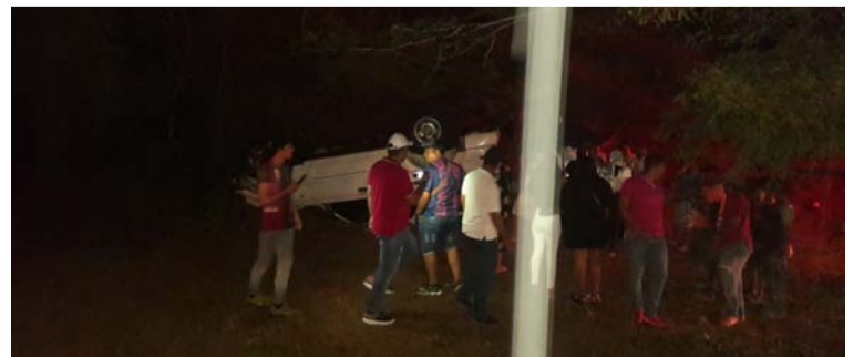
Personal paramédico que llegó hasta el lugar de los hechos expresó que la mujer sólo recibió golpes leves.

Las autoridades competentes manifestaron que los conductores deben conducir por esta vía con prudencia y acatando las normas de tránsito para evitar pérdidas humanas.