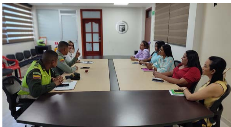
La actividad se cumple a través de la secretaría de Salud, en el marco de la semana por la vida.