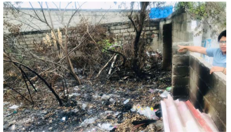
Habitantes del sector piden al propietario del lote, limpiarlo y hacer de este un sitio seguro y agradable a la vista.

Igualmente, la comunidad amenaza con invadir el lote si se no toman cartas en el asunto de manera inmediata, por lo que también hacen un llamado a las autoridades distritales para que se haga la limpieza del sitio.