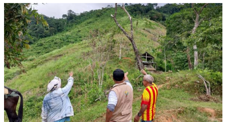
El balance positivo forma parte de la etapa judicial del proceso de restitución de tierras que lleva la URT en la región.

Finalmente, la directora territorial para Cesar y La Guajira informó que al cierre del mes de enero se reporta la inscripción de cuatro solicitudes al Registro de Tierras Despojadas y Abandonadas Forzosamente, por cuanto cumplen con los requisitos establecidos en la ley 1448 de 2011 en el desarrollo de la etapa administrativa del proceso de restitución de tierras.