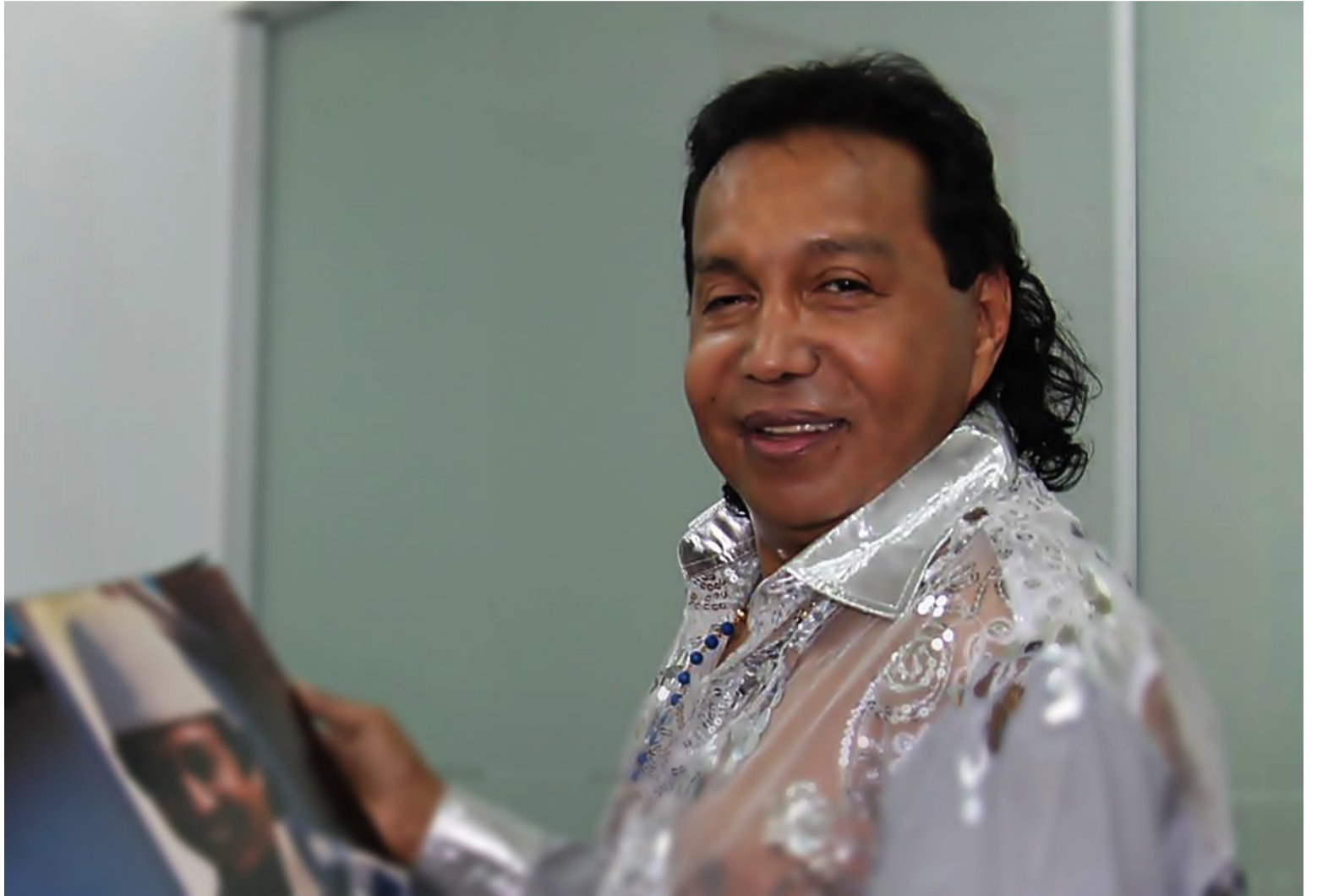
A Diomedes la música lo encumbró en lo más alto del éxito hasta convertirlo en el artista vallenato que más discos vendía.