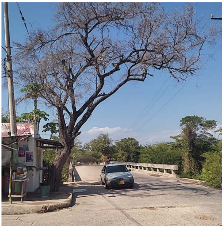
El árbol tiene más de un año de estar seco y sus raíces y ramas van perdiendo fuerzas, por lo que se vuelve un peligro.