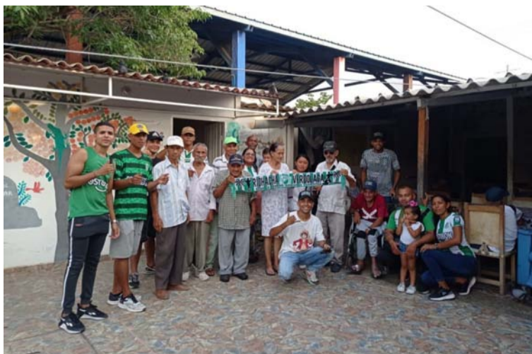
Este grupo de jóvenes mantiene un espíritu de colaboración y empatía con la comunidad.