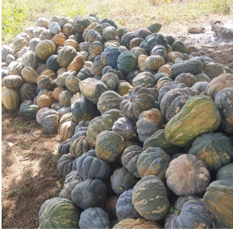
Pérdidas por más de $600 millones sufren 140 familias campesinas por no poder comercializar el producto.

Carlos Escobar, líder agrícola, expresó su frustración. "No es la primera vez que superamos estos tipos de pérdidas ya sea por la inclemencia de la sequía o las lluvias torrenciales que