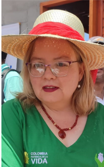
Astrid Cáceres Cárdenas, directora del Icbf.

Astrid Cáceres Cárdenas, directora a nivel nacional del Icbf, hizo énfasis en el proceso de contratación para la región guajira en las que resaltó el plan de contingencia puesto en marcha desde el año 2023, mientras se realiza el nuevo convenio de