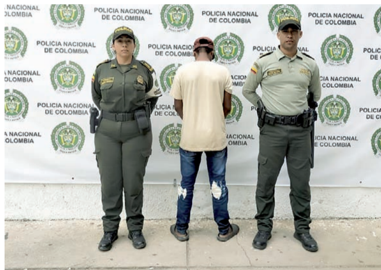
Este sujeto estaba siendo solicitado por orden judicial, por el presunto delito de abuso sexual con menor de 14 años.

La captura se efectuó entre el corregimiento de Mingueo y Riohacha, mediante las acciones policiales que se desarrollan para contrarrestar el delito en todas sus modalidades.