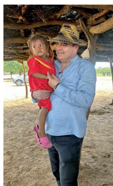
Ungrd llegó con la 'Ruta por la vida', una estrategia que sumó 40 carrotanques nuevos.

un convenio con el Ejército Nacional de Colombia, se destinaron $92.000 millones para la entrega de jagüeyes, arreglo de las vías de acceso y repuestos.