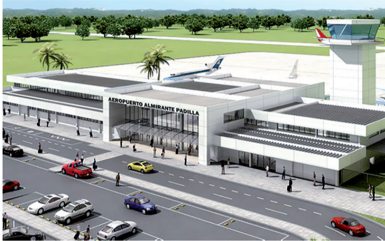
Se espera que finalizando el 2025 o comenzando el 2026 se tenga lista la pista del aeropuerto de Riohacha.

“Hoy con el Ejército tenemos seis pistas en construcción (...) esas pistas son tres en el Pacífico (Bahía Sola-