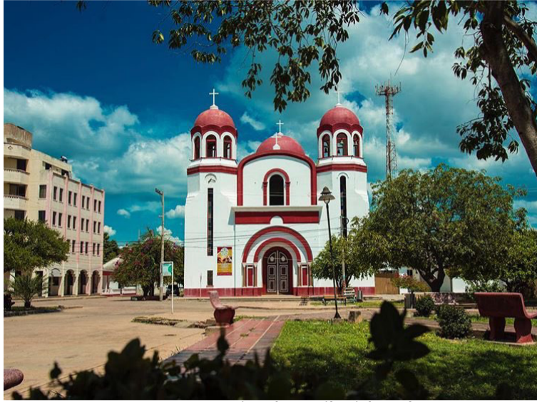
Con un supuesto comunicado atribuido a las AGC, estas exigen a delincuentes y jíbaros abandonar la población.

El siguiente es el texto del comunicado: “El estado mayor (AGC), informa a toda la comunidad sanjuanera, que nuevamente estamos en este territorio como respuesta armada a la delincuencia y bandidos que delinquen en este municipio, acatando órdenes del estado