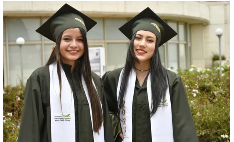
En sus 38 años de existencia esta iniciativa ha becado a 1.761 estudiantes en todo el país. Este año son 100 jóvenes.

Para este año, las inscripciones estarán abiertas hasta el 6 de marzo para que participen los jóvenes que obtuvieron un desempeño sobresaliente en las pruebas Saber 11 del año 2023 y que cumplan con