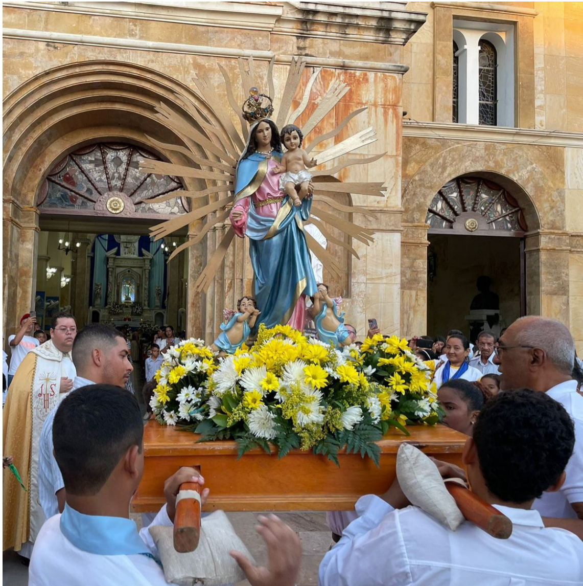
La Virgen Nuestra Señora de los Remedios se ha convertido a través de los años de devoción en la hacedora de milagros, sus feligreses le tienen mucha fe.

El gran milagro que hizo 'La Vieja Mello', ocurrió un 14 de mayo de 1666, cuando las aguas embravecidas del mar Caribe intentaban arrastrar la pequeña parroquia de ese entonces, llamada Riohacha, fue cuando sus habitantes de la época sacaron a la virgen, la pasearon y cuando iban en la famosa 'Calle de las Perlas', al frente de lo que es hoy el Hotel Arimaca, se cayó su corona y posteriormente se produjo el milagro; las aguas comenzaron a regresar a su cauce normal, y los riohacheros, desde ese día, veneran a la Virgen de Los Remedios, como su patrona y protec-