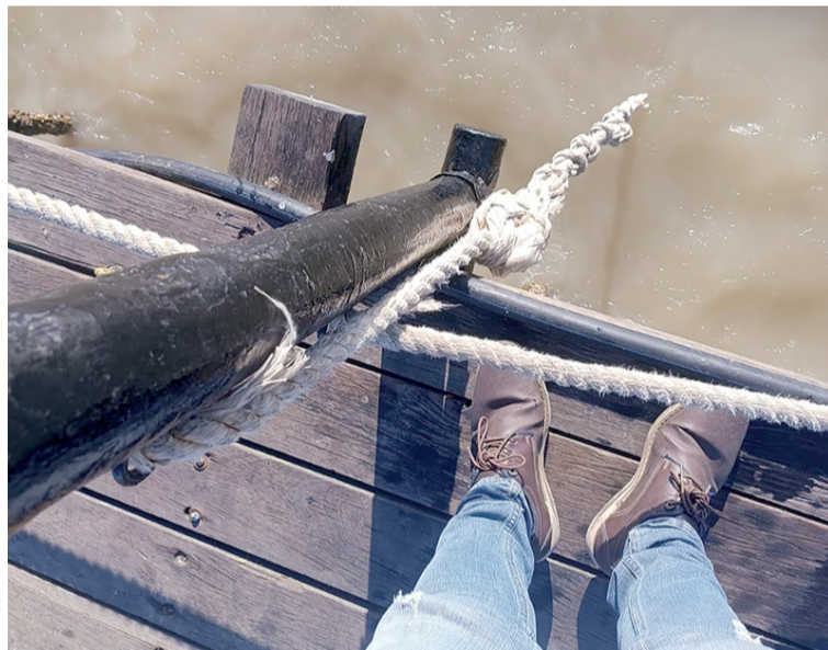
Esta acciones vandálicas en el muelle del Distrito de Riohacha, dañan la imagen turística de la capital de La Guajira.

tentes al consultarle sobre esta problemática de convivencia ciudadana señalaron que han realizado varios operativos en esta zona para controlar la situación pero no es posible debido a la falta de personal y las acciones que se deben implementar para contrarrestar la situación.