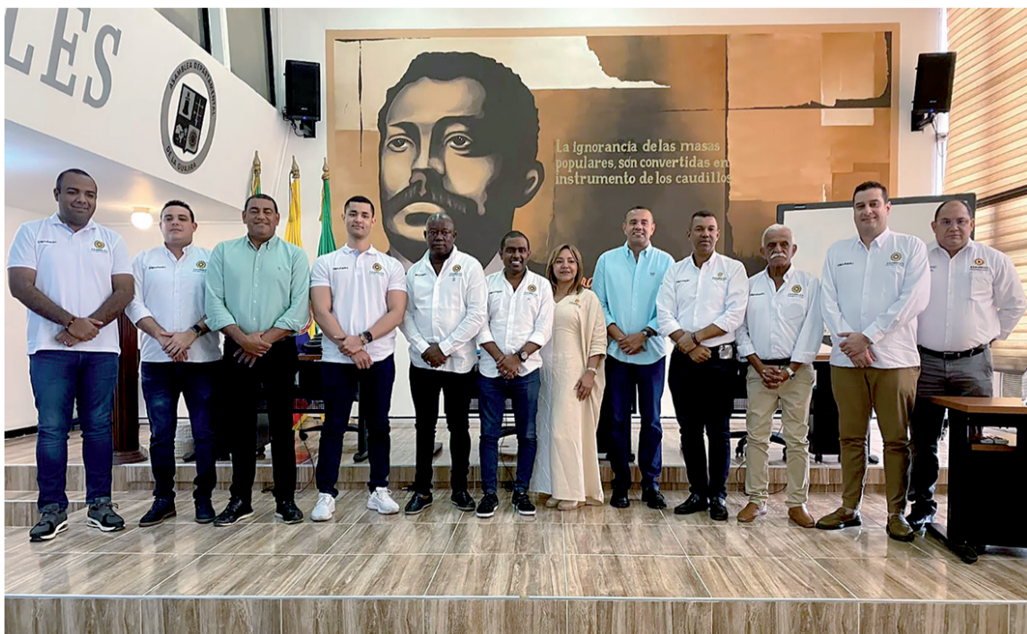
A la Asamblea asistieron los funcionarios encargados de la seguridad en Riohacha y La Guajira.

Sin embargo, ante esta situación de inseguridad, sobre todo en Riohacha, ya que se han elevado a 14 homicidios, los diputados de la Asamblea exigen resultados inmediatos por parte de las autoridades.