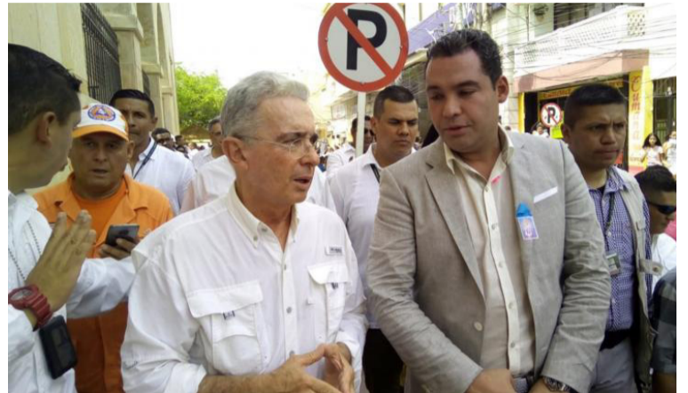
El expresidente Uribe ha asistido por años a las fiestas de la Virgen de los Remedios pero en este 2024 se excusó.

Álvaro Uribe es reconocido por ser uno de los políticos, fiel devoto de la patro-