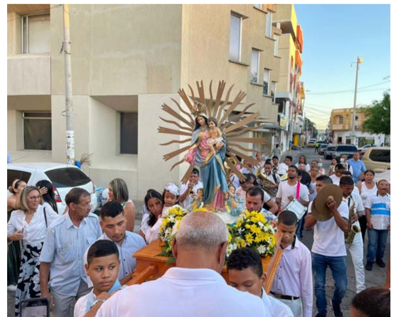
En los primeros días de febrero en la capital de La Guajira se siente el fervor que despierta la patrona de los riohacheros, a los que acuden a recibir su bendición.