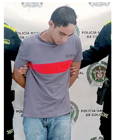
Los habitantes del barrio ayudaron a capturarlo.

El detenido ha sido puesto a disposición de la Fiscalía General de la Nación, donde se llevarán a cabo las acciones legales correspondientes.