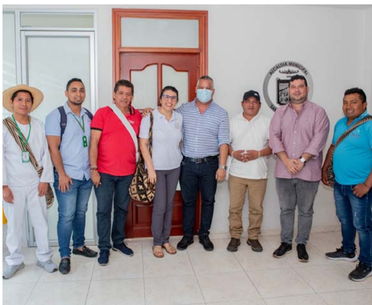
La Registraduría Nacional, con el apoyo de la Alcaldía de San Juan del Cesar, realizará una jornada de identificación.

“Nuestra meta es lograr el 100% en cobertura, tanto en identificación de ciudadanos, como en aseguramiento al Sistema General de Salud”, expresó el mandatario.