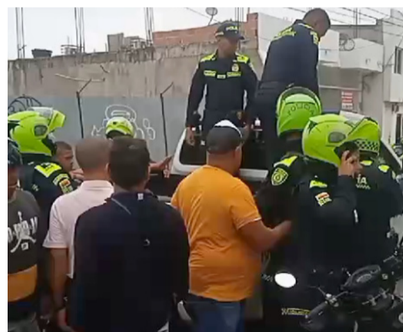
Al sujeto intentaron lincharlo al conocer lo que presuntamente había hecho, sin embargo, los uniformados lo impidieron.