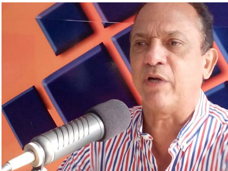
El entonces alcalde de Villanueva fue reconocido por su arrogancia y falta de humildad, además de constantes agravios a los villanueveros destacados fuera del municipio.

fuerte que lideró su revocatoria hasta recoger más de 8 mil firmas y nombrar un alcalde ad hoc, hecho inédito en Villanueva y que se constituyó en una fuerte mancha para su propósito.