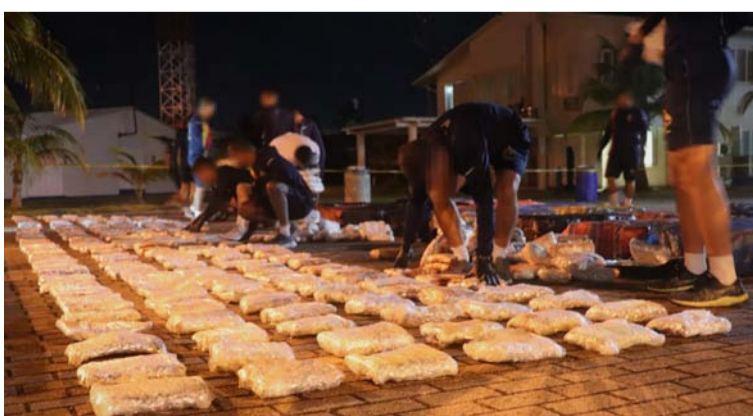
Guardacostas de la Armada en operación de interdicción incautaron 1,2 toneladas de marihuana en el mar Caribe.

La Armada de Colombia con apoyo de la Fuerza Aeroespacial Colombiana (FAC) y de la Fuerza de Tarea Conjunta e Interagencial del Sur de los Estados Unidos, incautaron 1,2 toneladas de marihuana y 73 kilogramos de clorhidrato de cocaína en el desarrollo de una operación de interdicción marítima al sur de la isla de San Andrés.