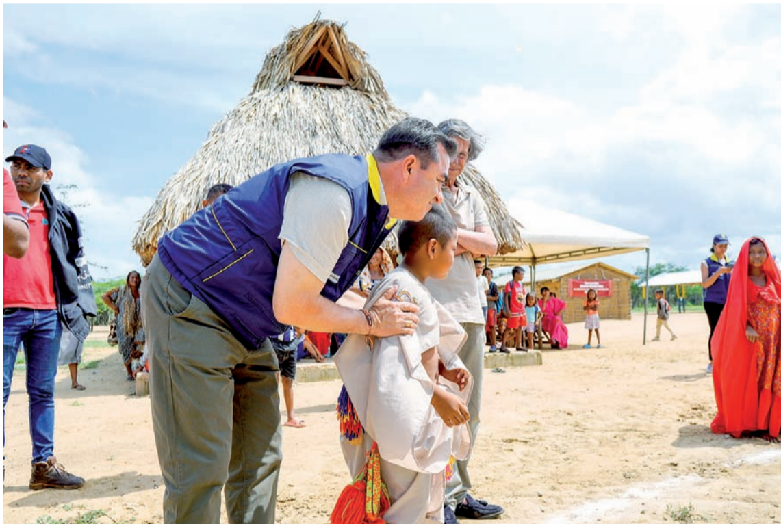
Olmedo López, director de la Ungrd, ha estado en innumerables ocasiones en La Guajira.

Son cerca de $600.000 millones que la Ungrd y el Gobierno Nacional han destinado para La Guajira, de los cuales $70.000 millones serán para el mantenimiento y adecuación de 1.670 jagüeyes en Uribia, Maicao, Riohacha, Manaure y Albania. Asimismo, mediante