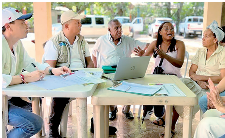
En total deben completarse 41 mesas en los diferentes cascos urbanos, corregimientos y veredas de cada municipio.

Al finalizar los encuentros se revisarán los aportes que se hicieron en las mesas técnicas y se procederá a elaborar el Plan de Acción para los próximos cuatro años, que tendrá como objetivo la protección de la gran biodiversidad biológica.