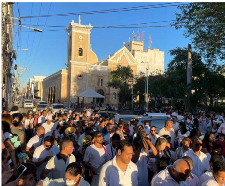
Todos los 2 de febrero los riohacheros, los raizales y los que de corazón participan de la misa y de la procesión de la Virgen de los Remedios.