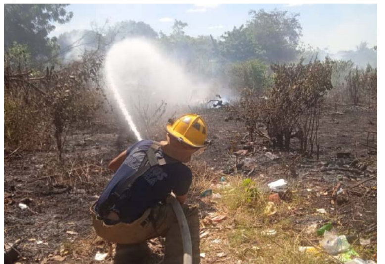
Residentes informaron a las autoridades que el incendio al parecer fue provocado a propósito por desadaptados.

Hasta el lugar llegaron los voluntarios del Cuerpo de Bomberos con la máquina 03 quienes de inmediato iniciaron con la descarga de agua para apagar las lla-