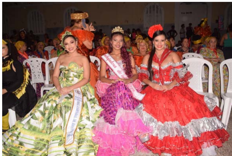
En la plazoleta del parque Nicolás de Federmann, se realizó la noche de gala de la gran cumbiamba Edita Pinto Quintero.