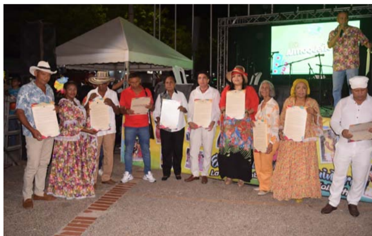
Los gestores culturales fueron reconocidos por salvaguardar el patrimonio cultural del Distrito y el Departamento.