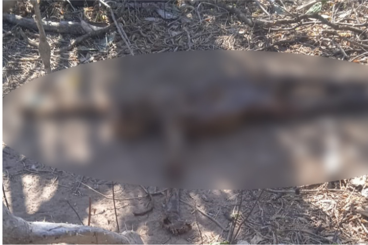
Los restos humanos quedaron al descubierto por un grupo de jóvenes quienes frecuentan a diario la zona.

El esquelético cuerpo, aún con la piel seca pegada a los huesos, quedó al descubierto por un grupo de jóvenes quienes frecuentan a diario la zona para realizar actividades de cacería, en busca de