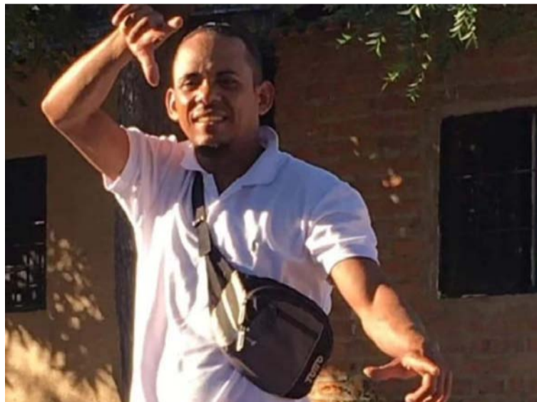
El hombre fue abordado por sujetos que le propinaron golpes que lo dejaron inconsciente y luego le dispararon.

Asimismo, una fuente investigativa encargada del caso señaló que al parecer este hecho violento se había presentado por una banda