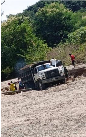
Comunidad pide aplicar sanciones a responsables.

copalma y Lagunita han expresado su preocupación por esta situación y han anunciado medidas para detener la extracción ilegal de arena en el río San Francisco.