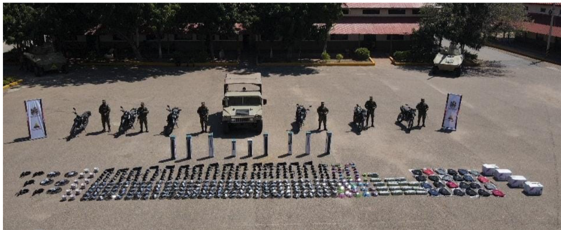
La mercancía de contrabando estaba valuada en 10 millones 439 mil 400 pesos.

Esta importante incautación se realizó por parte de las tropas del Grupo de Caballería Blindado Juan José Rondón de la Décima Brigada del Ejército Nacional en el marco del 'Plan Ayacucho'.