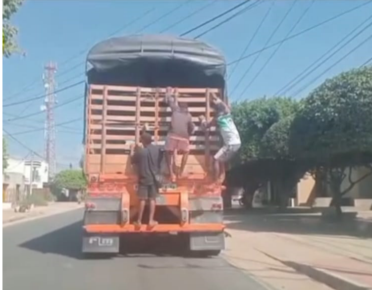
Los conductores de camiones hacen un llamado a las autoridades para tomar mayores medidas en esta vía nacional.

La actividad inusual se presenta cuando pasan por la avenida principal de Fonseca al frenar en el reductor de velocidad entre las carreteras 9 y 10, donde funcionaba el antiguo DAS. Allí los jóvenes entre 13 y 17 años aproximadamente aprovechan para subirse y lanzar toda la mercancía por esta