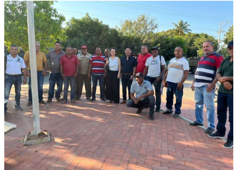
La Alcaldía de San Juan está dando cumplimiento a la sentencia del Tribunal Administrativo de La Guajira.

Cabe destacar que en estos momentos, la Alcaldía de San Juan del Cesar, está dando cumplimiento a la sentencia emitida por el Tribunal Contencioso Administrativo de La Guajira, que le ordena realizar acciones que vayan encaminadas a la conservación del río Cesar.