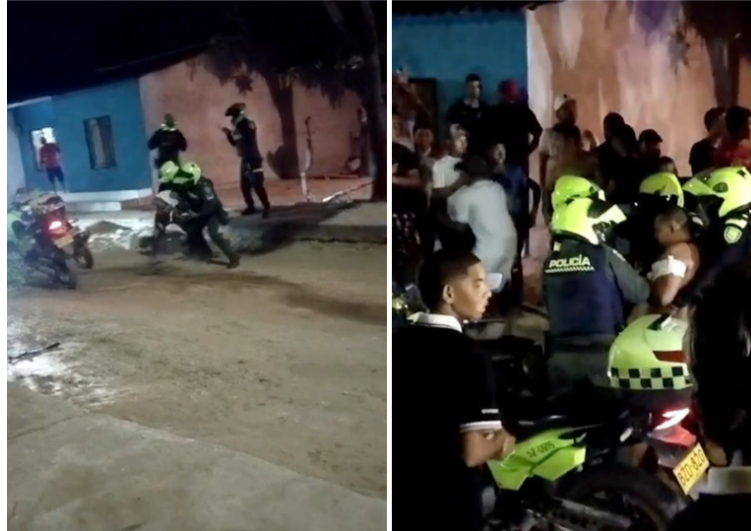
Los uniformados lograron calmar la situación y se llevaron al sujeto capturado hasta la estación de Policía de Riohacha.

Según la versión de los testigos y videos aficionados, el hombre se detiene y al parecer se resiste al registro de persona por parte de los uniformados, por lo que se presenta un fuerte altercado que originó alte-