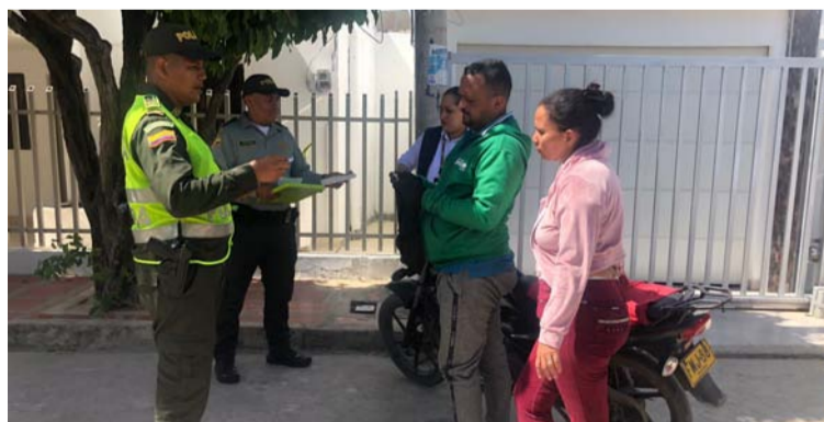
Es una estrategia de prevención y rechazo a los comportamientos y manifestaciones xenofobas y discriminatorias.

Para reducir y evitar prácticas discriminatorias y xenofóbicas en la calle 17, 19 y 20 entre carreras 4, 5 y 6, en el barrio Los Olivos, cuadrante 2, la seccional de Protección y Servicios Especiales del Departamento de La Guajira puso en marcha la