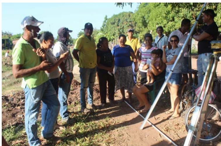
La comunidad del barrio El Carmen está dispuesta a paralizar la obra hasta no tener una explicación convincente.

Aclaró que al proyecto que está en ejecución no se le puede inyectar más recurso adicional y manifiesta la funcionaria que ha requerido al ingeniero para que haga presencia, pero señala que hasta el momento no ha dado la cara.