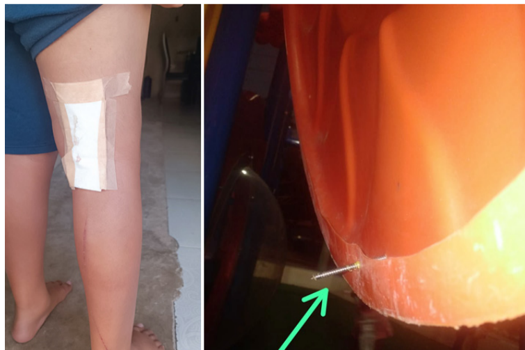
El niño resultó lesionado en una de sus piernas con un tornillo del elemento de diversión.

Evidentemente nadie, pero es el panorama que