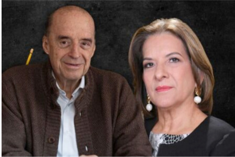
Para el órgano de control, el canciller habría incurrido en dos faltas disciplinarias, calificadas como gravísimas.

La Sala Disciplinaria de Instrucción señaló que el canciller habría incurrido en dos faltas disciplinarias, calificadas de manera provisional como gravísimas cometidas a título de dolo, la primera al declarar de-