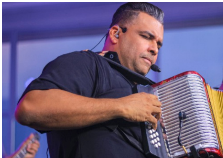
Por problemas en su columna, el acordeonero presentaba fuertes dolores, por lo que buscó ayuda médica.

Antes de ir voluntariamente a urgencias, el expe-