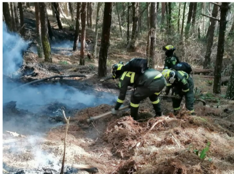
La región de Cundinamarca, en el centro del país, enfrenta la mayor incidencia de incendios forestales.