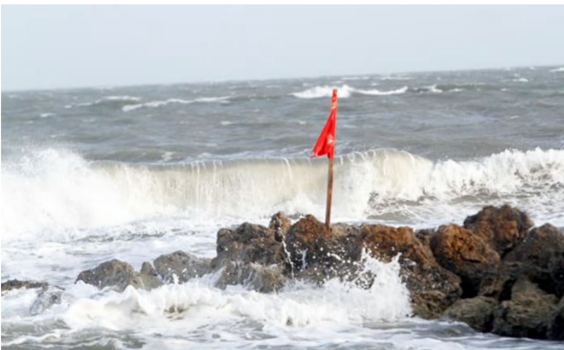
El llamado también es para pequeñas embarcaciones y pescadores por el alto oleaje.