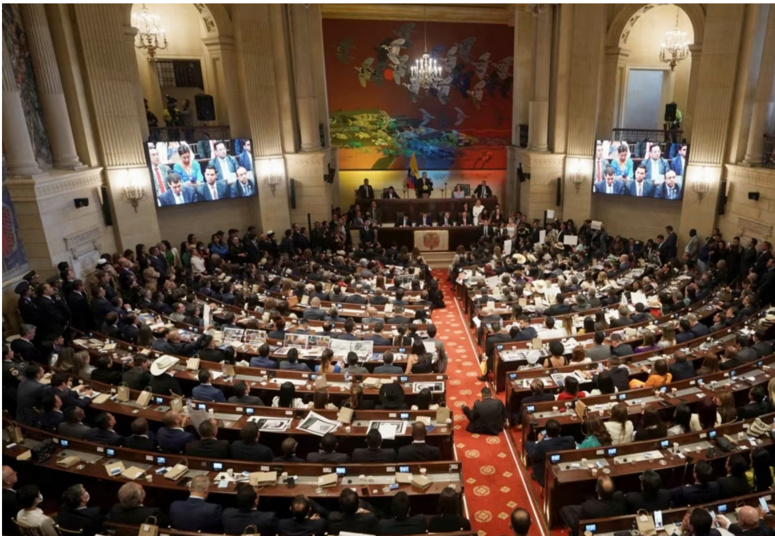
El Congreso de la República aprobó el acto legislativo “por medio del cual se adopta una reforma de equilibrio de poderes”.

Los fracasos electorales hay que aceptarlos y asimilarlos con dignidad, hidalguía y decoro; y no con resentimiento, soberbia y maquiavélicamente buscando venganza a través de caprichosas demandas que por lo general la presentan en cuerpo ajeno.