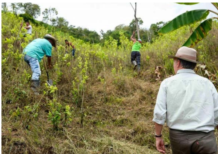
Los recursos que reciben las familias por sustituir el cultivo los deben destinar al pago de deudas de ‘gota a gota’.

sos que están recibiendo las familias por sustituir el cultivo de coca —3 millones de pesos— los deben destinar al pago de deudas de ‘gota a gota’ o para comprar comida.