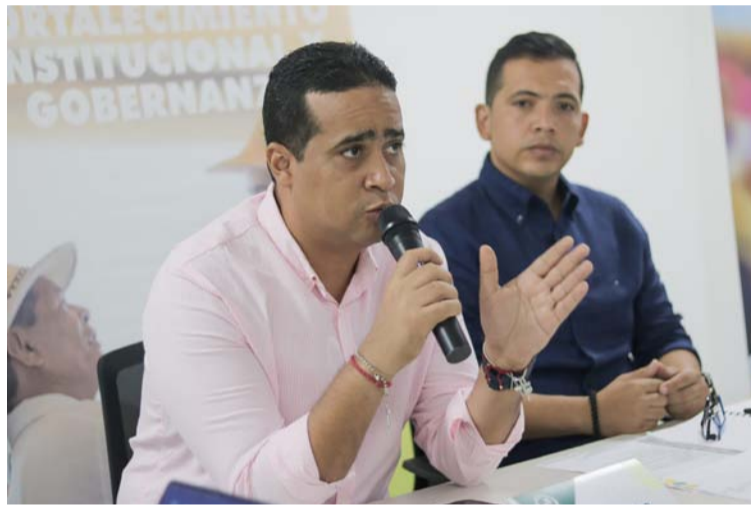
El mandatario explicó que se trabaja de manera articulada para llevar a cabo los proyectos para los municipios.

"Estamos trabajando de manera articulada para llevar a cabo los proyectos para nuestros municipios, teniendo en cuenta la diversificación productiva, fortalecimiento institucional y desarrollo de la mano de obra.