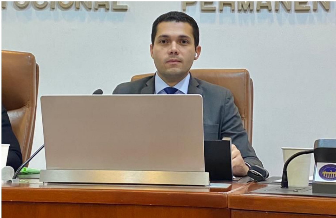
El representante de La Guajira destaca la importancia de abordar este tema crucial.

“Hemos sido testigos de eventos recientes que han dejado un impacto significativo en el bienestar psicológico de nuestra comunidad”, expresó el Representante Gómez Soto. Según datos proporcionados por la EPS.I Anas Wayuu, el año 2022 registró la tasa más elevada de intentos de