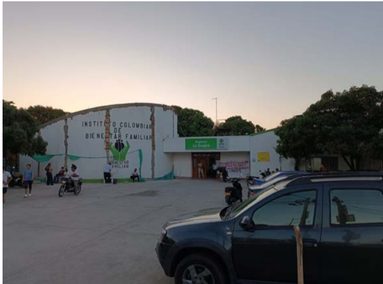
La información que manejaban los líderes comunitarios es que estos espacios serían cerrados pero resultó falso.

La información que manejaban los líderes comunitarios es que estos espacios serían cerrados y la población infantil que son atendidos en estas unidades pasarían a los CDI que hay en cada localidad, ellos no estaban de acuerdo con esta supuesta medida ya que afectan a todos los procesos y a las madres que viven de esta iniciativa de las UCA, atendiendo a la población infantil.