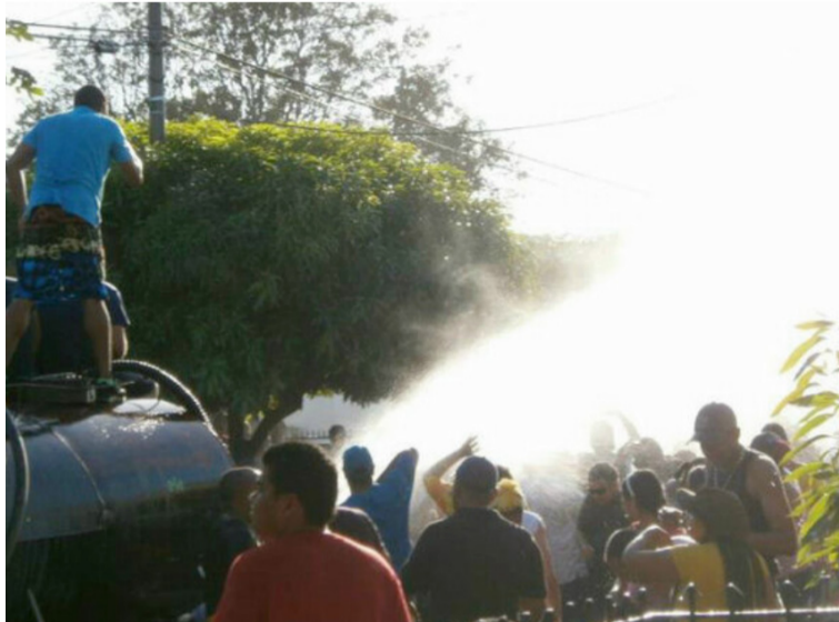
El alcalde solicita a la ciudadanía comprensión ante la escasez de agua, y por los estragos del fenómeno de El Niño.

“Desde ya estamos con el decreto donde le vamos a decir a la gente que tenemos que tener un uso racional del agua, es decir, no vamos a tener carrotan-