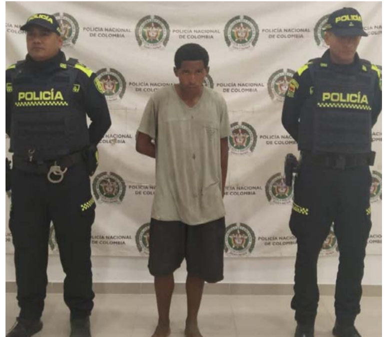
Este sujeto, denunció la comunidad, había ingresado saltando la pared de una vivienda y sustraído 10 láminas de zinc.

La Policía Nacional continúa comprometida en mantener la seguridad de la comunidad y tomar acciones firmes contra la delincuencia.