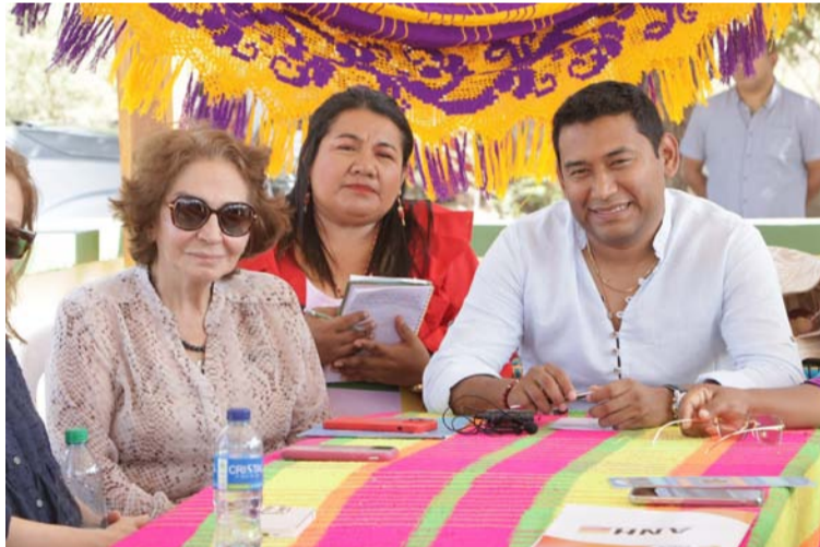
El alcalde dijo que busca mejorar condiciones educativas de niñez maicaera y tener aliados que ayuden en esto.

El proyecto está enfocado en la adecuación de la infraestructura social y su principal objetivo es contribuir al desarrollo territorial y mejorar la calidad en la educación de los estudian-