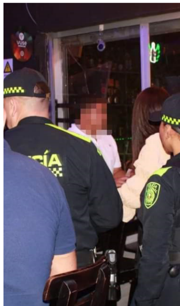
Se verificó si los locales cumplen con las normas.

establecidas, y una de estas sanciones es el cierre preventivo del establecimiento como tal.