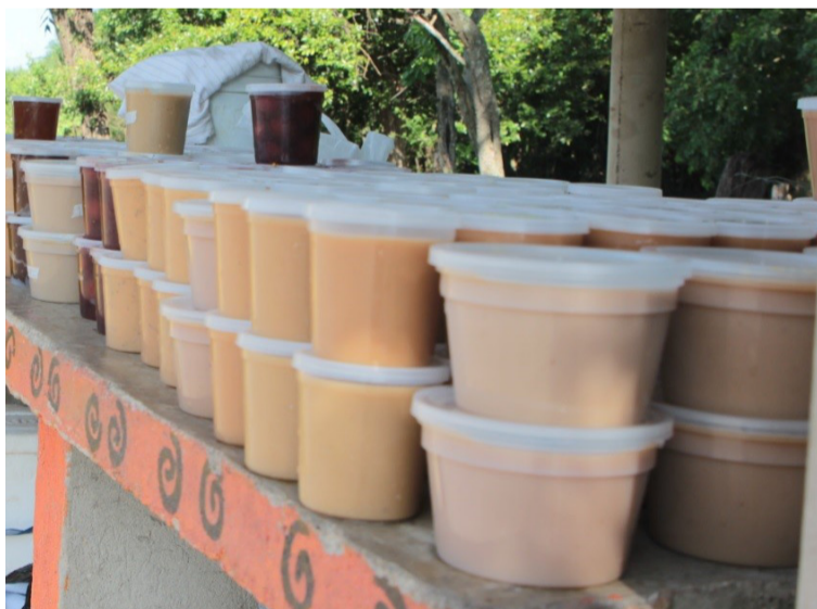
Los viajeros entre Riohacha y Cuestecita siempre suelen encontrar a la entrada de Monguí su manjar: el Dulce de leche.

le jabón a la sopa porque amargados hay en todo el mundo”.