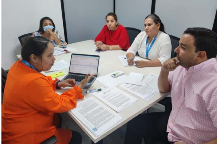
El evento tuvo lugar en la ciudad de Cartagena y contó con la presencia de expertos nacionales e internacionales.