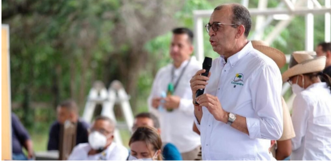
Con este instrumento de planeación la Corporación espera concretar el logro de objetivos.

En él se definen las acciones e inversiones que se ejecutarán en el territorio durante el periodo 2024 – 2027. Para esta formulación colectiva se invitarán a los diversos sectores, como los entes territoriales, los