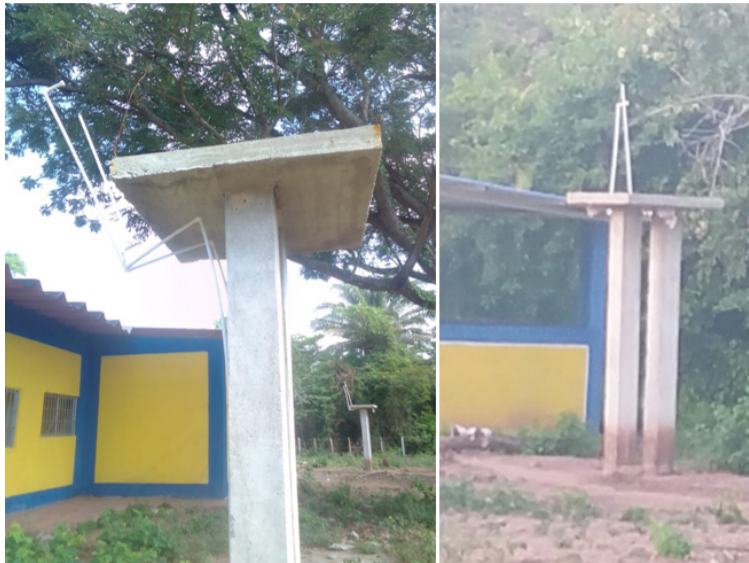
Los afectados instauraron la respectiva denuncia para que se localice a los responsables del ilícito.

tarde, cuando ninguno de los usuarios se encontraba laborando. Lo extraño del caso es que a las seis y treinta de la tarde del mismo día, nuevamente