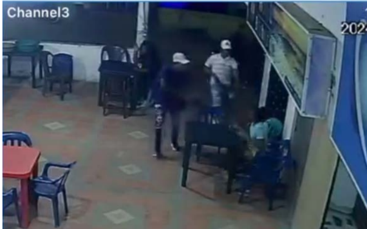
Dos bandidos se bajaron de las motos, mientras los otros esperaban que sus cómplices cometieran el hurto.

El hecho se registró en unos locales de la calle 16 con carrera 20 en el centro del municipio fronterizo de Maicao, en donde dos sujetos se bajaron de las motos, mientras los otros espera-