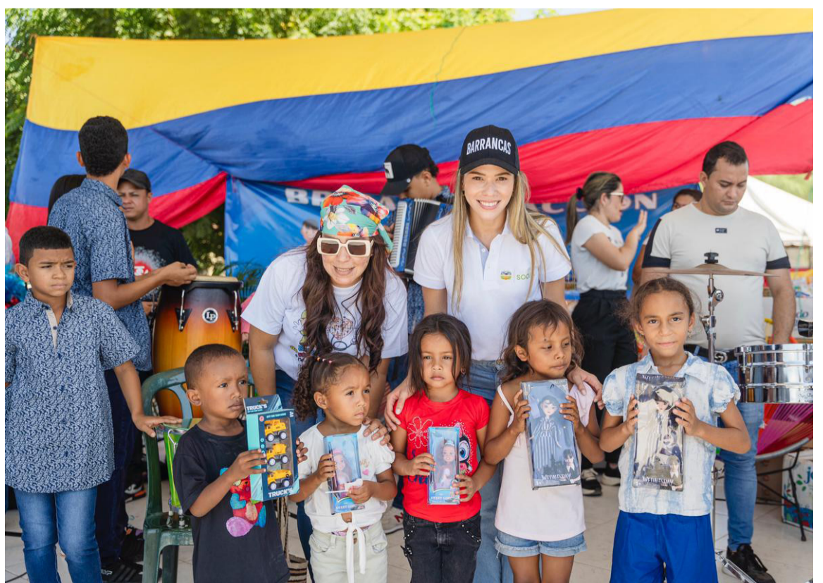
La gestora social del municipio dijo que se trató de una brigada social de atención integral.

La actividad contó con el apoyo de la Fundación ‘Te amo Barrancas’, el Ejército Nacional, la Policía de Infancia y Adolescencia, y toda la oferta institucional de la administración municipal.