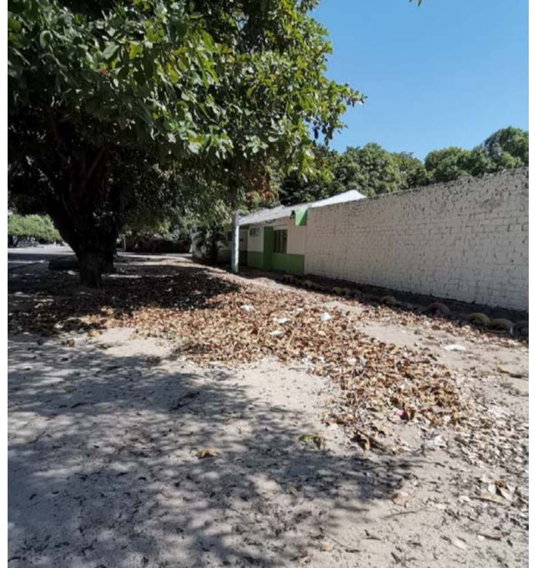
Se advierte que no hay voluntad de las personas que han laborado durante muchos años, hacer un aseo o limpieza.

En ese sentido hacen un llamado para que las personas y organismos competentes puedan supervisar el mantenimiento de este lugar que ha servido para la atención de niños y niñas de la localidad.