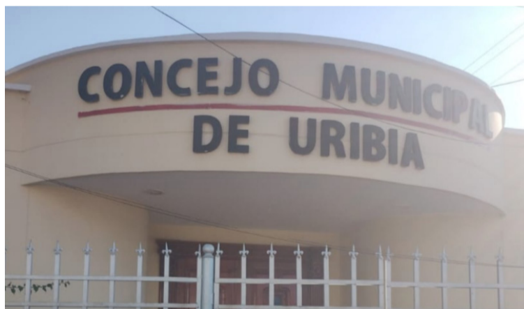
Para el juez es claro que se ha dado continuidad al proceso de elección por parte de la entidad accionada.

el documento como se expide por parte del Honorable Concejo del Uribia la resolución No. 004 de 2024, donde se modifica el cronograma y se fijan nuevas directrices para llevar a cabo la entrevista en el concurso público y abierto de méritos para proveer el cargo de Personero Municipal de Uribia La Guajira, indicando en el parágrafo segundo del artículo segundo de la citada resolución que: "Los Aspirantes presentarán la entrevista de manera individual ante la plenaria del concejo Municipal, en el lugar y fecha indicada