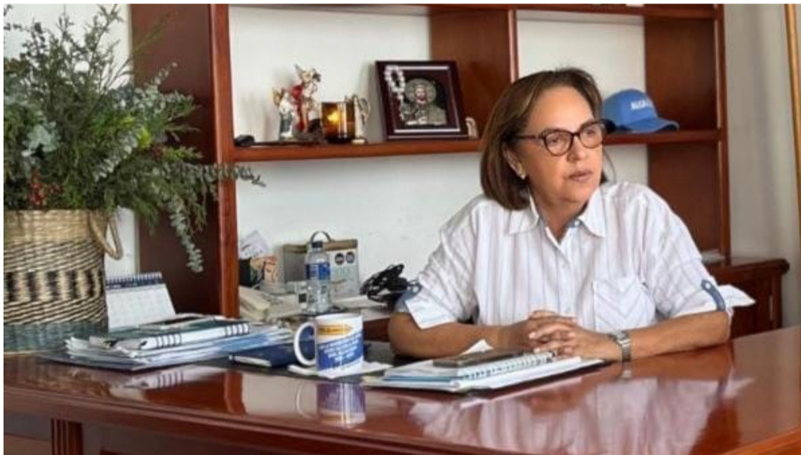
La alcaldesa solicita que se investigue a la juez, entre otras, por un posible prevaricato.