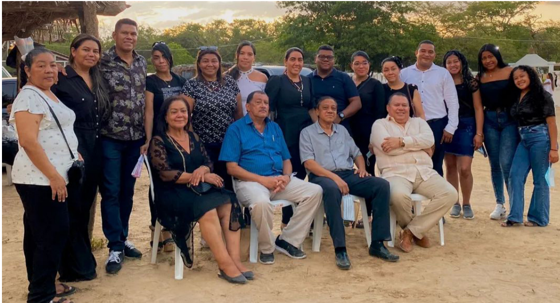
Los habitantes de Monguí, jurisdicción de Riohacha, trabajan mancomunadamente para que el pueblo sea una ‘Tierra de paz, cultura y trabajo’.