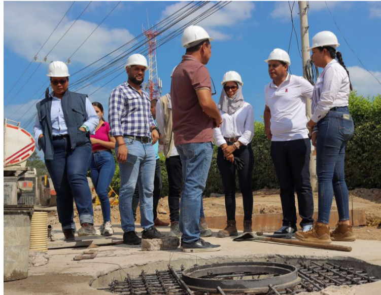
El mandatario implementa las estrategias de buen Gobierno, en donde prima el diálogo con la comunidad.

Durante el recorrido se indicaron acciones de mejoras a los contratistas como la correcta implementación de los elementos de protección personal, la señalización de la obra, la socialización con las juntas de acción comunal y la optimización de actividades para entre-