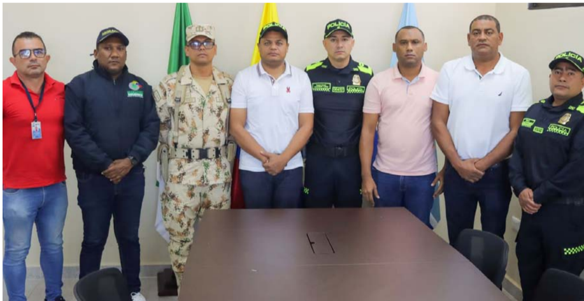
El alcalde dice que trabajará con líderes comunitarios y fuerza pública por la seguridad.

La tranquilidad de los habitantes del Distrito es una prioridad para la administración, por lo que el mandatario se comprometió a fortalecer las fuerzas militares y policivas, traba-