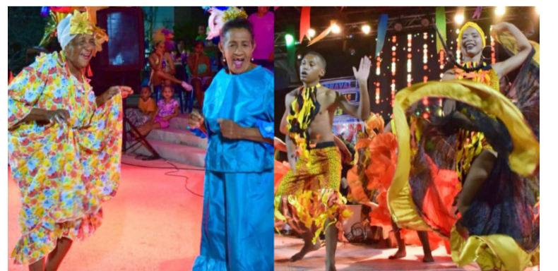
Se llevará a cabo la lectura del bando el 27 de enero, en el escenario que se ubicará frente al parque Simón Bolívar.

El carnaval de la gente' contará con un amplio cronograma que se extenderá hasta el 11 de febrero.