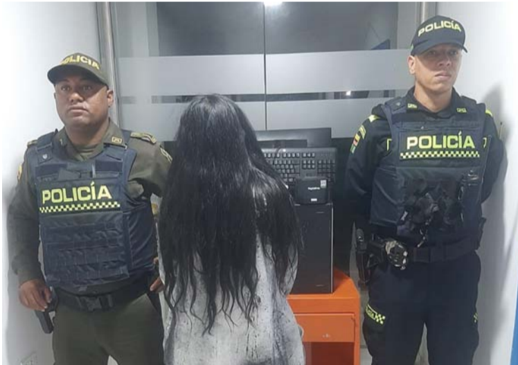
La mujer y los elementos incautados fueron trasladados hasta las instalaciones de la URI de San Juan del Cesar.

der una pantalla de televisor, una CPU, un monitor, un teclado y una mini impresora para los tiquetes y veinte mil pesos colombianos en efectivo.