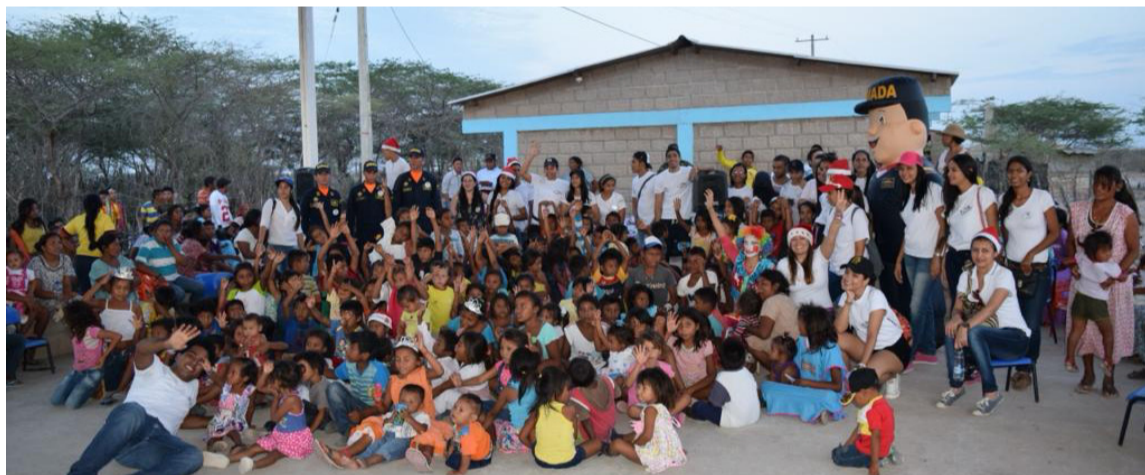
Más de 8.000 menores se han visto beneficiados de la tarea que adelanta la fundación.