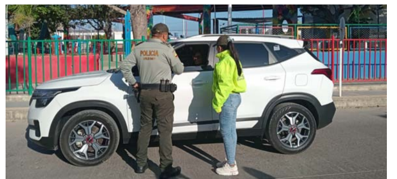
Se ejercieron controles y se brindaron recomendaciones preventivas para tranquilidad de movilización a ciudadanos.

solicite la marcación de los repuestos y accesorios de su motocicleta; evite transitar por vías peligrosas y/o estacionarse en lugares oscuros y solitarios; cuando adquiera una motocicleta, verifique sus antecedentes.