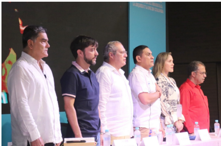
La propuesta de Name no es una iniciativa en solitario, son varias las voces que tienen diferentes puntos de vista.

Expresó que “Las regiones autónómicas es una propuesta casi desesperada frente a momentos de crisis que tiene ya nuestro