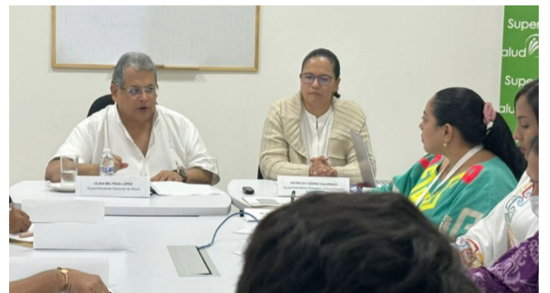
Supersalud activó los mecanismos necesarios para que las poblaciones de mayor vulnerabilidad sean atendidas.

De esta manera la Supersalud activa los mecanismos necesarios para que las poblaciones de mayor vulnerabilidad sean atendidas de manera prioritaria y continuar cumpliendo el compromiso de ser una entidad amiga, aliada y solidaria con los usuarios de la salud.