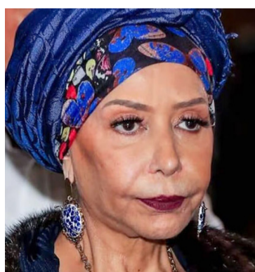
Senadora de la República, Piedad Córdoba, fallecida.

mañana martes 23 se realizarán sus exequias en la funeraria San Vicente de Medellín desde las 2 de la tarde y de ahí se trasladarán sus restos para darle cristiana sepultura.