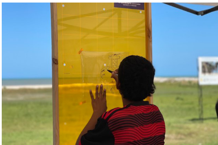
Niño dibujando el faro, cuya inversión supera más de 489 millones de pesos.

“Le genera desarrollo, aumentar sus capacidades, mucha cultura, entendimiento y conocimiento para los estudiantes, pero sobre todo la llegada de más turistas para engrandecer al Distrito”, precisó. En tanto, la comunidad espera que esta vez este proyecto realmente sea una realidad y no termine en una frustración más para la ciudad.