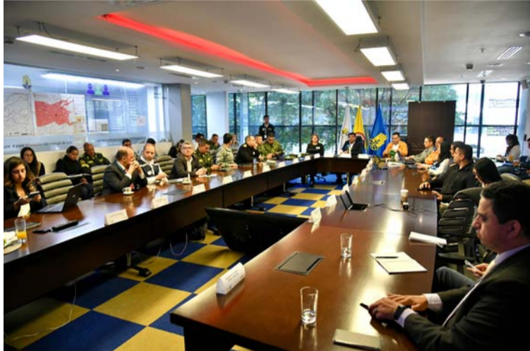
Gobierno llamó a los alcaldes y gobernadores para que reporten los municipios con desabastecimiento de agua.

El director encargado de la Unidad Nacional para la Gestión del Riesgo de Desastres (Ungrd), Víctor Meza Galván, expresó que el objetivo del PMU es realizar un seguimiento al Plan