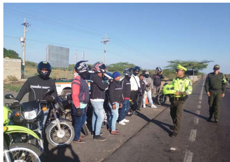
Estas jornadas en la Troncal del Caribe se hacen para reducir accidentes viales y acciones que pongan en riesgo la vida.

Estas actividades correspondieron a pausas activas, información actual del estado de las vías, además, de recomendaciones para conducir a la defensiva, así como orientación y retroalimentación de las normas de tránsito y transporte a los taxistas en el municipio de Maicao y otros de La Guajira.