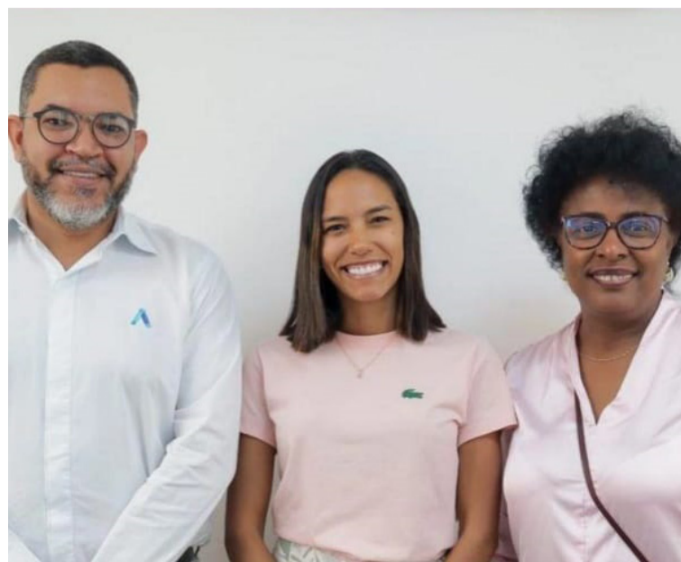
El encuentro busca establecer estrategias colaborativas para el desarrollo social y económico del Departamento.

Finalmente, Air-e liderará mesas técnicas con los alcaldes de los quince municipios de La Guajira con el fin de avanzar en las distintas líneas de trabajo.