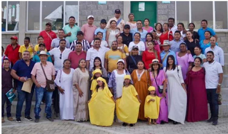
Esta iniciativa demuestra el compromiso de Aguilar en trabajar con las comunidades para garantizar una educación de calidad.

En el encuentro se focalizó en aspectos esenciales como el transporte escolar, contratación previa, canasta alimentaria y el Programa de Alimentación Escolar (PAE). El objetivo principal es garantizar las condiciones adecuadas para el regreso a las aulas de los niños pertenecientes a estas comunidades.