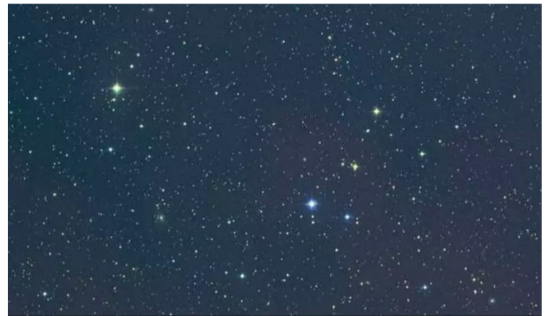
Los investigadores se centraron inicialmente en estudiar las galaxias de bajo brillo superficial (LSB).