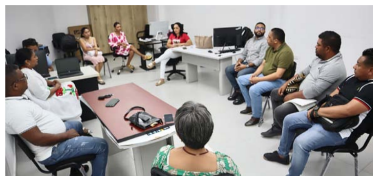
El Gobierno de Miguel Felipe Aragón González, busca convertir las dificultades en oportunidades.