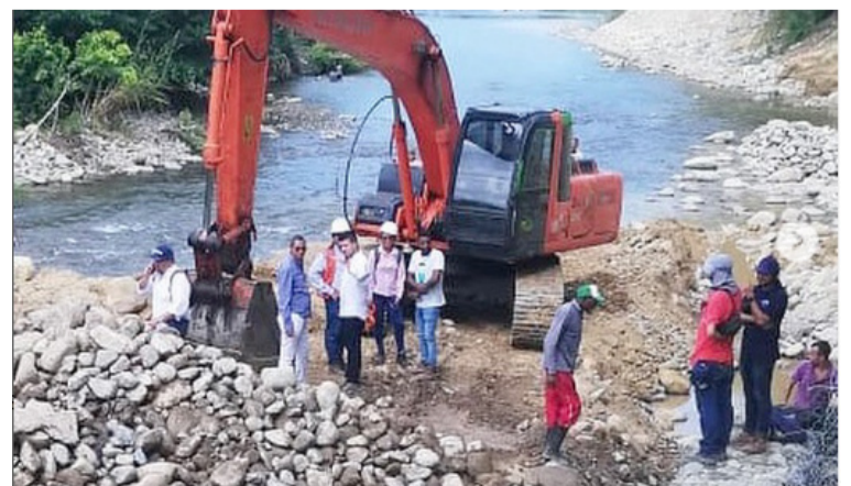
Con este proyecto se atiende la alta tasa de sedimentos del cauce en un amplio sector del río Cañas.

Se estima que al menos mil personas del municipio de Dibulla se beneficiarán directamente con la implementación del proyecto.