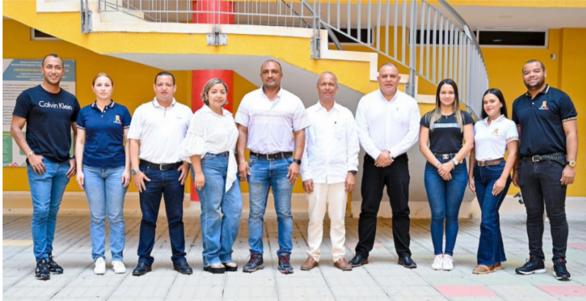
El programa marca un hito en la historia institucional al ser el primer doctorado propio.

Conviene destacar que el plan de estudios de este doctorado, contempla los enfoques de la innovación social, inclusiva, transformativa y étnica, lo que implica un claro interés por las necesidades sociales, la