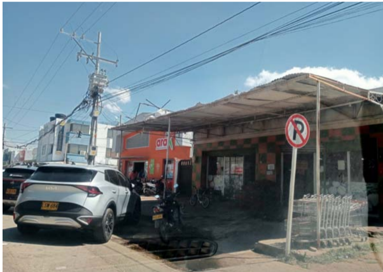
Las autoridades señalaron que al parecer los delincuentes ingresaron por la parte de atrás del establecimiento.

El suceso se registró la madrugada del lunes en las instalaciones de la Comercializadora 'Mega Fruver Del Campo', ubicada en la calle 13 con carrera 19, avenida principal del municipio de Fonseca, sur de La Guajira, donde ingresaron