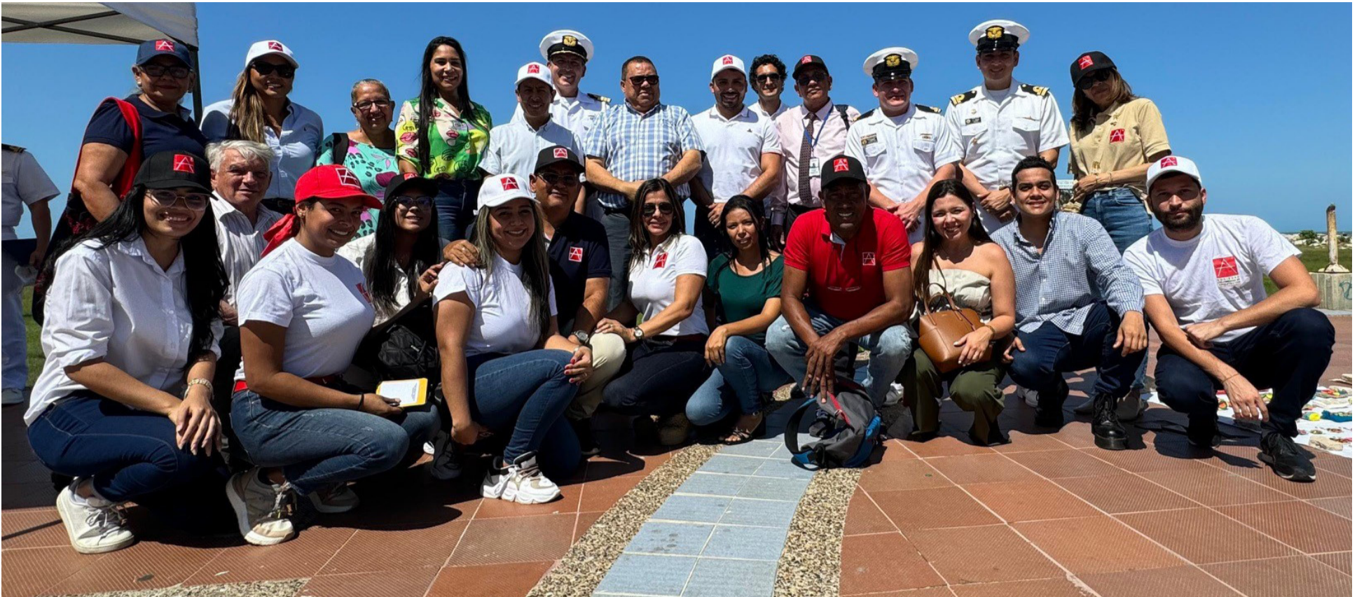
Participantes del encuentro que se realizó en la ciudad de Riohacha, con representantes de las distintas instituciones.