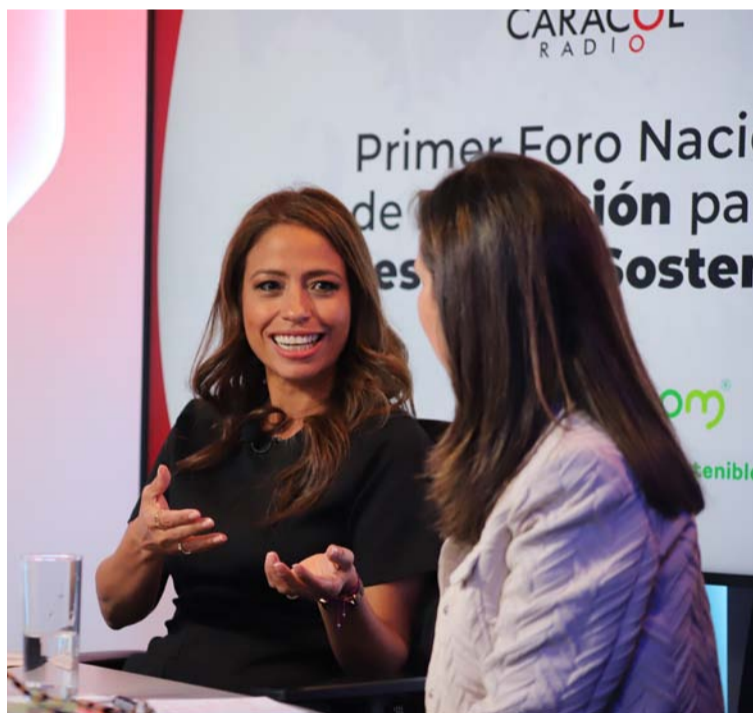
Cree en el poder de las alianzas; ha generado sinergias con más de 200 empresas locales, nacionales e internacionales.

cionales e internacionales, en el sector público y en organizaciones sin ánimo de lucro, con reconocimiento nacional e internacional por su profundo conocimiento de la Agenda 2030 y la implementación de proyectos alineados con los Objetivos de Desarrollo Sostenible (ODS).