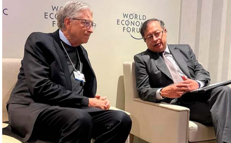
El presidente Gustavo Petro le planteó a Gates la posibilidad de que Colombia se convierta en hub de la IA.

Colombia fue, de acuerdo con el mandatario, protagonista en el Foro de Davos y estuvo en el centro de las discusiones, aportando a la construcción de problemáti-