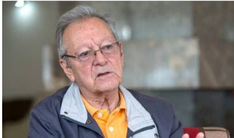
Al general (r) del Ejército Nacional, Jesús Armando Arias Cabrales, le fueron retiradas sus condecoraciones.

Y por ese episodio fue condenado por el Juzgado 51 Penal del Circuito de