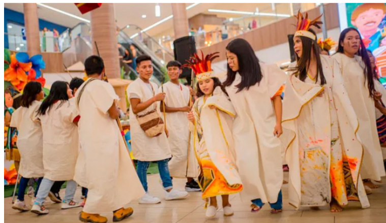
Participaron miembros de la etnia Yukpa, y toda la colonia becerrilera ubicada en la capital del departamento.