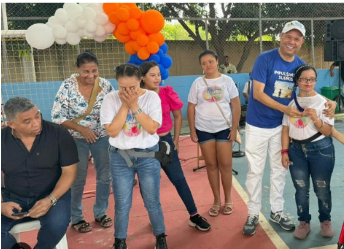
La historia le reconocerá su labor, cuando se mejore la interlocución con el Gobierno nacional.

Es por todos sabido, que donde hay luz hay sombras; que donde está el bien abunda el mal y donde está Dios llega Satanás tratando de destruirlo todo y generar el caos. Pero también es menester recordar, que nadie es más porque lo aplaudan ni menos porque lo vituperen, lo injurien o lo calumnien, lo que el alcalde de San Juan es, eso es. Estamos frente al mejor alcalde de La Guajira, de los 170 municipios Pdet del país y entre los 15 mejores de Colombia.