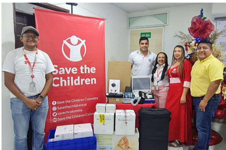
Con estos equipos se fortalecerá el programa PCI del hospital y se mejora la calidad de la atención brindada.

Entre los equipos recibieron monitores de signos vitales, hemocue, equipos antropométricos, saturómetros,