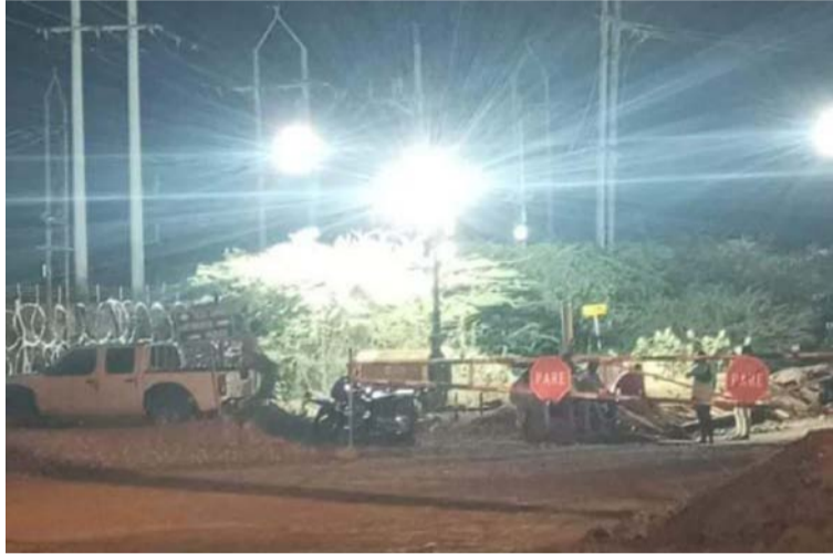
Las comunidades se quejan del incumplimiento de acuerdos que se han concretado desde el año 2022.

Se pudo conocer que algunas de estas comunidades que se encuentran en el bloqueo son Roche, Tabaco, Manantialito, Barrancón, Sierra Azul, Cocotazo, San Francisco y Tamaquito, entre otras, las cuales están exigiendo el cumplimiento