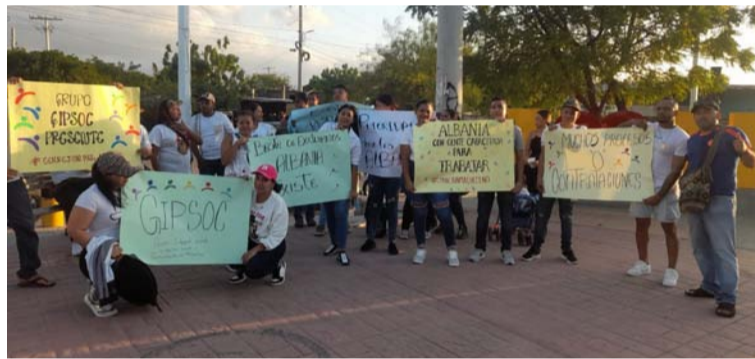
Dicen los manifestantes que Cerrejón engaña a los jóvenes porque le hacen los exámenes para el ingreso y todo queda allí.