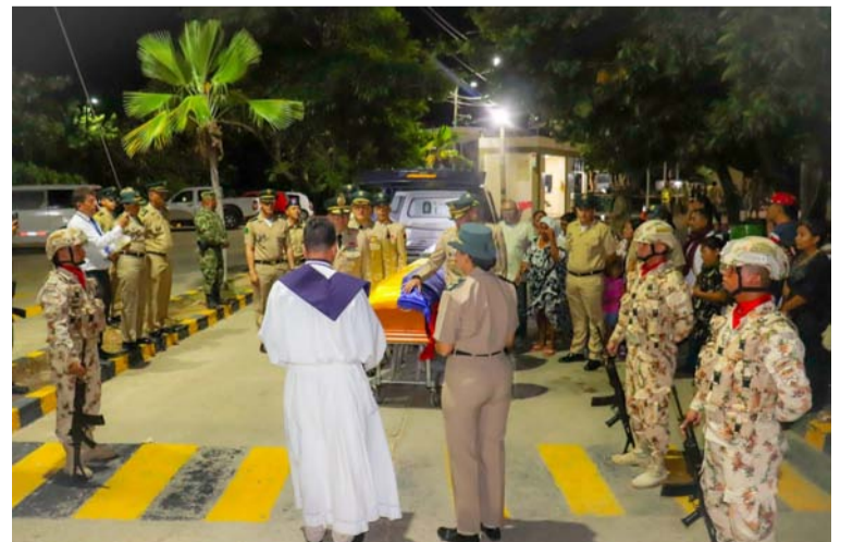
Con honores fueron despedidos los militares que resultaron muertos en un enfrentamiento en zona rural de Riohacha.

Luego de recibir todos los honores póstumos, el cabo primero fue enviado para el municipio de Subachoque en el departamento de Cundinamarca, donde con gran dolor sus familiares esperaban su cuerpo para darle cristiana sepultura.