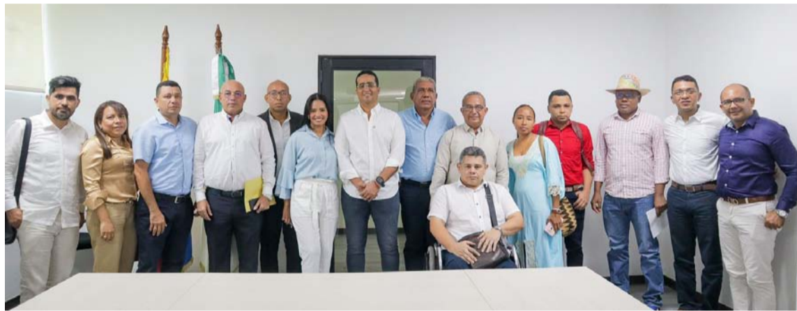
El gobernador y la secretaria de Educación dieron posesión a los directivos docentes.

deseándoles muchos éxitos y sabiduría en su labor, a la vez que les hacemos un llamado para que trabajemos en equipo por la cobertura y la calidad en nuestros establecimientos educativos”, dijo.