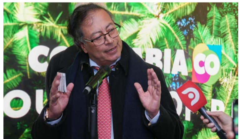
Las declaraciones del jefe del Estado se produjeron durante la inauguración de la Casa Colombia en Davos, Suiza.