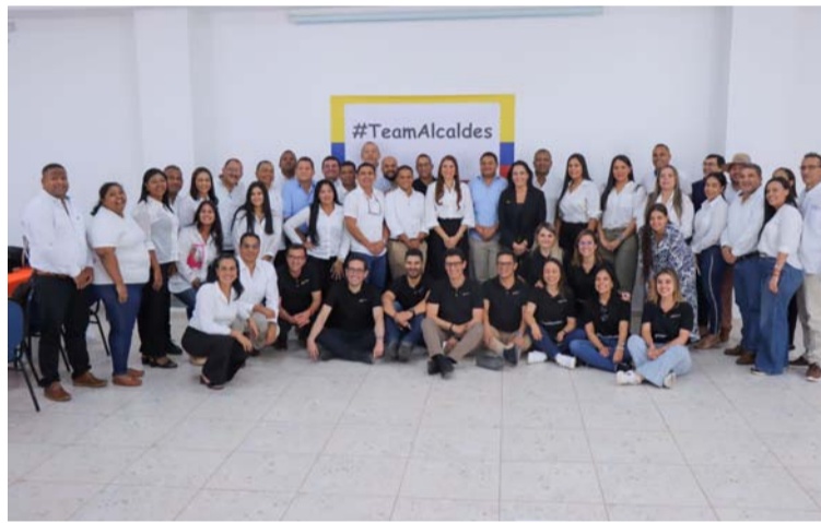
Las mesas se centraron en impulsar la economía local, generar empleo y fomentar el desarrollo económico y social.

“La priorización de Riohacha para el Centro de Pensamiento de Asocapitales fue muy importante por todos los retos que tenemos con la población indígena, pero además frente a los temas de agua, de turismo y