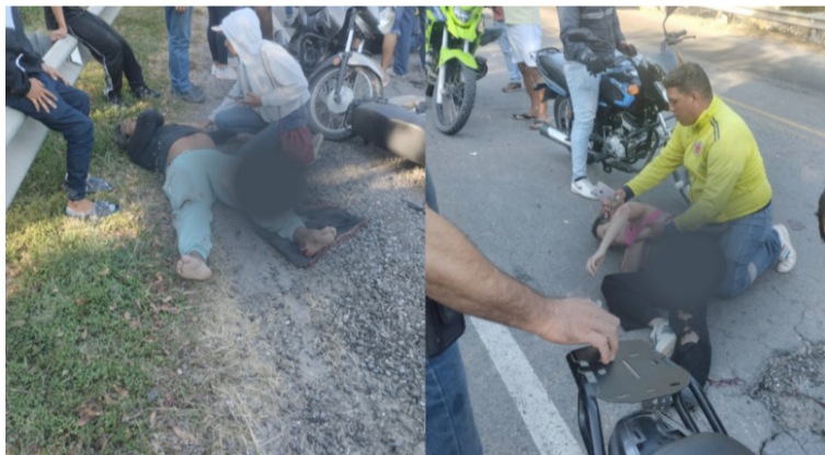
Las causas que manejan las autoridades sobre este accidente son atribuidas al mal estado de la vía en el sector.

Estas personas fueron socorridas por habitantes del sector y trasladadas hasta