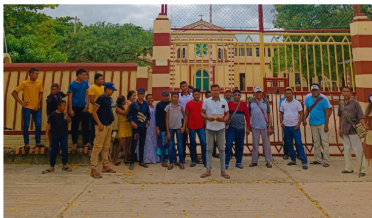
Para la Diócesis está amenazada la seguridad de los estudiantes, los feligreses y el personal adscrito a la institución.

en el portón para impedir el ingreso de la comunidad al establecimiento educativo y a la parroquia San Antonio, hecho que no solo afecta los derechos a la propiedad privada que tiene la Diócesis de Riohacha sobre el predio, sino que también está siendo amenazada la seguridad de los estudiantes, de los feligreses y del personal adscrito al establecimiento educativo.