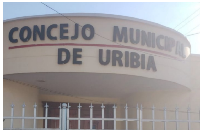
En el fallo se indica que se declara improcedente la acción de tutela por quebrantarse el principio de subsidiariedad.

Se precisa también que en los casos bajo estudio no fue demostrado un perjuicio irremediable que le permita al juez constitucional estudiar la vulneración de derechos fundamentales por lo tanto la primera línea de acción judicial para estudiar el caso le corresponde a la jurisdicción contenciosa administrativa.