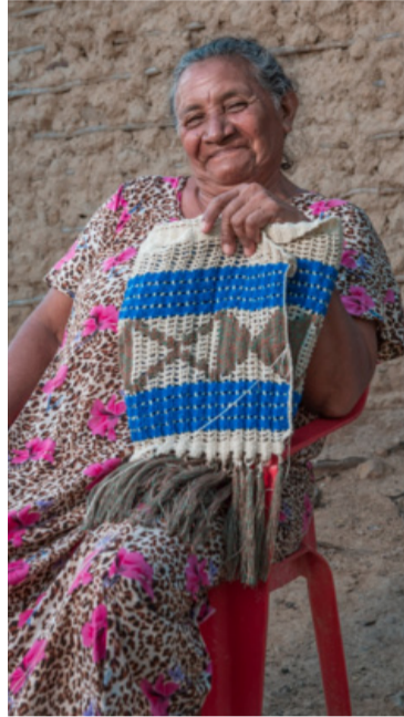
Esto hace parte del mejoramiento de la calidad de vida y del fortalecimiento económico de las comunidades.