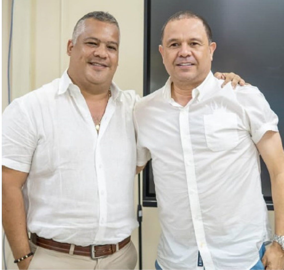
San Juan nunca pensó que estaba frente a un líder auténtico de esos que ya no vienen.

El Gobierno municipal de San Juan se hizo acreedor a dos premios de alta gerencia por parte del Departamento Administrati-