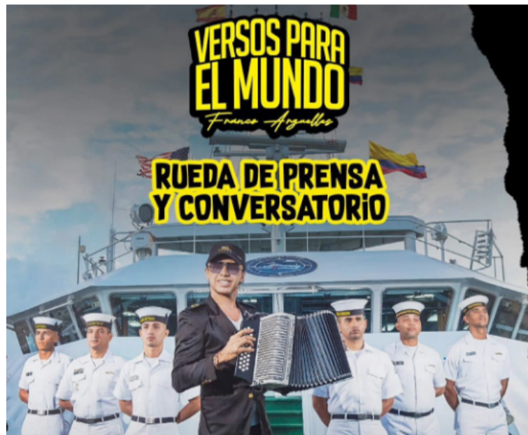
Su nuevo álbum titulado ‘Versos para el mundo’ será presentado mañana en rueda de prensa en Valledupar.