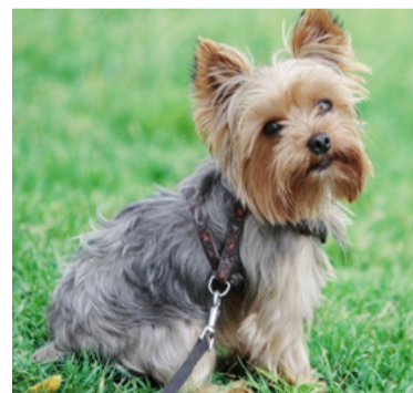
Los perros siguen ocupando una de las opciones preferentes a los que les es recomendado tener un animal.

Yorkie terrier: Estos pequeños y juguetones son perfectos para servir como animales de apoyo emocional, debido a sus características como el cariño que re-