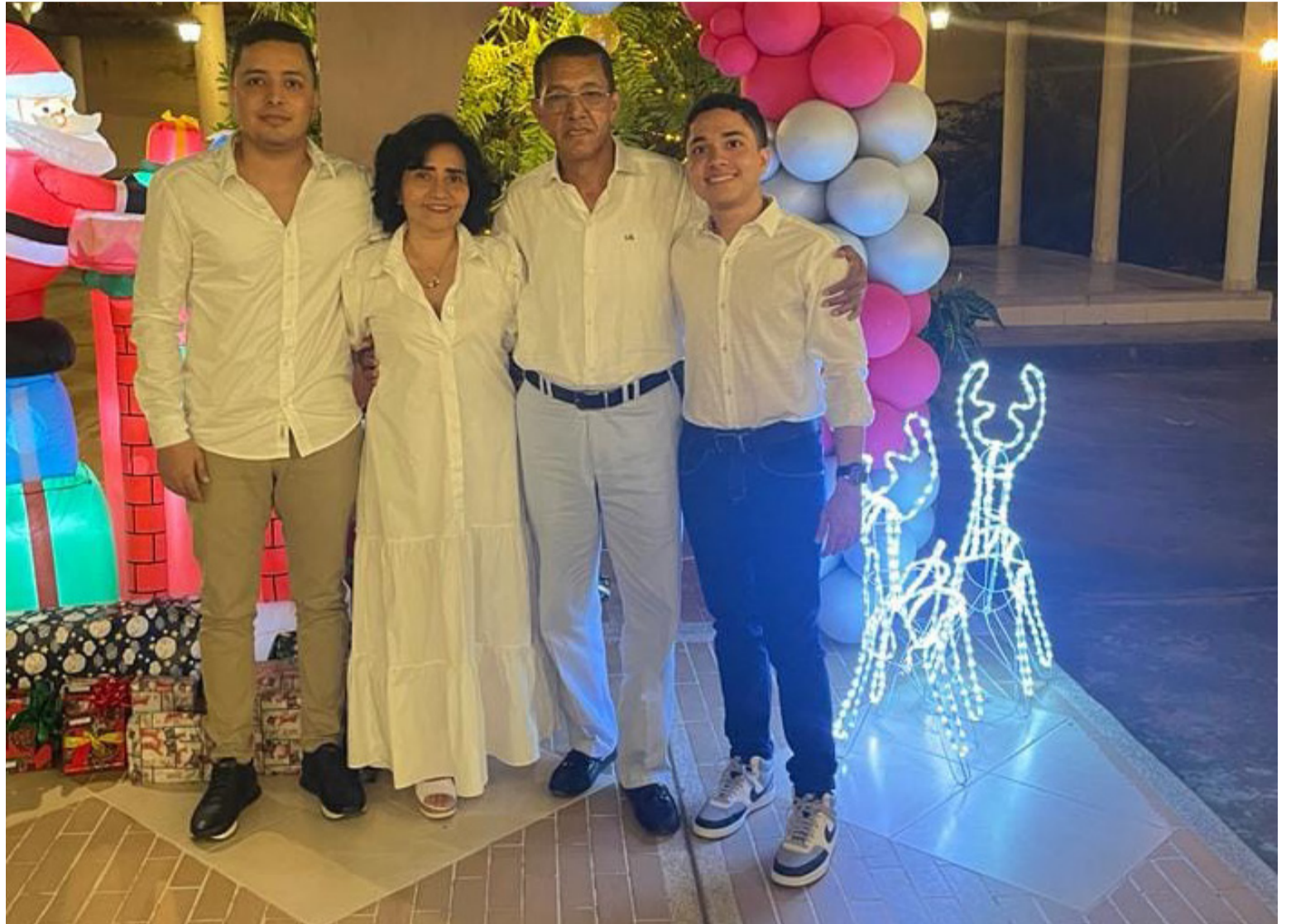
En 2020 es nombrado por el alcalde de San Juan como secretario de Planeación hasta el 31 de diciembre de 2023.

Fue nombrado jefe de Planeación Municipal en 2001 y encargado de la Alcaldía municipal de su tierra natal. Después se desempeñó como contratista de obras públicas del estado y como consultor e interventor. Fue nombrado director del Departamento Administrativo de Planeación en La Guajira.