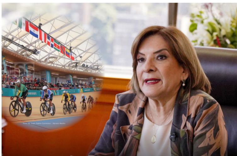
Aparentemente la jefe de la cartera pasó por alto dar cumplimiento a los artículos 1, 2 y 6 del decreto 1670.

la ocurrencia de conductas presuntamente irregulares, para determinar si constituyen faltas disciplinarias, el posible perjuicio causado y definir si se actuó o no al amparo de una causal de exclusión de responsabilidad.