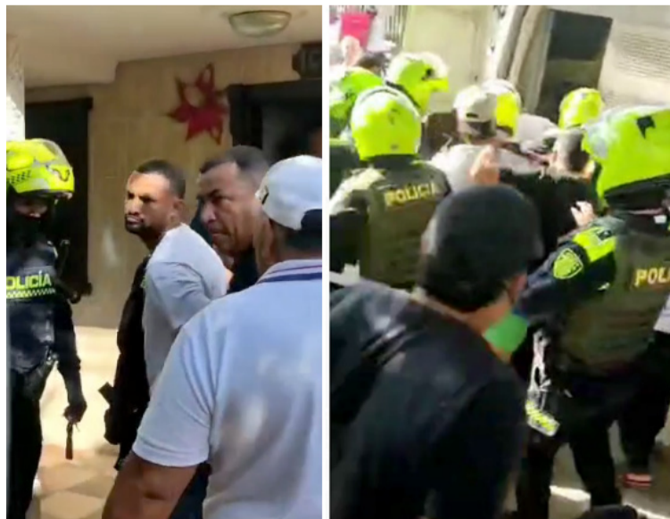
Los uniformados casi no podían proteger al sujeto, al que la turba atacaba a golpes incesantemente.