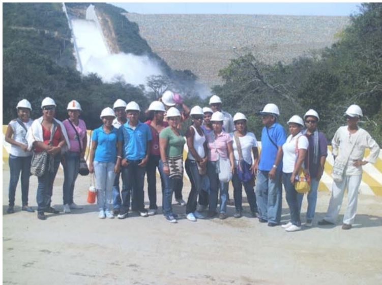
La visita a las instalaciones de la Represa del Río Ranchería es un paseo refrescante y ambiental de este histórico sitio.

cada vez que haya un motivo especial como los cumpleaños, grados, bautismo, matrimonio, semana santa, reconocimientos especiales,