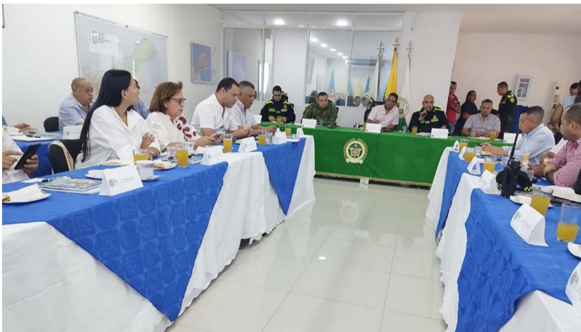
El objetivo primordial del escuadrón es garantizar la normalidad del tránsito en las vías.

Policía Nacional agradeció al gobernador y a los alcaldes por participar en este evento, orientado a consolidar la seguridad y la convivencia ciudadana.