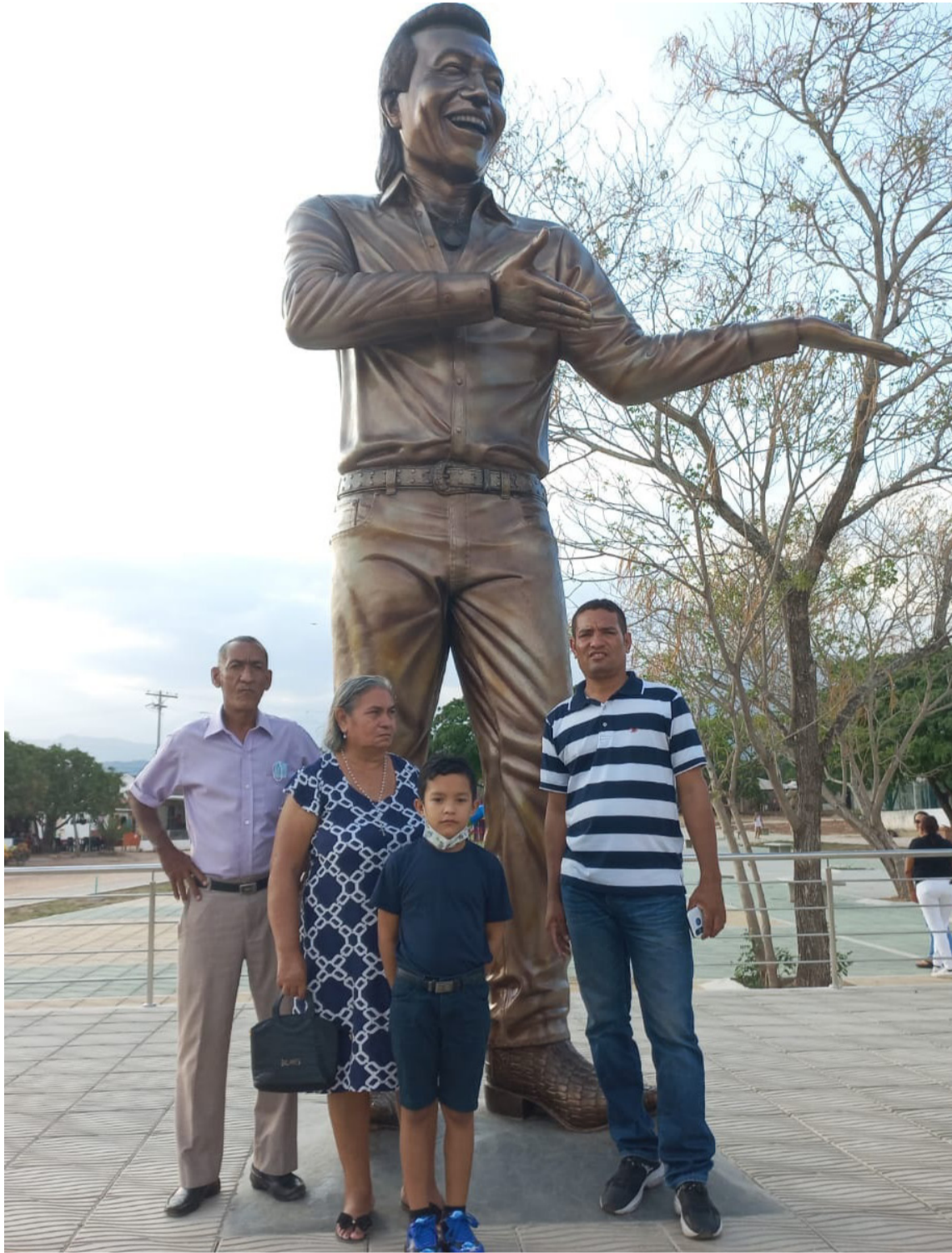
Parque del Cacique en La Junta, es un lugar propicio para visitar en familia y comentar la importancia musical de Diomedes Díaz acompañado de sus canciones.

Otro de los propósitos es recuperar las buenas costumbres que se han perdido, con el uso masivo de los celulares, donde las familias se han desintegrado, debido a que cada uno está pendiente de leer, chatear o jugar en su iPhone 15, Samsung, Apple, Xiaomi, Motorola, Huawei, Oppo y Honor, etc., debemos reunirnos en familia y las amistades