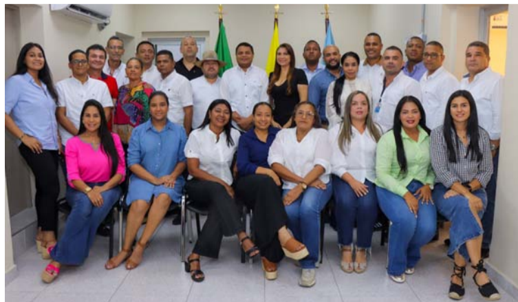
El alcalde riohachero aseguró que este será un equipo receptivo, proactivo y dispuesto.

“Nuestra prioridad es la gente, seremos un equipo de gobierno con un propósito que Dios nos ha en-