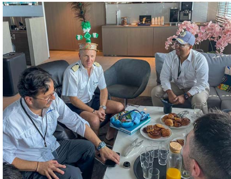
Recibir a turistas extranjeros en el Cabo de Vela, genera un impacto positivo al dinamizar la economía local.

En estrecha colaboración con ProColombia, esta empresa desarrolló una hoja de ruta para la promoción y habilitación del destino en La Guajira, con el propósito de establecer condiciones ideales para recibir cruceros y garantizar una experiencia excepcional para los visitantes. La colaboración y apoyo esenciales de la Gobernación de La Guajira también desempeñaron un papel clave al facilitar la gestión de requisitos específicos para la atención de cruceros expedicionarios en este destino.