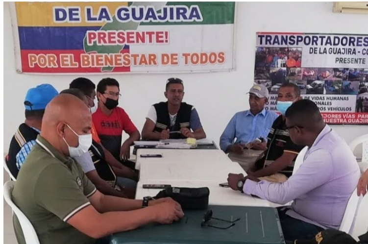
Los temas a tratar serían combustible subsidiado vías, transporte diferencial (ZET), y seguridad.

“Conociendo de usted, su gran labor desempeñada de excelentes gestiones de manera articulada, buscamos en estos momentos por medio del diálogo y la concertación, soluciones prontas a nuestras problemáticas que en estos momentos afectan no sólo a nuestro gremio de transportadores si no a la comunidad en general un problema Socio- económico y de atraso a nuestro Departamento”, manifiestan