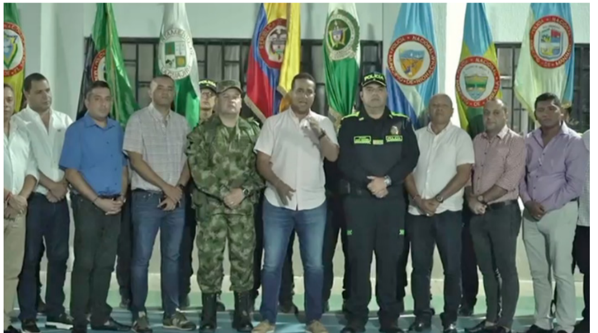
Se establecieron estrategias claves y planes de seguridad para tranquilidad de los guajiros.

El gobernador enfatizó que más de 180 policías que actualmente se encargan de la custodia de internos, deben ser destinados a brindar seguridad en las calles, resaltando que la seguridad es una prioridad.