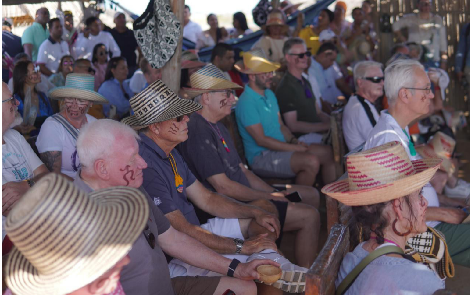
Se organizaron actividades que brindaron a los visitantes internacionales la oportunidad de disfrutar de paisajes únicos.

La funcionaria agregó que “llevamos a cabo un proceso estratégico destinado a atraer la atención de