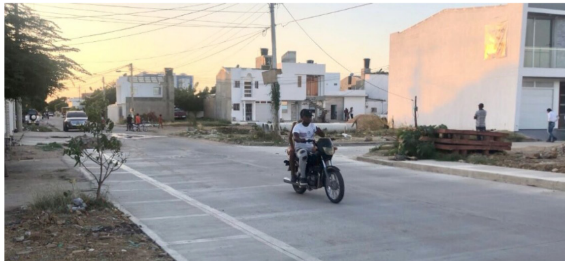
La obra optimiza el funcionamiento del colector principal del sistema de alcantarillado.

“Este tramo que entregamos a la comunidad busca recuperar el buen funcionamiento y mejorar la infraestructura sanitaria de la ciudad que tiene más de 50 años de antigüedad, lo que ha generado constantes fallas que ocasionan emergencias sanitarias. La culminación de este tramo ubicado en Las Tunas marca un importante logro en