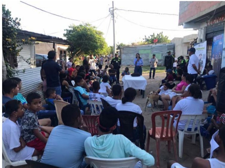
El grupo de infancia proporcionó charlas preventivas sobre maltrato infantil, abuso sexual y consumo de alucinógenos.

El personal de policía de vecindario presentó su portafolio de servicios en