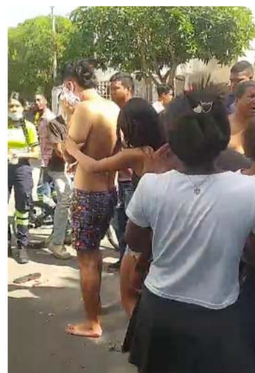
Se conoció que el conductor del vehículo tipo automóvil fue retenido por los presentes.

cuando al parecer un vehículo se voló la escuadra e impactó de frente con el conductor del liviano rodante dejándolo tendido en el suelo.