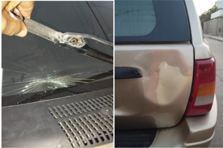
Denuncian que los jóvenes llegan con un plan y terminan tirándose piedras y todo tipo de objetos.

Elsa Martínez, habitante del barrio Libertador, manifestó que esto no debe continuar porque ellos llegan con un plan y terminan tirán-