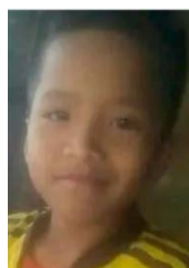
El menor de 11 que recibirá tratamiento sobrevivió al siniestro.

El siniestro aéreo sucedió el pasado domingo cuando el niño sería llevado a la capital del país para el tratamiento.