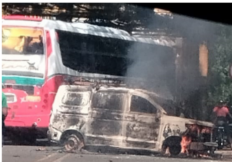
En los confusos hechos muere un usuario de Air-e a quien un técnico de la empresa le suspendió el servicio.

A través de un comunicado de prensa la empresa contratista Dominion, expresó su pesar y lamentó los hechos ocurrido la tarde del miércoles 10 de enero en el corregimiento de Mingueo, jurisdicción de Dibulla, donde una persona murió al parecer de forma accidental luego de un intento de agresión a un técnico de la compañía que labora para la empresa Air-e.