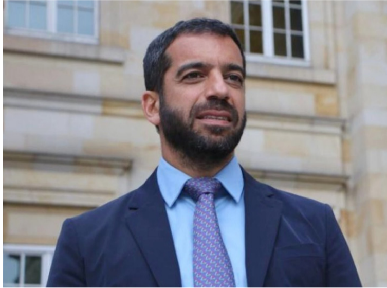
Ex senador de la República Arturo Char investigado por la Corte Suprema, por presunta compra de votos.

Esto es lo que dice el juez en el auto: “Ello aunando al hecho que si se cuentan los términos desde el 7 de septiembre de 2023 hasta la interposición del Habeas