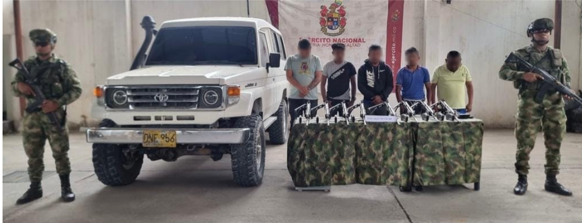
El Ejército capturó a 5 hombres que se movilizaban por La Guajira con material de guerra.

Este resultado se logra gracias al trabajo de los soldados del Grupo de Caballería Blindado Mediano GR Gustavo Matamoros D'Costa quienes en el desarrollo de la campaña 'Viaje Seguro, su Ejército está en la vía', ubicaron dos vehículos que transitaban entre el corregimiento Bahía Porte-