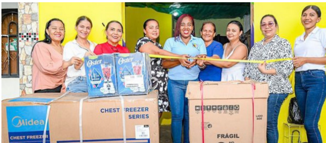
Entre los implementos proporcionados se incluyen lavadoras, licuadoras y neveras.

Entre los implementos proporcionados se incluyen lavadoras, licuadoras, máquinas de coser, fileteadoras, neveras, congeladores, estufas, mesas, sillas,