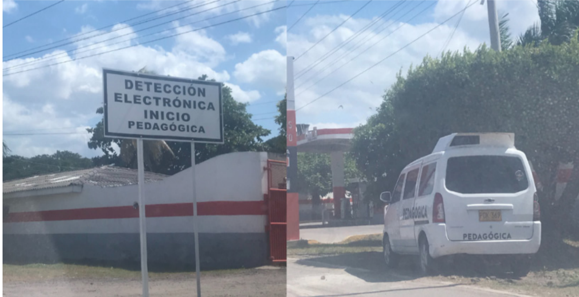
Afectados hablan sobre falta de voluntad política para solucionar problemas del gremio.

También señalan que esta cámara de fotomulta fue colocada sin el lleno de los requisitos legales consa-