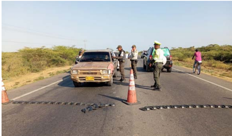
Los uniformados llevaron a cabo campañas pedagógicas con la meta de lograr una disminución en las fatalidades.

La estrategia se cumple en el Puesto de Control Vial Número 4 ubicado en el KM 82 con el fin de velar por la seguridad, la tranquilidad y la convivencia de niños, niñas, adolescentes, turistas nacionales y extranjeros, y comunidad en general, para garantizar el éxodo y un re-