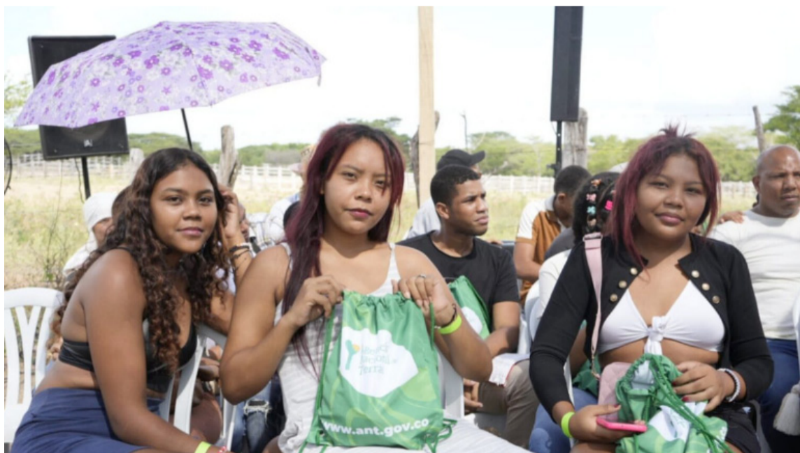
La Agencia le compró a un particular cuatro fincas colindantes, en Villa Martín, Riohacha.

De esta manera, alrededor de 1.000 personas se benefician de 1.454,8 hectáreas en la reforma agraria, una de las políticas fundamentales del Gobierno del Cambio para buscar paz total, justicia social y ambiental en Colombia, en la ruta de que el país sea una potencia de la vida.