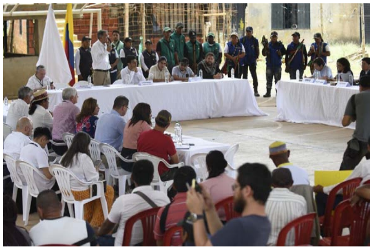
Uno de los mayores acuerdos alcanzados es el compromiso del EMC de renunciar al secuestro con fines económicos.

Las delegaciones del Gobierno nacional y el Estado Mayor Central (EMC), principal de las disidencias de las Farc, volverán a sentarse hoy martes, para una tercera ronda de negociación de paz que se llevará a cabo en la capital del país y que se extenderá hasta el 18 de enero, según confirmaron ambas partes.