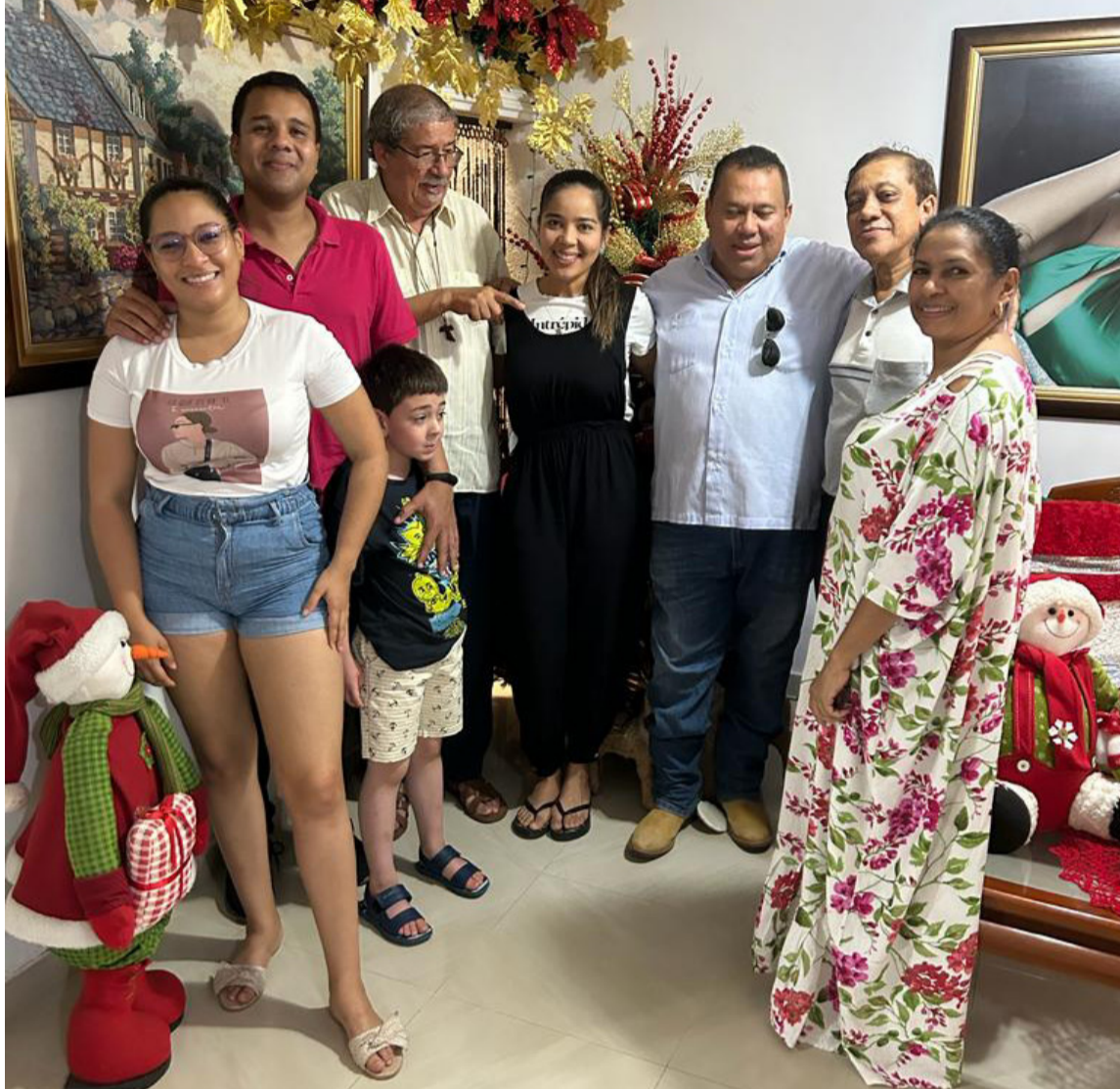
En familia se acostumbra a despedir al año viejo para expresarse mutuamente los deseos de un Feliz Año, acompañados del riguroso abrazo a los familiares.