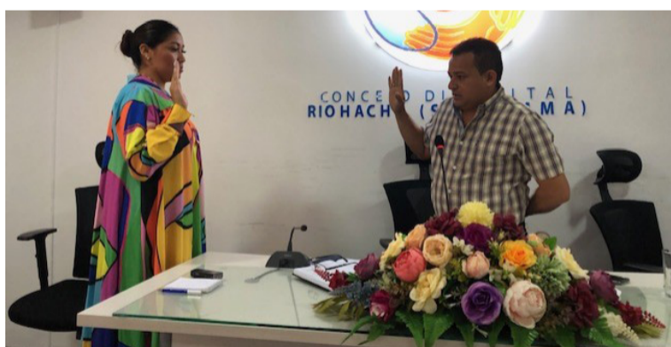
La concejala Sijona se declaró en oposición para lograr ser elegida primera vicepresidenta de la Corporación.

Agregó, "créanme que en mí tendrán una secretaria de día y de noche, estaré disponible a la hora que me necesiten".