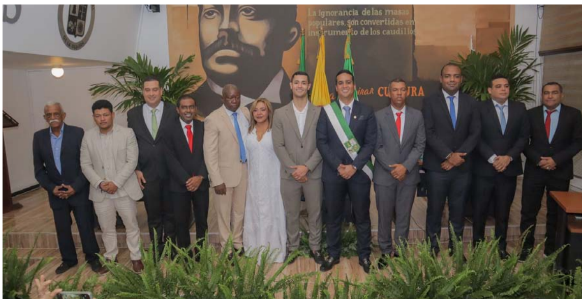
Los nuevos mandatarios inician sus gobiernos en los que sus paisanos tienen fincadas las esperanzas de que van a cumplir con la promesa que hicieron en campaña.

“Diciembre alegre te fuiste, diciembre alegre vendrás” Emiro Zuleta Canción ‘Diciembre alegre’ Hnos. López-J. Oñate 1971.