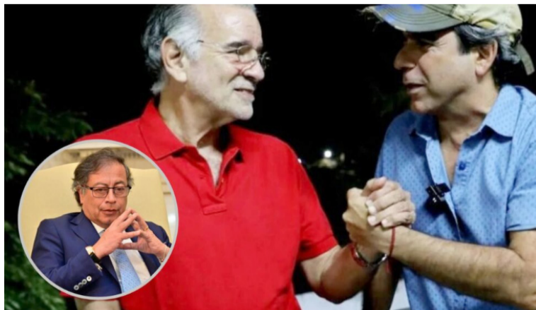
De ninguna manera Barranquilla puede perder la sede de los Juegos Panamericanos, dijo el gobernador Verano.

Este martes 9 de enero, se reunirán en Casa de Nariño el presidente Gustavo Petro, el alcalde de Barranquilla Alex Char y el gobernador del Atlántico, Eduardo Verano de la Rosa, para ultimar detalles del plan que presentarán para la recuperación de la sede de los Juegos Panamericanos 2027.