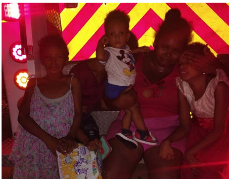
La conflagración ocurrió en la residencia ubicada en el barrio Villa del Rosario en el municipio de Villanueva.