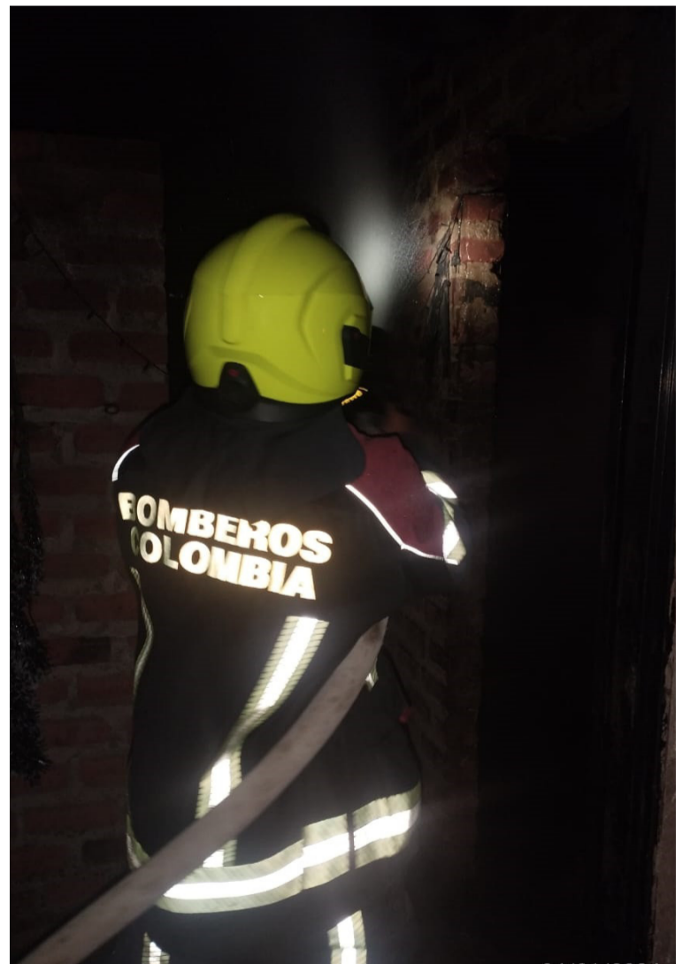
Bomberos descartaron que hubiera un corto circuito.

genitora. La madre de los niños pudo sacar a sus pequeños a tiempo.