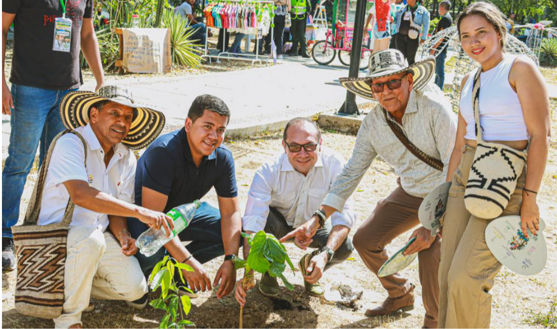
Sembratón de árboles nativos durante el III Festival 'Un Canto al Río' en Valledupar.