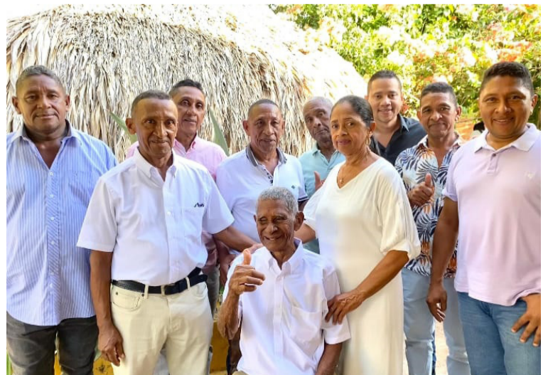
El veterano hombre hasta ahora se encuentra lúcido, tocando el acordeón que es una de sus pasiones.