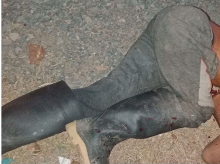
Las autoridades notificaron que el cadáver de hombre se encuentra como Cuerpo No Identificado (CNI).