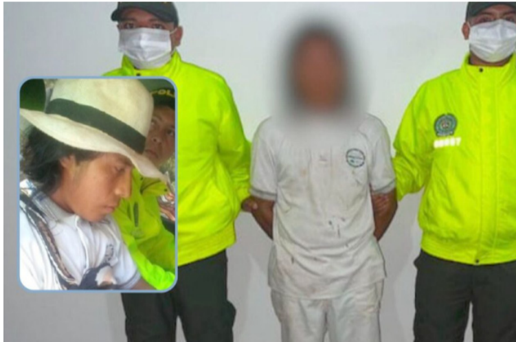
El dictamen emitido por Medicina Legal señaló que la menor presentaba hematomas en varias partes de su cuerpo.

Labores de policía judicial evidenciaron que el procesado, al parecer, sostuvo una discusión con su compañera sentimental, madre