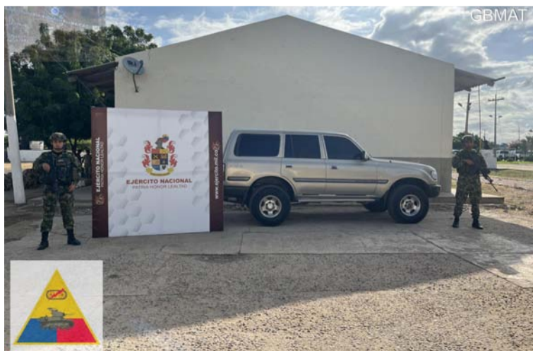
Las autoridades informaron que en el lugar donde se halló la camioneta abandonada no hubo capturas.

En desarrollo de operaciones militares por parte de las tropas del Grupo de Caballería Blindado Mediano General Gustavo Matamoros D'Costa, para incrementar el control de áreas (control territorial) para prevenir el hurto contra la población, se recupera un vehículo tipo camioneta que había sido hurtada por sujetos armados el 31 de diciembre del año 2023 en la troncal del Caribe a la altura del kilómetro 88.