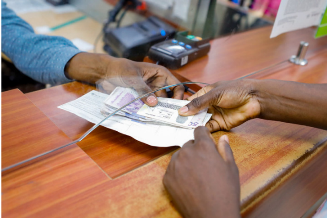
La entidad recomienda a los beneficiarios que realicen el cobro oportunamente.

La directora de Prosperidad Social, Laura Sarabia, anunció que 16.383 familias del pueblo wayuú, que tienen niños y niñas en primera infancia, fueron incorporadas en este ciclo. Recibirán esta transferencia en municipios como Manaure