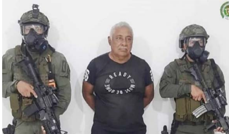
Una Corte Distrital para el distrito sur de La Florida requiere a 'Don Rafa' para que responda por cuatro cargos.

Además, en las investigaciones se refiere que él recibía el cargamento de clorhidrato de cocaína en el Catatumbo departamento del Norte de Santander, de donde era transportado por vía terrestre hasta la Alta Guajira.