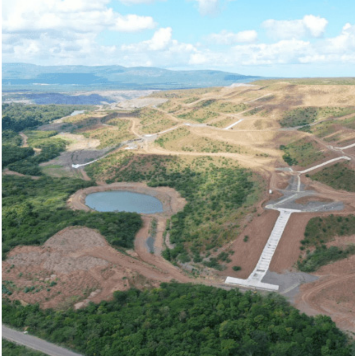
La empresa implementó un programa pionero en el país que permite rehabilitar las tierras.

“El estudio refleja los esfuerzos y la responsabilidad de la empresa que desde inicios de nuestra operación implementó un programa pionero en el país que nos permite rehabilitar las tierras, donde anteriormente realizamos minería a cielo abierto, y reforestarlas con especies y plantas nativas del bosque seco tropical de la mano