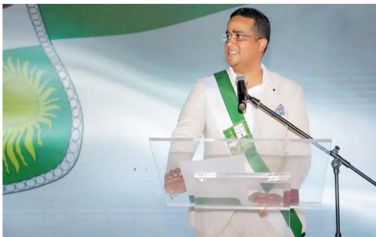
Los nombres de los profesionales los dio a conocer el mandatario seccional de La Guajira, el día de su posesión.