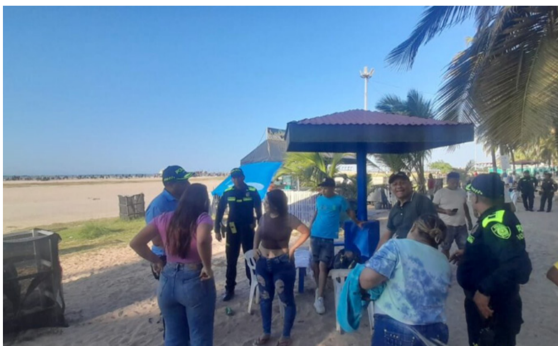
Fueron desplegadas 14 áreas de prevención, dos ambulancias y un equipo de emergencias.

El Departamento de Policía Guajira a través de la Seccional de Tránsito y Transporte, el grupo de Protección y las diferentes especialidades, fueron desplegadas a lo largo de las vías y sitios turísticos para garantizar un plan retorno tranquilo y seguro.