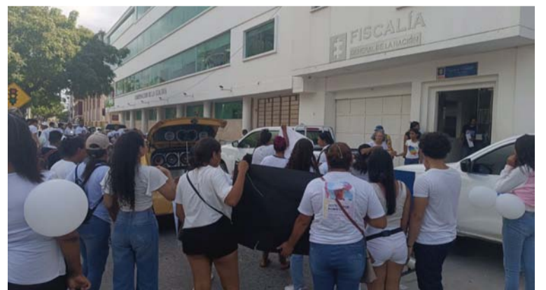
Al parecer quien arrolló al joven era un médico y la familia del fallecido cuestiona que no lo haya ayudado.