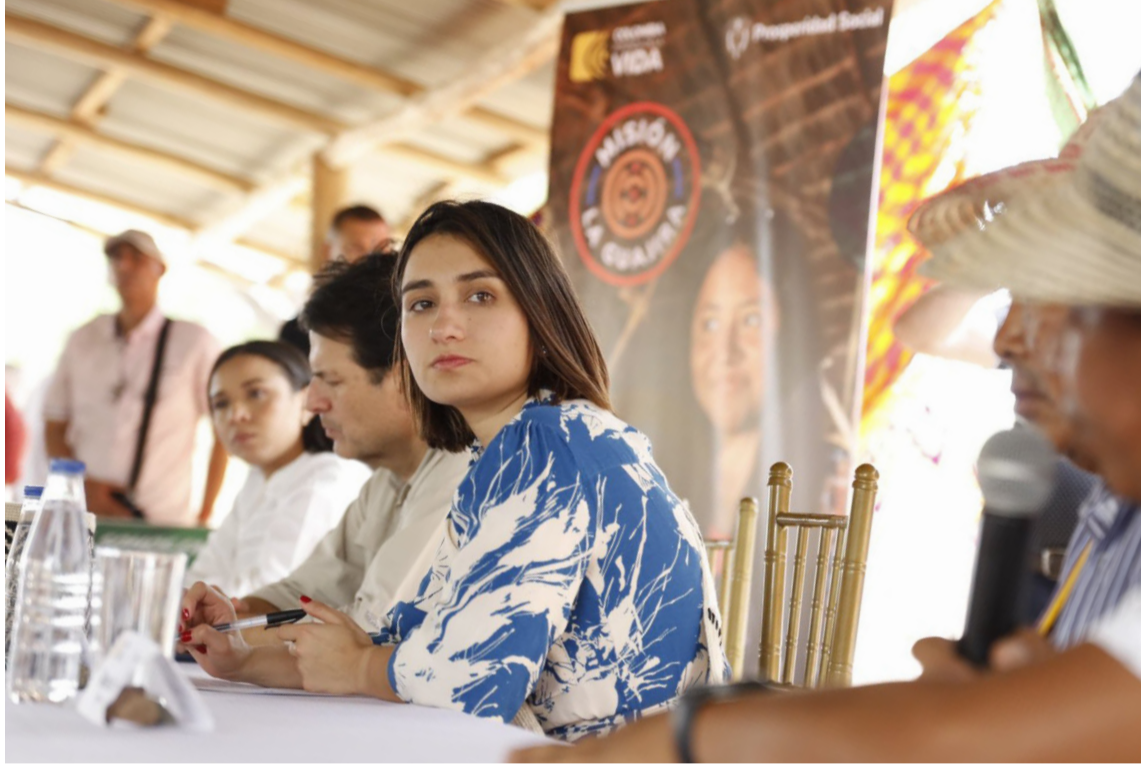
Serán intervenidas 74 comunidades de Manaure y Uribia, de más de 3.600 hogares wayuú.

“Desde Aval enfocaremos cuantiosos esfuerzos y recursos para contribuir a mejorar la calidad de vida de ustedes, que son los habitantes y protectores de esta región. No queremos que nuestra contribución se limite a una donación y ayuda humanitaria de una vez; vamos a aprender y a trabajar de la mano de ustedes y sus autoridades tradicionales, de Prosperidad Social y de los gobiernos locales, en el desarrollo de iniciativas concretas, para ofrecer soluciones estructurales y sostenibles”, expresó Sarmiento.