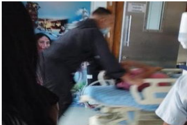
El ataque se presentó en el sitio conocido como Paradero, cuando viajaban a Maicao a hacer una diligencia.

Sin embargo, gracias a la valentía del conductor pudieron escapar de la lluvia de balas que dispararon contra el automóvil, el cual fue impactado en 11 oportunidades, y llegaron a un centro asistencial en el municipio de Maicao en donde les brindaron los primeros