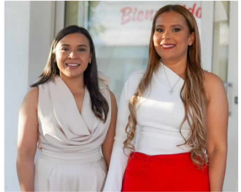
La gobernadora de La Guajira, Diala Wilches Cortina dijo que apelará la decisión ante el Consejo de Estado.

"Estamos preparados para defender la naturaleza de la creación de la empresa de Servicios Públicos de La Guajira, la cual está demostrando resultados concretos en la ejecución de obras para llevar agua potable al