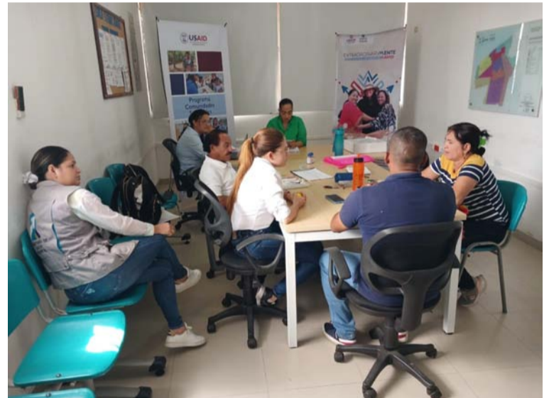
El objetivo de la ruta es contribuir a estrategias y políticas efectivas centradas en necesidades reales de las personas.

principios rectores de la Ruta de Atención Integral en Salud Mental, entre otros, la confianza sanitaria universal, el enfoque para garantía de derechos humanos, enfoque intercultural y