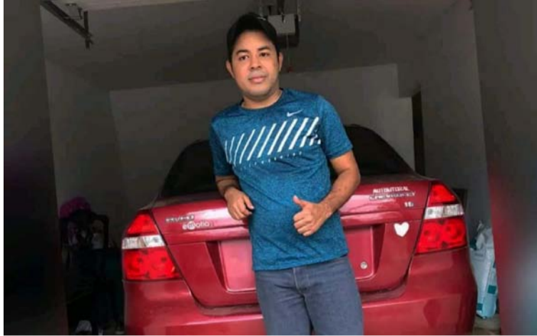
El trágico hecho se registró la noche del lunes en la calle 22 con carrera 14A de la ciudad de Riohacha.