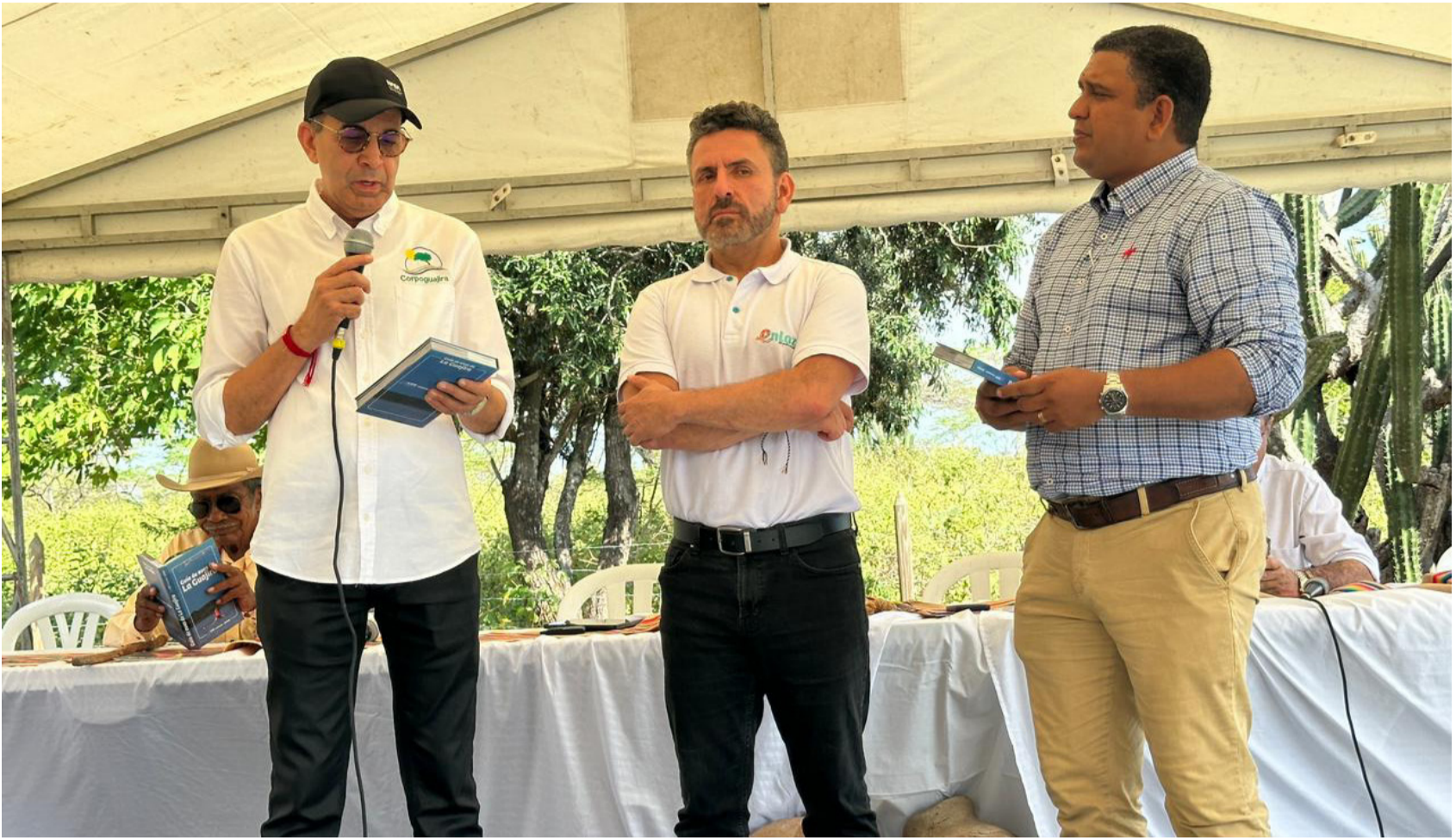
La Guía de Aves de La Guajira, presenta en detalle las características propias de 285 especies del Departamento.