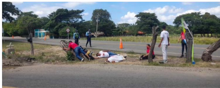
La dramatización del siniestro vial se llevó a cabo en 'La Ese' del sector conocido como 'Paradero' en Albania.