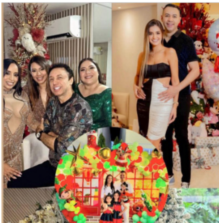
En las redes sociales se hicieron ver los artistas quienes han recibido buenos comentarios por sus indumentarias.

Por otra parte, cabe mencionar a 'El Caballero