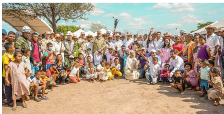
El Gobierno Nacional puso en marcha la Ley de Compras Públicas Locales en La Guajira para beneficiar a campesinos.

implementación de la Reforma Rural Integral. Y en consonancia con este enfoque, el presidente Luis Higuera anunció que en el 2024 esta agencia se convertirá en la mano amiga de los productores, gracias a lo cual se fortalecerá la comercialización sin intermediarios. “Se-