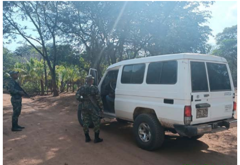
Los operativos arrancaron desde el primer puente festivo del 7 de diciembre y se extienden en toda la época decembrina.

Profesional U. Secretaria de Planeación.