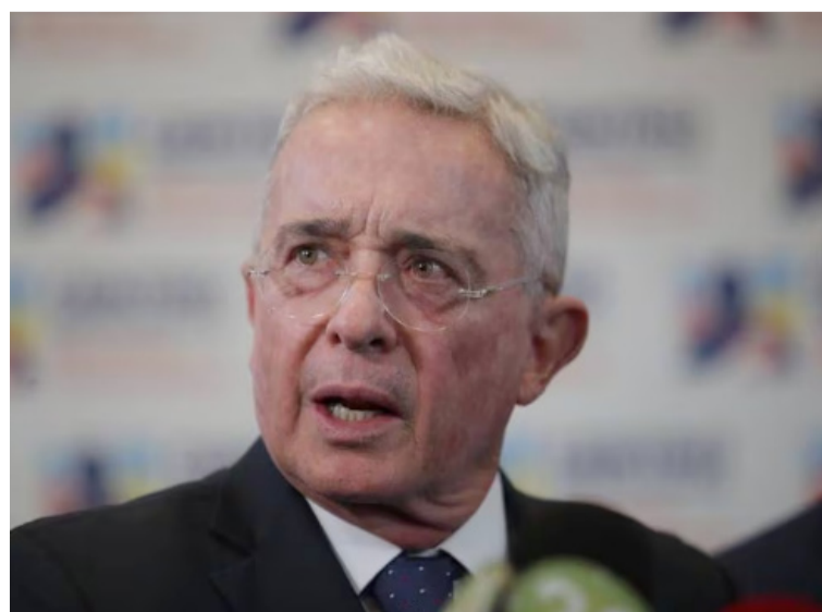
Uribe volvió a decir en su cuenta de X: "Jamás he sobornado testigos, menos personas presas durante nuestro Gobierno".

"Visité al fiscal Montealegre en 2014, y ya de exfiscal, con un discurso político enrabiado, me acusa de criminalidad de delitos de lesa humanidad", concluyó.