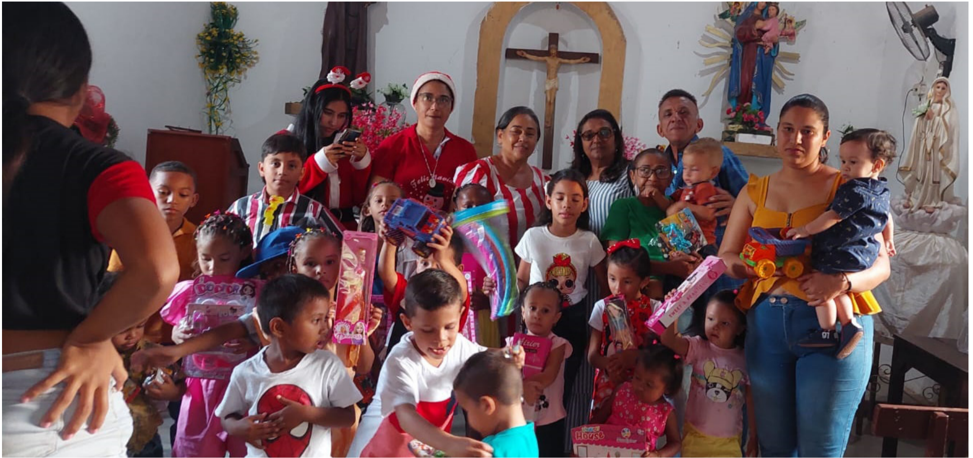
Los niños reciben regalos del Consejo Comunitario 'Zenobia Orozco Crespo' en Zambrano, municipio de San Juan del Cesar, La Guajira.

En el municipio de San Juan del Cesar, La Guajira