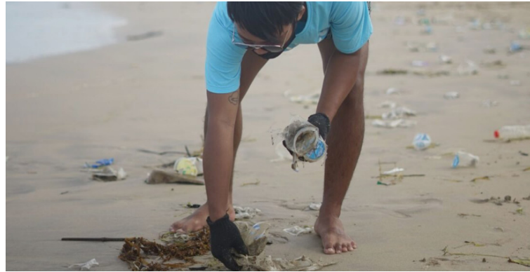
Se deben diseñar programas que fomenten la gestión adecuada de residuos y el uso de elementos reutilizables.

“La prohibición establecida en el artículo 12 de la ley 2232 de 2022 aplica para todas las áreas pertenecientes al Sistema Nacional de Áreas Protegidas, según se determina en el artículo 2.2.2.1.2.1 de este reglamento, al igual que para las áreas del Sistema Regional de Áreas Protegidas de acuerdo con los lineamientos que establezcan las au-