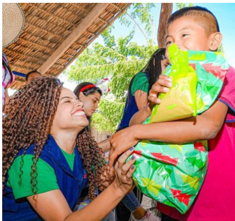
La Navidad con sus alegrías y tristezas sigue siendo una hermosa tradición que nos llena de alegría, paz y unidad familiar.

Navidad y año nuevo, dos fiestas con sentimientos encontrados: alegría e ilusión para los niños, esperanza y futuro para los adultos. Al final todos llenos de esperanza nos preparamos para recibir el año nuevo, unidos en fraternal abrazo de paz y amor. Feliz año 2024 les deseo queridos amigos lectores, y que Dios les bendiga.