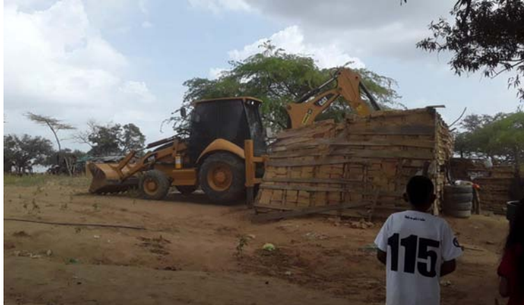
Mediante una orden judicial fueron desalojadas 60 familias wayuú de la comunidad indígena Jarrijnamana.