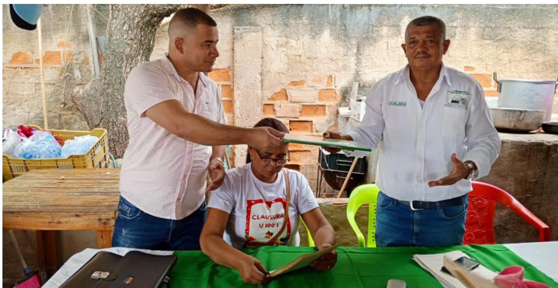
Se busca que los campesinos generen recursos que le sirvan para seguir trabajando la tierra.