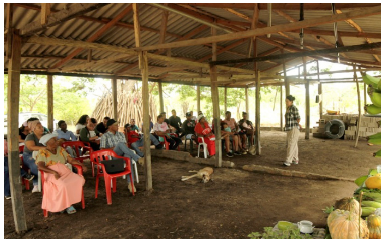
Se ordenaron medidas de protección individual y colectivas, medidas de protección territorial y asistencia humanitaria.

En su decisión favorable a las pretensiones de la Unidad, el despacho judicial expresó: "se ha demostrado plenamente la vulneración y amenaza al disfrute de los derechos territoriales étni-