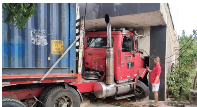
Las primeras hipótesis apuntan a que se trata de una falla mecánica, sin embargo, se adelantan las investigaciones.

Un tractocamión con su cargamento sufrió un accidente de tránsito, cuando al parecer el conductor perdió el control del vehículo y al tratar de equilibrarlo terminó estrellándose contra una vivienda causando solo daños materiales.