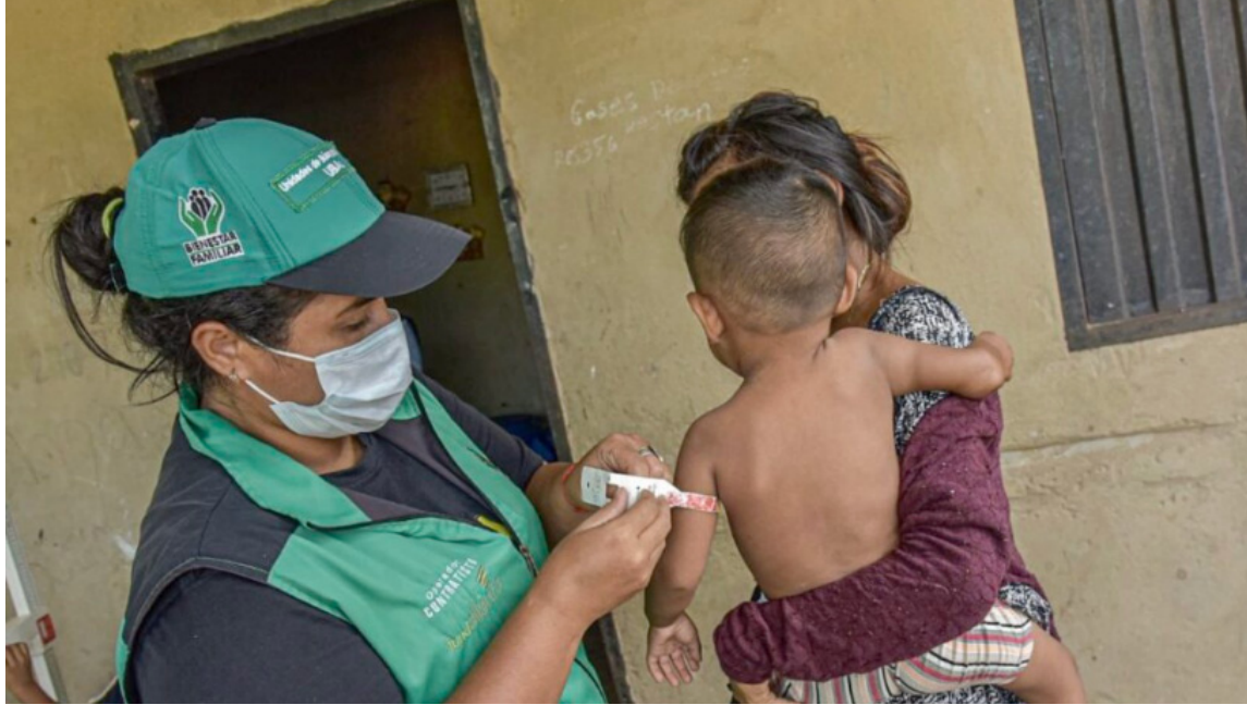
El modelo indígena se integra y valida costumbres y tradiciones de los pueblos originarios.

“Se garantizan los derechos fundamentales a la consulta y consentimiento libre, previo e informado de los pueblos indígenas a través de sus instituciones representativas, en lo que