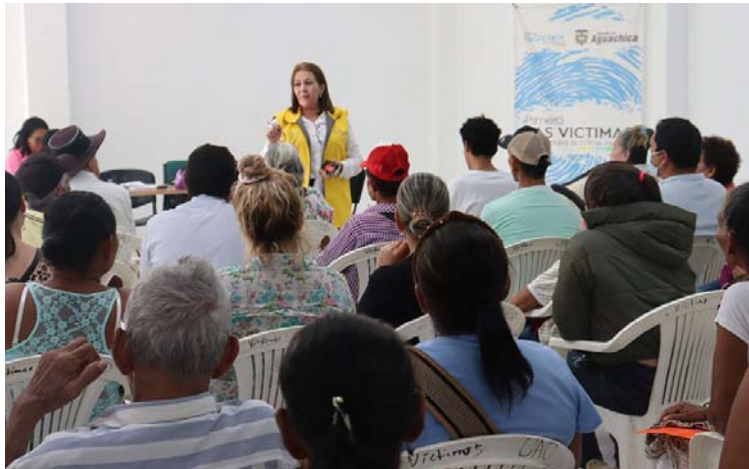
En la territorial existen 612.194 víctimas, de las cuales 444.332 son sujetos de atención por parte de la Unidad.

En la territorial Cesar – La Guajira existen 612.194 víctimas, de las cuales 444.332 son sujetos de atención por parte de la Unidad para las Víctimas. En 2023, por vía administrativa, en el Cesar se han indemnizado, a corte del mes de octubre, 2.264 víctimas por