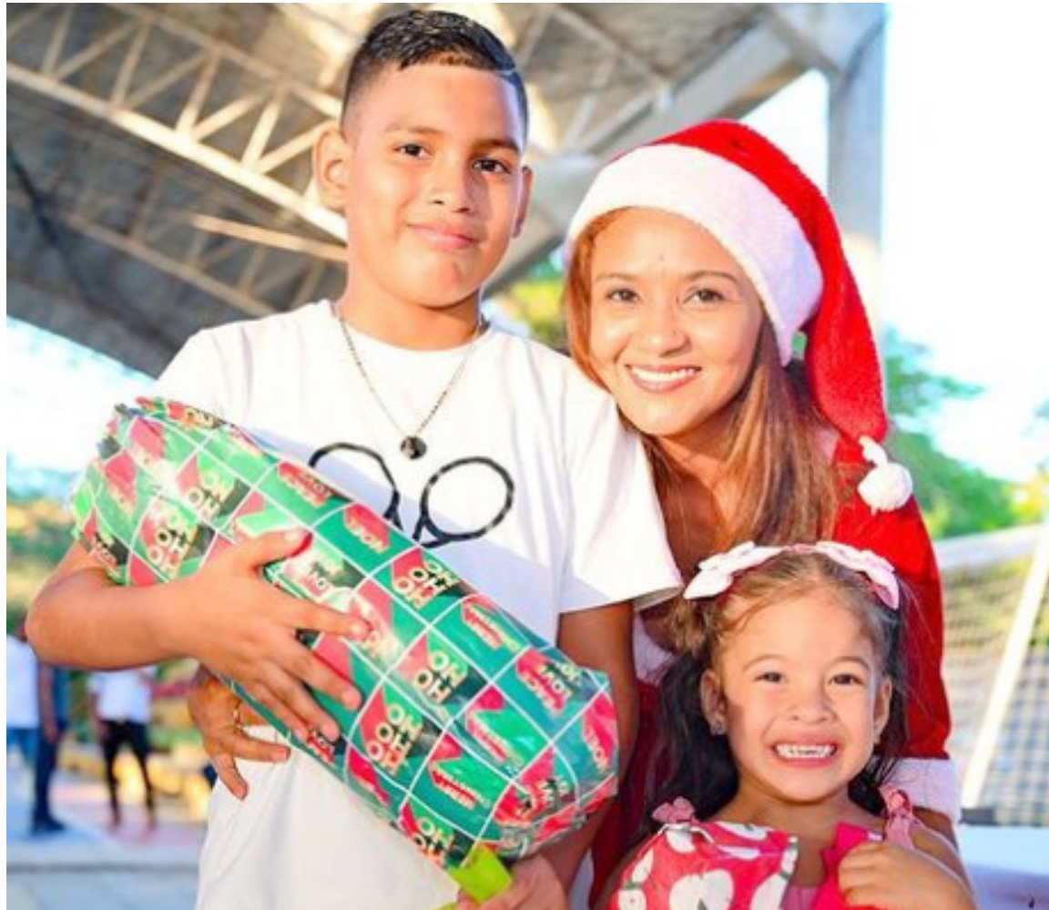
Nada produce mayor alegría que la felicidad de un niño disfrutando su regalo de Navidad.

Pasó otra Navidad. Afortunadamente se conservan las tradiciones del pesebre, el arbolito, la novena, los villancicos, la cena de nochebuena, los regalos. Para los de mi generación 60 los regalos los pedíamos al Niño Dios a través de una cartita que escribíamos y colocábamos en el arbolito de Navidad. Santa Claus ni Papa Noel existieron en nuestra cultura navideña, y los regalos que pedíamos eran sencillos como una pelota de fútbol, un carrito, una pistola de agua, o una bicicleta como mucho; las niñas soñaban que el niño Dios les trajera muñecas y ‘chocoritos’ para cocinar y jugar a ser mamá. Los niños de hoy en cambio piden a ‘Santa’ o a ‘Papa Noel’ lo