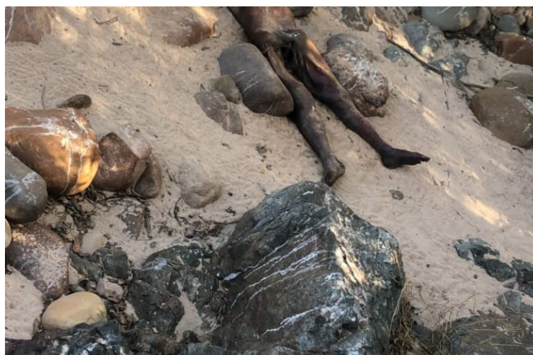
El macabro hallazgo se registró la tarde del lunes cerca del puente en el corregimiento de Corral de Piedra.

Se espera que por medio de pruebas rigurosas por parte de Medicina Legal se logre dar con el nombre de esta persona. Hay gran expectativa por la posibilidad de que se trate del joven que lleva más de 20 días desaparecido en el corregimiento de Guayacanal en San Juan del Cesar.