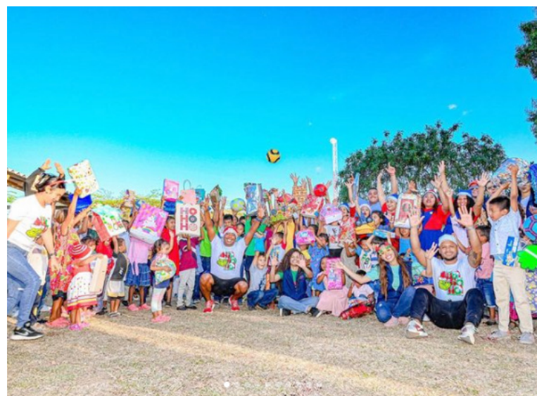
Con donaciones hacen posible la oportunidad de brindar una Navidad inolvidable para los menores.

En la Unidad para las Víctimas ‘Cambiamos para servir’ con el objetivo de seguir trabajando en acciones de cara a la implementación de una política que contribuya a la superación de los rezagos, brinde una reparación transformadora y le permita a quienes han padecido el conflicto armado acceder efectivamente a sus derechos.