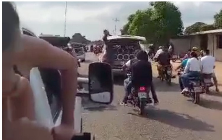
Familiares y amigos de ‘Tere’ exigen que las autoridades competentes den con los responsables de este crimen.

nes en el municipio fronterizo de Maicao, y quién era miembro de la comunidad Lgbtiq+ en esta localidad de La Guajira. Se pudo conocer que al