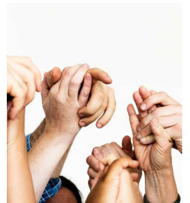
Se registra un alto riesgo para el ejercicio de los liderazgos.

También hizo un llamado de atención a los alcaldes salientes de los municipios incluidos en el Programa de Desarrollo con Enfoque Terri-