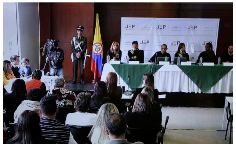
El régimen de condicionalidad es un requisito con el que deben cumplir todos los comparecientes.

El régimen de condicionalidad es un requisito con el que deben cumplir todos los comparecientes ante la JEP y el Sistema Integral para la Paz. El incumplimiento de ese régimen puede acarrear la pérdida de tales beneficios e incluso suponer la expulsión de la Jurisdicción.