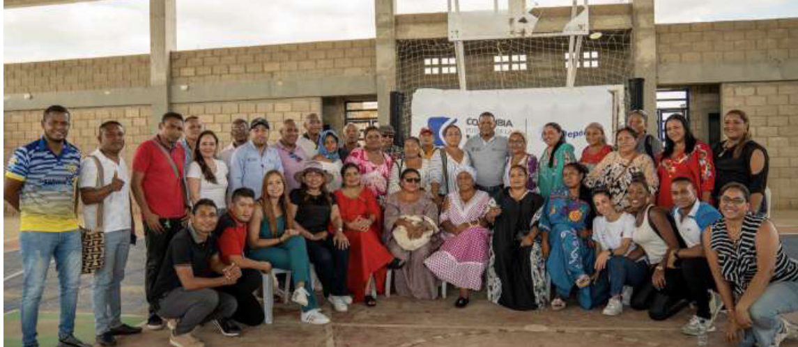
El encuentro incluyó competencias deportivas, charlas y actividades recreativas y culturales.

El viceministro del Deporte, Camilo Iguarán Cam-