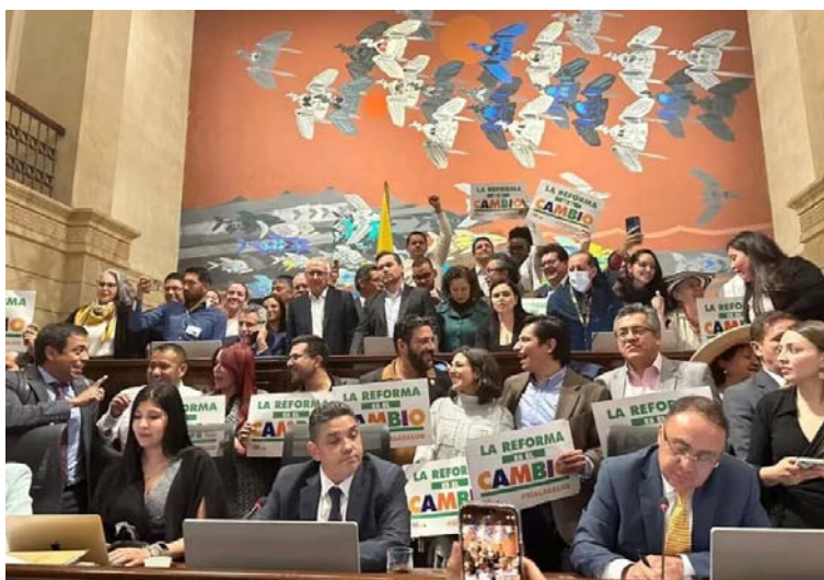
La nueva reforma a la salud promete grandes cambios y mejorar la atención en salud de todos los colombianos.

Por Veeduría Ciudadana a la Implementación de la Sentencia T 302 de 2017.