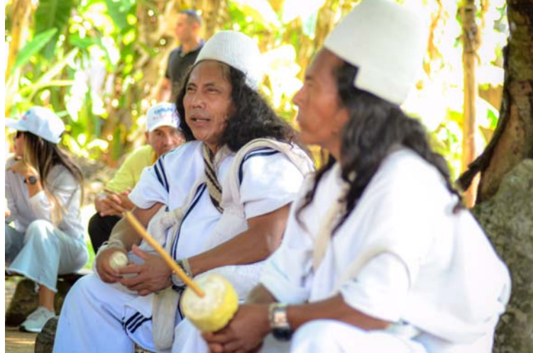
Los mamos también están dedicados a determinar quién ocupará el cargo de gobernador en reemplazo de Villafañe.

Los mamos también están dedicados a determinar quién ocupará y cómo ocupará el cargo de gobernador en reemplazo del líder fallecido, mientras avanzan los rituales fúnebres para des-