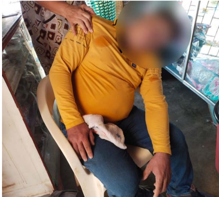
Según algunos testigos, la víctima llega a una tienda, se sienta y pide una gaseosa, y a los pocos minutos fallece.

Al parecer vivía en el barrio La Provincia de la ciudad de Riohacha. El cuerpo en horas de la tarde de ayer jueves fue trasladado de la zona rural a la urbana.