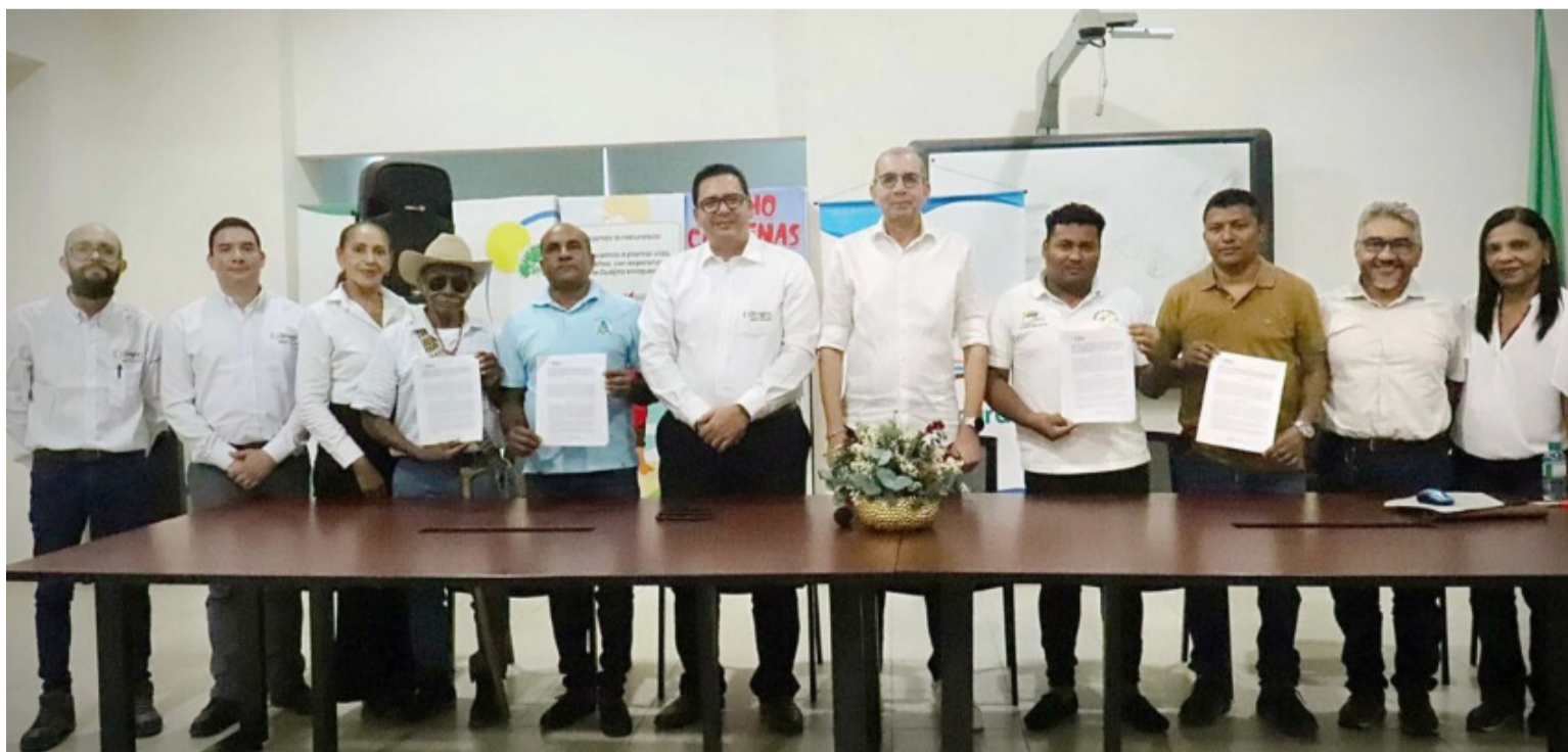
Estas acciones de conservación, fueron impuestas por Corpogujaira como una medida de compensación ambiental.

"Nuestra función será sensibilizar a la comunidad para que no se siga talando, que no se continúe con la caza de animales y que sigamos protegiendo nuestro medio ambiente. La comunidad está bastante comprometida con este propósito", señaló. Dentro de estos acuerdos, los cuales contarán con la supervisión de Corpogujaira, se realizarán talleres de educación ambiental, inducción a la normativa de áreas protegidas, control y monitoreo, conservación y manejo de especies nativas, manejo de protección de fauna, prevención de incendios forestales y formulación de proyectos.