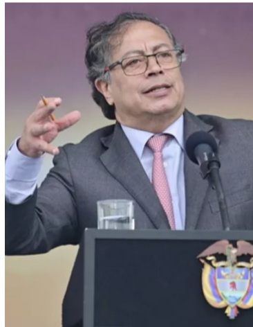
Gustavo Petro, presidente de la República.

Esto dijo al respecto: “Ya andan soñando por ahí algunos que no que se le pasa la moda a la gente y que ya no quieren el cambio y quieren el pasado; que les gusta al pueblo colombiano que