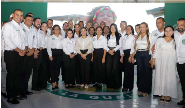
Con su equipo de Gobierno la gobernadora presentó de manera clara y objetiva, los logros más representativos del Gobierno "Unidos por el cambio".

Bajo el liderazgo de Diala Wilches, esa noche se convirtió en una exitosa jornada, donde la administración departamental, con todo su equipo de Gobierno, presentó de manera clara y objetiva, los logros más representativos del Gobierno 'Unidos por el cambio', Gobierno del cambio que inició el exgobernador Nemesio Roys Garzón, presente en esta Rendición de Cuentas y que termina felizmente, Diala Wilches Cortina, como gobernadora designada; podemos afirmar, sin equivocaciones, que el Gobierno nacional,