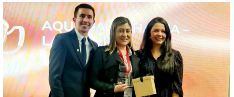
Aqualia fue reconocida por abrir oportunidades para personas de difícil colocación en La Guajira.