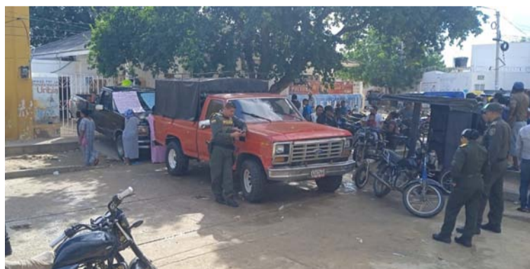
Los manifestantes volvieron a prohibir el ingreso de los trabajadores y dicen estar cansados por atrasos de los pagos.

Por último, explicaron que no piensan quitarse de la entrada ya que están cansados de tantos atrasos para los pagos, hasta que no haya una respuesta favorable permanecerán protestando. Piden que el Gobierno nacional o Ministerio del Interior se pronuncie al respecto.