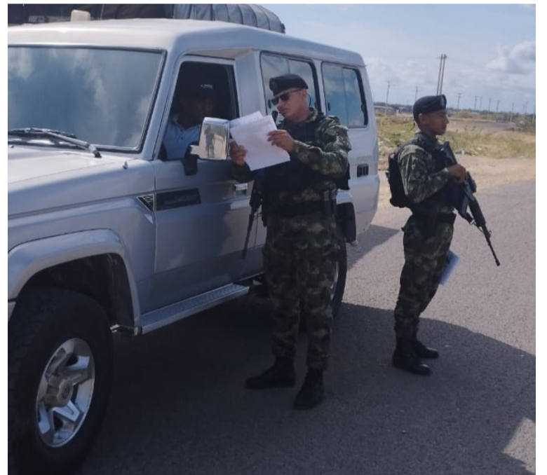
Los operativos se están ejecutando en cada una de las vías que conectan a la capital indígena de Colombia.