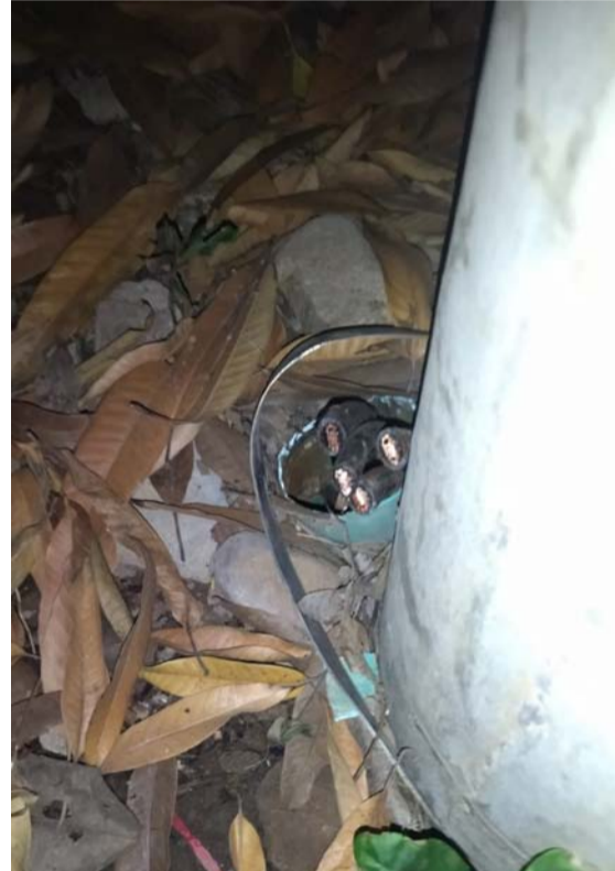
La madrugada, el día y la noche de ayer quedó sin luz el hospital por robo de cables.