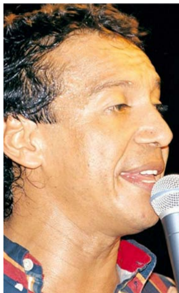
Diomedes Díaz interpretaba con 'Guille' Morales las canciones 'La negra' y 'Morenita' que son de su autoría.

Tocado por la nostalgia, añadió: "Claro, nunca olvido las distintas presentaciones en los pueblos, donde era bien recibido, aunque el pago era poco. Eran otros tiempos en el cual primaban más los aplausos y el ron, ese que nunca faltaba. Ahora, los músicos tienen diversas oportunidades y