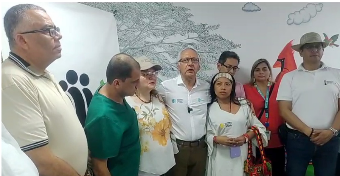
Minsalud y directora del Icbf hicieron una visita al Centro Nutricional de Maicao.

las zonas rurales y dispersas, de manera oportuna y pertinente.