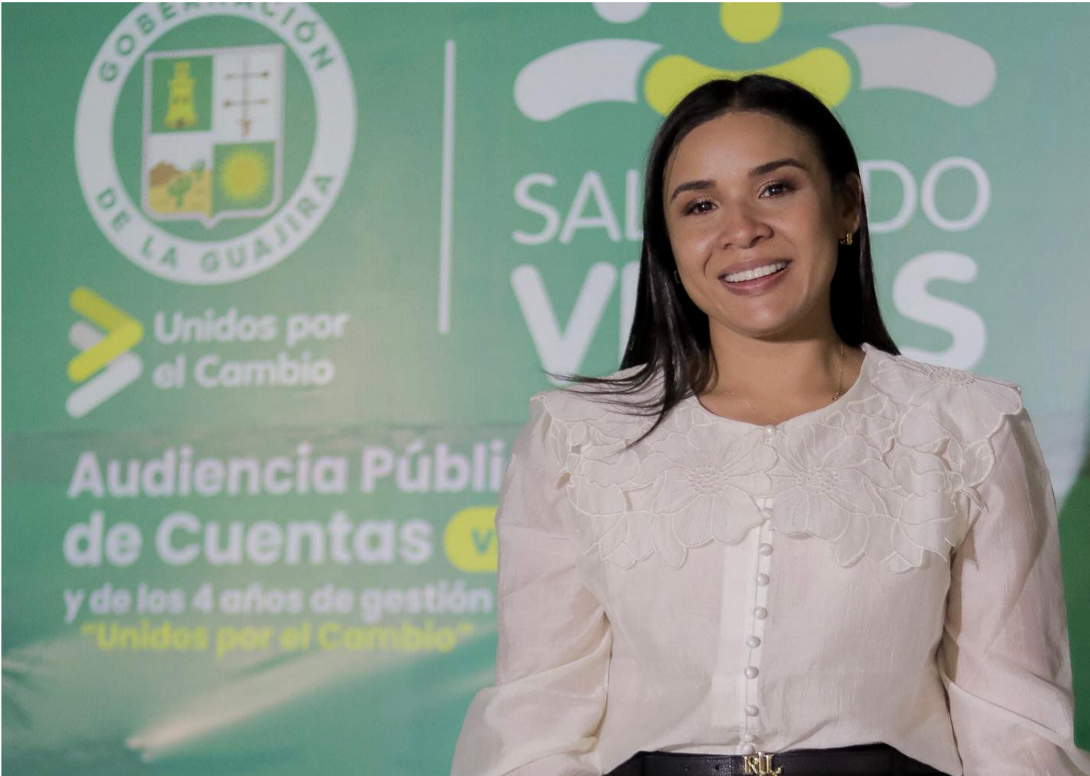
La gobernadora de La Guajira Diala Wilches presentó la rendición de cuentas de la vigencia 2022 – 2023 en la que se conocieron los logros y dificultades de la administración.