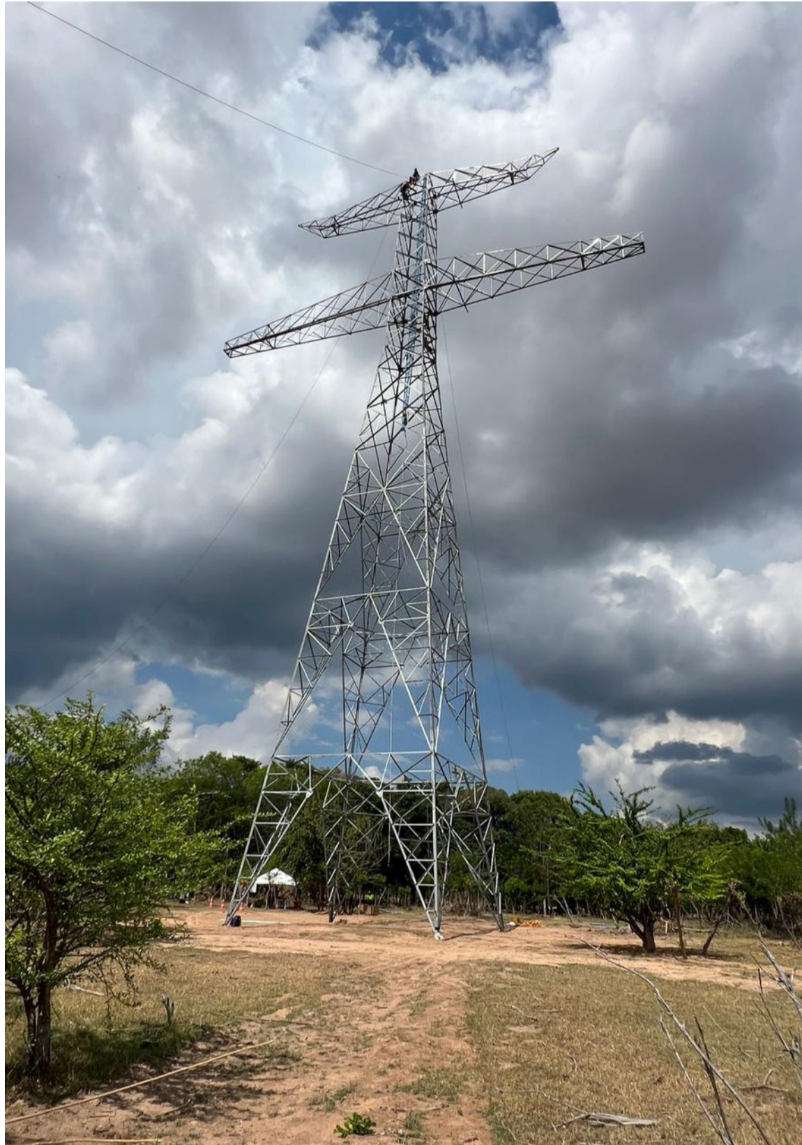
Para el montaje de una torre es necesario el uso de una pluma -o grúa- de 24 a 36 metros.

El tramo de línea, de 247 kilómetros (km.), tendrá en total 513 torres, cuya construcción involucra el montaje de más de 13.000 toneladas de estructura metálica, que se conectarán a través de un tendido de 6.000 km. de cable, entre