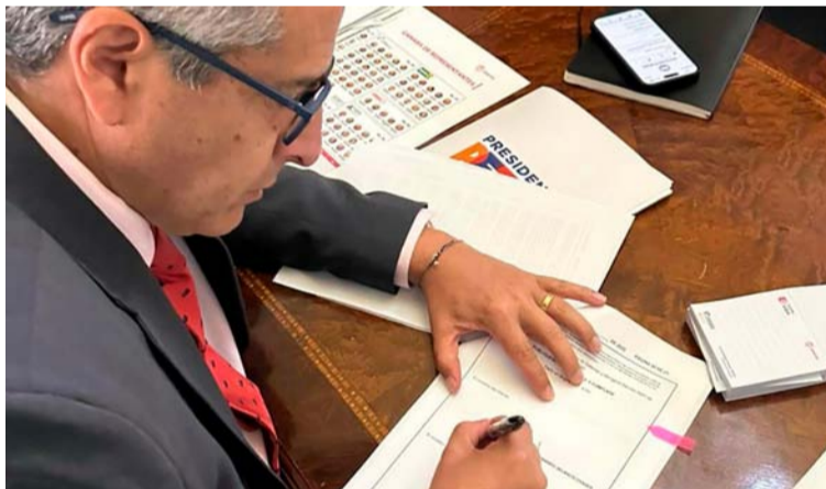
Mininterior está liderando la campaña 'La vida brilla sin pólvora' para concientizar sobre el uso inapropiado de la pólvora.

El decreto, firmado por el ministro del Interior, Luis Fernando Velasco, prohíbe totalmente la producción o fabricación, la manipulación o uso y la comercialización de artículos pirotécnicos o fuegos artificiales que contengan fósforo blanco, y