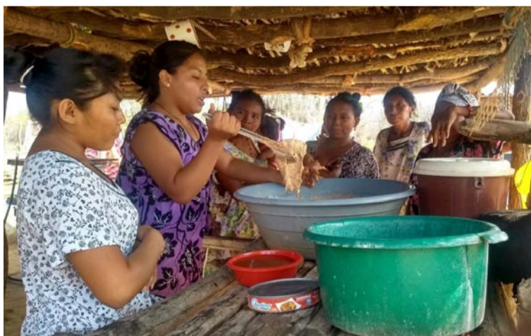
Las dos regiones del país en condición de inseguridad alimentaria son el Caribe y el Pacífico con el 40% en promedio.

con que los departamentos de Córdoba (70%), Sucre (63%), Cesar (55%), Bolívar (51%) y La Guajira (50%), superan ampliamente el promedio regional del 40%. A excepción del archipiélago de San Andrés, Providencia y Santa Catalina, que con el 17.2% de sus hogares en condición de inseguridad moderada o grave, sólo es coltado por el departamento de Caldas con el 14.6%, el resto de los departamentos de la región Caribe supera