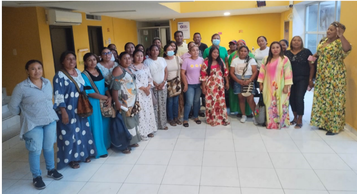
En lo que va del año, los empleados de la educación no han recibido ni una sola dotación.

En lo que va corrido del 2023, los empleados del sector educativo no han recibido ni una sola dotación de las tres que les corresponde de acuerdo a lo estipulado por el artículo