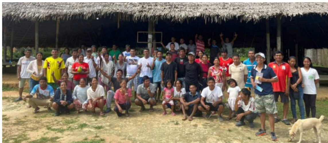
En este gobierno se han formalizado 1.650.000 hectáreas a comunidades étnicas y campesinas.