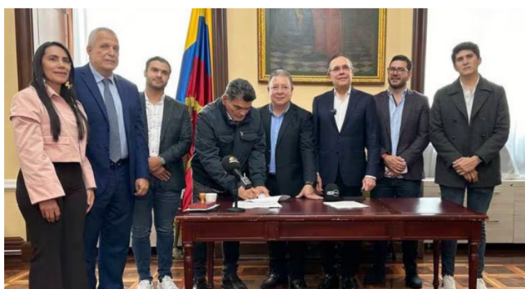
El proyecto iniciará su trámite en febrero de 2024, en la Comisión Primera del Senado, presidida por Germán Blanco.

El Partido Conservador radicó el proyecto de ley con el que busca restablecer las multas al porte de la dosis mínima en espacio público, luego de que el presidente Gustavo Petro decidiera tumbiar la medida.