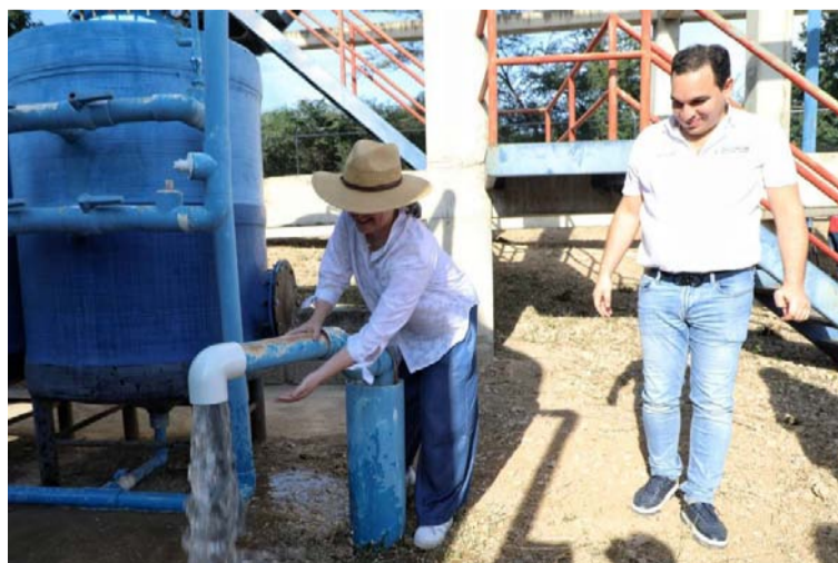
El primer punto de producción de agua garantizará el suministro del recurso a 4.367 familias de 172 comunidades.

Con la puesta en marcha de la planta de agua potable bajo la dirección y supervisión de Esepgua, que se extrae de un pozo de 100 metros de profundidad. Este proyecto consta de una planta de tratamiento en el cual se trata mediante un proceso de ósmosis inversa. Esta planta tiene una capacidad de producción de agua tratada de hasta 10 litros por segundo, lo que origina una producción de