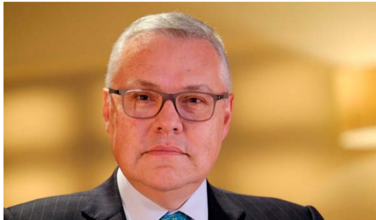
El ministro de Justicia, Néstor Osuna, aseguró que la iniciativa se planteará en la reforma a la justicia.

La polémica entre el Gobierno Petro y la Procuraduría no para. Tras las pretensiones que ha tenido el presidente de cambiar las funciones del ente de control, ahora el ministro de Justicia Néstor Osuna, confirmó que esas modificaciones se van a presentar en la nueva reforma a la justicia.