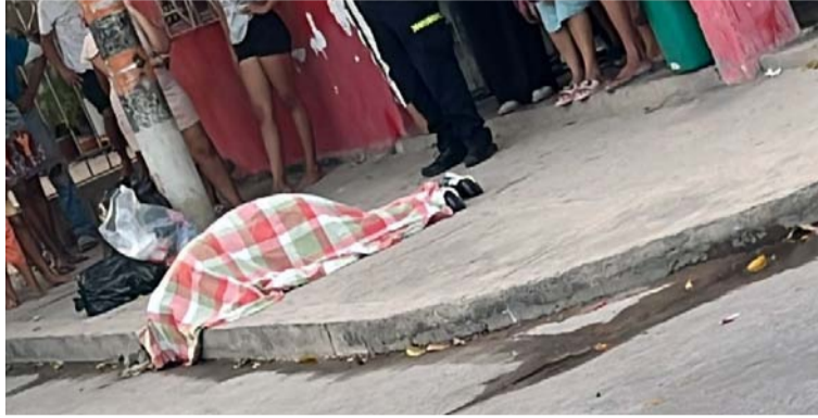
El asesino abordó su víctima en una esquina y le disparó.

El suceso se registró la tarde de ayer miércoles en la calle 23 con carrera 14 del barrio Los Remedios de la ciudad de Riohacha, frente a una tienda donde quedó el cuerpo de Barro Fince.