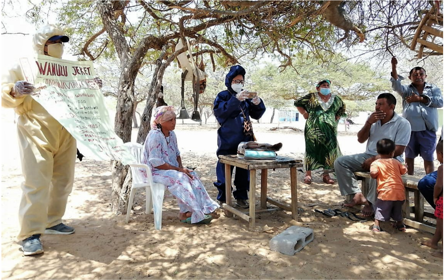
Llegó la hora de revivir el programa ‘El Caribe sin hambre’ que se formuló y estructuró en 2011 con el apoyo del BID.

Y si desagregamos la cifra que corresponde a la región Caribe, nos topamos