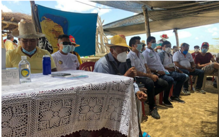
Programas como Ingreso Solidario y Renta Ciudadana, son paliativos que no van a la raíz de esta problemática.