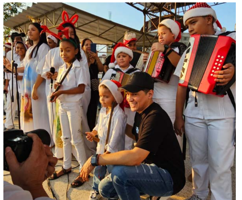
El artista se dejó contagiar de la alegría de los niños quienes acompañados de sus padres se tomaron la plaza principal.