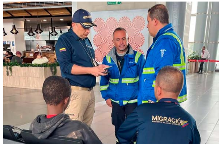
El Ministerio de Relaciones Exteriores informó que se adelantan medidas para detectar, atender y proteger a los menores.

En los últimos días, agentes de Migración Colombia encontraron en el Aeropuerto El Dorado a un adolescente de 13 años de edad no acompañado, procedente