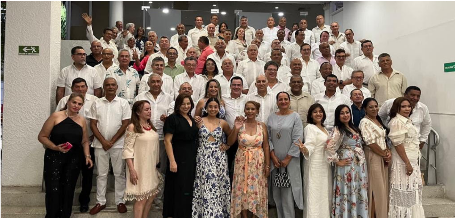
Reencontrarse con amigos y compadres a los que tienes tanto tiempo de no ver, sin duda, rejuvenece el alma.

La llegada al Club fue expectante y colmada de ansiedad