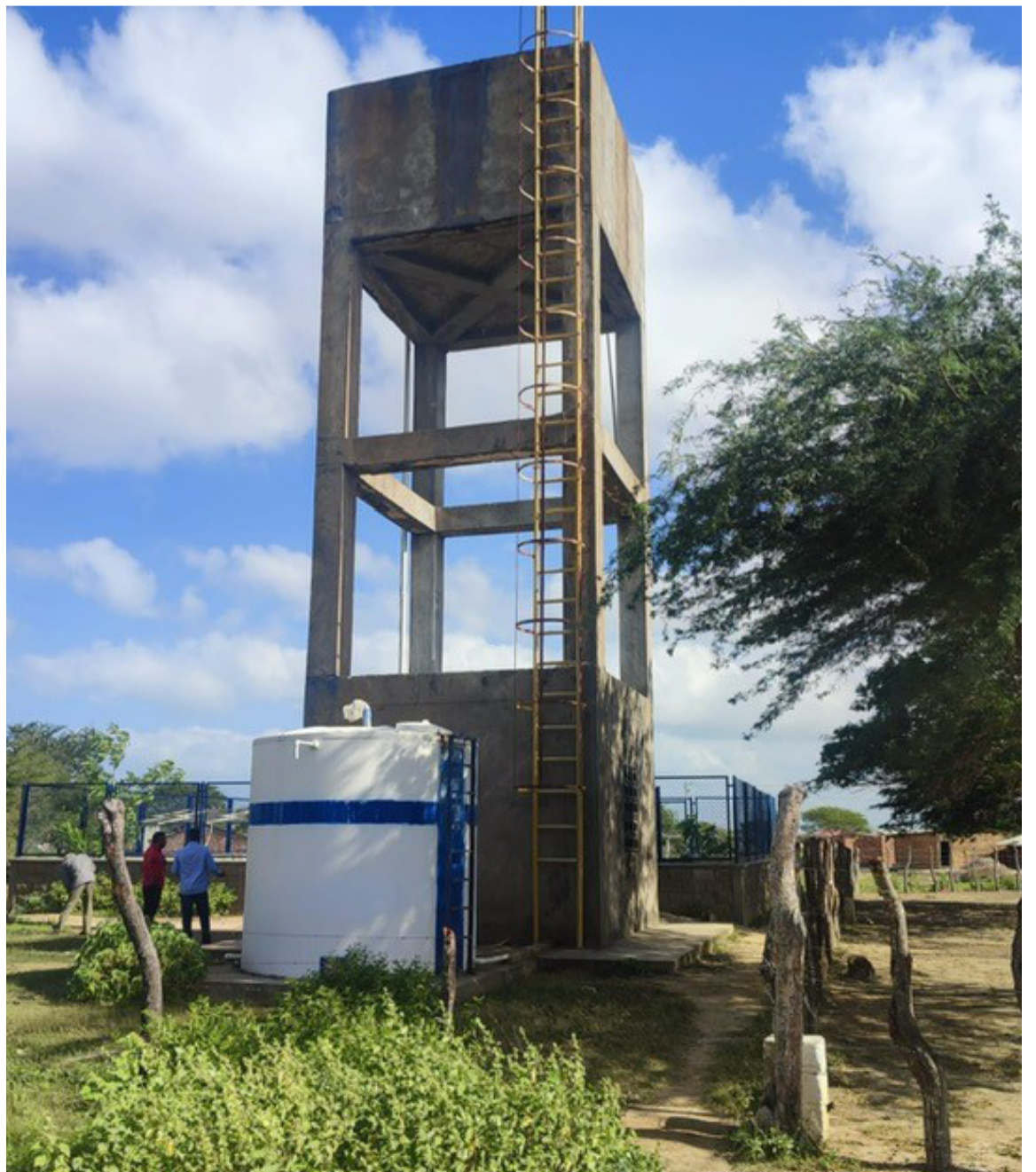
Para el año 2021, La Guajira tuvo un índice de 50,2% sin acceso a fuentes de agua mejorada.

En conclusión, podríamos abordar dos aspectos principales. Primero, si bien en La Guajira persisten las desigualdades en el acceso al agua potable respecto a los municipios, corregimientos, zonas rurales y urbanas. Se ha venido mitigando tal problema por medio de proyectos del Estado y del sector privado. Segundo, el cuidado y uso del agua potable es responsabilidad de todos, así como la sostenibilidad y cuidado de las construcciones y plantas de agua que son entregadas a las comunidades. Y si bien, tales plantas y construcciones prometen una solución duradera, no queda demás resaltar que el mantenimiento de cada una de ellas requiere de un desgaste que podría ser eliminado si se piensa en una planta que suministre agua potable a todo el Departamento.