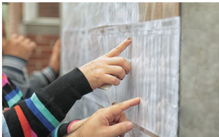
La Registraduría Nacional instalará 12 puestos de votación, que estarán conformados por 71 mesas.

bien la Registraduría Nacional es la entidad que lleva a cabo el proceso de inscripción de ciudadanos para votar, es el Consejo Nacional Electoral la corporación competente para investigar los hechos que puedan constituir una inscripción irregular de cédulas.