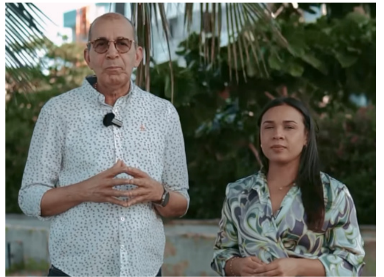
El objetivo es fortalecer la educación ambiental en las instituciones del Departamento de La Guajira.