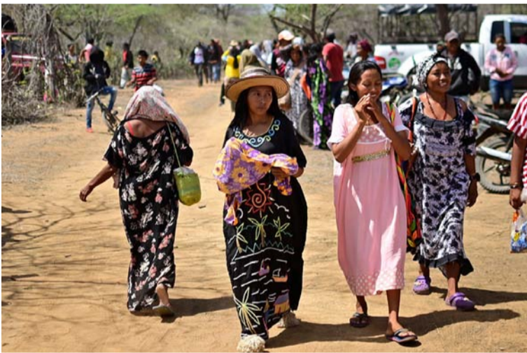
El Gobierno ratifica su compromiso con la comunidad indígena wayuú, luego que la Corte tumbara el decreto 1272.

El Gobierno del Cambio reafirma así su compromiso con la superación de la pobreza extrema en La Guajira y la inclusión del pueblo wayuú en las políticas públicas, de acuerdo con los objetivos del Plan Nacional de Desarrollo 2022-2026 – Colombia Potencia Mundial de la Vida.