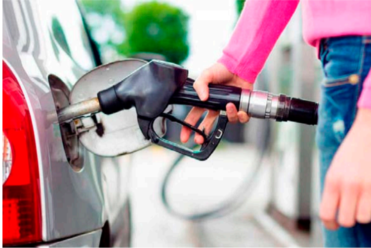
Continúan las mesas de diálogo con el gremio transportador de carga para evaluar el incremento en el diésel.

«Nosotros estamos todavía evaluando qué tanto realmente falta para cerrar la brecha. Ya falta poco. Creo que nosotros habíamos dicho que faltaban tres, ya se hizo uno. Faltarían dos. Creo que solamente vamos a necesitar otro solo en ene-