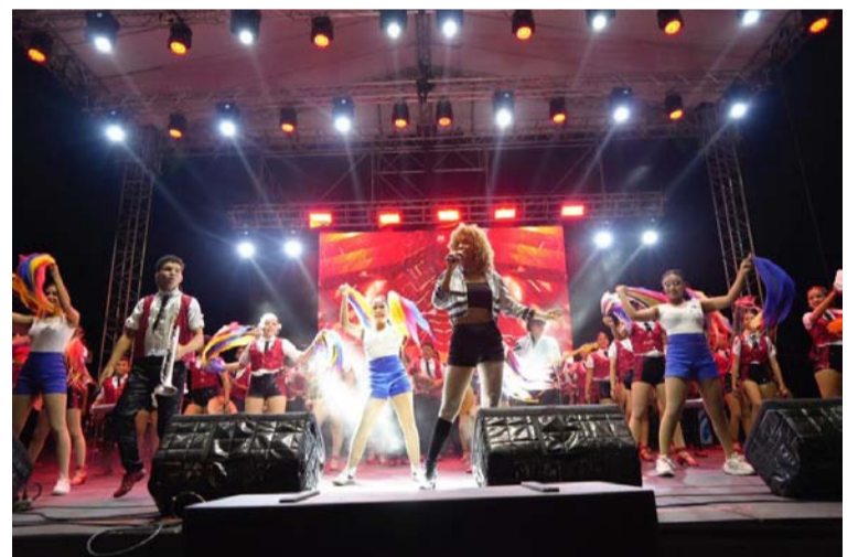
El jurado calificador, con gran juicio y lealtad a la tradición vallenata, desempeñó un papel fundamental en el evento.