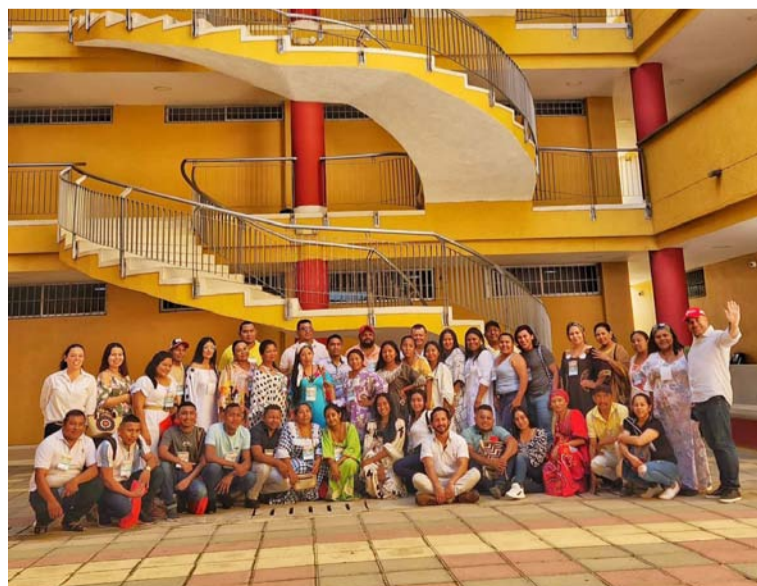
Este grupo desempeñará un rol importante en el diálogo concertado de proyectos de consulta previa en la región.

esencial para la toma de decisiones participativas y de respeto por los derechos de las comunidades indígenas que merecen un futuro más justo y equitativo.