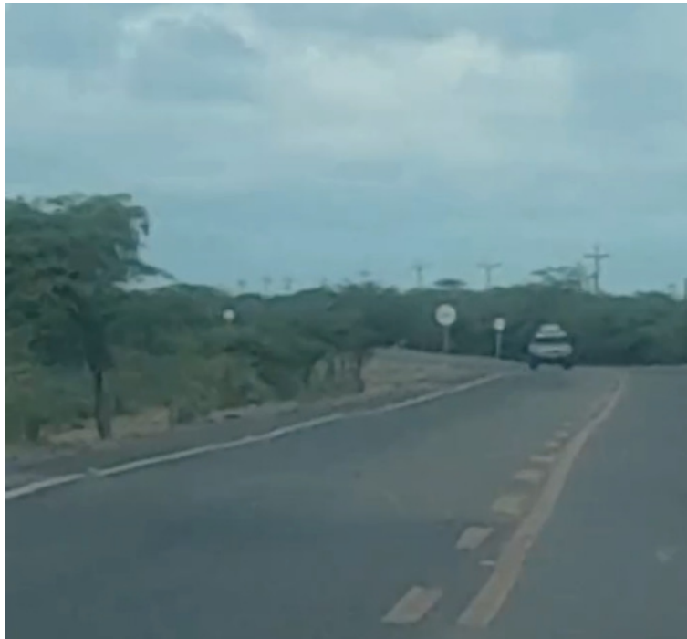
El fin de semana hombres armados fueron grabados por un conductor cuando salían a la vía para cometer los asaltos.