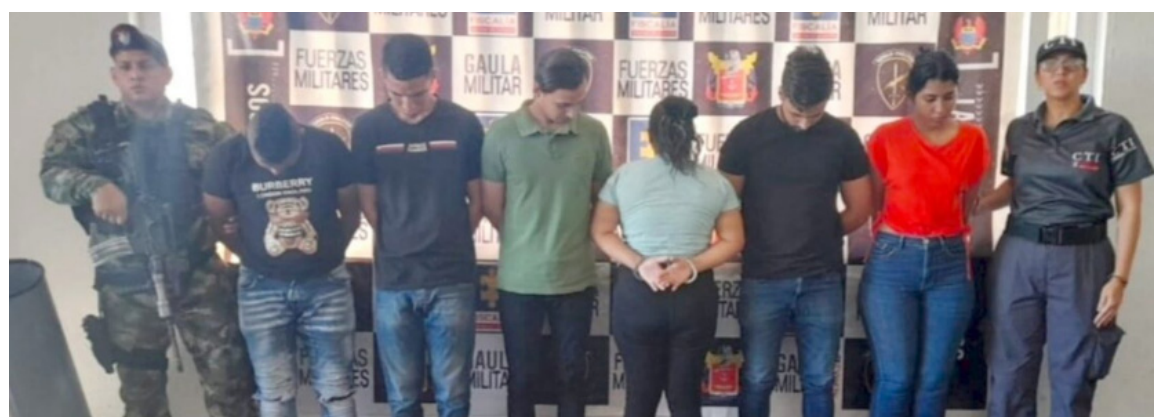
Los 6 personas fueron judicializadas por el delito de transferencia no consentida de activos.

como presuntos responsables del delito de transferencia no consentida de activos con circunstancias de agravación, el cual no aceptaron.