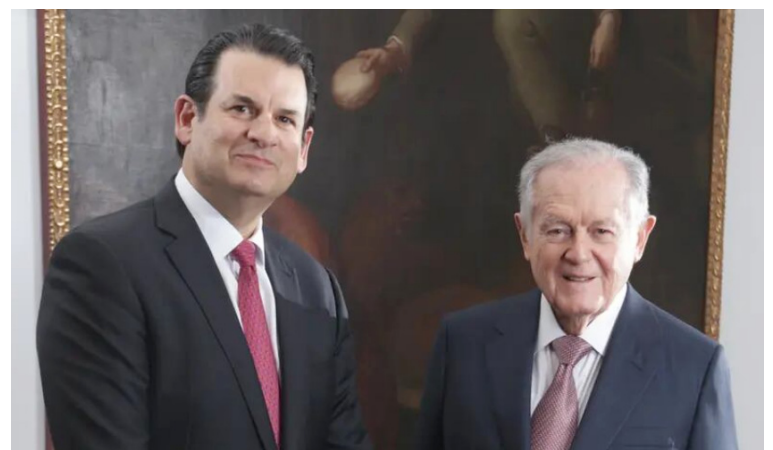
El Grupo Aval en cabeza de Luis Carlos Sarmiento Angulo se encargará de devolver el agua a La Guajira.