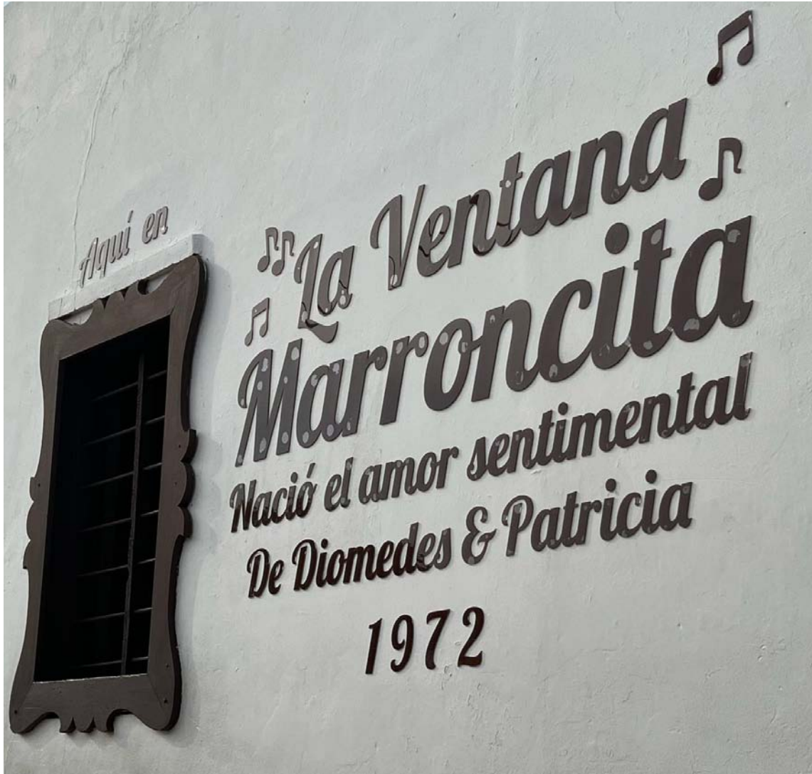
'La ventana marroncita' sitio de La Junta en donde nació el romance que dio origen a la canción 'Tres canciones' grabada en 1977 por Diomedes Díaz.