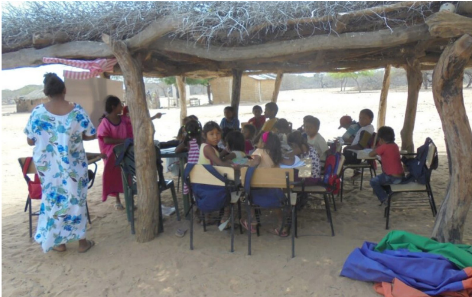
La Guajira es un Departamento que sigue en mora de cumplimiento de la Sentencia T302 de 2017 de la Corte.

Para comenzar, en este momento el Gobierno movido por el incidente de desacato a sus principales funcionarios como: la directora de Prosperidad Social, Laura Sarabia; la ministra de Ambiente, Susana Muhamad; el ministro de Salud, Guillermo Alfonso Jaramillo; la ministra de vivienda,