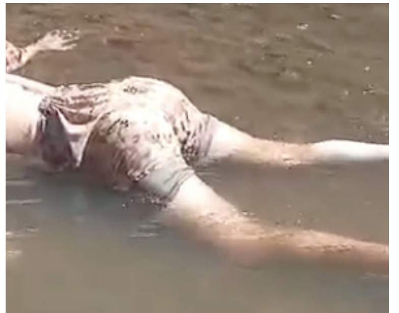
Las autoridades llegaron hasta el lugar y procedieron al levantamiento del cuerpo y trasladado a Maicao.

se ha presentado en la zona rural del Distrito de Riohacha, el secretario de Gobierno convocó para hoy martes un consejo extraordinario de seguridad para que las autoridades competentes puedan buscar acciones que brinden tranquilidad a los moradores de la zona.