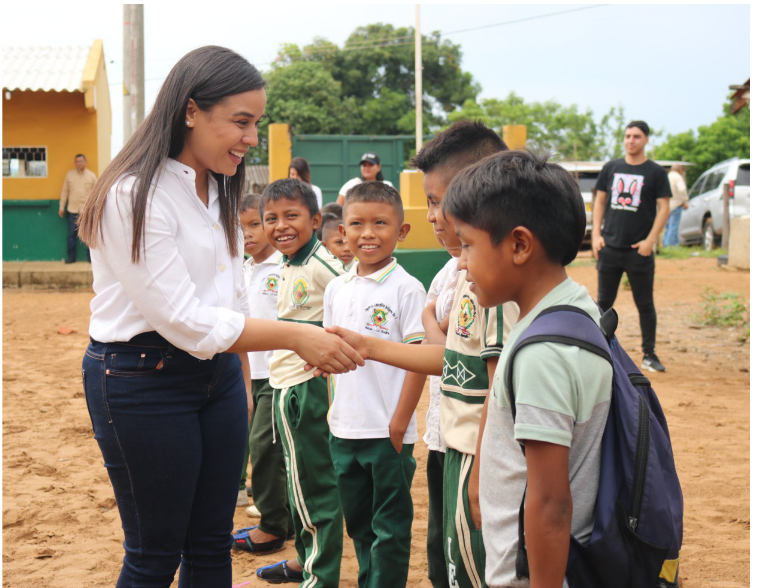
La Gobernadora presentará los resultados que han impulsado el progreso y han mejorado la calidad de vida de los guajiros.

La Gobernación extiende una invitación a todos los medios de comunicación, entidades, y comunidad en general, para que se sumen y sean testigos de las "Acciones que Salvan Vidas".