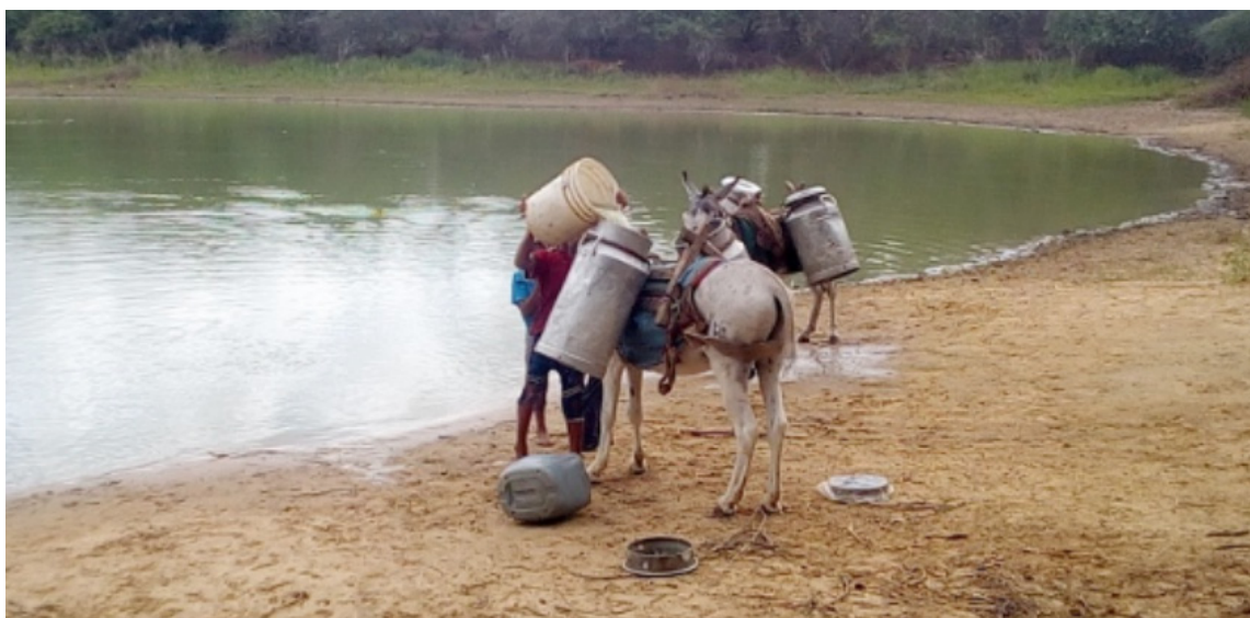
Obras se deben ejecutar con celeridad para tratar de contrarrestar la escasez de agua en 2024.

Por La Veeduría Ciudadana para la Implementación de la Sentencia T302 de 2017.