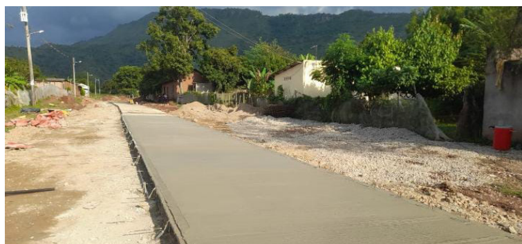
Pavimentación de la Avenida Matildelina corregimiento El Plan, La Jagua del Pilar.