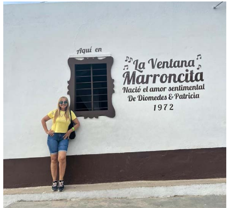
'La ventana marroncita' es uno de los sitios más visitados por el turismo que genera este sitio de romance.