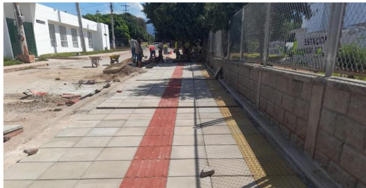
Adecuación del área pública, obra por valor de 2.500 millones de pesos.

Se conoció que en el corregimiento El Plan se adelanta la pavimentación de la Avenida Matildelina en su totalidad, y se está arreglando la malla vial casi en un 80% incluyendo el área de circulación o andenes, obras por valor de 2.500 millones de pesos.