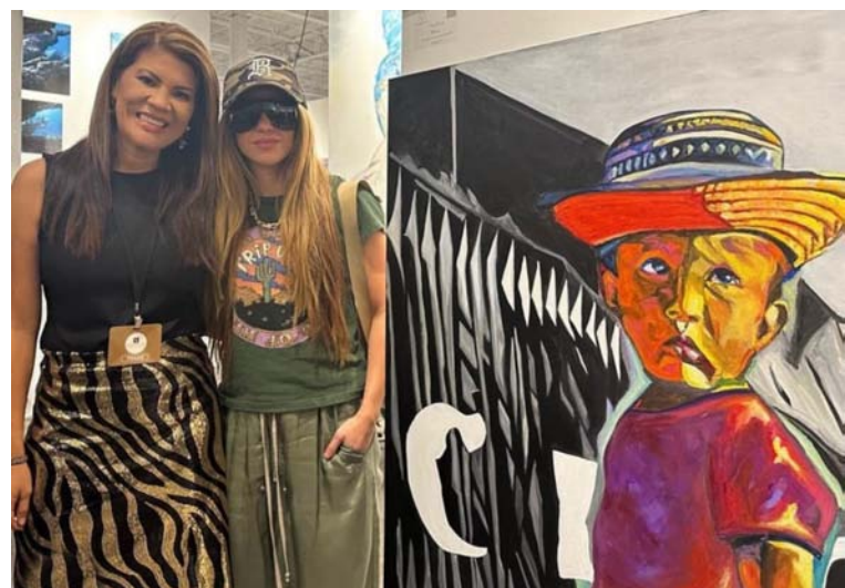
Shakira es una de sus fuentes de inspiración; las une una amistad que surgió en la infancia.