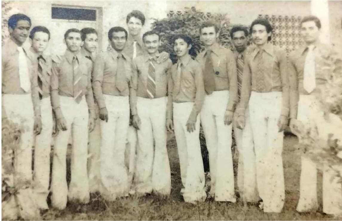
Los Estudiantes Promoción 1977 de la Institución Educativa El Carmelo.