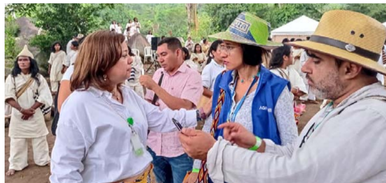
La URT en Cesar y La Guajira cierra con un 75% de decisiones de fondo favorables a los intereses de las víctimas.

de Santa Marta (jurisdicción rural de Dibulla). Esta cifra contrasta con la de 2022, año en el que se profirieron dos sentencias favorables a las víctimas, cifra que incluso se mantuvo por más de una dé-