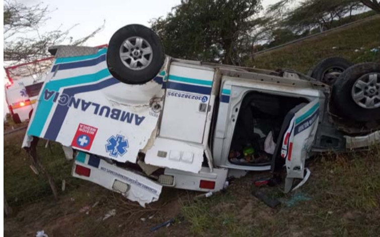
Las autoridades reportaron que la ambulancia se salió de la vía quedando a un costado luego de varias vueltas.

Este suceso se registró la mañana del martes 5 de diciembre, en esta importante vía de la Troncal del Caribe, cuando al parecer la ambulancia se salió de la vía quedando a un costado luego de varias vueltas.