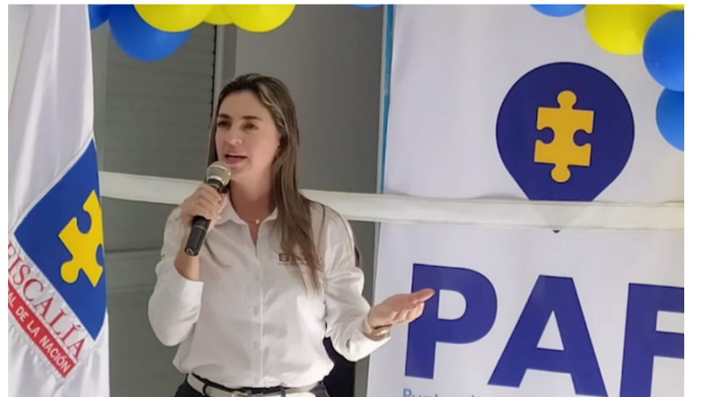
Se informó que este nuevo punto de la Fiscalía es el quinto habilitado en el Departamento de La Guajira.

Esta implementación se llevó a cabo de acuerdo al direccionamiento estratégico 2022 – 2024 dispuesto