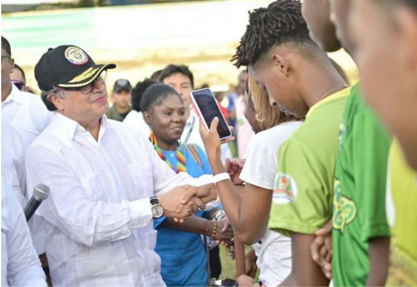
Estamos diciendo que es más valioso no cometer delitos que trabajar con esfuerzo y construir una vida honesta.