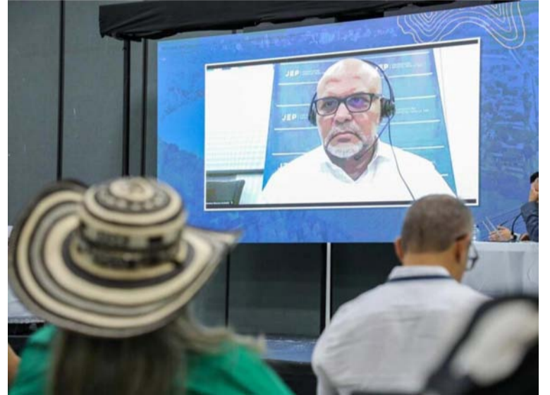
El presidente de la JEP Roberto Vidal, señaló que la idea es investigar los nexos entre paramilitares y la fuerza pública.

Entre tanto el senador Alexander López Maya se refirió al polémico tema y precisó en su cuenta de X: "Salvatore Mancuso usó helicópteros de la fuerza pública, entraba a las estaciones de la fuerza pública, armó masacres en compañía de la fuerza pública, se reunió con presidentes en su época delictiva, dirigió operaciones militares de la fuerza pública y usó armas privadas de la fuerza pública. A pesar de todo esto hay quie-