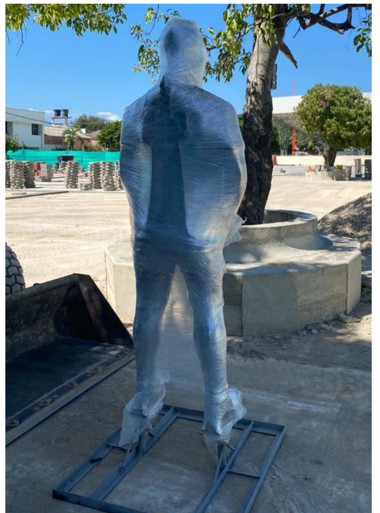
La estatua de Nelson Velásquez será develada en el marco de la 47 versión del Festival Nacional de Compositores.