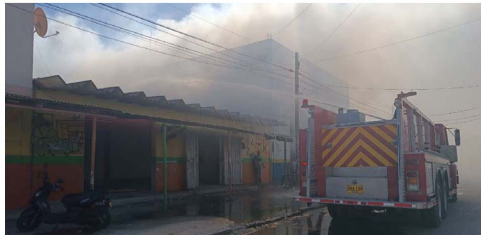
En una bodega de licores tuvo inicio el incendio, producto de un corto circuito que se habría originado en un poste y que amenazaba extenderse.