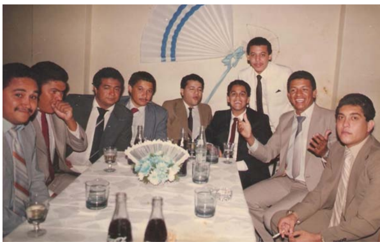
El desaparecido acordeonero Juancho Rois al lado de sus amigos del Club de la Flotica Sanjuanera.