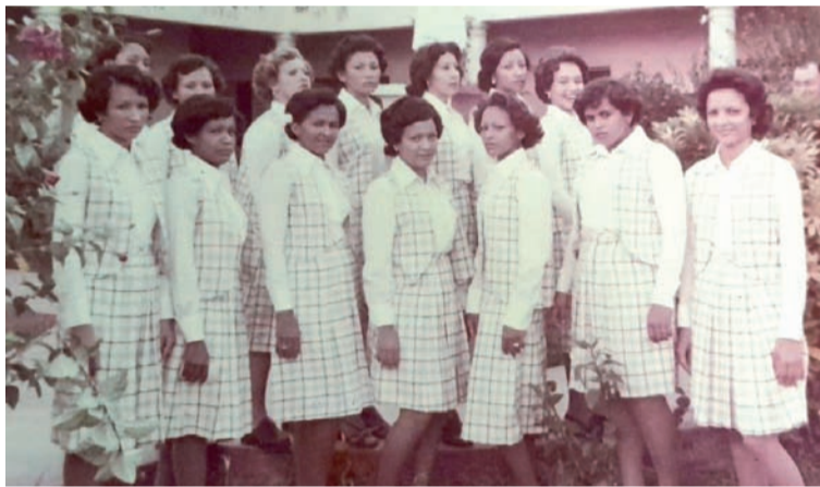
Las Estudiantes Promoción 1977 de la Institución Educativa El Carmelo.