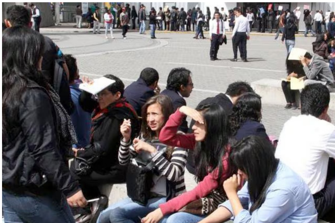
No me malinterpreten, entiendo que el programa busca la prevención de la violencia.