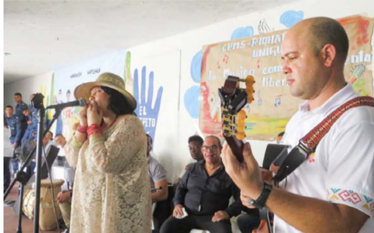
Este espacio ofreció a las personas privadas de la libertad, capacitación músico académica para una reinserción social.

En la capacitación participaron más de 50 reclusos de los patios 1 y 2 del Centro Penitenciario de Mediana Seguridad de Riohacha, quienes recibieron clases de lectura y escritura musical, talleres de guitarra y piano funcional, ensambles y performances musicales, orien-