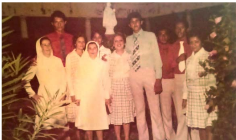
Docentes y Estudiantes Promoción 1977 de la Institución Educativa El Carmelo.