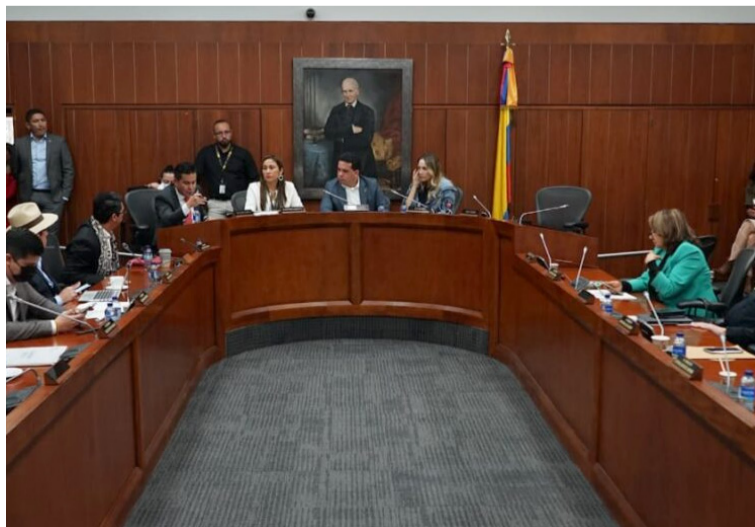
El mínimo vital deberá estar dentro del rango de 1,5 a 2,5 metros cúbicos por persona al mes.

La plenaria del Senado de la República aprobó en las últimas horas una iniciativa que tiene que ver con la implementación del mínimo vital de agua para la población más vulnerable del país.