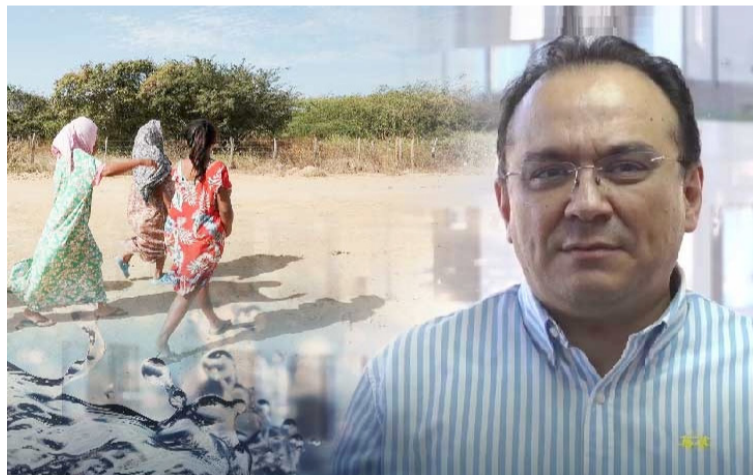
Las consideraciones del proyecto están fundamentadas en un decreto que fue declarado inexecutable por la Corte.

Las consideraciones del proyecto están fundamentadas en un decreto que fue declarado inexecutable por la Corte Constitucional, refiriéndose al decreto No. 1085