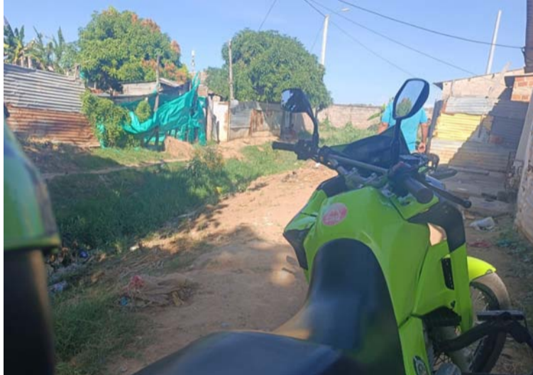
Desde el Departamento de Policía Guajira, dijeron que sobre el tema no manejan ningún tipo de reporte.

Al consultar de este supuesto atentado a bala, en el Departamento de Policía Guajira, manifestaron que