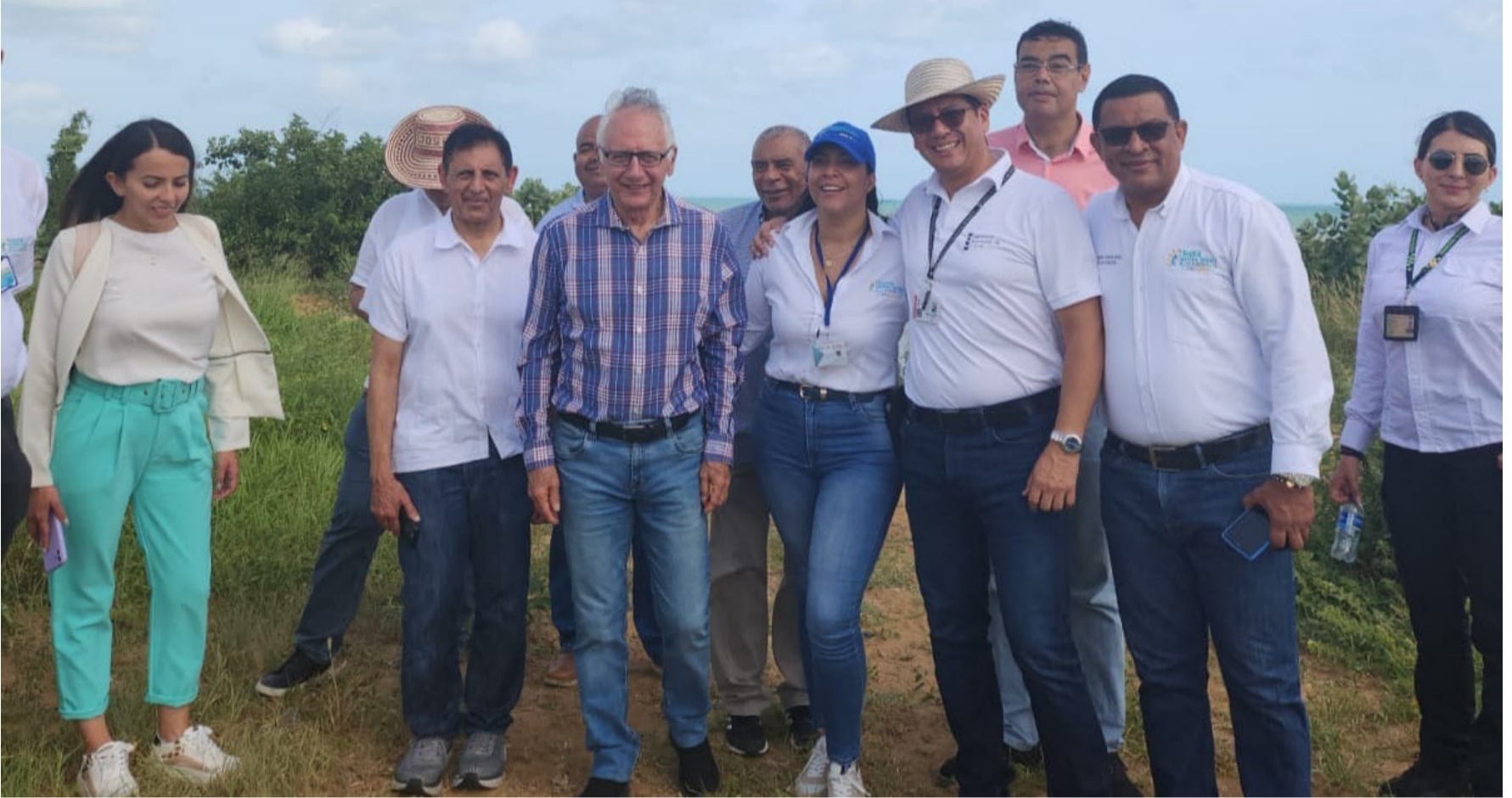
El día panamericano del médico fue celebrado por parte de los galenos de La Guajira, presentando el Plan Nacional de Ayuda a la etnia wayuú a la Corte Constitucional.