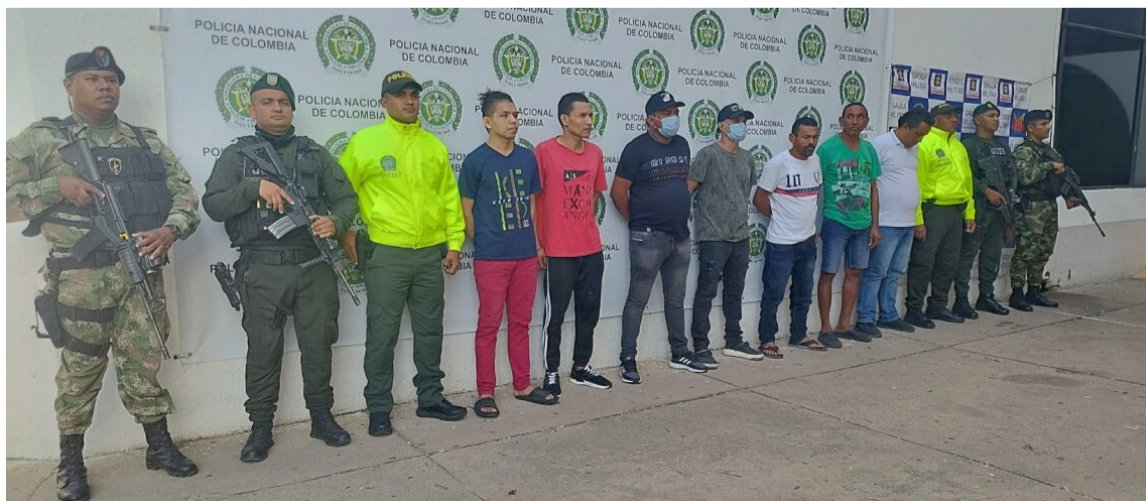
Desde el 1 de noviembre hasta el 30, la Policía Guajira capturó a 122 personas.

Se recuperaron 21 motocicletas y 10 vehículos que habían sido objeto de hurto en La Guajira. Fueron incautadas 22 armas de fuego ilegales, 99 kilos de clorhidrato de cocaína y 12 kilos de marihuana.