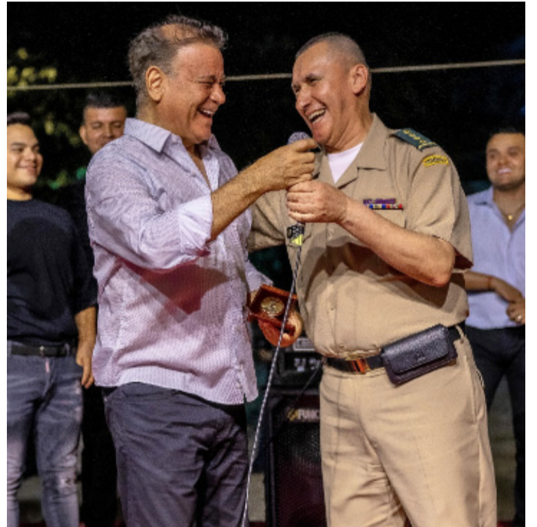
El cantante recibió la condecoración y agradeció este reconocimiento hecho por los héroes de la patria.