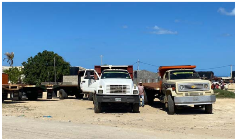
Los transportadores exigen mayor compromiso de las autoridades locales, para poder afrontar esta problemática.

Los transportadores exigen mayor compromiso por