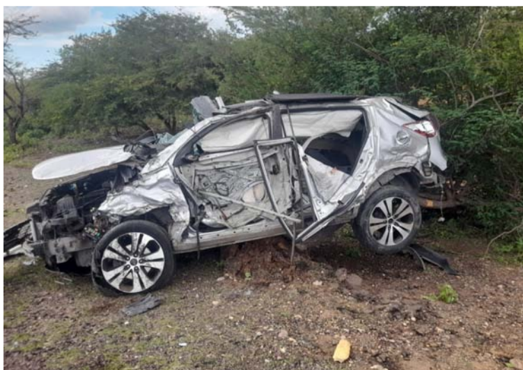
Los municipios donde se presentaron los accidentes son Maicao, Manaure, Barrancas y Fonseca en el sur de La Guajira.

Las autoridades están enfocados en las actividades preventivas de pedagogía que ayuden a crear conciencia en cuanto al estar frente al volante para evitar estos hechos que afectan la seguridad vial de La Guajira.