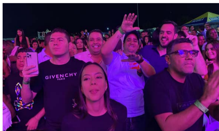
Anualmente el Festival de Compositores concentra a personalidades del Departamento y el país, lo cual mueve la economía local.

Querido amigo lector, que encender las velitas en su casa sea la representación de la armonía interna que debe iluminar su presencia, en su andar y su hogar.