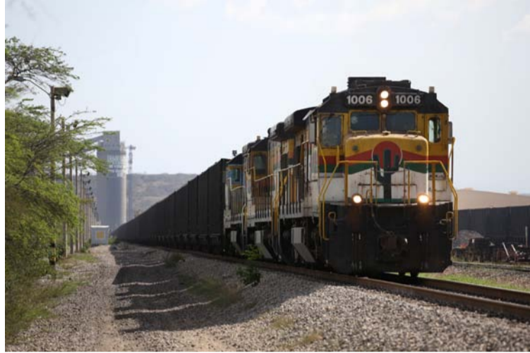
Bloquear a Cerrejón pone en riesgo la sostenibilidad de la empresa y el empleo de más de 13.000 trabajadores.

Agregó que Cerrejón viene trabajando por su parte, en iniciativas de relacionamiento en el área de influencia, que permitan fortalecer la comunicación entre diferentes actores de orden nacional y departa-