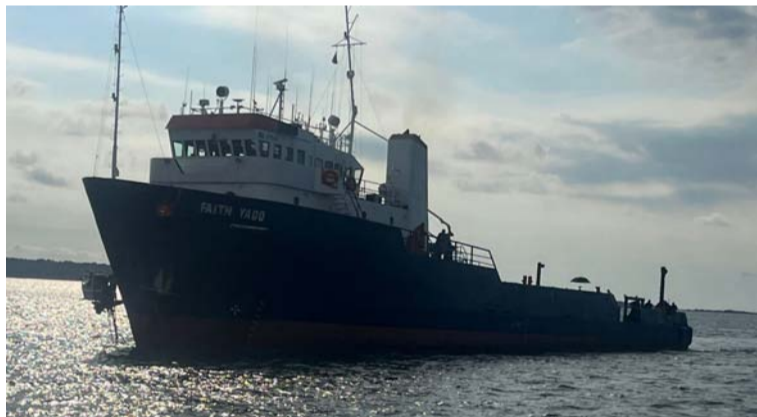
Las pérdidas ascienden a más de 110 millones de pesos con $10 millones diarios en nómina, alimentación y fondeo.

Comerciantes de Uribe, Manaure y Maicao, en la zona del régimen especial aduanero y fronterizo, expresaron su malestar ante el almirante nacional por el estancamiento de la motonave Faith Yadd en la zona portuaria Pensoport, Puer-