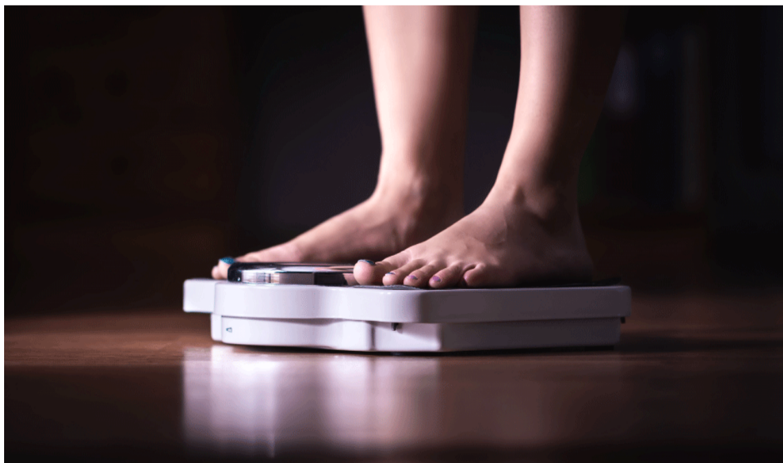
La Corte señaló que la obesidad es un tema que afecta a los adultos y a niños y niñas.