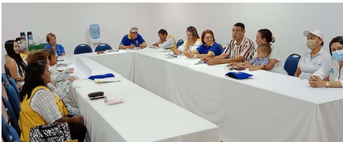
El Colegio Médico de La Guajira proyecta la realización de un evento de importancia internacional titulado 'Salud Pública en el contexto del mundo wayuú'.

Este plan abarca medidas integrales, como la recuperación nutricional con el proyecto 'Joolo', la creación de un instituto de investigación biomédica, educación en salud con enfoque étnico y la formación de profesionales de la salud. La Corte Constitucional respaldó estas propuestas, convirtiendo al Colegio Médico de La Guajira en veedor de las ac-