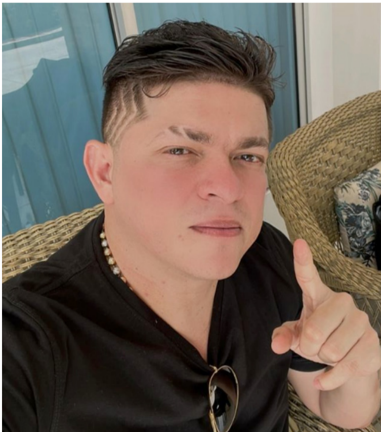
El artista reveló a sus seguidores que ya tiene el álbum preparado y sus fanáticos los han felicitado por eso.

El cantante 'Mono Zabaleta' anunció a través de sus redes sociales que se encuentra preparando su próximo lanzamiento musical y que lo hará por lo alto.