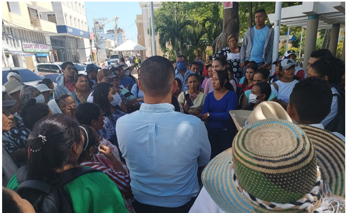
Los manifestantes exigían la presencia del alcalde José Ramiro Bermúdez Cotes.

Los manifestantes señalaron que al no tener solución inmediata, continuarán en señal de protesta sin dejar que nadie ingrese a las instalaciones de la Alcaldía de Riohacha, y continuarán con las vías de hecho hasta que les hagan los pagos.