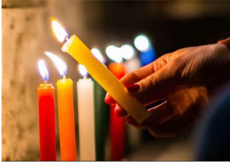
La noche de las velitas es una de las fiestas más representativas de la temporada decembrina en el mundo.

Otras personas prefieren esperar a pasar la hoja del calendario para empezar a adornar y preparar los de-