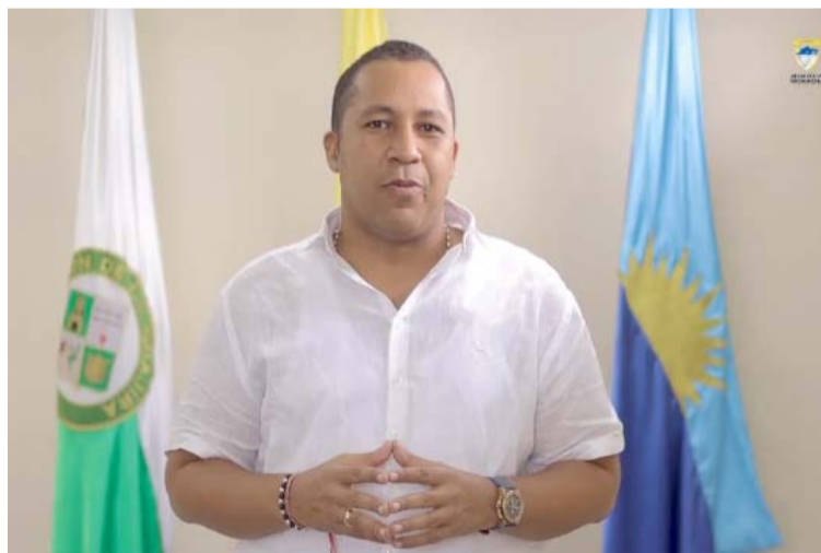
El mandatario, quien ya se encuentra despachando, sostuvo reuniones con varios de sus secretarios de despacho.

Además, que se deje sin efectos el numeral segundo del Auto de Apertura de Investigación Disciplinaria