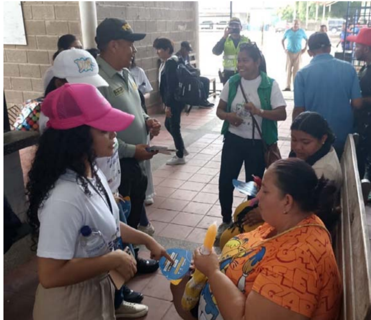
Dentro de las acciones se adelantó la intervención en la Central de Terminal de Transporte Maicao ‘Centrama’.

El coronel Diego Edison Montaña Gómez, comandante del Departamento de Policía Guajira, sostuvo que, dentro de las acciones preventivas se adelantó la intervención en la Central de Terminal de Transporte Maicao ‘Centrama’, en el barrio Santo Domingo, donde se dieron a conocer las diferentes campañas interinstitucionales y en ellas se brindaron recomendaciones de seguridad dirigidas a turistas nacionales y extranjeros, pasajeros, viajeros, comerciantes, locales comerciales, empresas de transportes y comunidad en general, con el propósi-