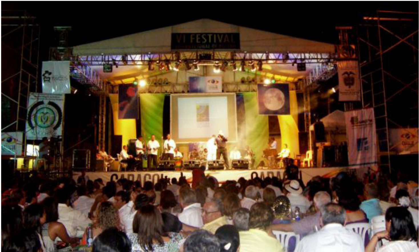
Se anunció que el XIII Festival Internacional del Bolero en la capital guajira será transmitido por Telecaribe.