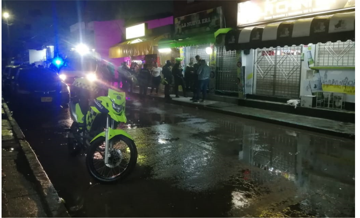
Las autoridades adelantaban las primeras pesquisas para determinar móviles y autores.

Hasta el sitio de los hechos llegaron miembros de la Seccional de Investigación Criminal (Sijín) quienes procedieron al levantamiento del cadáver e iniciar las investigaciones para determinar el móvil de este nuevo homicidio en la capital de La Guajira.