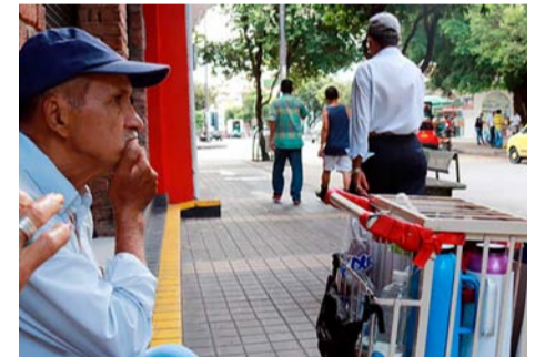
La tasa de desocupación para los hombres llegó a 7,7%.

El informe señala que las mujeres siguen siendo las más afectadas por el desempleo, pues para ellas la tasa de desocupación total nacional en septiembre de 2023 fue de 11,3%, mientras que para los hombres llegó a 7,7%, lo que representa una brecha de género de 3,6 puntos