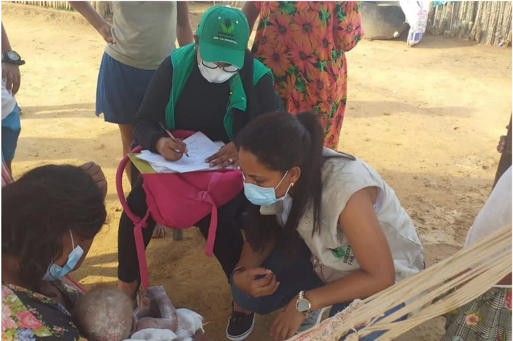
La mortalidad infantil por causas asociadas a la desnutrición sigue siendo siete veces mayor que el promedio nacional.