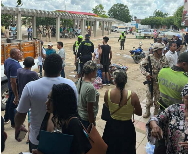
La fuerza pública ha estado muy pendiente de que todo este proceso de escrutinio se desarrolle con total normalidad.