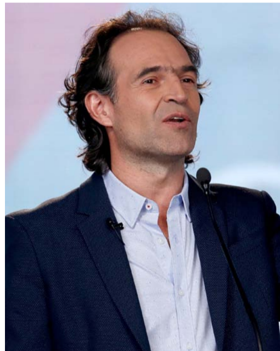
Federico Gutiérrez, alcalde electo de la ciudad de Medellín.