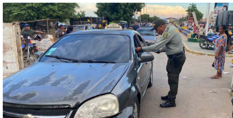
La estrategia fue dirigida a turistas, visitantes, ciudadanos nacionales y extranjeros, conductores y comunidad.

Cuando adquiera un medio de transporte (vehículo - motocicleta), verifique sus antecedentes y sistemas de identificación; para ello invitan a hacer la revisión con funcionarios adscritos a la Seccional de Investigación Criminal (Sijin), y denunciar de manera oportuna cualquier tipo de acción delincuencia.