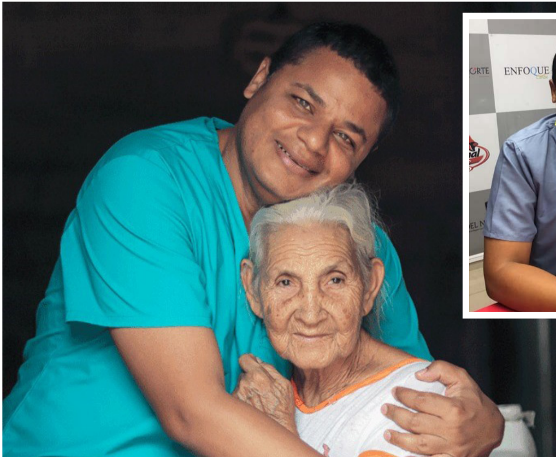
El alcalde electo agradeció el apoyo de su familia, de su grupo de trabajo, y al Todopoderoso.

“Hoy todos tenemos que trabajar alrededor de un solo propósito y ese propósito se llama Riohacha, así que en mí van a encontrar una persona completa-