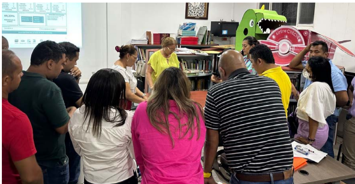
Estas irregularidades incluyen la presencia de votantes fallecidos, suplantación y enmiendas.