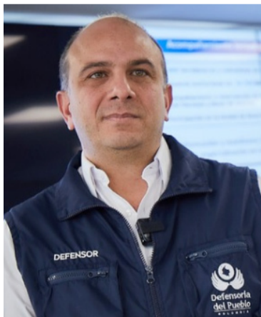
Carlos Camargo Assis, defensor Nacional del Pueblo.

Las principales motivaciones de los manifestantes fueron el desconocimiento de los resultados electorales, con un 42%, la mayoría de estos eventos, debido a la escasa diferencia de votos entre uno y otro candidato; la denuncia de posibles irregularidades electorales, con un 29%, principalmente relacionadas con eventos de