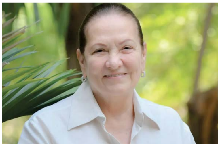
De acuerdo a la Fiscalía General, la decisión de la funcionaria sería un evidente desconocimiento de sus competencias.