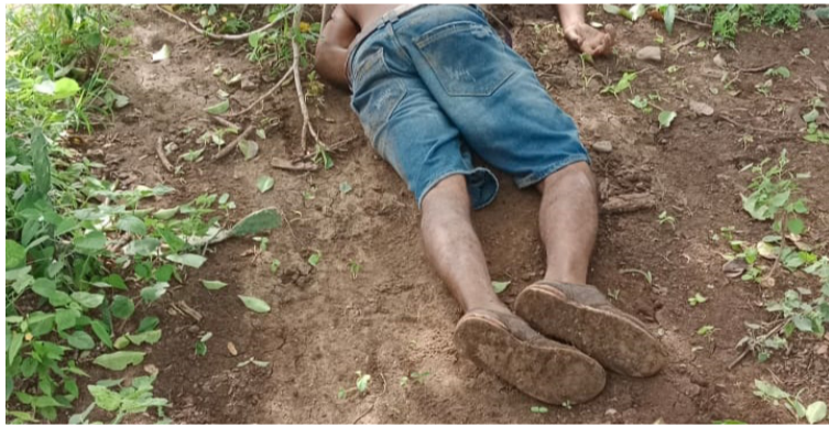
Moradores del sector dieron aviso a las autoridades sobre el hallazgo en la vía que comunica a Barrancas.

El hallazgo se registró por parte de moradores en la vía que comunica al municipio de Barrancas con el corregimiento de Guaya canal, en el sur de La Guaji-