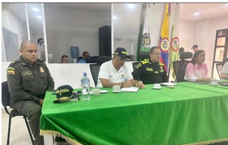
La gobernadora lamentó los hechos en Manaure, especialmente porque los escrutinios se venían cumpliendo bien.

Precisó, que el Centro Cultural se encuentra debidamente resguardado