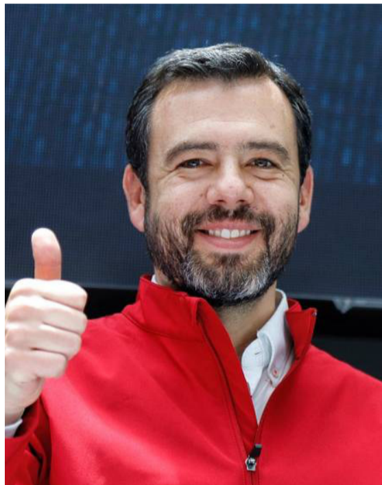
Carlos Fernando Galán Pachón, alcalde electo de Bogotá.