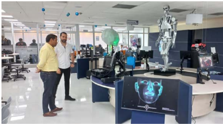
En su recorrido por la UniSimón, el alcalde wayúu visitó Eureka, el primer Distrito de Conocimiento e Innovación.

mandatario y el representante legal de la institución educativa, han coincidido en la necesidad de establecer convenios de colaboración fomentando con ello, abrir más oportunidades educativas para los y las jóvenes del municipio de Mai-