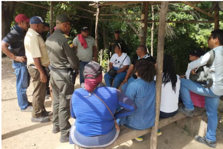
El acuerdo también incluye una jornada de fumigación en el sector de Villa Rumbo y vía a Los Pozos.

El acuerdo contiene varios puntos firmados por el secretario del Interior y