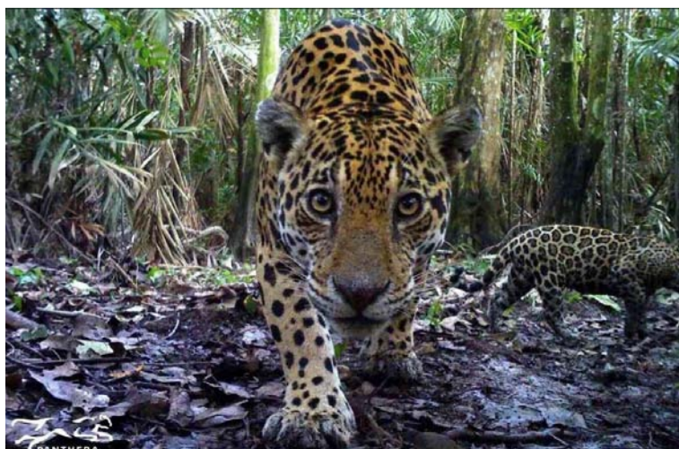
Mañana se celebra el día mundial del jaguar para generar conciencia sobre las amenazas que enfrenta.

Corpoguajira inició la semana con un video de @theamazing.world, en el que se puede apreciar la majestuosidad de uno de los felinos más importantes de la vida silvestre del Departamento: el Jaguar.