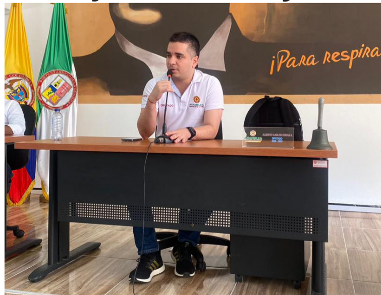
El presidente de la duma explicó que es necesario tener información de primera mano sobre las acciones de la Policía.