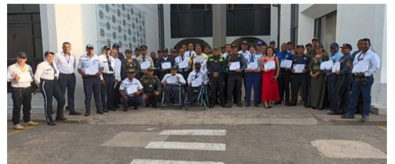
El pasado 26 de noviembre, se rindió homenaje a los más de 1.000 Vigilantes de La Guajira.