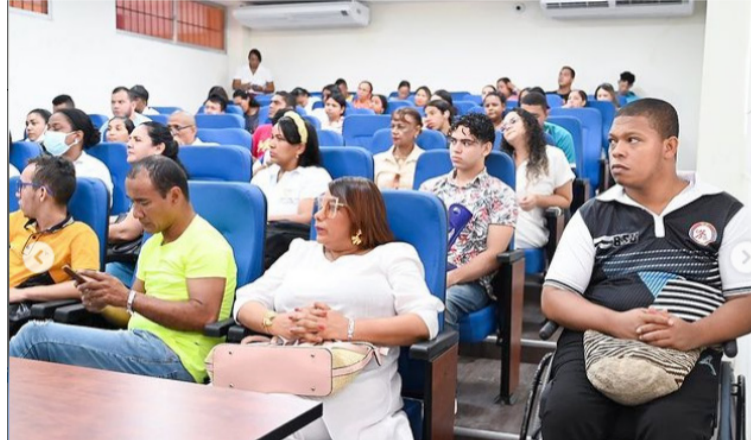
Durante la actividad, estudiantes compartieron sus experiencias desde la condición de discapacidad que presentan.

Cabe resaltar que el avance más significativo, fue la culminación de los se-