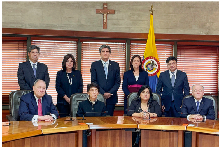
La Sala advirtió que autoridades tienen tres días para presentar pruebas y, estos deben basarse en indicadores efectivos.

Así, la Sala dispuso que la Consejería Presidencial