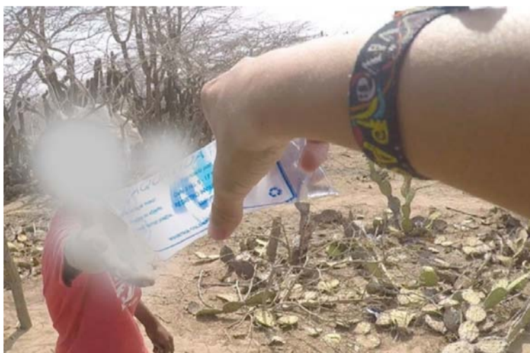
Los 'peajes' son vistos en las redes como un proceso colectivo de mendicidad de la comunidad wayuú en los territorios.

En su estructuración, un reglamento debe ser de carácter incluyente. En su parte introductoria se deben invocar las bases legales, los objetivos, los criterios generales y las reglas especiales para el uso de las zonas intervenidas en los territorios indígenas, seguida de la definición de su ámbito geográfico y la enumeración de las partes involucradas. Por Veeduría Ciudadana a la Implementación de la Sentencia T-302 de 2017.