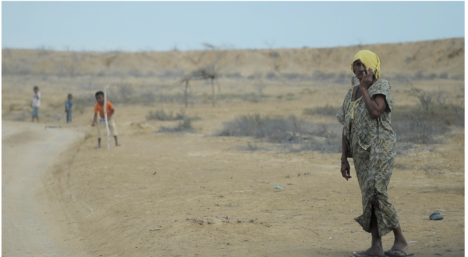
Los niños wayuú son utilizados como una suerte de barrera para solicitar contribuciones económicas a los conductores.

Los 'peajes' son visibilizados en las redes como un proceso colectivo de mendicidad de la comunidad wayuú en los territorios, actividad en la que se ven involucrados niños, niñas, mujeres embarazadas y ancianos. Asumir esta realidad solamente desde allí, es una forma de estigmatizar a las comunidades indígenas de las cadenas productivas que generan y acumulan ganancias desde sus territorios. La existencia de estos retenes de niños wayuú