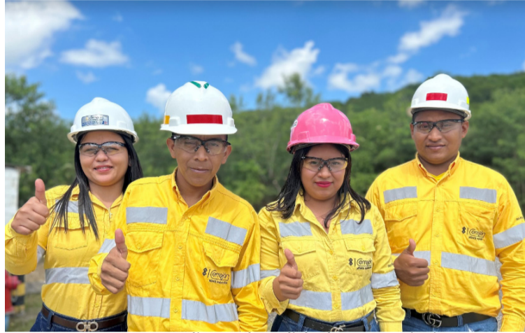
Las vacantes son analistas de calidad, mantenimiento, geotécnico, asistentes de voladura, electrónica, entre otras.

Las vacantes en esta primera convocatoria laboral cubrirán las ocupaciones de analistas de calidad, mantenimiento, geotécnico y despacho, asistentes de voladura, electrónica y controles industriales, operación de camión, grúa, lubricantes y combustibles, tractocamión, cama baja articulada y camión de explosivos; operación de planta de agua, voladura, e Isla de combustible, operación de motoniveladora, tractores de oruga, palas hidráulicas y eléctricas, supervisores de control de calidad, mantenimiento y minería, técnico/as de atención de emergencia, integridad operacional y calidad, técnico/as de mantenimiento de llantas, tala-