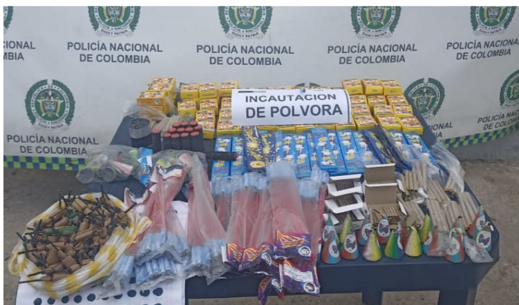
El material incautado tiene un peso de 2.000 gramos aproximados y está valorado en cerca de un millón de pesos.

Igualmente, se busca prevenir accidentes y promover la seguridad de la población durante las festividades decembrinas que ya se aproximan.