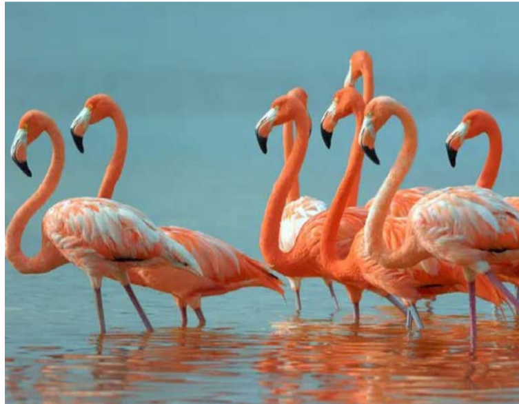
Los dispositivos más eficaces para ello son los desviadores de vuelo luminiscentes y de luz ultravioleta.

Durante este proceso, Enlaza viene estudiando con sus especialistas la avifauna en la región y ha encontrado que en particular la línea Riohacha - Cuestecita 110 kV registra algunos inconvenientes en su interacción con los flamencos, pues se trata de una especie que elige las noches para emprender sus rutas migratorias en-