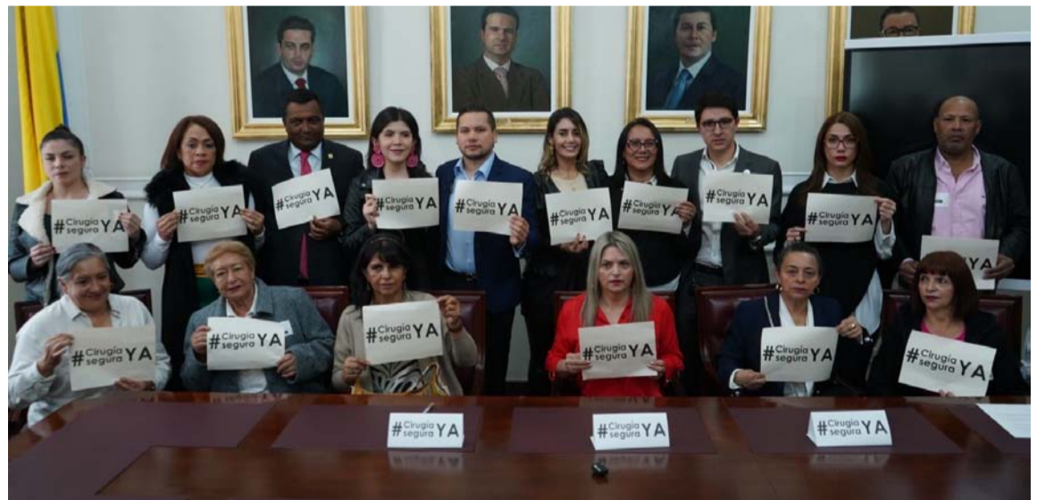
La iniciativa debe ser aprobada en cuatro debates para convertirse en ley de la República.

“Si bien no somos responsables directos de su funcionamiento, hemos apoyado la operación de la estación de bombeo pluvial con insumos logísticos y con nuestro equipo técnico, además de avanzar con limpiezas generales con el vector.