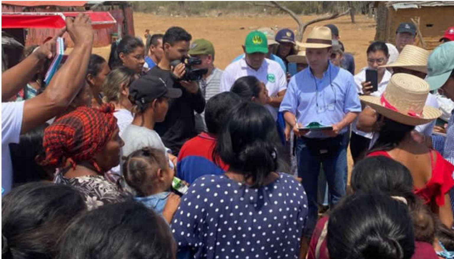
Las administraciones mantienen en el abandono total a las comunidades y solo llegan en épocas de campañas políticas.

En su informe, resaltó la falta de articulación y coordinación entre las entidades tanto del orden nacional, como del orden territorial y las comunidades indígenas como corresponsables, situación que se vio reflejada en los procesos de atención a los niños wayuú y cuyos resultados no son compartidos, especialmente, en las intervenciones en contra de la desnutrición infantil. Esta información que debe ser también conocida al interior del sistema de protección a la familia en donde se encuentran el Icbf y las entidades de salud, con el ánimo de realizar esfuerzos mancomunados, ya que la cuenta de niños