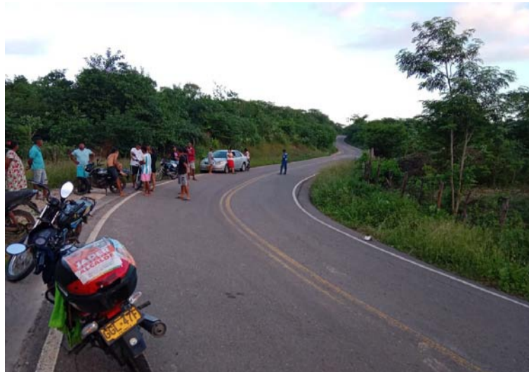
El hecho se registró a las 6 de la mañana a la altura del sitio conocido como 'La S con S', vía Nueva América-Albania.

Habitantes de la vereda claman a las autoridades más presencia en el sector,