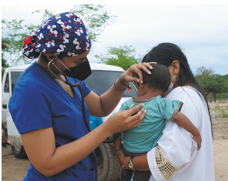
En las profundidades de las rancherías, la vida comunitaria sigue inmersa en condiciones de extrema vulnerabilidad.