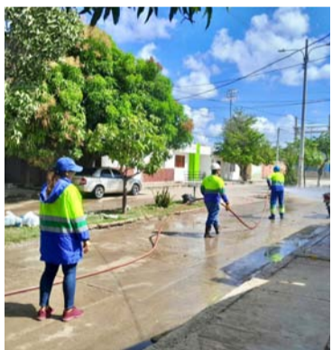
Se realizó la desinfección y limpieza de las calles.

En un esfuerzo conjunto por mejorar el entorno y bienestar de los habitantes del Barrio Arriba, en Riohacha, se llevó a cabo una jornada de lavado y limpieza en el sector comprendido entre la calle 3B hasta la 6, y las carreras 1 y 2.