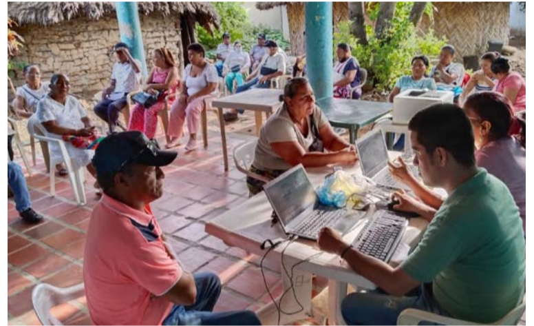
Durante el 2023, la Unidad estableció el compromiso de llegar a más población víctima del conflicto en La Guajira.

En la Unidad para las Víctimas 'Cambiamos para servir' con el objetivo de