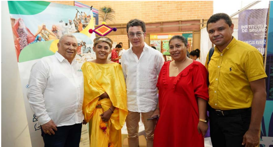
En las jornadas académicas asistieron 560 empresarios quienes participaron en varios foros.

Igualmente, 206 empresarios y emprendedores asistieron a las ruedas de relacionamiento comercial y financiera para generar conexiones en cuanto a proveeduría, relacionamiento y desarrollo de negocios con las Ruedas Alístate y