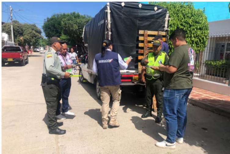
Se llevó el mensaje de manera especial a la ciudadanía, padres de familia, responsables de niños, niñas y adolescentes.

De igual forma, mediante acciones pedagógicas se adelantó la campaña de prevención frente al uso de la pólvora haciendo énfasis en las afectaciones