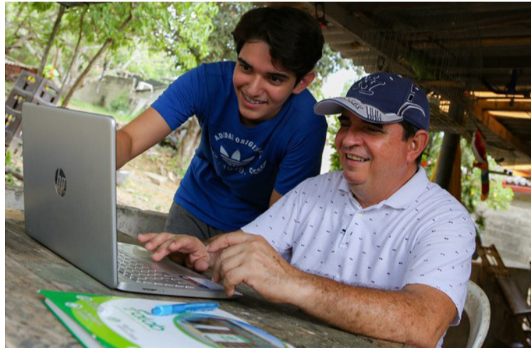
Para el ministro Mauricio Lizcano esta convocatoria avanza en el compromiso de conectar al 85% de la población.

Los Proveedores de Redes y Servicios de Telecomunicaciones (Prst), Prestadores del Servicio de Internet (ISP) y demás interesados podrán participar de la convocatoria hasta el próximo 29 de noviembre de 2023 hasta las 11:59 p.m., enviando sus propuestas a través del correo electrónico: