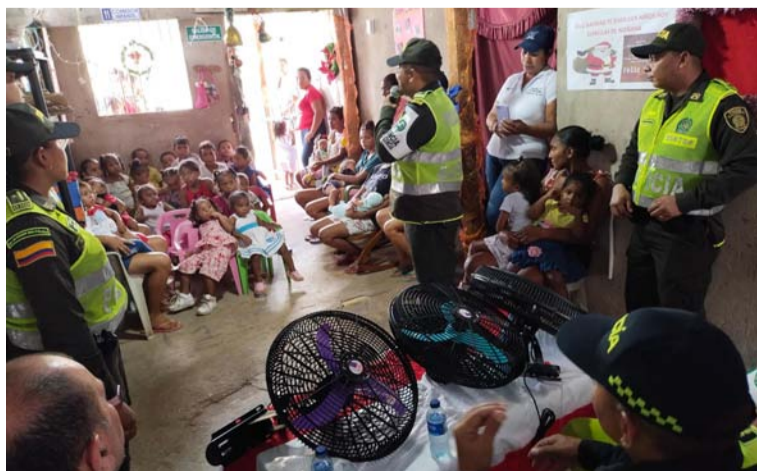
Esta iniciativa tiene como objetivo mejorar la calidad de vida de los niños y niñas que asisten al centro infantil.

El Grupo de Prevención y Educación Ciudadana, en colaboración con la Policía de Vecindario y el Grupo de Protección a la Infancia y Adolescencia, Patrulla Púrpura, hizo la entrega de tres ventiladores de pared a un hogar infantil del barrio La Bendición de Dios en Riohacha.