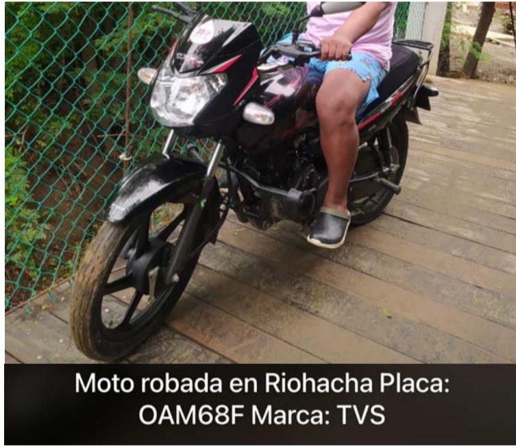
Moto robada en Riohacha Placa: OAM68F Marca: TVS

avenida, se presume que lo ayudó sin saber que la motocicleta estaba siendo hurtada por este niño.