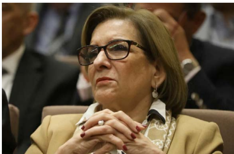
Dice Cabello que la ausencia de publicación del informe de conciliación en la Gaceta, debe considerarse una infracción.

La Procuradora General de la Nación, Margarita Cabello Blanco, pidió declarar la inexecutable parcial de la ley mediante la cual se expidió el ‘Plan Nacional de Desarrollo 2022 – 2026, Colombia Potencia Mundial de la Vida’ (Ley 2294 de 2023), al presentar vicios en el trámite de conciliación.