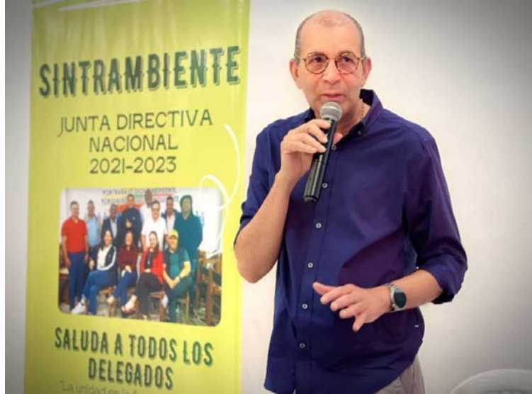
La distinción se llevó a cabo en el marco de la Asamblea Nacional de Sintrambiente, la cual se realizó en Dibulla.

el evento se efectuó la elección de la nueva Junta Directiva Nacional en la que se eligieron a los represen-