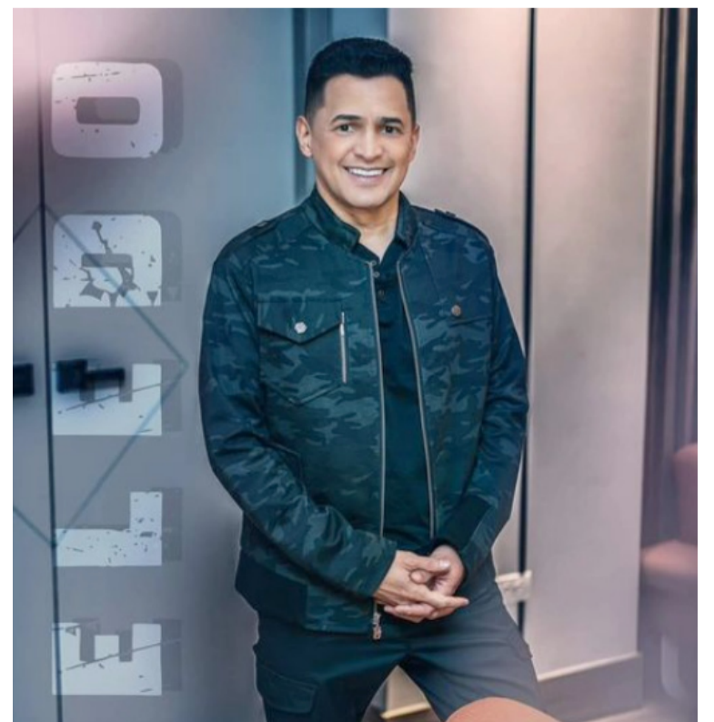
El artista se estará presentando este 25 y 26 de noviembre en Envigado y Heliconia, departamento de Antioquia.

En estos dos conciertos, Jorge Celedón será el artista complaciente con todas las peticiones de sus seguidores.