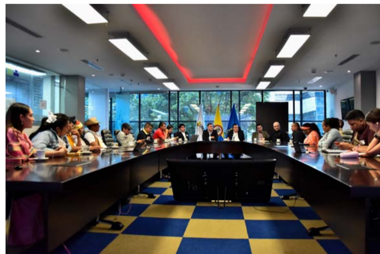
El Gobierno trabaja en 1.620 jagüeyes; la compra de 70 plantas desalinizadoras portátiles, y 5.720 tanques de 5.000 litros.

El Gobierno del Cambio continúa trabajando desde el diálogo y la escucha para proponer soluciones desde las realidades y a partir de ello entregar resultados que permanezcan en el tiempo.