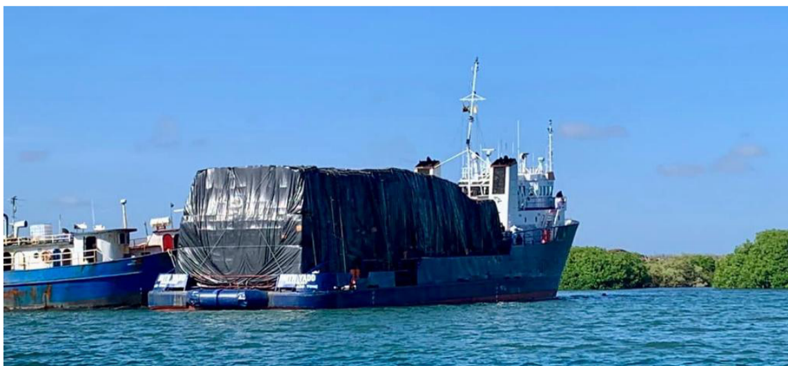
La capitanía ordenó el descargue de los productos navideños de la motonave Faith Yadd.

Asimismo, se le informó la necesidad de exigir la bandera de la nave y la certificación permanente a la casa clasificadora, donde determine que la motonave es de 'carga general'.