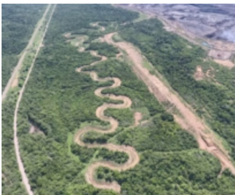
El arroyo Bruno está vivo y se evidencia en el hecho de que el nuevo cauce ha mejorado la disponibilidad de agua.

la normatividad colombiana, es apta para el consumo humano con un tratamiento convencional (como en cualquier fuente de agua