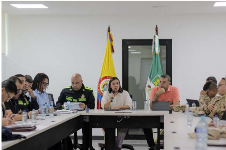
La mandataria, dijo que la administración brindó todo el apoyo logístico requerido por las autoridades electorales.

La mandataria, dijo también que desde la adminis-