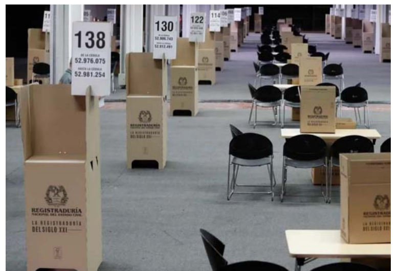
El objetivo es que las elecciones se cumplan sin ningún problema en los 196 puestos de votación habilitados.

Recordó que en esta justa electoral estarán actuando 13.692 ciudadanos que fueron seleccionados como jurados de votación, de los cuales 3.048 corresponden a la capital de La Guajira.