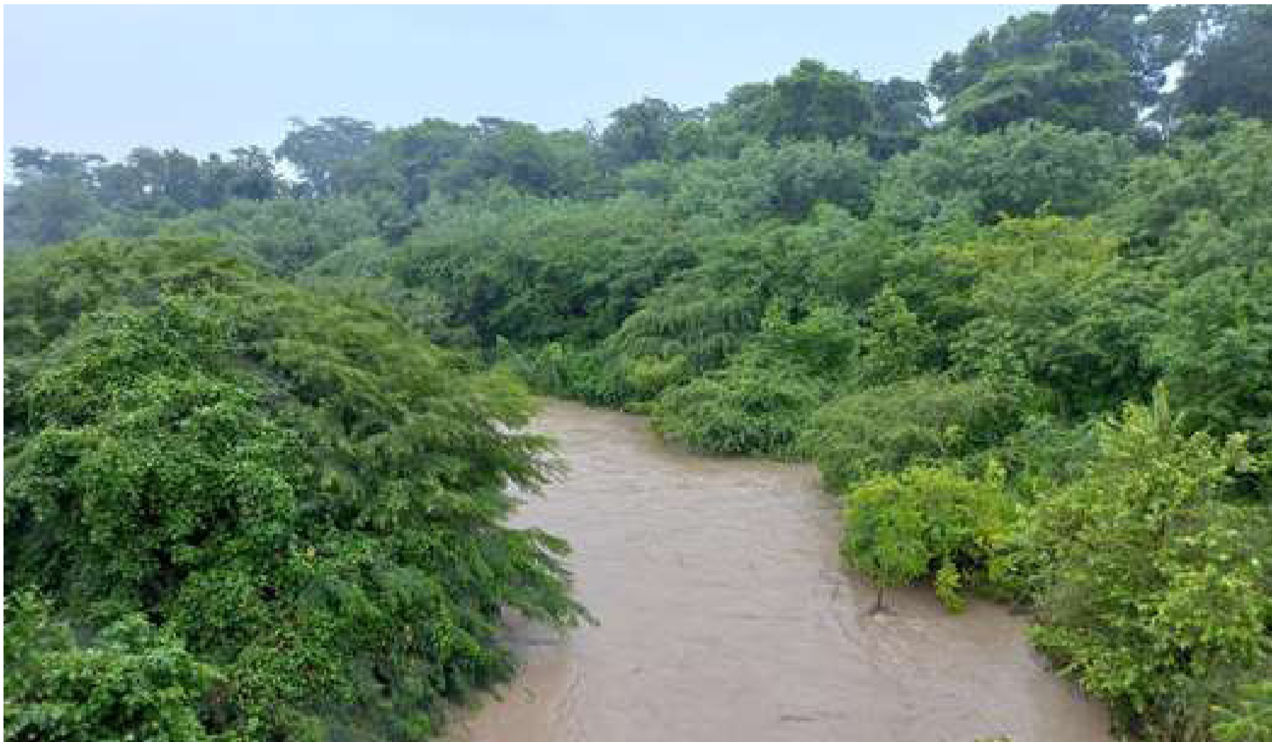
El arroyo cuenta con más de 17.800 árboles sembrados o que han nacido naturalmente en el nuevo cauce, pertenecientes a 76 especies nativas.

La calidad del agua responde a los niveles establecidos por la normatividad nacional