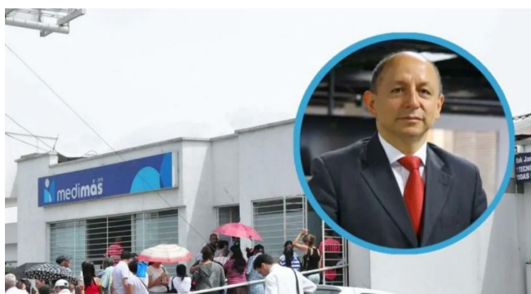
La EPS entregó un anticipo por $263.000 millones, de los cuales $7.105 millones se usaron para pagar arriendos.

Los elementos de prueba dan cuenta de que el contratista fue seleccionado sin tener la capacidad financiera y la experiencia técnica para cumplir el objeto previsto. Al parecer, el proceso de adjudicación se hizo con