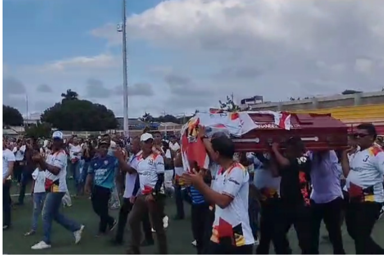
Familiares, amigos y compañeros manifestaron que las autoridades siguen sin dar un parte de lo sucedido con 'Zapuca'.

La comunidad y familiares del deportista están resentidos ante este suceso en el que perdió la vida una persona que no tenía enemigos y que gozaba de un gran cariño en la Comuna 10 de Riohacha.