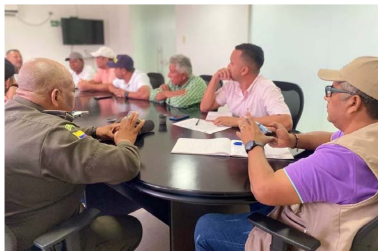
Las mesas de diálogo y negociaciones iniciaron en las instalaciones de las oficinas del Ministerio del Trabajo.

Por último se acordó que para el día lunes 30 de octubre se inicia la mesa de trabajo entre los miembros del gremio de transportadores, gremio de coteros, socios de la empresa Sama y la Alcaldía de Manaure para definir la situación de reactivar el derecho al trabajo de los transportadores que llevan más de 70 días paralizados.