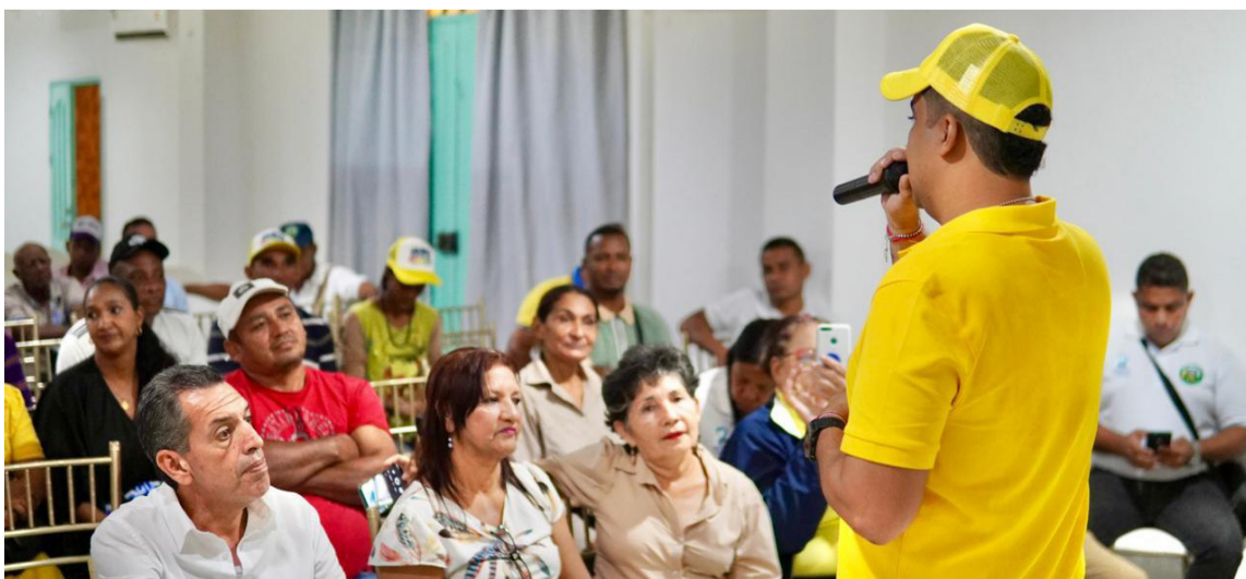
El candidato llamó a la participación activa de todos los guajiros en esta jornada electoral.