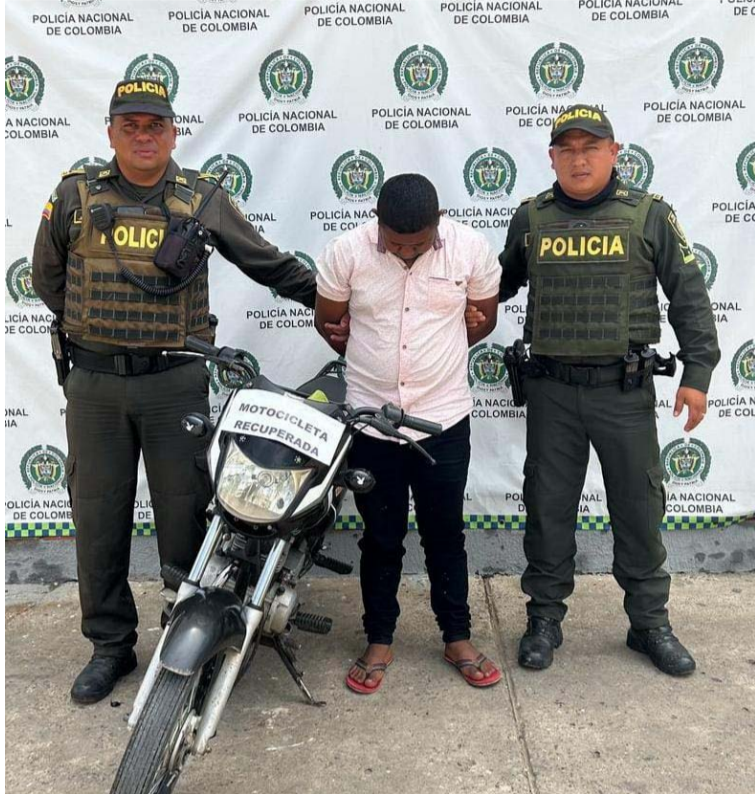
La persona capturada y la motocicleta fueron entregadas a la autoridad competente.

La persona capturada y la motocicleta recuperada, en relación al delito de receptación, fueron entregadas a la autoridad competente.