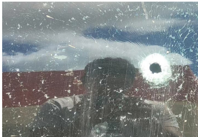
El automotor con las tres personas fue atacado a balazos por hombres armados.

Un hombre murió y dos más resultaron heridos, entre ellos un menor de edad, cuando se movilizaban a bordo de un vehículo en la vía Troncal del Caribe, en el tramo Los Filuos-Moina, en sentido La Raya-Maraicao.