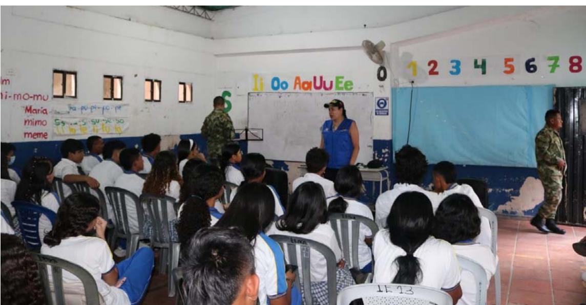
La actividad estuvo liderada por uniformados del Grupo de Caballería 'Gr. Gustavo Matamoros'.