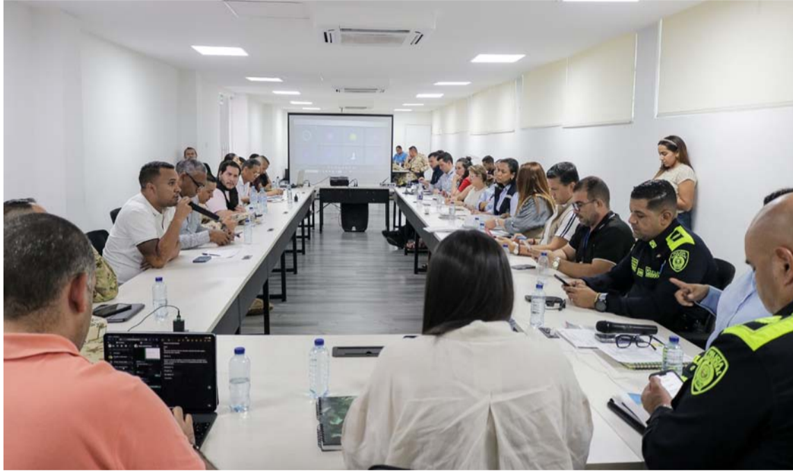
En el PMU señalaron que ya están preparados todos los jurados de votación en cada puesto.

Dentro de la instalación se analizaron varios temas entre los que destacaron que en La Guajira hay dispuestos 2.054 mesas electorales en 196 puesto de votación. Además, certificaron que todos los kits electorales están en cada una de las cabeceras municipales con el fin de brindar todas las garantías para un proceso oportuno y con todas las capacidades de logística para