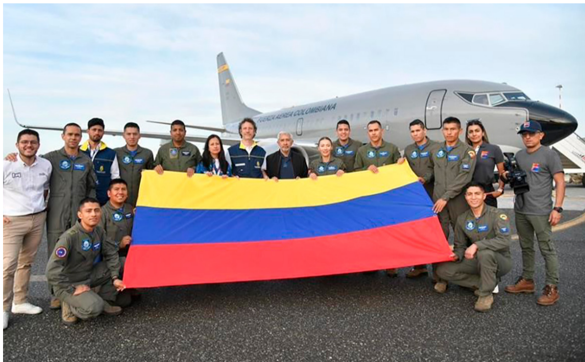
El vuelo aterrizó en la zona del desierto del Sinaí para descargar la ayuda humanitaria.

La aeronave de la Fuerza Aeroespacial Colombiana (FAC) que transporta ayuda humanitaria enviada por Colombia a la Franja de Gaza, llegó a Egipto, informó el Ministerio de Relaciones Exteriores.