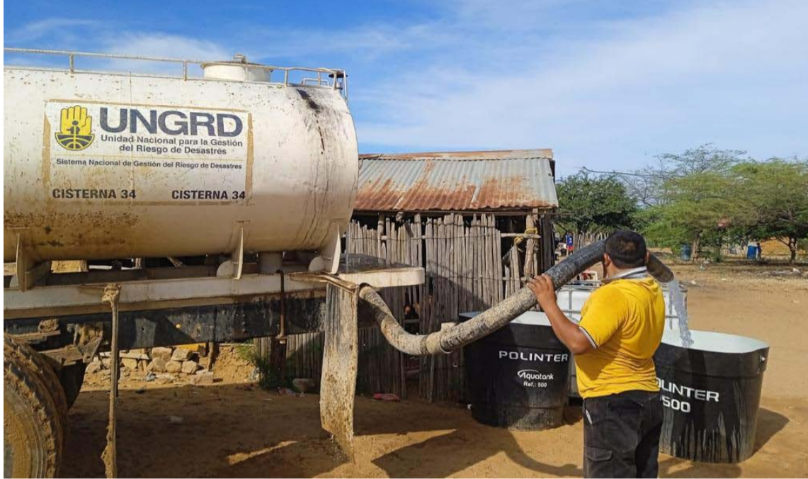
En el Gobierno Petro se han invertido $460 mil millones para llevar agua potable a La Guajira.

En días pasados un camión cisterna del Ejército Nacional llegó a Uribia, transportando 100.000 litros de agua apta para el consumo humano. Desde allí, la Ungrd coordinó la transferencia de este preciado líquido a 10 carro-tanques, cada uno con una capacidad de 10.000 litros para ser entregados en diferentes municipios del Departamento.