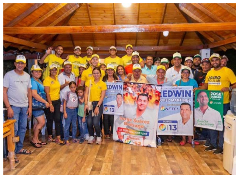
Tiene 27 años y se encuentra entre los más opcionados para ocupar una curul en la дума departamental.