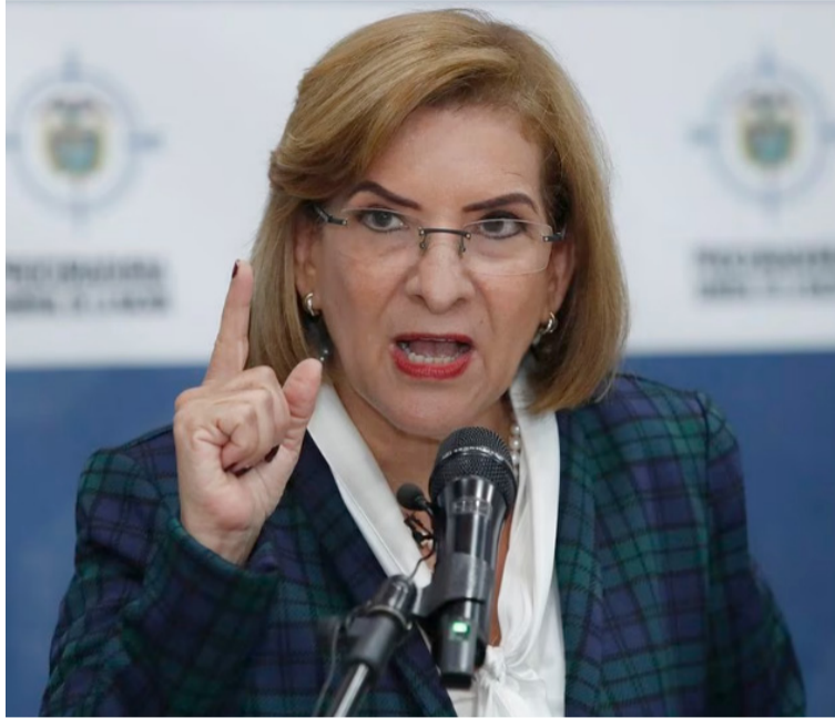
Margarita Cabello destacó el reto que tiene la entidad para realizar vigilancia e intervención durante la jornada.

En el PMU, se afirmó que la entidad designó 3.100 funcionarios para ejercer