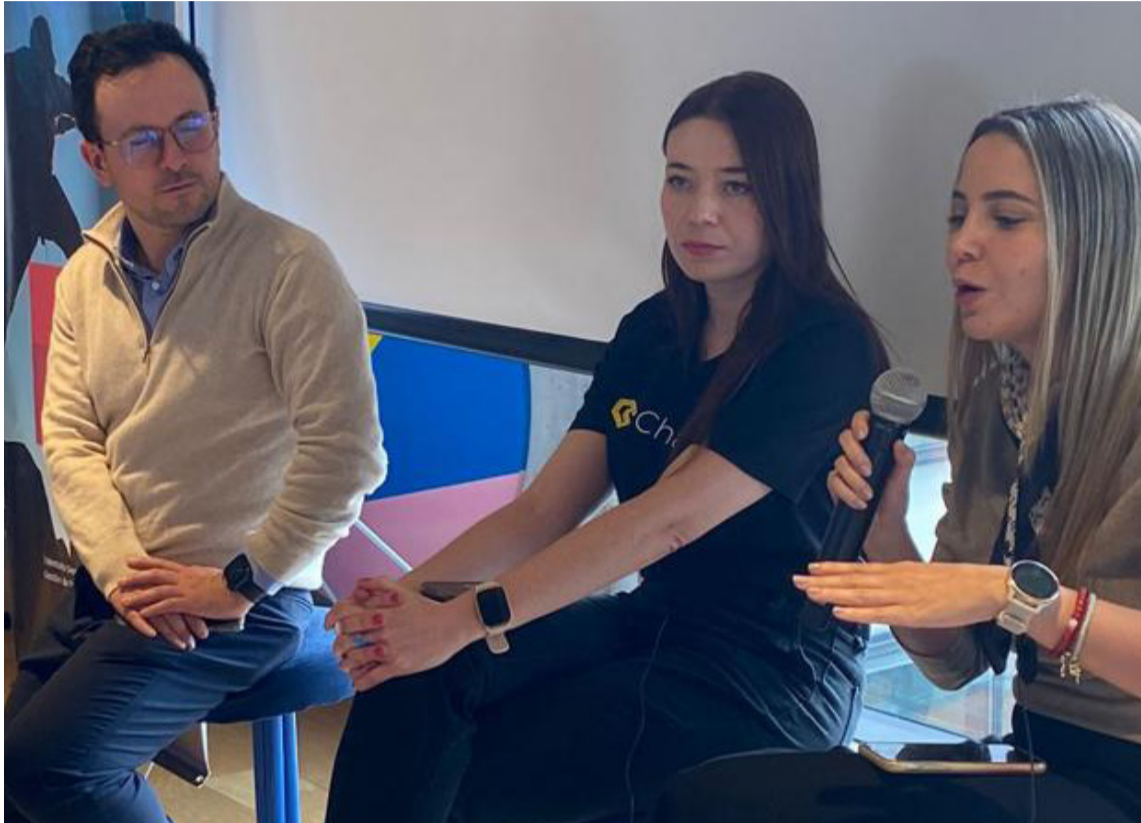
Participando de un conversatorio de impacto de la relación con el jefe en la salud mental.

En el año 2020, durante la pandemia, tomé una decisión crucial, fundar mi propia empresa: Life and Career Mentors. Esta iniciativa empresarial surgió como respuesta a la compleja situación global en el mundo laboral, con despidos masivos, un aumento significativo de la ansiedad y la depresión debido a la incertidumbre reinante. Paralelamente, observé a muchas personas que estaban reinventándose y desarrollando talentos que habían estado inexplorados debido a sus trabajos anteriores. Ahí vi la necesidad de apoyar a estas personas en la búsqueda de un camino satisfactorio. En el presente, me llena de alegría liderar este proyecto y tener un impacto positivo en la calidad de vida de muchas personas”.