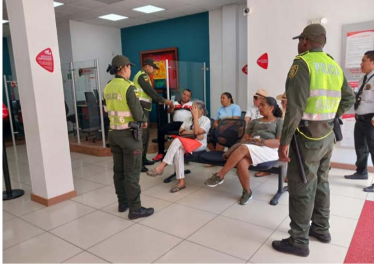
Las acciones se basaron en la distribución de material informativo donde se hace recomendaciones para la seguridad.

Entre las recomendaciones destacadas para prevenir el homicidio y el hurto en sus diversas formas se incluyen la sugerencia de evitar llevar consigo más dinero del necesario al salir, mantener la atención en su entorno, incluso durante conversaciones en aplicaciones como WhatsApp; recor-