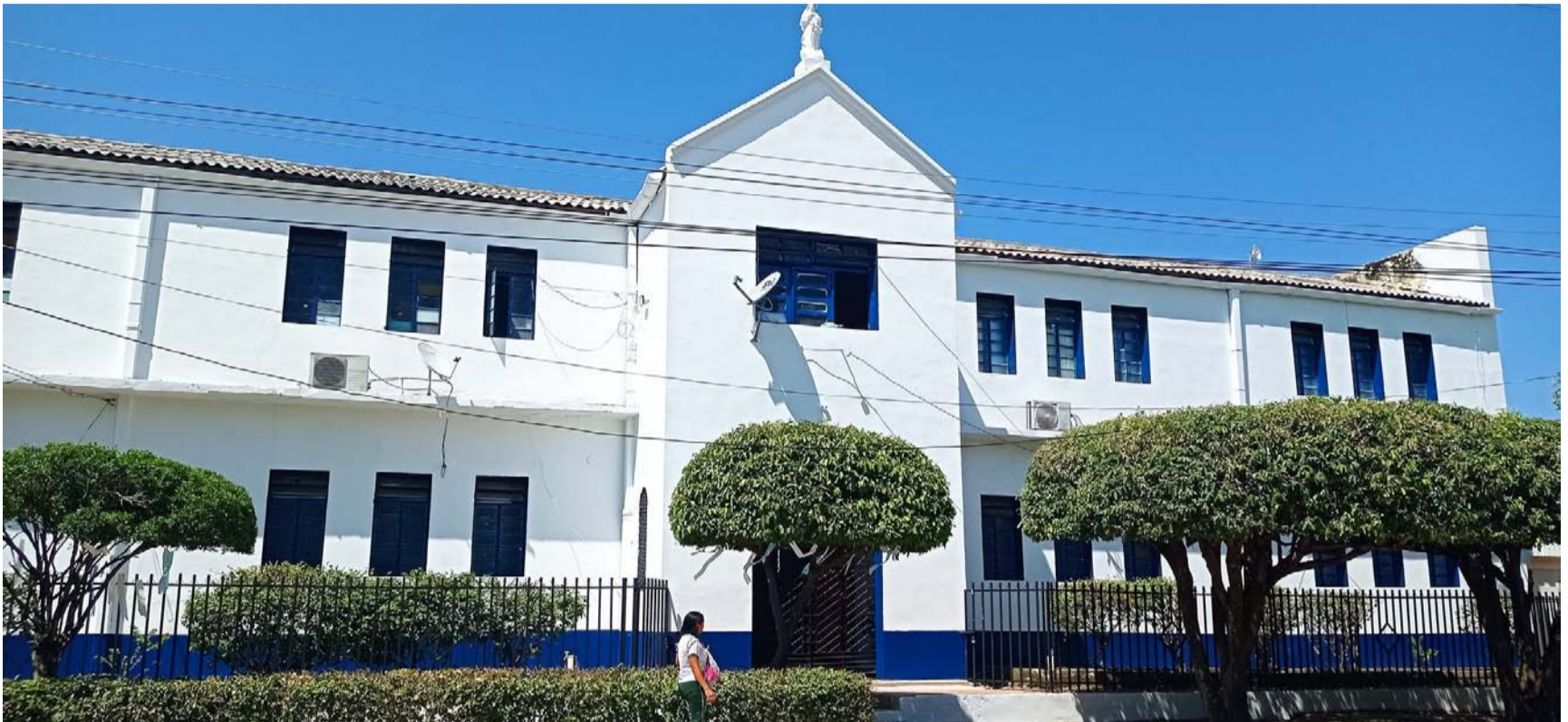
La Institución Educativa María Inmaculada de Fonseca cumplió 75 años, colegio que ha logrado dejar huella imborrable en la vida de innumerables personas.

Por Misael Arturo Velásquez Granadillo mimaju2002@hotmail.com