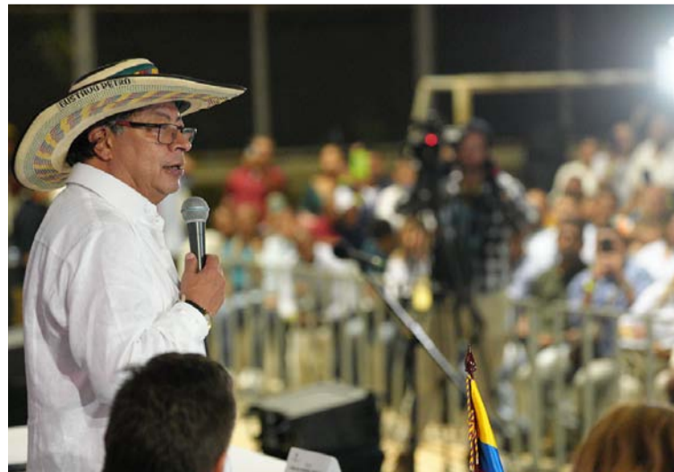
Petro dijo que la compra de votos afecta la transparencia de la democracia, genera violencia y deteriora derechos políticos.

“Igual que uno tiene el derecho de vivir, de no ser molestado en su intimidad, el derecho de educarse, el