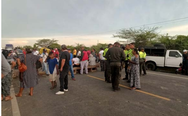
Desde las 2 de la tarde de ayer mantenían bloqueado el paso, sin permitir el acceso a ningún vehículo.

En horas de la madrugada de ayer una mula cargada se llevó por delante a un automóvil que terminó