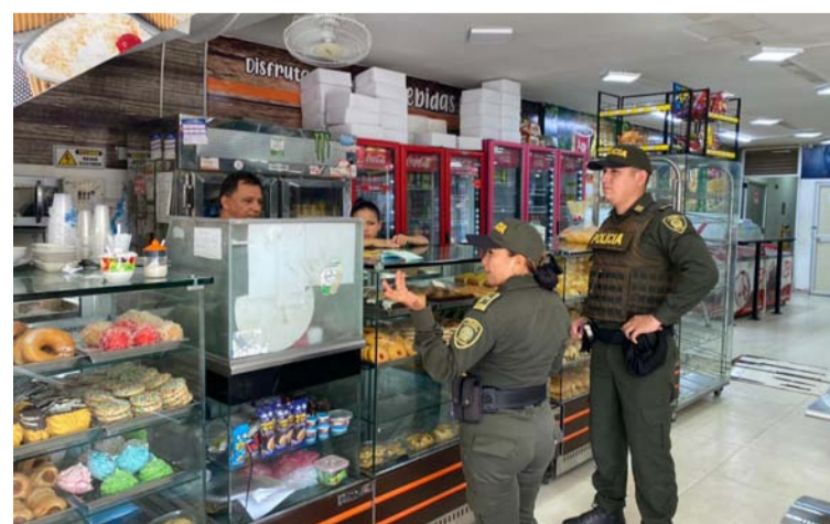
Se pide no aceptar ayuda para realizar transacciones bancarias y no entregar su tarjeta de crédito o débito a extraños.

Igualmente se sugiere no brindar información a