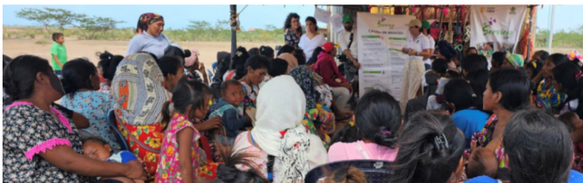
Los talleres se realizaron con el apoyo de una intérprete de la lengua wayuunaiki.

Paralelo a las capacitaciones se han estado escuchando los ciudadanos que conforman los comités de control social del Icbf en los municipios de Manaure, Fonseca, Maicao y Riohacha, para conocer la percepción de los servicios y hacer los ajustes necesarios para garantizar los derechos de la generación para la vida y la Paz.