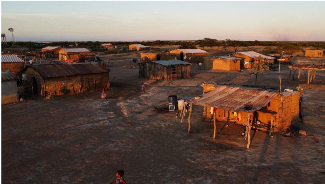
Los pueblos indígenas más afectados fueron el Wayuú, Wiwa (3), Kogui (2) y Arhuaco (1).