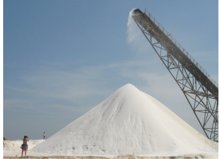
Con el apoyo del viceministro esperan que se logre una rápida concertación que lleve a normalizar de las actividades.