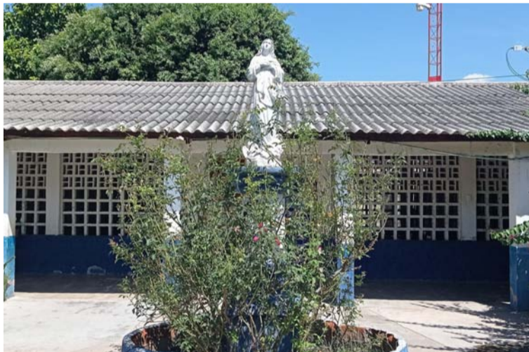
La congregación de las hermanas Laura Montoya, son un ejemplo inspirador de dedicación y compromiso con el servicio a los demás.

A lo largo de los años, han demostrado un compromiso inquebrantable con la excelencia educativa, poniendo a disposición de sus estudiantes un equipo de docentes altamente capacitados, que no solo transmiten conocimientos, sino que también fomentan el amor por el aprendizaje y la superación personal. Su encomiable labor educativa ha dado frutos maravillosos, formando generaciones de profesionales exitosos y ciudadanos comprometidos con el bienestar