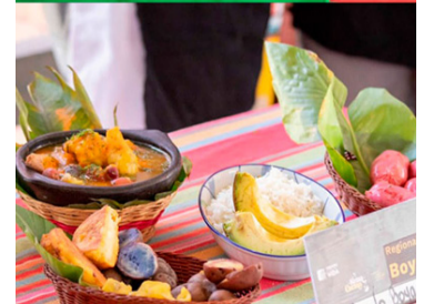
Fueron muestras típicas de sabores de un país diverso.