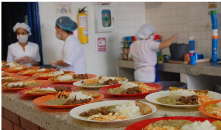
Municipios como Riohacha, Manaure, Maicao y Uribia no cuentan con accesibilidad y calidad en la atención.

mismo periodo relacionado fueron notificados 1993 casos de desnutrición aguda moderada y severa en niñas y niños menores de 5 años en el departamento, ubicándose como la segunda entidad territorial con mayor número de notificaciones. El aumento fue del 47% en comparación con los registrados en el mismo periodo del 2022, cuando se