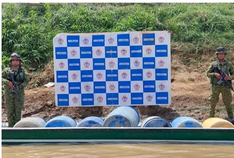
La Armada y el Ejército destruyeron tres laboratorios para el procesamiento de pasta base de cocaína.

artesanales, los cuales fueron puestos a disposición de la autoridad competente