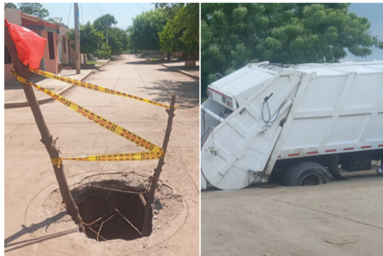
Dice la comunidad que el manjón y el pavimento hundido se vuelven un inminente peligro para los transeúntes.

Denuncian que esta situación mantiene afectados a más de 35 niños de la Unidad Comunitaria de Atención, UCA del Icbf, quienes se encuentran propensos a sufrir algún tipo de epidemia.