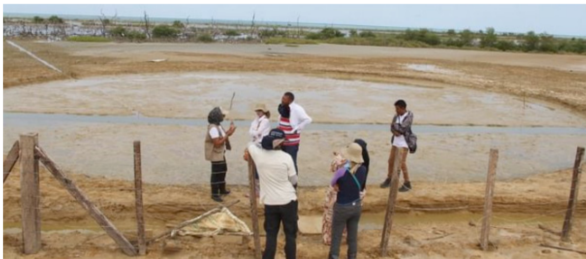
Delegados de Minambiente verificaron el cerramiento para protección de los manglares.

Corpoguajira atendió la visita del delegado del Ministerio de Ambiente y Desarrollo Sostenible y de los integrantes de la Unidad de Gestión del Proyecto 'Medidas de Adaptación basadas en ecosistemas contra la