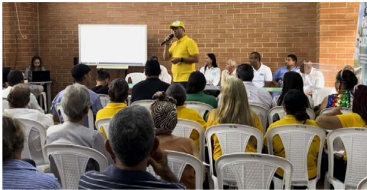
En el mismo evento se firmó el Pacto Departamental por la cultura 2024-2027. por una guajira diversa y creativa.