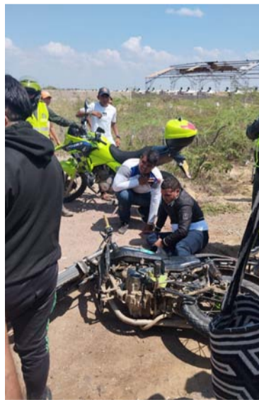
Con disparos los sindicados fueron neutralizados.

Ante el llamado de auxilio de la mujer, los uniformados de la Policía Nacional con acompañamiento del Ejército, iniciaron la persecución de los supues-