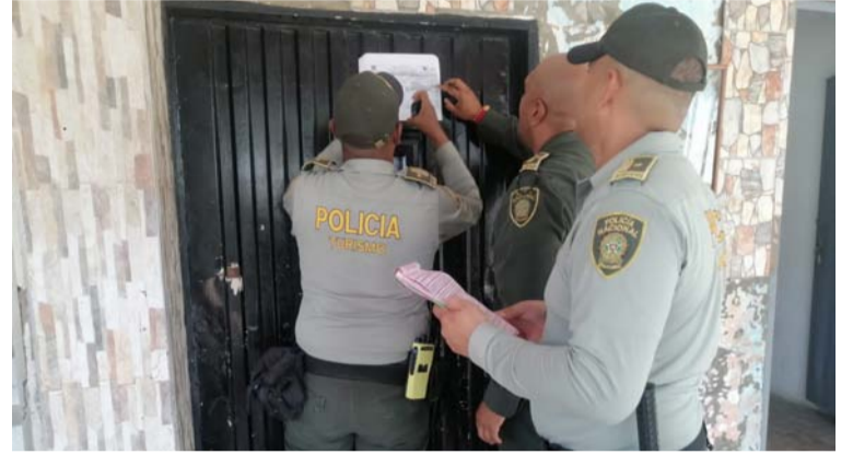
Se realizaron de manera exhaustivas las revisiones de las documentaciones de cada uno de estos lugares.

La Policía informó que en este operativo que se adelantó en Riohacha, se colocaron varias órdenes de comparendo con multas de tipo 4 a establecimientos de hospedaje, así como la incautación de colchones y almohadas que no superaban la inspección de la Secretaría de Salud.