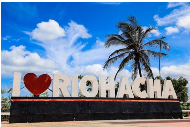
La histórica Riohacha cuenta con la Avenida 14 de mayo, Calle Primera, Avenida de la Marina o Primera Avenida de Suramérica.