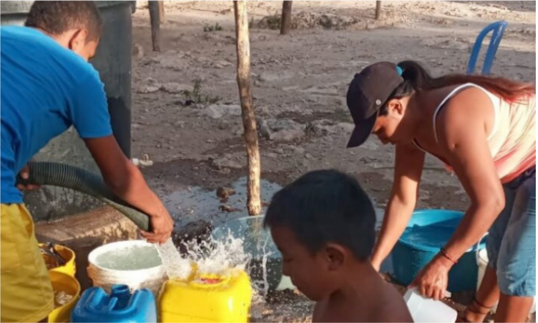
El suministro de agua potable en los 15 municipios es crítico y donde la situación de mortalidad infantil se ha incrementado.