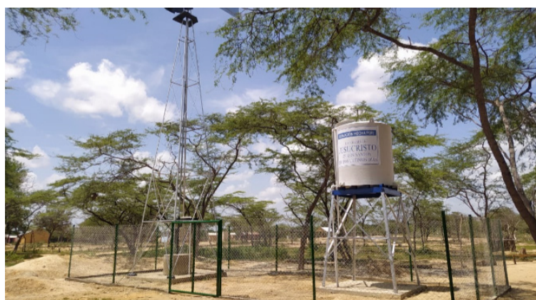
El pastor llegará a la dirección de una de las entidades que nació con la declaración de emergencia económica.

Agua de La Guajira y una de las soluciones es el 'pastor'.