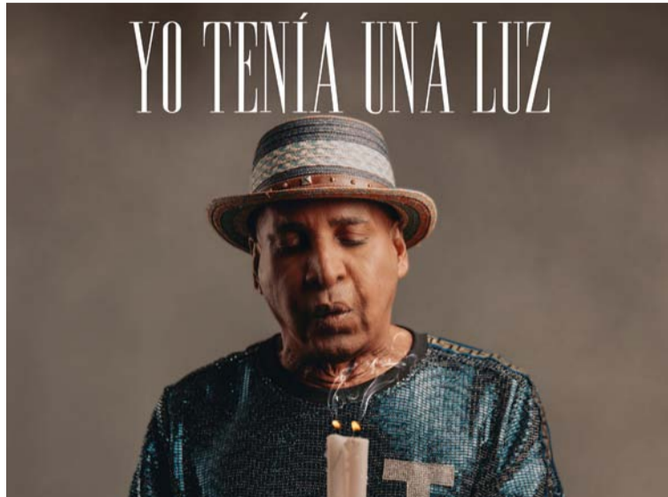
Farid Ortiz, considerado uno de los principales intérpretes de vallenato, presenta su nueva canción 'Yo tenía una luz'.