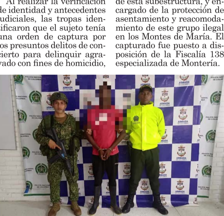
Alias Niche sería una pieza fundamental en la seguridad del máximo cabecilla de esta subestructura.

tráfico porte y fabricación de armas de fuego, tráfico y distribución de estupefacientes. De acuerdo a las investigaciones adelantadas, el capturado quien presuntamente delinquía en el área de San Onofre, en la alta montaña, sería el encargado de prestar apoyo en actividades delictivas, realizar inteligencia delictiva a las unidades militares de la región, además de coordinar movimientos logísticos de material bélico, abastecimiento e intendencia para mantener la actividad delictiva de este grupo armado organizado en los Montes de María, en Sucre. Alias Niche sería una pieza fundamental en la seguridad del máximo cabecilla de esta subestructura, y encargado de la protección de asentamiento y reacomodamiento de este grupo ilegal en los Montes de María. El capturado fue puesto a disposición de la Fiscalía 138 especializada de Montería.