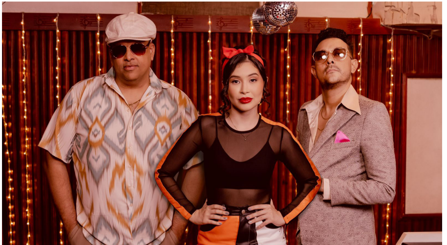
Zona 8 inicia la promoción de su CD en la capital del país, donde visitará más de 22 medios de comunicación.

El evento se realizará del 13 al 15 de diciembre