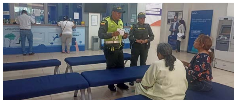
Estas medidas son esenciales para prevenir delitos que puedan afectar la convivencia y la seguridad ciudadana.

Por ello, pidieron no utilizar los cajeros automáticos