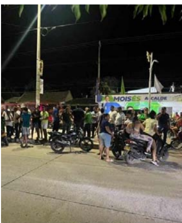
Sicarios atacaron a tiros la camioneta del candidato.

Las autoridades policivas llegaron al lugar de los hechos para proceder con las investigaciones y determinar si se trató de un atentado contra el candidato a la alcaldía del municipio de San Juan del Cesar, se espera el reporte oficial de la Policía Nacional.