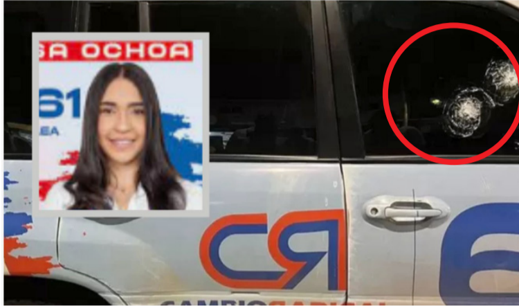
Los delincuentes abrieron fuego contra el automotor de la candidata, impactándolo en repetidas ocasiones.

Según lo informado por el secretario de Gobierno