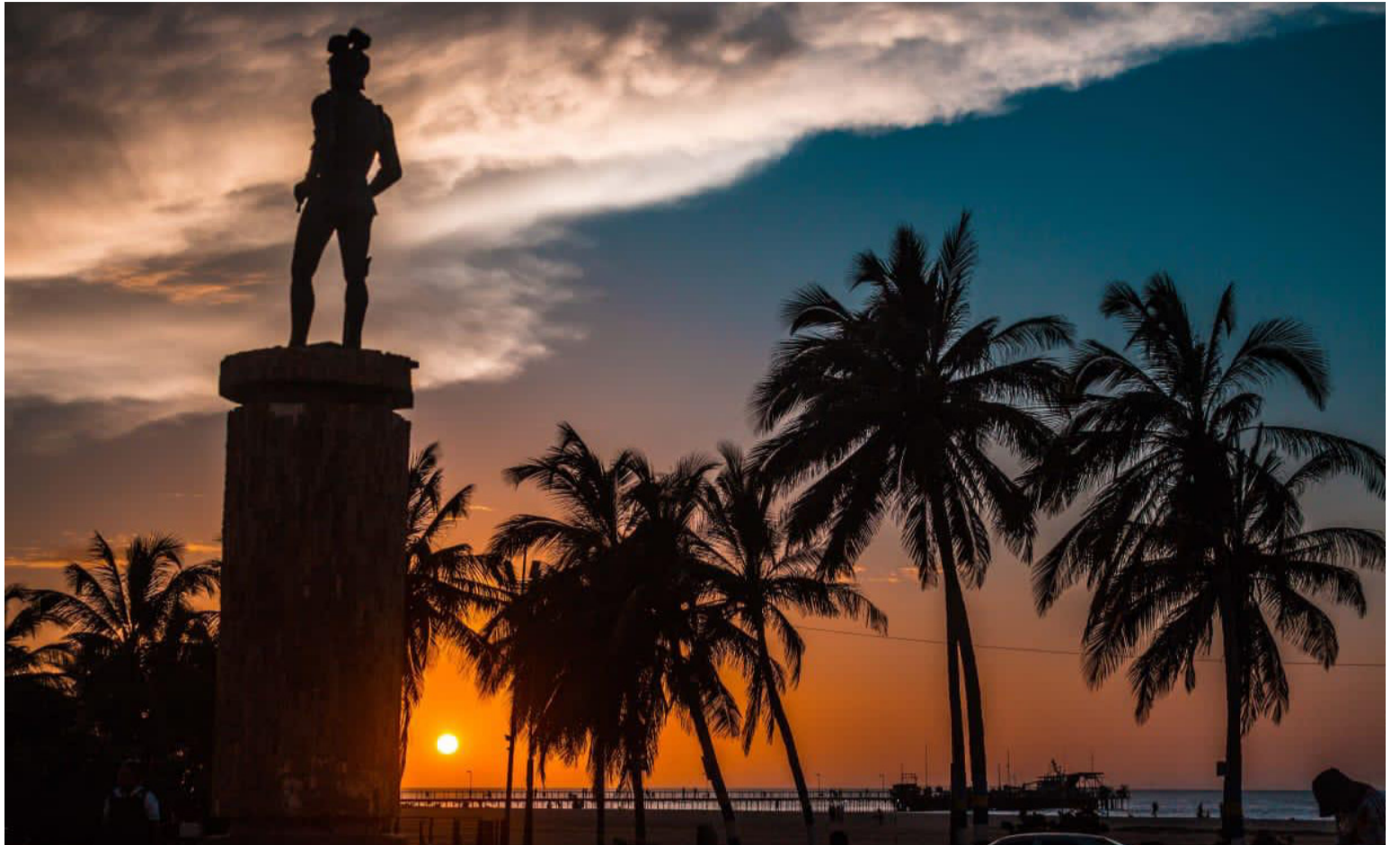
La administración de Riohacha viene trabajando en la recuperación forestal del ecosistema de las playas urbanas del Distrito.

Esta remembranza la traigo a colación porque durante mis mañaneras caminatas por la avenida 14 de Mayo de la fénix del Caribe, las que además de servirme