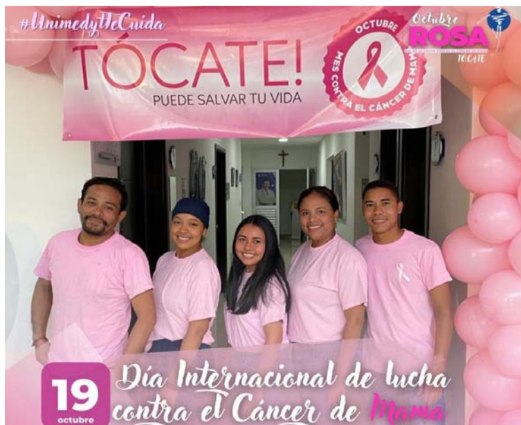
Unimedyt se ha consolidado como una IPS comprometida con prevención y diagnóstico oportuno del cáncer de mama.

de detección. "Las mamografías son fundamentales para identificar lesiones antes de que sean palpables. Es importante que las mujeres mayores de 40 años se realicen una mamografía anualmente, y aquellas con antecedentes familiares o factores de riesgo, incluso antes", señala.