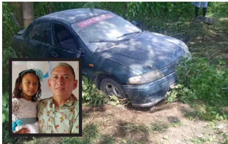
El percance se presentó en la vía que va de Cuestecita a Riohacha y afortunadamente sólo hubo daños materiales.