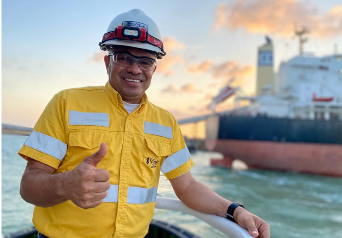
La medición evalúa anualmente la reputación de las compañías y de los líderes empresariales.

“Al reconocimiento reciente que obtuvimos como la empresa minera con mejor reputación en Colombia, según Brújula Minera,