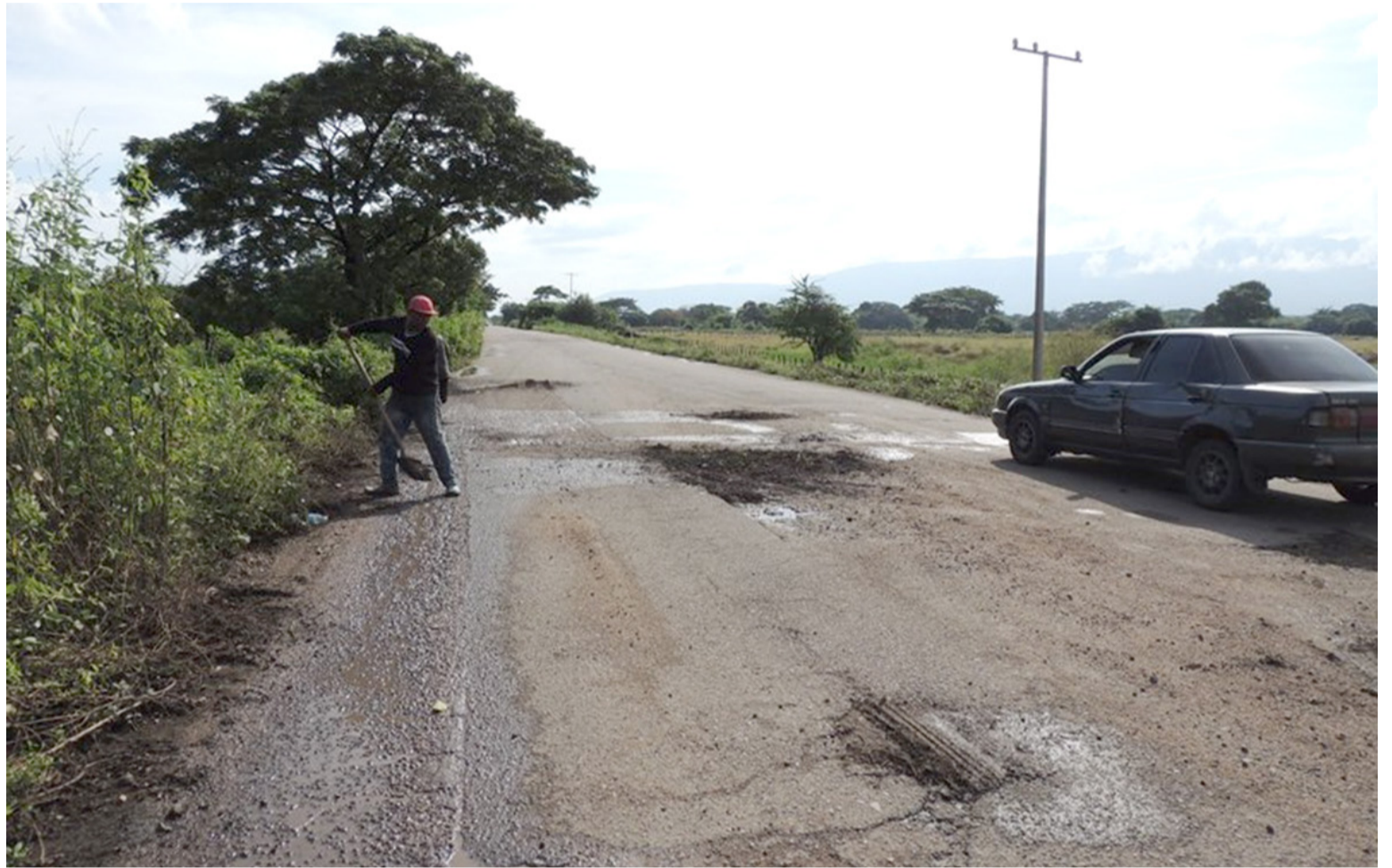
El proyecto de la rehabilitación fue adjudicado al consorcio T Ingep Vías de La Guajira, en donde se invierten $ 79.627.378.

Los trabajos consisten en la construcción de la estructura de pavimento flexible, puentes en concreto, muros de contención y obras hidráulicas como cunetas, alcantarillas y box-coulvert.