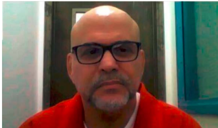
Según el demandante, una persona como Mancuso, condenado por crímenes, no puede verse como hombre de paz.

Agrega el documento que: “el solo hecho de poder enarbolar el señor Mancuso su condición de gestor de paz asegurando con ello su libertad por sobre los muchos años de prisión a los que ha sido condenado, ha dado pábulo a que delincuentes de toda laya autores de execrables delitos e inspirados exclusivamente en el afán