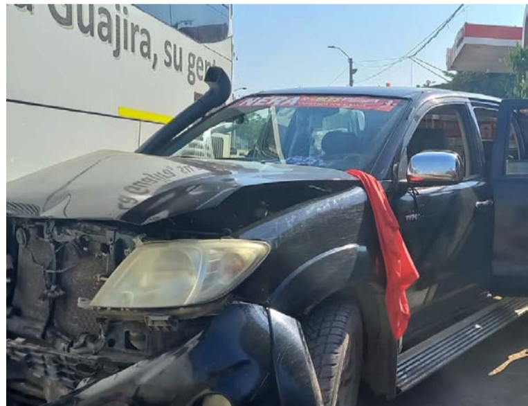
El incidente en Albania dejó golpeada una camioneta que pertenece a una campaña política local.

De acuerdo con el Art. 26 del RETIE, consulta en la página web www.air-e.com/hogares/mi-energia/ o el código QR inserto en esta publicación, sobre los riesgos de origen eléctrico por inadecuadas prácticas que rompan distancias mínimas de seguridad o zona de servidumbre.