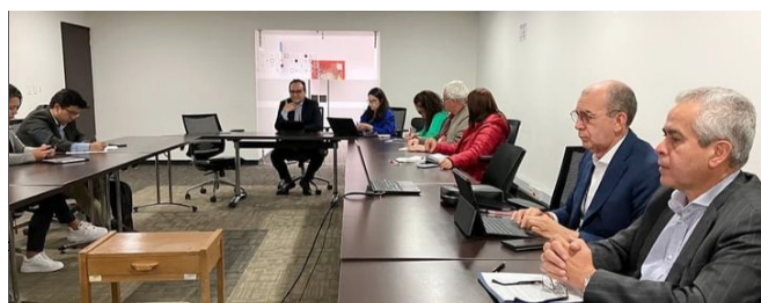
El decreto permite adoptar medidas de uso, manejo, protección y conservación del agua en el Departamento.

Se indicó finalmente que la sección primera del alto tribunal le dio 5 días a la Presidencia para que se pronuncie sobre la solicitud de nulidad.