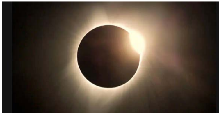
Para la mayoría de las ubicaciones, la totalidad del eclipse durará entre dos y cinco minutos.

liminar del fenómeno, la mejor vista del eclipse anular se logrará en lugares como Bogotá (con un 90 % de visibilidad), Meta, Valle del Cauca, Risaralda, Quindío, Tolima, Huila, Caquetá, Guaviare y Vaupés.