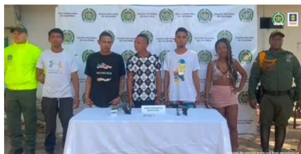
Se les vincula con varios robos cometidos en una zona universitaria de Valledupar.

De acuerdo con las investigaciones adelantadas, estas personas, al parecer, eran integrantes del grupo delincriminal Los Niquelados, quienes estarían vinculados con varios robos cometidos en una zona universitaria de Valledupar.