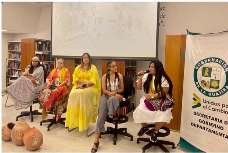
Momentos del panel Género, Interculturalidad y Derechos Humanos.

En la segunda parte, fue escuchada atentamente