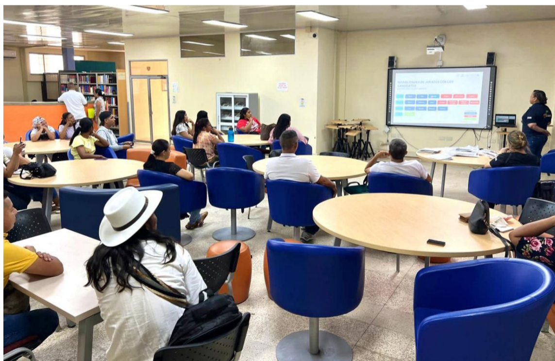
Las jornadas de capacitación de jurados se extenderán hasta el 27 de octubre.

Los 13.692 ciudadanos que fueron seleccionados como jurados de votación en La Guajira para las elecciones territoriales 2023 están siendo capacitados por facilitadores de la Registraduría Nacional en los distintos municipios del Departamento, jornadas que se extenderán hasta el 27 de este mismo mes.