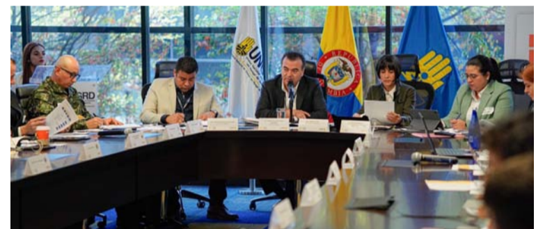
En la construcción del plan se logró identificar 176 municipios con alto riesgo de emergencias y baja capacidad operativa.