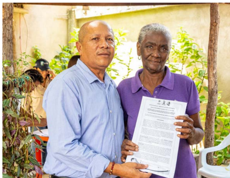
Este importante logro les brinda a las familias la seguridad y estabilidad de la posesión legal de sus hogares.