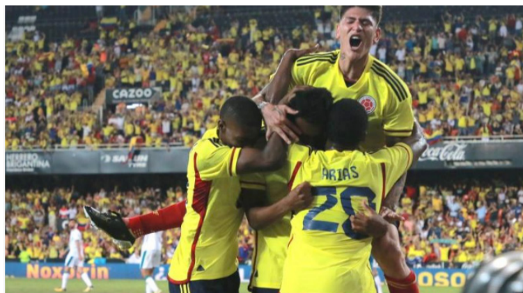
La Fifa quiere ganar más dinero y el negocio para lograrlo es más sedes y más selecciones participantes.

porta la calidad del fútbol sino la cantidad de selecciones, aunque baje el nivel competitivo del Mundial hasta llegar a mediocre, pero el torneo seguirá llenando los bolsillos a la Fifa.