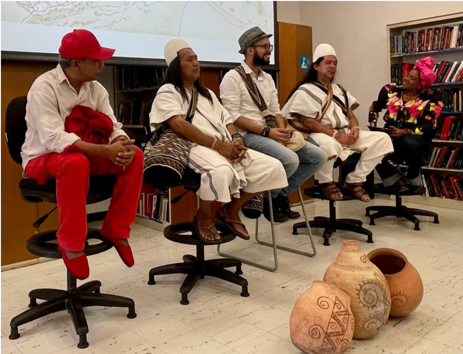
Momentos del panel Espiritualidad y Sabiduría Ancestral.

El Centro Cultural del Banco de la República fue el mejor epicentro para la realización del Panel Coexistencias: Diálogos Interculturales en La Guajira. Este espacio concebido para escuchar voces étnicas y culturales de La Guajira se constituyó en un escenario significativo y empoderante en el que se dialogó sobre el valor de la palabra, la espiritualidad, la sabiduría ancestral, género, interculturalidad, derechos humanos y las cocinas tradicionales afro e indígena.