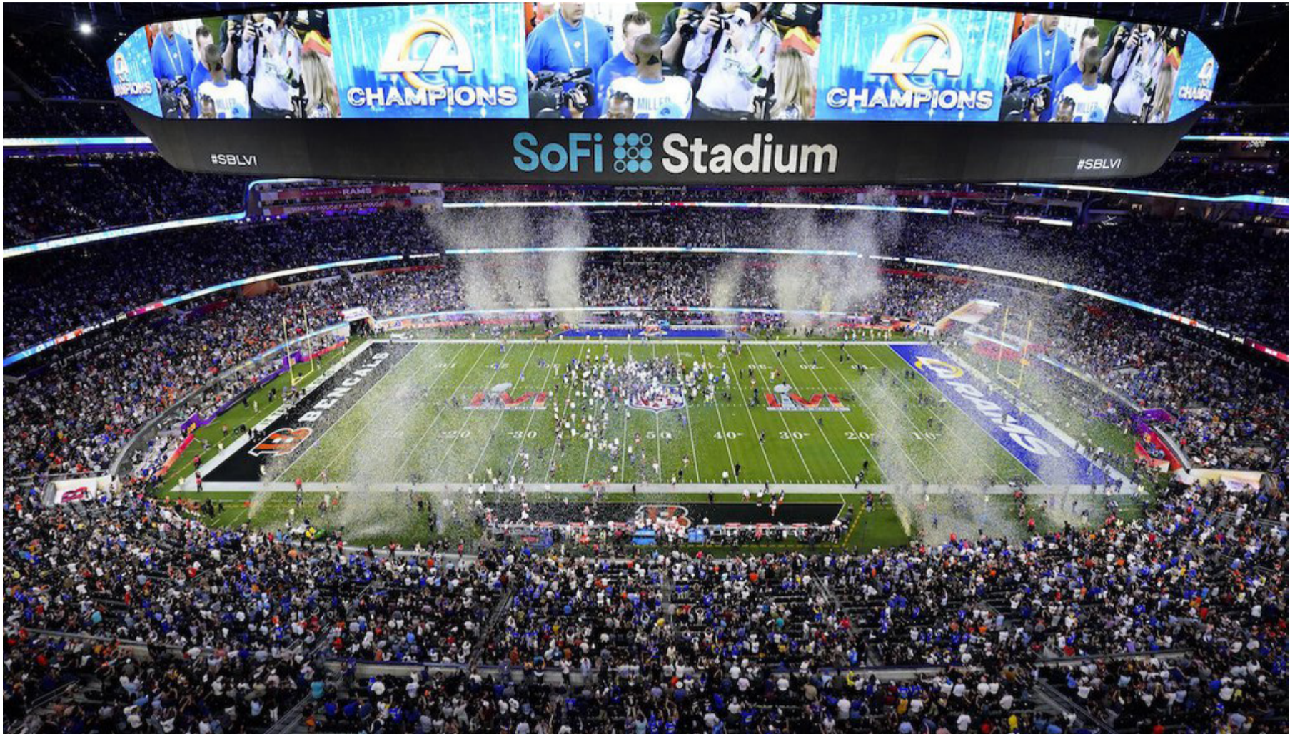
Grandes eventos deportivos son mezcla de deporte y show, por eso estos cambios se imponen para los próximos mundiales.