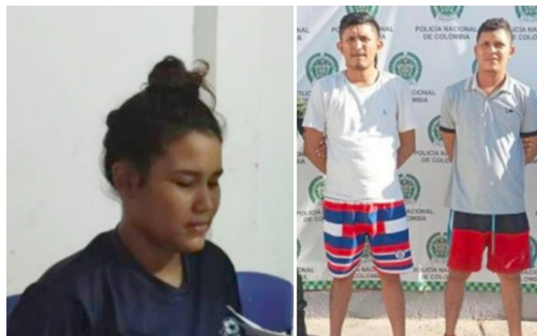
Estas personas están señaladas de realizar exigencias económicas a comerciantes de la Troncal del Caribe.

Además, dentro de las evidencias presentadas se presume que bajo amenazas de muerte, estas personas les exigían a las víctimas sumas entre quinientos mil y un millón de pesos, para no atentar contra sus vidas o las de sus familiares.