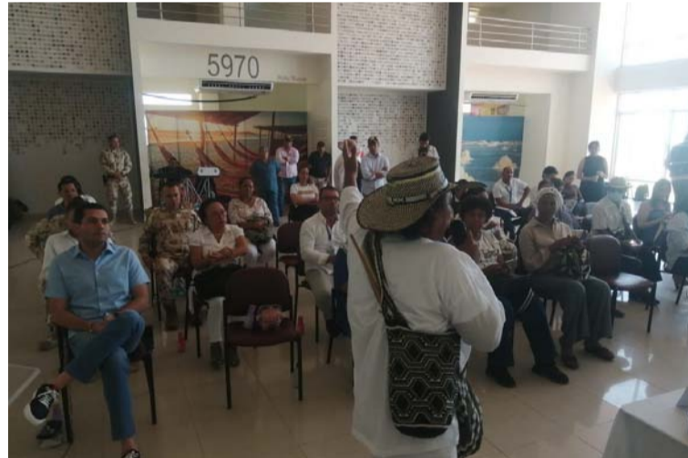
Cada uno de los líderes sociales plantearon las diversas problemáticas que vienen afrontando en La Guajira.

El ministro escuchó detenidamente cada una de