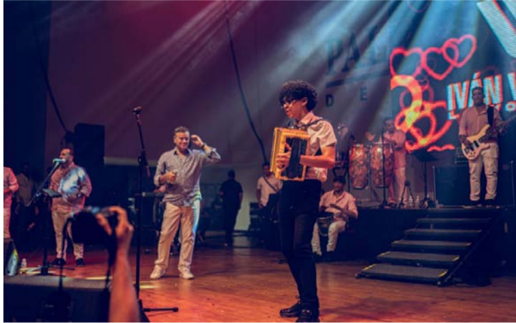
El joven acordeonero venezolano dijo que soñaba con tocar con el maestro Villazón y ese sueño se hizo realidad.

‘Johnsito’, como se le conoce en el mundo artístico en Venezuela se apostó a un lado de la tarima y Villazón lo invitó para tocar una canción, interpretando ‘Me quedo con tus besos’. La