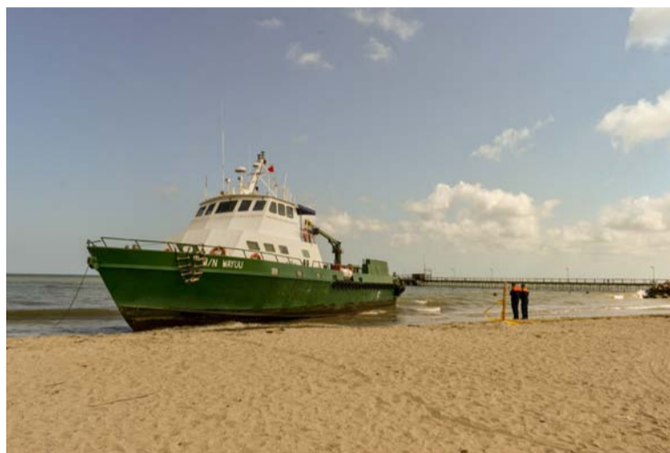
La zona cercana al lugar donde encalló la motonave se encuentra aislada para facilitar labores de los equipos técnicos.

En ese mismo sentido, Hocol S.A. reitera su compromiso de mantener canales de comunicación abiertos y transparentes que permitan trabajar mancomunadamente con el municipio, sus autoridades y las comunidades.