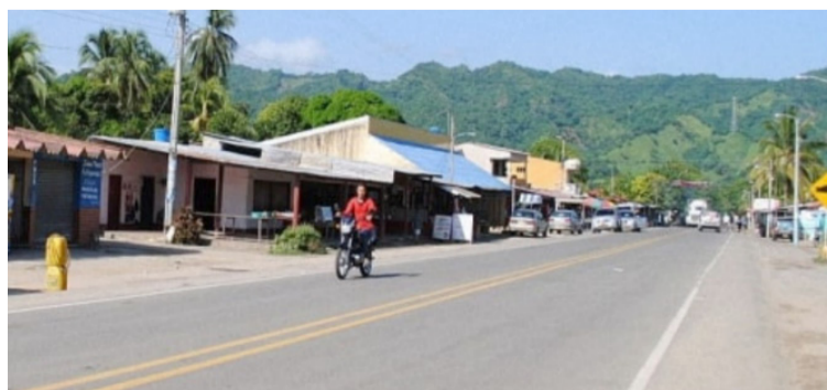
Personal de Air-e trabaja de manera ininterrumpida, logrando restablecer parte del circuito Mingueo-Río Ancho.

“Esta zona rural de Dibulla en inmediaciones de Río Ancho con una alta vegetación y sumado a las condiciones climáticas han causado la prolongación de los trabajos. Sin embargo, nuestros técnicos e ingenieros han trabajado ininterrumpidamente para el pronto restablecimiento del servicio”, informó la gerente.