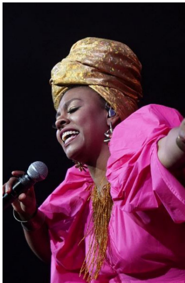
Los eventos aumentarán los recursos para el sector.

Estos recaudos se realizaron el año pasado, y parte del 2023, a través del Portal Único de la Ley del Espectáculo Público de las Artes Escénicas (Pulep), administrado por el Ministerio, en lugares con eventos cuya boletería y derechos de asistencia a espectáculos de artes escénicas superaban los