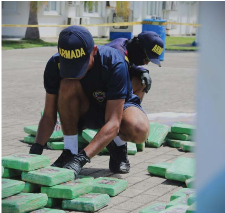
Las dos lanchas y sus tripulantes fueron conducidos a la Estación de Guardacostas de San Andrés.

En la primera operación de interdicción marítima fue ubicada una motonave sospechosa tipo 'Go Fast', que era tripulada por dos costarricenses y un colom-