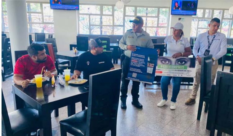
Se busca evitar que los niños, niñas y adolescentes sean víctimas de la vulneración de sus derechos fundamentales.

Por ello, se invita a padres, cuidadores, representantes de los menores y talento hu-