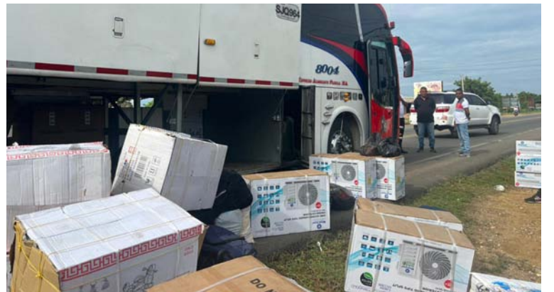
Mercancía decomisada por el Grupo de Caballería Blindado Mediano General Gustavo Matamoros D'Acosta.

La fuente militar informó que durante la inspección en el bus logró encontrar ocultos en las bodegas de