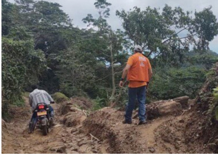
Las zonas de peligro de deslizamiento a causa de las lluvias, según el Ideam están en 18 departamentos del país.

deslizamientos de tierra en el país, hay alerta en 333 municipios, en especial en poblaciones del norte de la región Pacífica, en donde se prevén, para esta semana, lluvias fuertes con probabilidad de tormentas eléctricas.