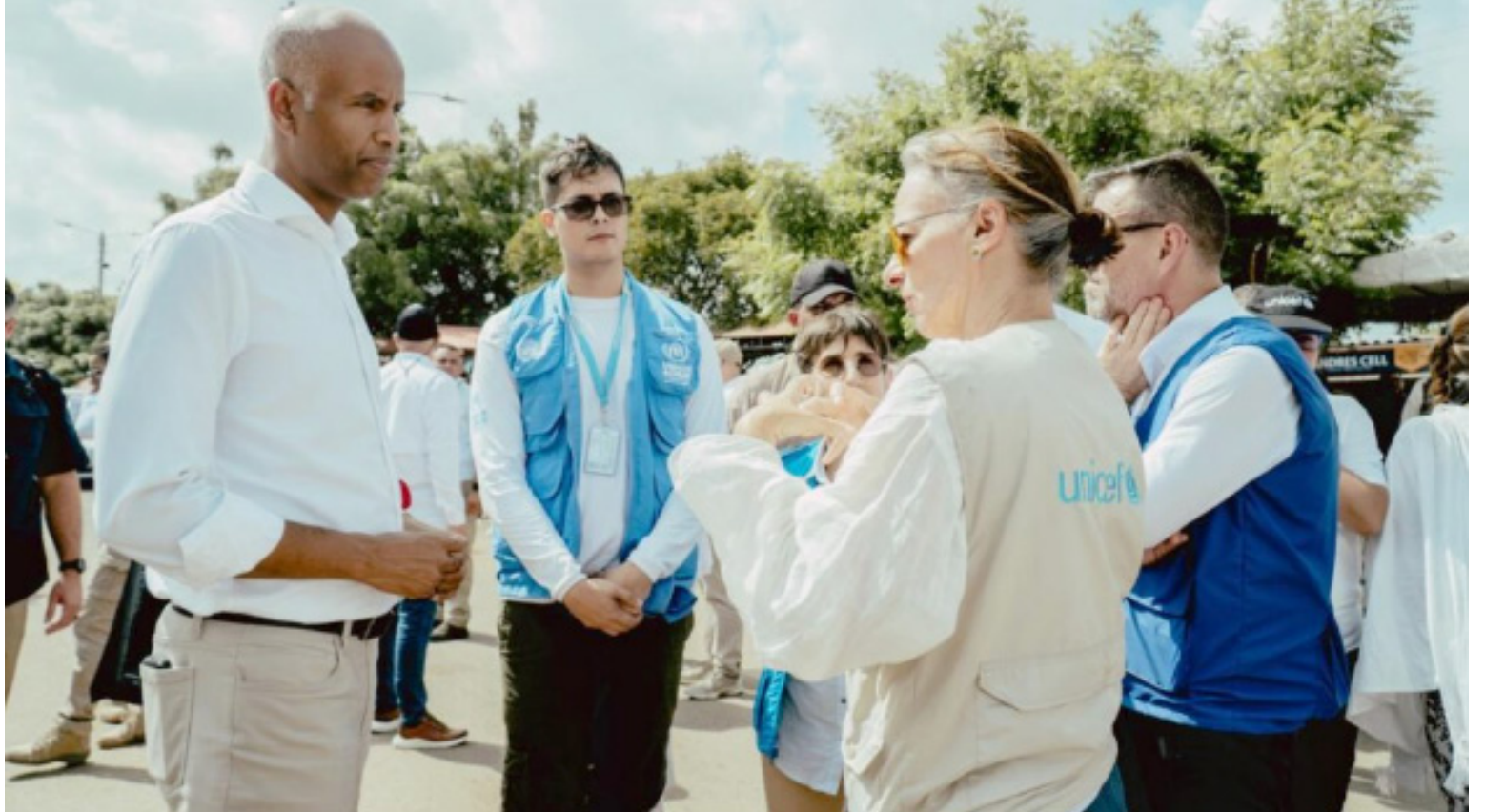
El Gobierno de Canadá y Unicef lanzaron la iniciativa CanGive para mejorar la implementación de los esquemas de vacunación.

En Paraguachón, Unicef instaló baterías sanitarias con baños, duchas y puntos de hidratación para brindar acceso a agua segura, higiene y espacios dignos y protectores a la población migrante, pendular y comunitaria, coordina desde hace cinco años la atención en este espacio, que presta su