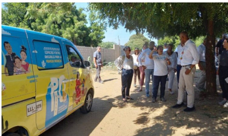
Se incorpora el modelo de aceleración escolar del MEN para aquellos niños que tienen un desfase edad-grado.

servicio de lunes a sábado desde las 6:30 de la mañana hasta las 2 de la tarde.