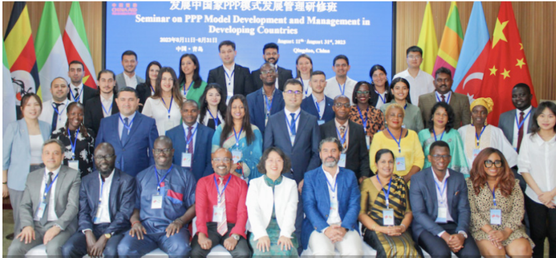
Durante el seminario se analizó cómo China ha implementado exitosamente las APP.

Durante el seminario, analizamos cómo China ha implementado exitosamente las APP en diversos sectores a través de la inversión compartida en infraestructura vial, servicios básicos, educación, incluso en