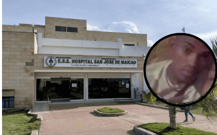
Las autoridades capturaron al presunto victimario en el barrio Buenos Aires Viejo y éste entregó el arma homicida.

Testigos manifestaron a la Policía por dónde se marchó el presunto victimario,