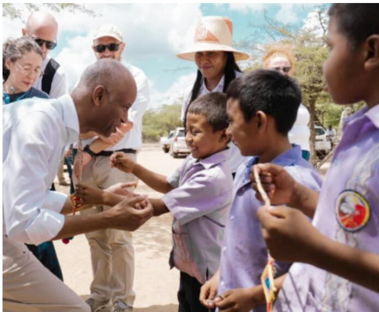
Unicef implementa acciones para responder a situaciones que ponen en riesgo la protección de la niñez.