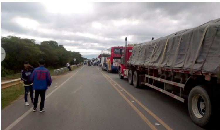
Es imperativo elegir a personas que no tengan vocación de enriquecimiento ilícito, sino vocación de servicio público.

la región, sobre todo porque los estados de emergencia no deben utilizarse para resolver problemas estructurales y que se requiere una política pública a largo plazo para abordar estas cuestiones.