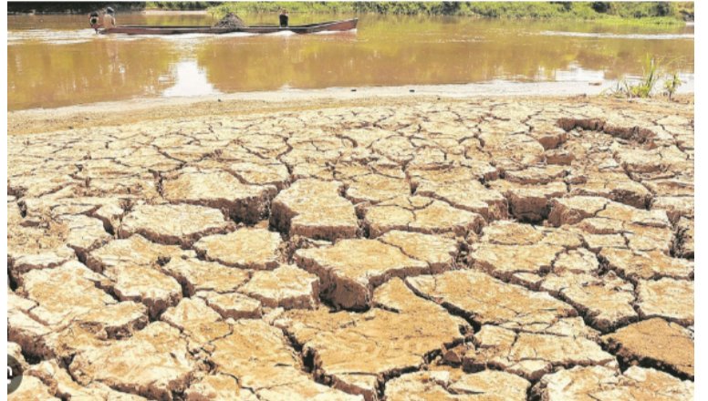
La Corte Constitucional sí reconoció los decretos para atender los efectos del cambio climático, dijo MinInterior.