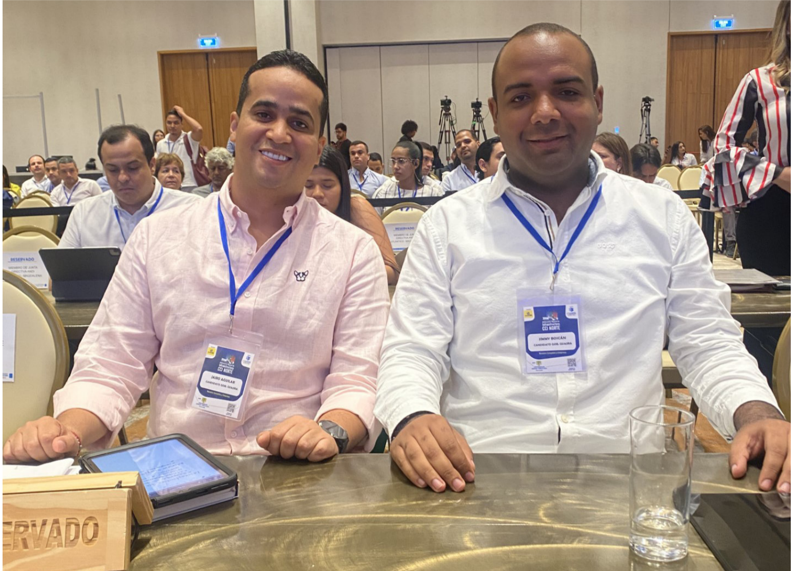
Jairo Aguilar y Jimmy Boscán vienen liderando las encuestas en La Guajira en su carrera política por alcanzar la Gobernación del departamento.

Para el próximo 29 de octubre, cuando se eligen gobernador, alcaldes, diputados, concejales y ediles, el panorama se encuentra definido para la Gobernación. Varias encuestas acreditadas en el Consejo Nacional Electoral, CNE, han dado como ganador, en la intención de votos, a Jairo Aguilar Deluque, quien goza del carisma del pueblo guajiro y cuenta con el respaldo de la mayoría de los candidatos a las alcaldías municipales de los 15 municipios, 28 en total, de aspirantes a la asamblea departamental y de concejos municipales y cuenta también, con la mayor estructura política del Departamento. Jairo Aguilar va con el aval del Partido de la U y el coaval de Cambio Radical, de Asi, la Fuerza de la Paz y el Partido Demócrata Colombiano; con el apoyo del senador de la U, Alfredo Deluque Zu-