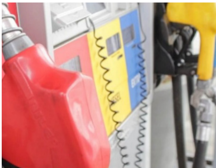
El gobierno continuará monitoreando las medidas para disminuir el impacto fiscal por la dinámica de los precios.

El Gobierno nacional informa que los precios de venta al público de la gasolina y del acpm se mantienen sin modificación para octubre de 2023.