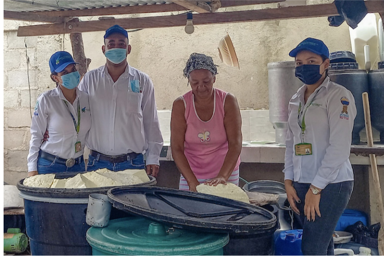
Se espera poder contribuir a la solución de problemas presentes en la cadena de valor de este producto.

“Son varios los avances que ha alcanzado el proyecto hasta el momento: la socialización e interacción con los actores que intervienen la cadena de suministro del queso costeño para conocer de primera mano una aproximación teórico-práctica de los procesos de producción, logística, comercialización y distribución en