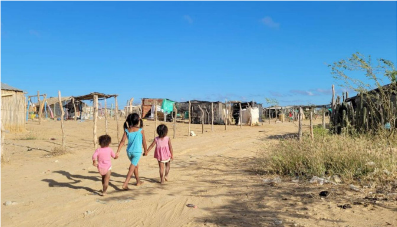
En La Guajira, lamentablemente, parece que lo único que no han logrado robarse es el aire y la luz del Sol.

El alto tribunal debió ser coherente con la Sentencia T-302