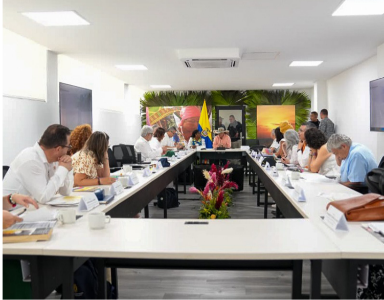
La Corte invitó al Gobierno y al Congreso para que dopten las medidas necesarias para superar la grave crisis humanitaria.

El decreto con fuerza de ley del pasado 2 de julio, otorgaba al jefe de Estado poderes extraordinarios