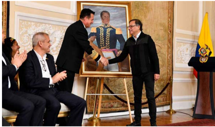
Mediante Ley sancionada por Petro se asciende de manera póstuma a Padilla al grado de Gran Almirante de la Nación.

El jefe de Estado contó que el Almirante Padilla, luego de haber comenzado su vida en el mar al servicio de la Marina Española