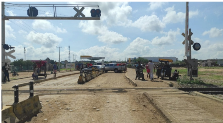
La Sentencia T-302 del 2017, lleva más de seis años de incumplimiento, por lo que la alerta debió activarse hace rato.

torio, sino que hay que mirarlos como una triste realidad de muchas familias con hambre y necesidades básicas insatisfechas que viven en condiciones extremas de pobreza, sin ingresos y lo peor, en el olvido total por parte del Estado colombiano y en especial de los llamados a ser primeros dolientes, como lo son los alcaldes y mandatarios de turnos en el territorio.