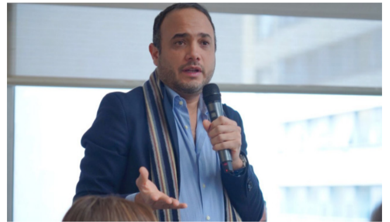
Senador Alfredo Deluque solicitará al Gobierno que apropie los recursos para hacer inversiones en La Guajira.

La situación en las vías de Riohacha es alarmante ante la frecuencia de accidentes de tránsito.