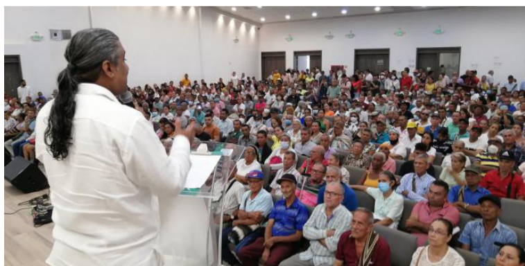
Fueron 931 víctimas de los dos departamentos que recibieron indemnizaciones en el transcurso de septiembre.

La Unidad para las Víctimas avanza para superar los rezagos que hay en la implementación de la política de víctimas y en la entrega de indemnizaciones a las víctimas.