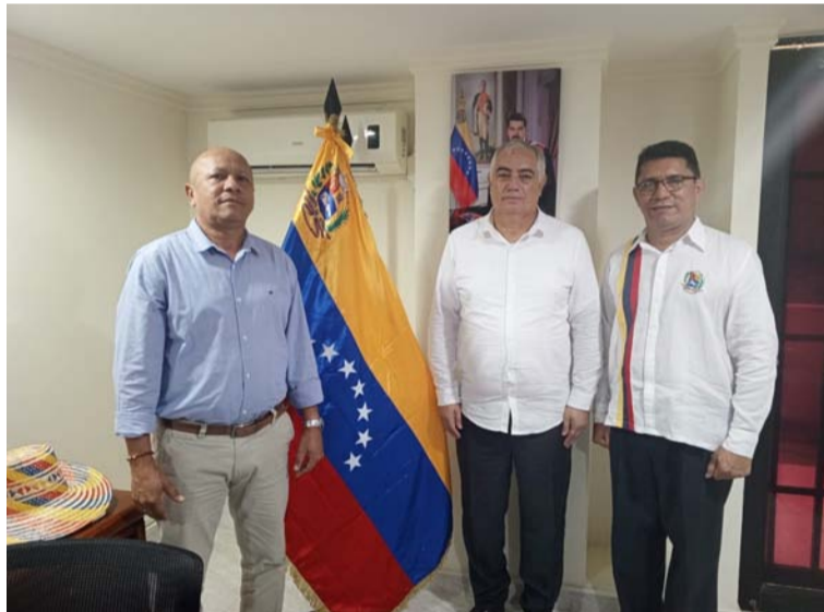
El Consulado quedó oficialmente en funcionamiento y atendiendo al público en horario de oficina.

En la ciudad de Riohacha, desde ayer reabrió sus puertas como símbolo de un nuevo cambio en las políticas de ambos países, el Consulado de la República Bolivariana de Venezuela, que estará atendiendo en horario de oficina a la ciudadanía para los trámites que se requieran en esta sede en la capital de La Guajira.