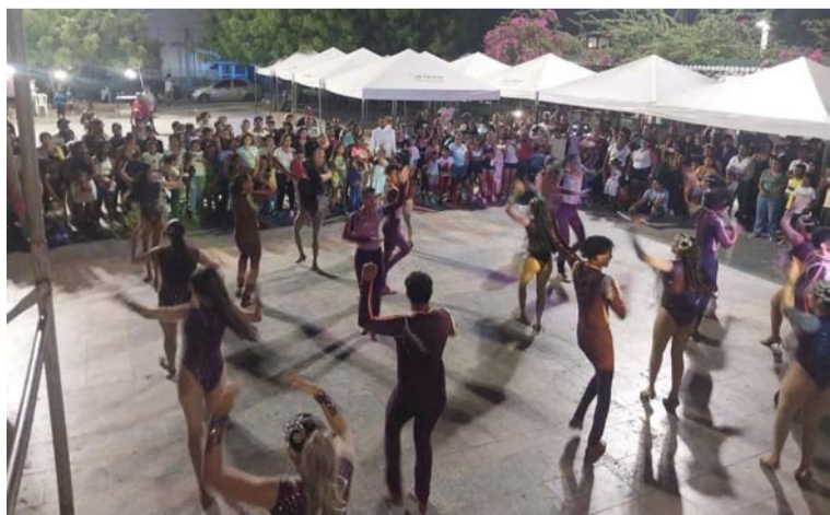
El evento contó con la participación de los representantes étnicos y artesanos del departamento de La Guajira.

Con el objetivo rescatar las costumbres y tradiciones de la región, el municipio de Albania vivió un fin de semana en medio de danzas y artesanías, la cual contó con los artistas más representativos del Departamento.