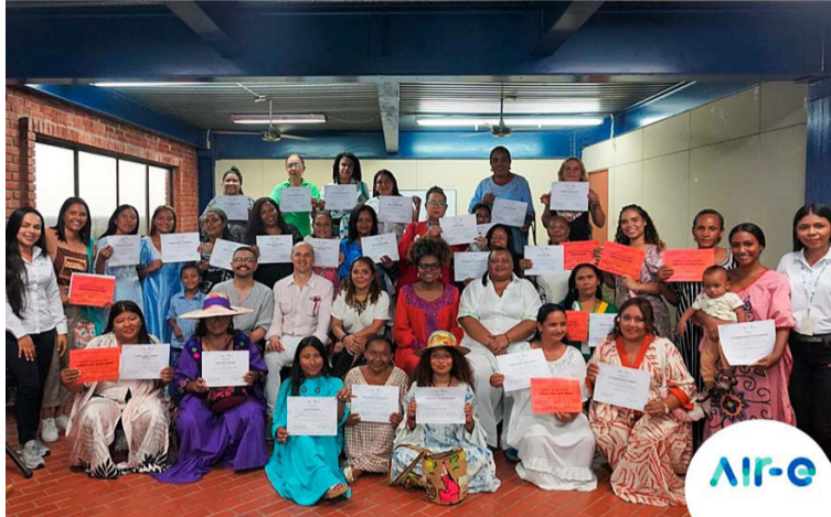
Este diplomado inició con el fin de fortalecer las capacidades y habilidades de liderazgo y el empoderamiento.

Este diplomado inició en el mes de marzo con el fin de fomentar por medio de la educación, la igualdad de oportunidades, y fortalecer las capacidades y habilida-