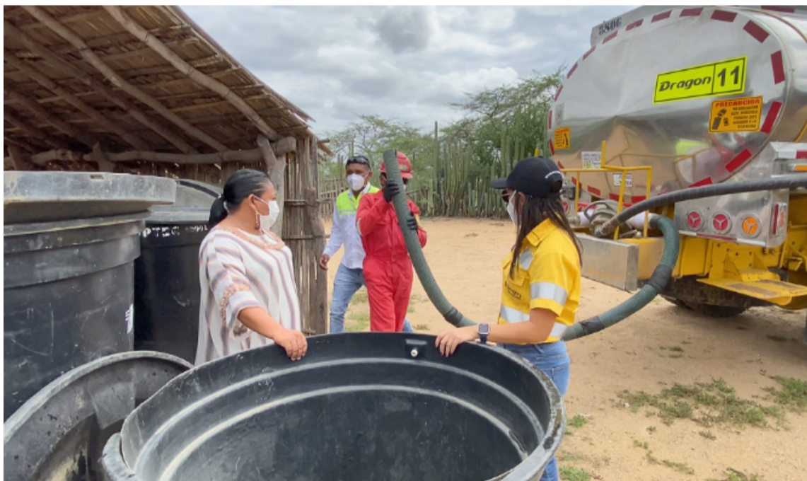
La corrupción ha debilitado la capacidad del gobierno para abordar la crisis en La Guajira.

En este debate, se cuestiona si la situación en La Guajira es realmente extraordinaria o si es el resultado de un problema histórico de abandono estatal en