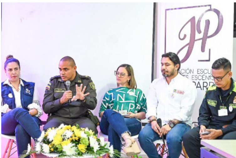
Según el informe, solo hay dos candidatos inscritos en La Guajira en las distintas corporaciones.

Con base en el estudio realizado por Caribe Afirmativo, en las elecciones territoriales de 2023 se inscribieron 100 personas pertenecientes a la comunidad Lgbtiq+, lo que representa un aumento del 32% en comparación con las elecciones de 2019.