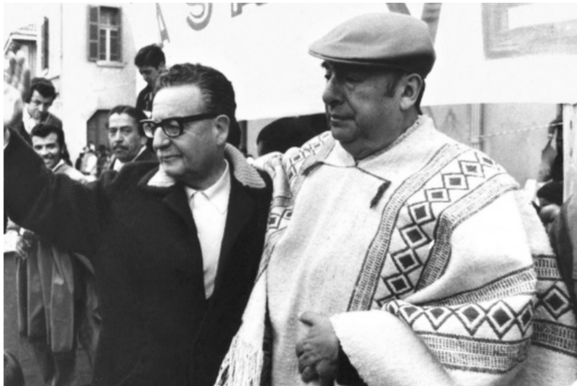
Doce días después del golpe contra Salvador Allende, muere Pablo Neruda.