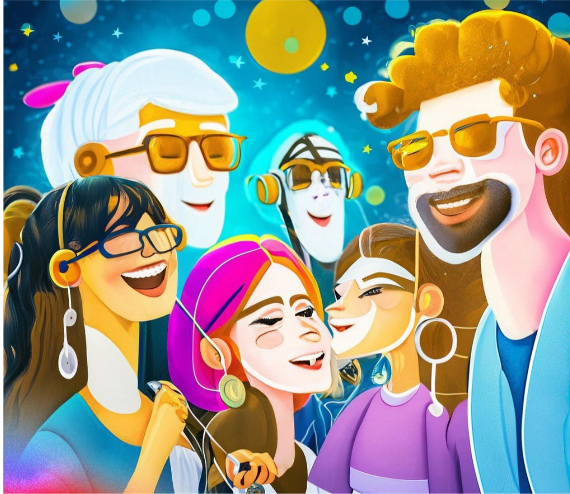
Cuando se habla de juventud, se hace referencia al rango de edad de entre 14 y 28 años.

Mejoramiento de la oferta institucional y servicios sociales para las juventudes: enfocado en la participación juvenil en actividades culturales, artísticas, recreativas, deportivas, intelectuales y de ocio, así como en el apoyo en temas relacionados con la