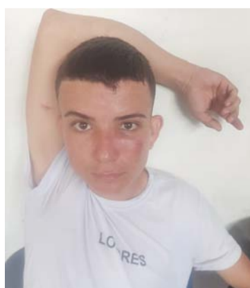
Este es uno de los sujetos capturado en San Juan.

Según informó la Policía, el pasado martes a las 10 y 20 de la mañana, cuando los uniformados realizaban labores de patrullaje, re-