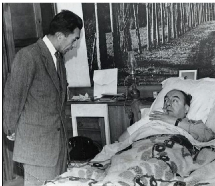
Un homenaje diferente para el insigne bardo puede ser la lectura de sus discursos parlamentarios.

bre al autor de obras y poemas tan conocidos como ‘Veinte poemas de amor y una canción desesperada’, ‘Crepusculario’, ‘Tentativa del hombre infinito’, ‘Residencia en la tierra’, ‘El hon-