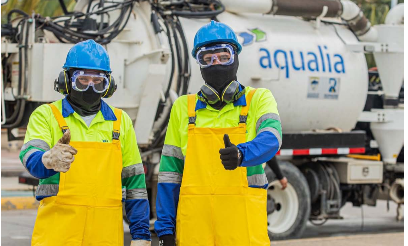
En los primeros 90 días de operación, Aqualia ha superado obstáculos que impedían llevar agua a los hogares del Distrito.

En el mes de junio, la Secretaría Departamental