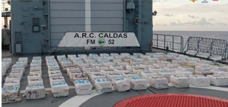
Fueron encontrados 2.994 paquetes con cocaína, cuyo peso total fue de cerca de tres toneladas.

Ninguno de los investigados aceptó su responsa-