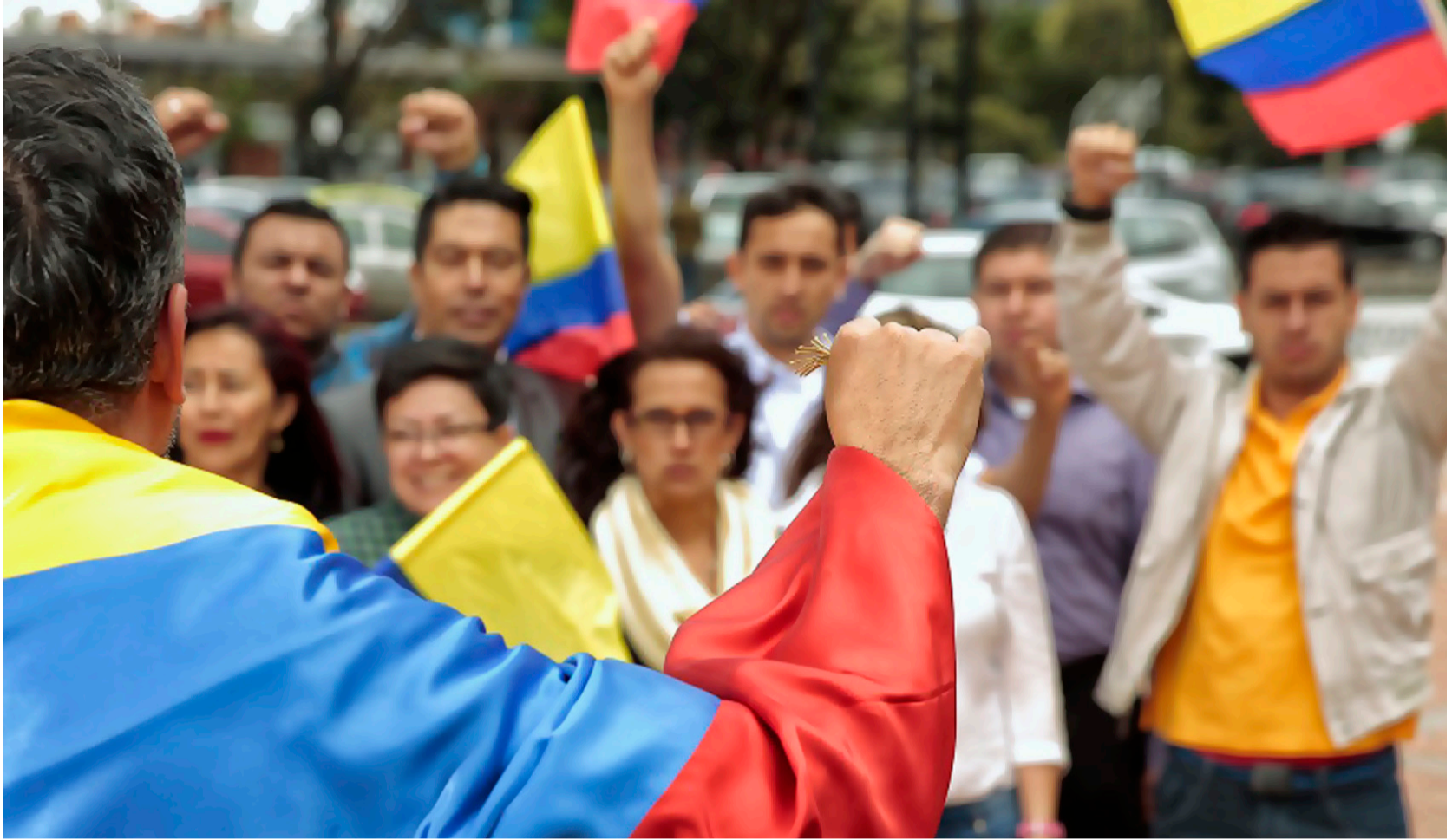
La frase en las campañas de alcaldías y gobernaciones más mencionadas y repetida es "cambio", sin precisar qué quieren cambiar.

Hoy en día no se eligen los mejores para gobernar, sino a quienes más votos compren