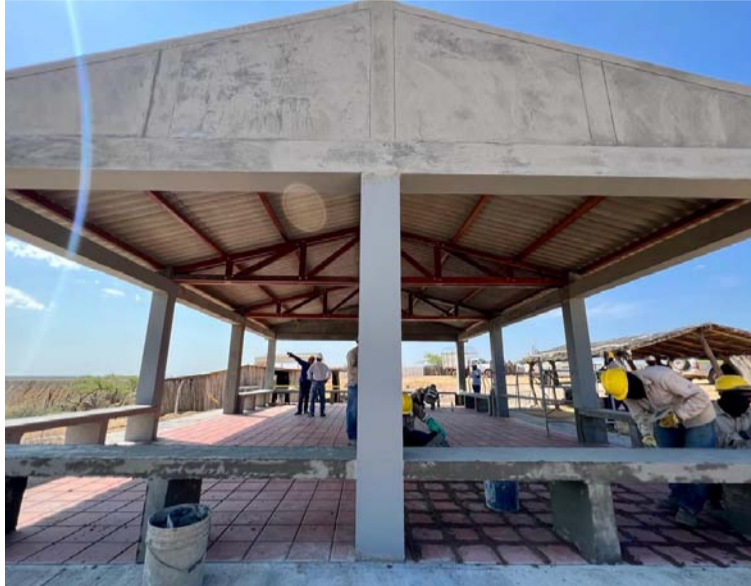
Las obras han sido ejecutadas por ellos mismos y son el resultado de acuerdos entre comunidades y compañía.

“En Cerrejón continuamos trabajando por dejar un legado a La Guajira, a las comunidades y a su gente. Este tipo de proyectos, en particular, son muestra de ello. Estas enramadas y viviendas son un avance en infraestructura, pero también una muestra de que, cuando las comunidades se organizan, lideran y hacen equipo, se pueden lograr grandes cosas. Hoy Media Luna tiene en este modelo de trabajo, toda la cadena productiva en su territorio: la infraestructura para su beneficio, fortalecimiento de capacidades para que-