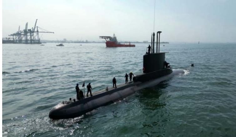
Colombia, con sus submarinos ARC Pijao y ARC Tayrona ha participado en nueve versiones del ejercicio naval.

En esta nueva versión de este importante escenario multinacional, que se realizará en aguas de la costa Este de los Estados Unidos y en las aguas interiores de las Bahamas, en el Caribe antillano, el ARC Pijao entrenará con Fuerzas