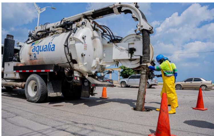
Los proyectos que están en contratación corresponden, a elaboración de planes maestros de acueducto y alcantarillado.

de Salud reportó un Índice de Riesgo para la Calidad del Agua Potable - Irca de 0,30% y de 0% para los meses de julio y agosto, indicando que el agua suministrada por Aqualia durante los tres (3) primeros meses de operación es libre de riesgo para la salud humana, según lo establecido en la resolución 2115 de 2007.