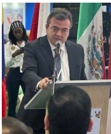
Olmedo López, director nacional de la Ungrd.

El director de la Ungrd reiteró el compromiso del Gobierno nacional; del Fondo de Adaptación; del Sistema Nacional de Gestión del Riesgo de Desastres, y la Ungrd, con la prevención, manejo y gestión de avenidas torrenciales, sismos, movimientos en masa, así como otros fenómenos naturales.