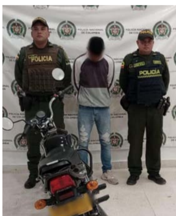
Hombre capturado y motocicleta incautada.

El procedimiento policial se realizó mediante patrullaje de los uniformados del Modelo Nacional Comunitario por Cuadrantes del Departamento de Policía Guajira, con planes de con-