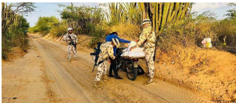
Con estas acciones se está controlando la presencia de delincuentes que afectan la seguridad.