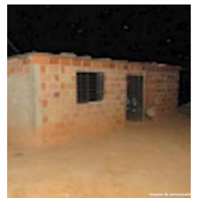
Este es uno de los predios incautados por la Fiscalía.

Los predios afectados con medidas cautelares de suspensión del poder dispositivo y embargo aparecen en cabeza cinco personas quienes estarían relacionadas con las disidencias de las Farc. Al parecer, los predios impactados fueron usados por los procesados para mantener privados de la libertad a un exfuncionario de una petrolera, y por quien exigían una elevada suma de dinero para su liberación.