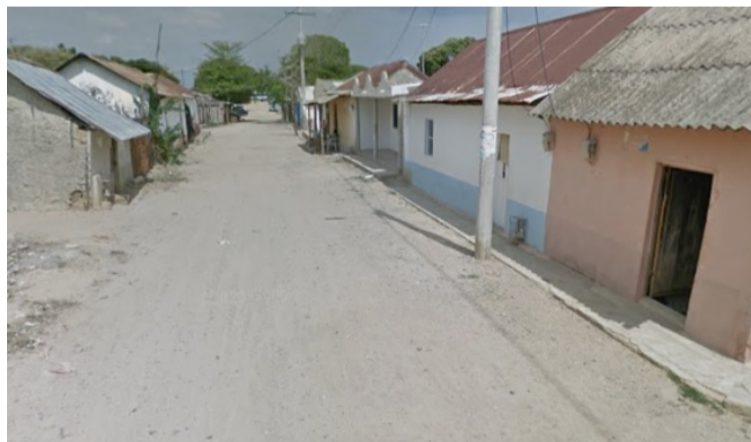
El órgano de control recalcó que las entidades territoriales tienen que priorizar la ejecución del presupuesto.

Igualmente, solicitó indicar si ya se estructuró el plan de contingencia correspondiente, y si ya se apropió el rubro presupuestal destinado para la