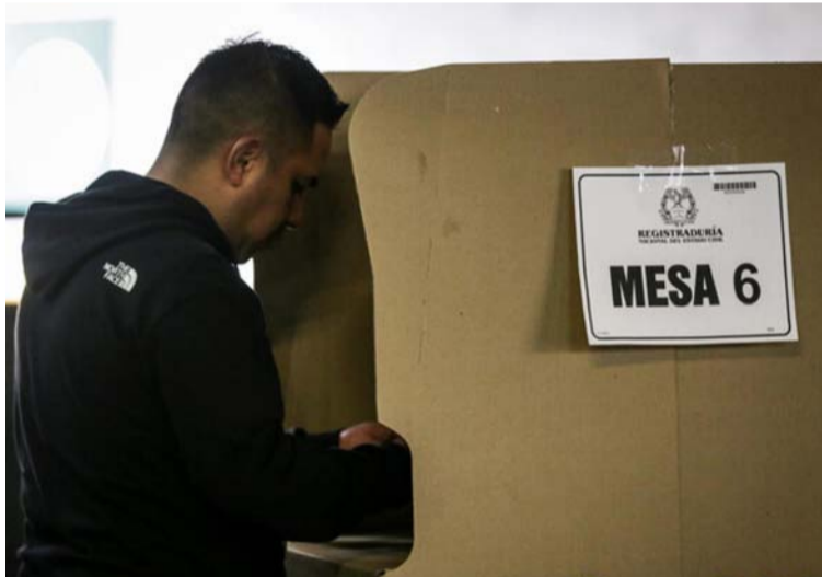
Las tradiciones políticas las han trastornado, transformado y traicionado, por compraventa de votos.

La frase en las campañas de alcaldías y gobernaciones más mencionadas y repetida es "cambio", sin precisar e identificar lo que quieren cambiar, ni sustentar la forma o medios de financiamientos durante un periodo de gobierno. El único cambio seguro es el de mandatario porque no hay