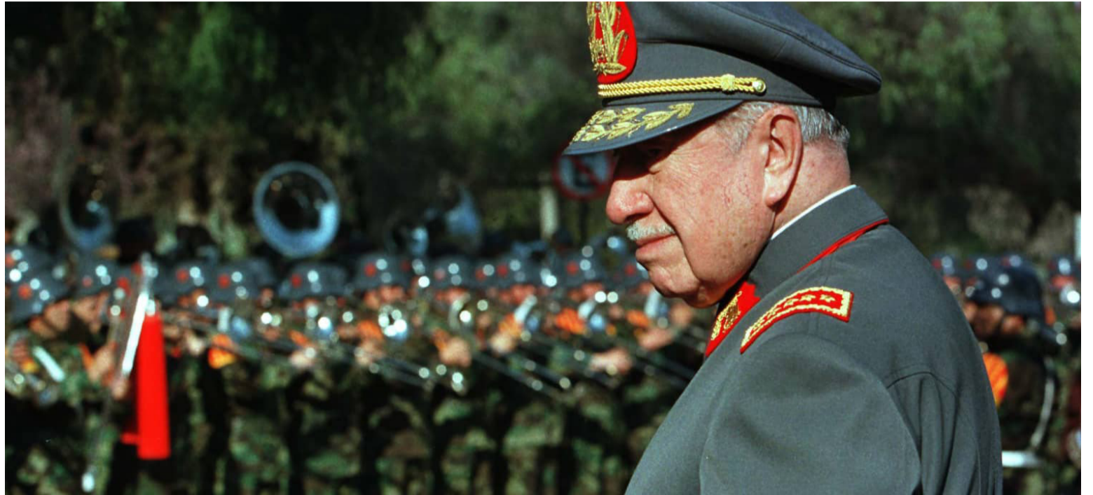
Augusto Pinochet entronizó la violencia oficial que gravitaría durante diecisiete años sobre la nación chilena.