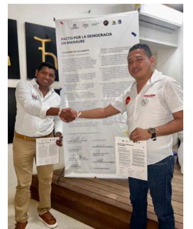
Los firmantes trabajarán por unas elecciones legales.

Se espera que en esta oportunidad se respeten los resultados de las elecciones, para evitar confrontaciones como las ya vividas.